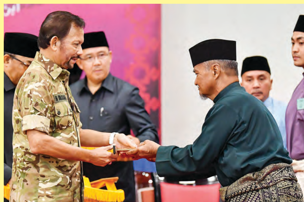
KEBAWAH Duli Yang Maha Mulia Paduka Seri Baginda Sultan Haji Hassanal Bolkiah Mu'izzaddin Waddaulah ibni Al-Marhum Sultan Haji Omar 'Ali Saifuddien Sa'adul Khairi Waddien, Sultan dan Yang Di-Pertuan Negara Brunei Darussalam berkenan menyempurnakan Penganugerahan Anak-Anak Kunci Rumah kepada para penerima di bawah Rancangan Perumahan Negara (RPN) bagi Daerah Tutong dan Belait (kiri dan kanan).