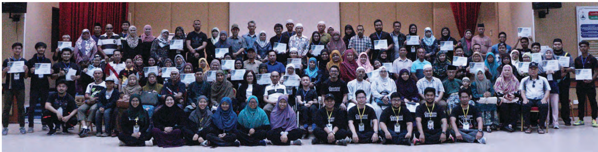
PARA peserta semasa sesi bergambar ramai setelah menerima sijil masing-masing pada Majlis Penutup Kem Asas Pemimpin Ke-2.