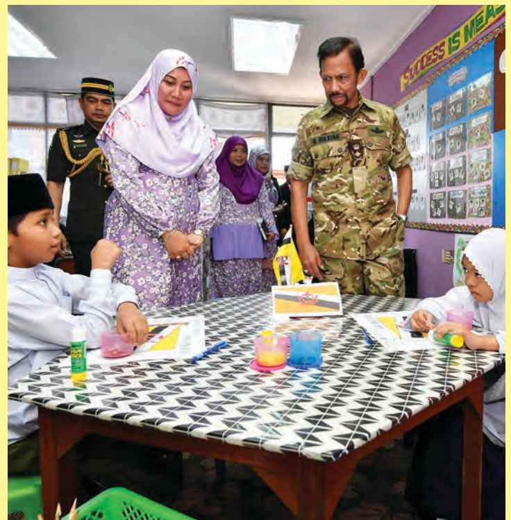
KEBAWAH Duli Yang Maha Mulia berkenan melihat secara lebih dekat pengajaran dan pembelajaran murid-murid.

Perancangan sekolah akan datang katanya, akan lebih mempertingkatkan perkembangan dari segi akademik dan kokurikulum.