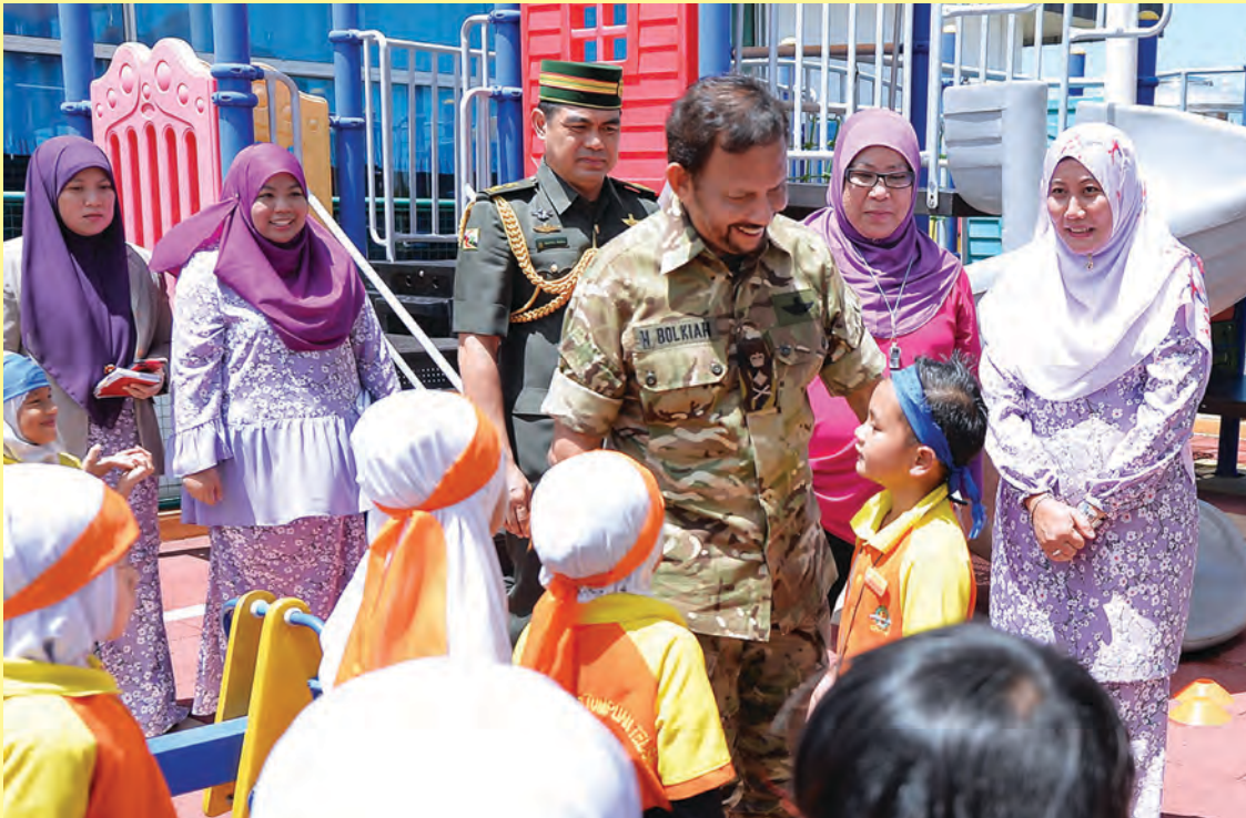
KEBAWAH Duli Yang Maha Mulia Paduka Seri Baginda Sultan Haji Hassanal Bolkiah Mu'izzaddin Waddaulah ibni Al-Marhum Sultan Haji Omar 'Ali Saifuddien Sa'adul Khairi Waddien, Sultan dan Yang Di-Pertuan Negara Brunei Darussalam berkenan berbual bersama salah seorang murid Sekolah Rendah Tumpuan Telisai, Tutong di Taman Permainan semasa pendidikan jasmani.