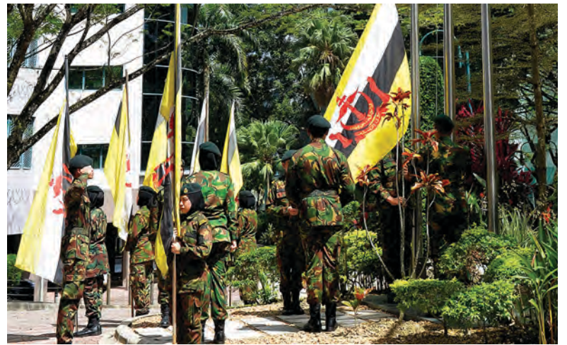
KADET Tentera Politeknik Brunei menaikkan bendera dan diiringi dengan nyanyian lagu kebangsaan.

Hari Kebangsaan pada tahun ini bertemakan 'Menjayakan Wawasan Negara'.