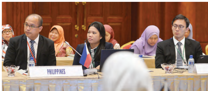
SEBAHAGIAN pegawai kanan dan penasihat undang-undang dari negara ASEAN yang menghadiri mesyuarat tersebut.

menghapuskan halangan teknikal terhadap perdagangan bagi memudahkan pelaksanaan Common Effective Preferential Tariff (CEPT) Agreement dan untuk merealisasikan Kawasan Perdagangan Bebas ASEAN (AFTA).