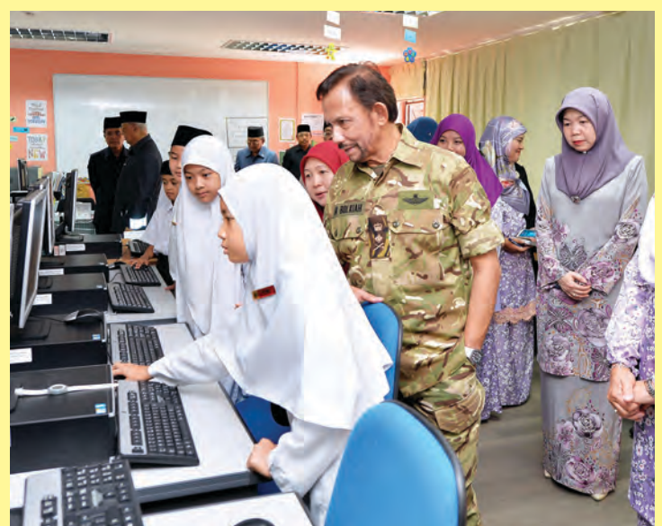
KEBAWAH DYMM berkenan melawat dan mendengarkan sembah penerangan ketika berada di Makmal ICT Sekolah Rendah Tumpuan Telisai, Tutong.