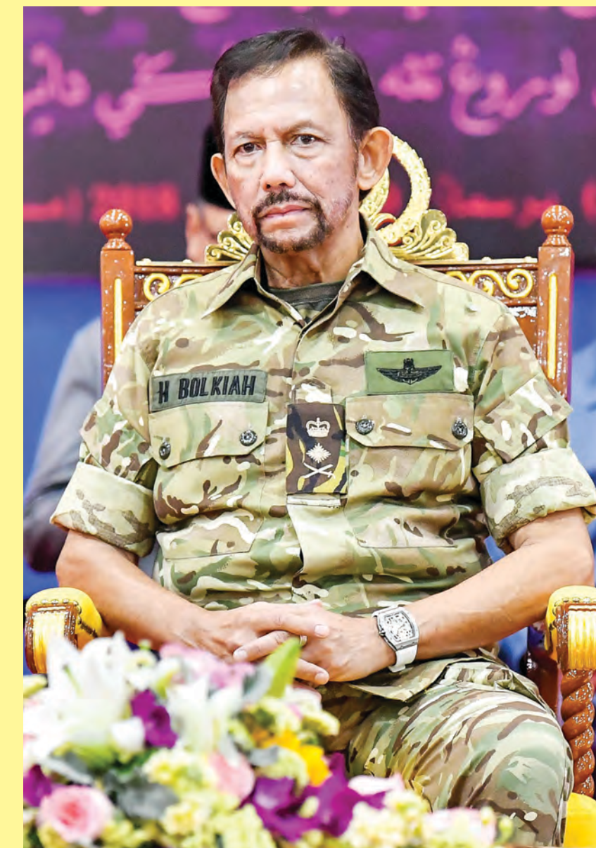
KEBAWAH Duli Yang Maha Mulia Paduka Seri Baginda Sultan Haji Hassanal Bolkiah Mu'izzaddin Waddaulah, Sultan dan Yang Di-Pertuan Negara Brunei Darussalam berkenan berangkat menyempurnakan Penganugerahan Anak-Anak Kunci Rumah kepada 601 penerima di bawah RPN bagi Daerah Tutong dan Belait.