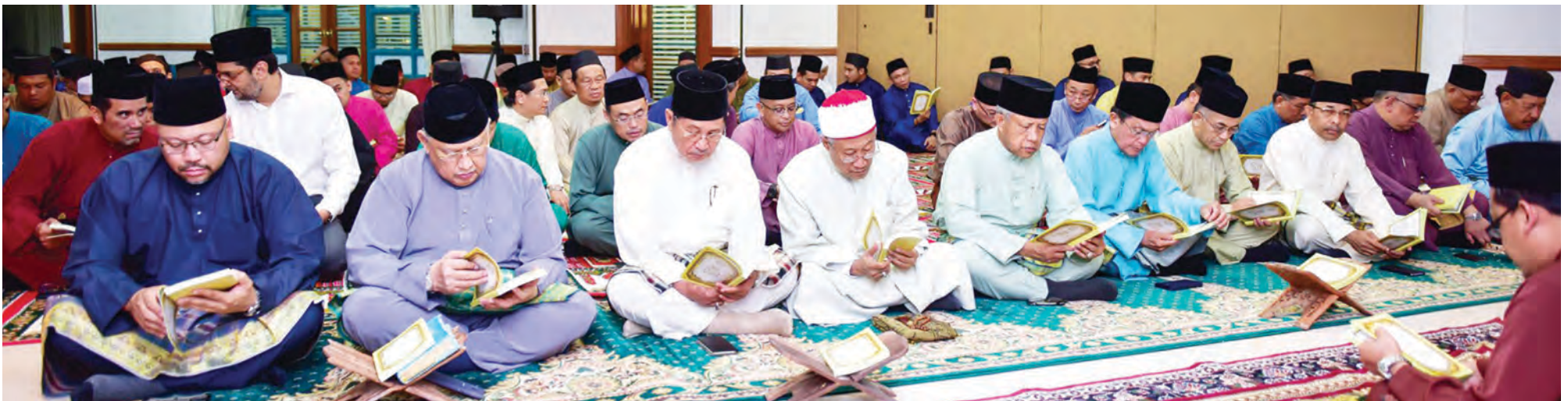
YAYASAN Sultan Haji Hassanal Bolkiah selaku Sekretariat Dana Pengiran Muda Mahkota Al-Muhtadee Billah Untuk Anak-Anak Yatim (DANA) mengadakan Majlis Doa Kesyukuran sempena Sambutan Ulang Tahun Hari Puja Usia Duli Yang Teramat Mulia Paduka Seri Pengiran Muda Mahkota Pengiran Muda Haji Al-Muhtadee Billah ibni Kebawah Duli Yang Maha Mulia Paduka Seri Baginda Sultan Haji Hassanal Bolkiah Mu'izzaddin Waddaulah, Menteri Kanan di Jabatan Perdana Menteri Ke-44 Tahun.