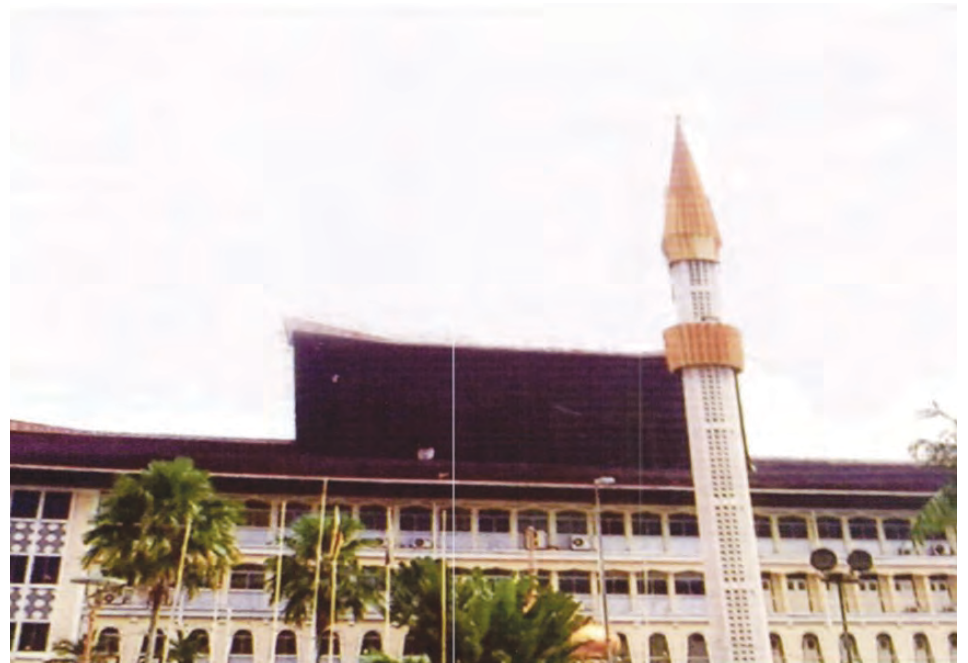
JABATAN / Kementerian Hal Ehwal Ugama (lama).

Kedua : Langkah Al-Marhum Sultan Haji Omar 'Ali Saifuddin Sa'adul Khairi Waddien mendahulukan terlaksananya pendidikan agama peringkat rendah yang menggunakan bahasa Melayu pada tahun 1956 itu adalah tepat, supaya pencapaian pengajaran agama itu lebih mudah dan