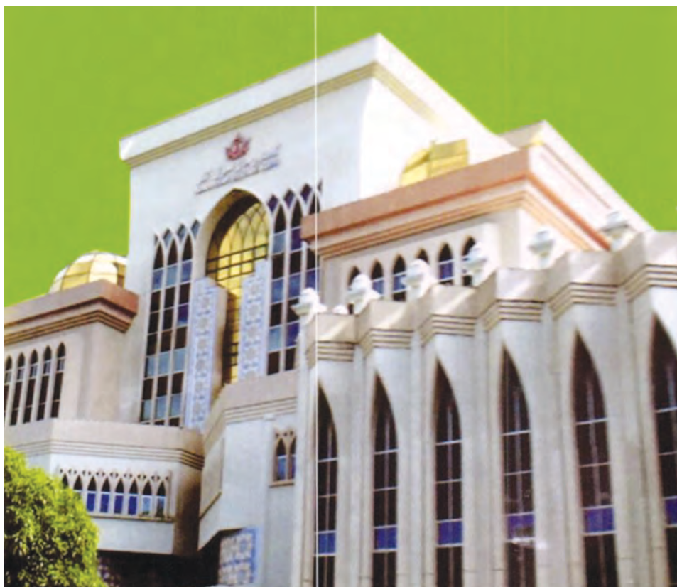
KEMENTERIAN Hal Ehwal Ugama (baharu).