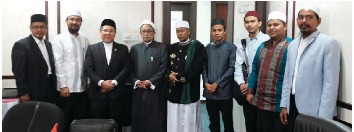
UNIVERSITI Islam Sultan Sharif Ali semasa menerima kunjungan silaturahim dari delegasi Institut Agama Islam (IAI) Al-Aziziyah, Aceh, Indonesia.

BANDAR SERI BEGAWAN , Selasa, 20 Februari. - Universiti Islam Sultan Sharif Ali (UNISSA) terus menjadi fokus institusi pengajian tinggi dari luar negara dalam usaha untuk menjalankan kerjasama dalam bidang akademik dan penyelidikan bersama. Perkara ini terbukti dengan adanya kunjungan silaturahim dari delegasi Institut Agama Islam (IAI) Al-Aziziyah, Aceh, Indonesia pada 19 Februari yang lalu.