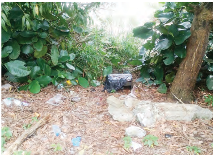
PASAR raya, De Rimba Department Store Sdn. Bhd. dikenakan denda kompaun atas kesalahan membuang sampah di kawasan persekitaran premis bangunan.

Siaran Akhbar dan Foto : Jabatan Daerah Brunei dan Muara