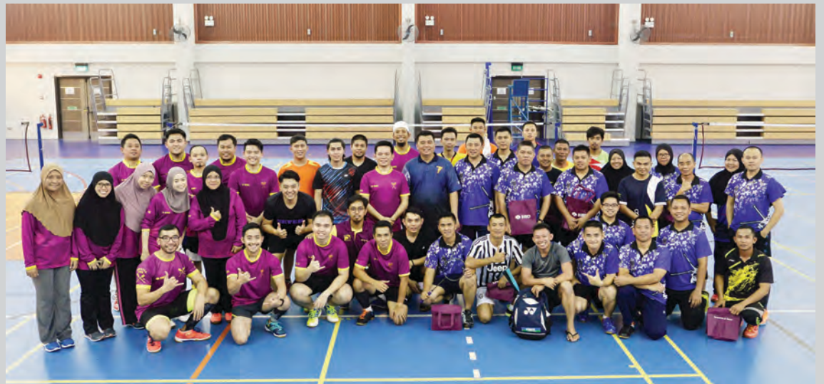
BANK Islam Brunei Darussalam semasa mengadakan Pertandingan Badminton Persahabatan bersama Angkatan Tentera Udara Diraja Brunei.