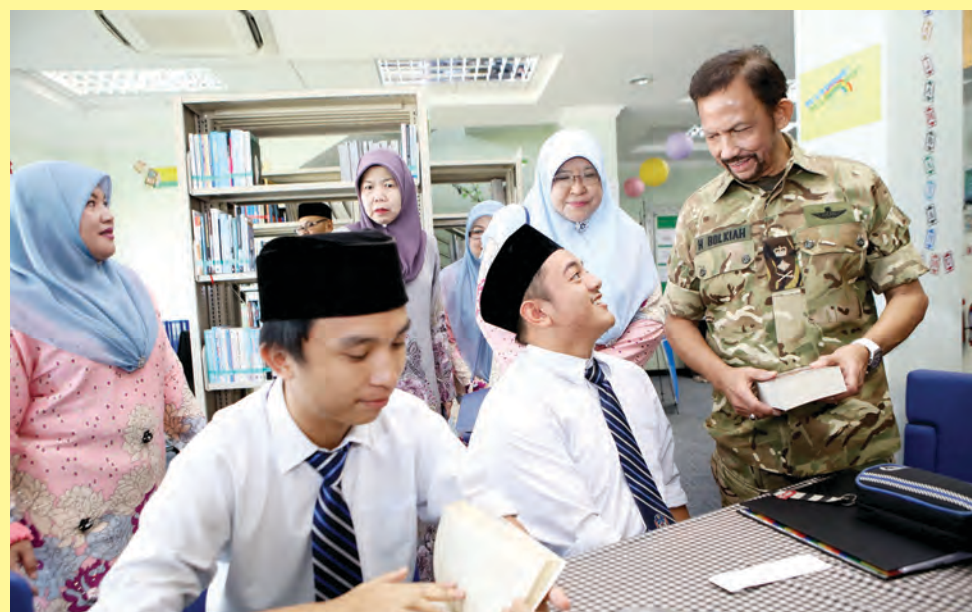
KEBAWAH DYMM berkenan berbual bersama salah seorang penuntut di Perpustakaan Pusat Tingkatan Enam Tutong (PTET), Kampung Bukit Beruang, Mukim Telisai (kiri), sementara gambar kanan, baginda berkenan berbual bersama seorang penuntut yang sedang mengadakan aktiviti kokurikulum di ruang legar PTET.