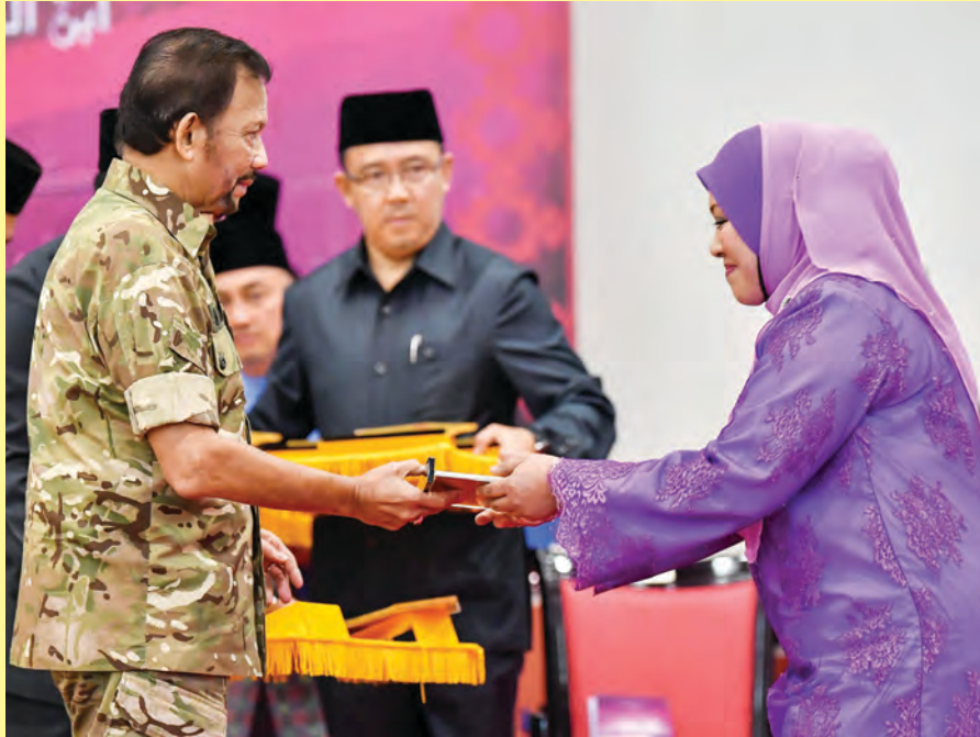
KEBAWAH Duli Yang Maha Mulia Paduka Seri Baginda Sultan Haji Hassanal Bolkiah Mu'izzaddin Waddaulah ibni Al-Marhum Sultan Haji Omar 'Ali Saifuddien Sa'adul Khairi Waddien, Sultan dan Yang Di-Pertuan Negara Brunei Darussalam berkenan berangkat menyempurnakan Penganugerahan Anak Kunci Rumah kepada penerima.

Para pelajarinya datang dari kawasan tadahan Mukim Telisai, Mukim Pekan Tutong, Mukim Tanjong Maya, Mukim Kiudang, Mukim Keriam,