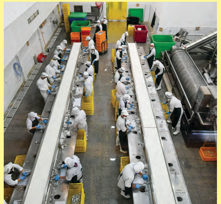
KEBAWAH Duli Yang Maha Mulia Paduka Seri Baginda Sultan Haji Hassanal Bolkiah Mu'izzaddin Waddaulah, Sultan dan Yang Di-Pertuan Negara Brunei Darussalam berkenan mendengarkan sembah penerangan mengenai produk yang dikeluarkan oleh Golden Corporation Sdn. Bhd. (kiri), sementara gambar kanan, antara pekerja yang berkhidmat di Golden Corporation Sdn. Bhd.