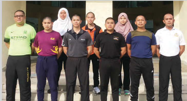
SEMBILAN orang kadet Diploma Kejuruteraan Marin memulakan pengajian di Akademi Maritim Brunei (BMA) Institut Pendidikan Teknikal Brunei (IBTE) Kampus IBTE Jefri Bolkiah (JBC).