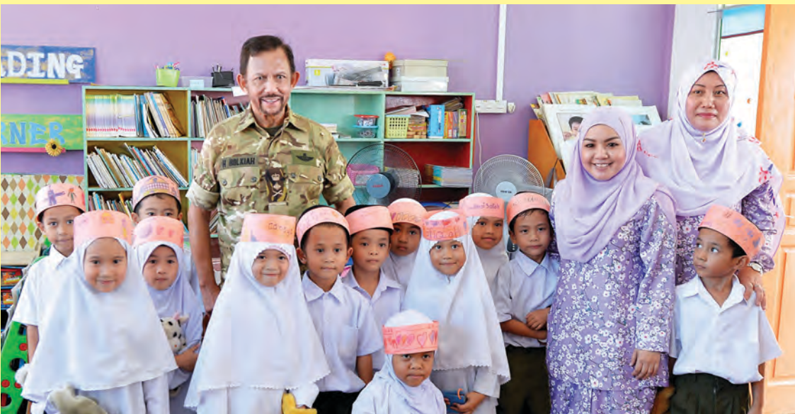
KEBAWAH DYMM berkenan bergambar ramai bersama murid-murid Sekolah Rendah Tumpuan Telisai, Tutong.