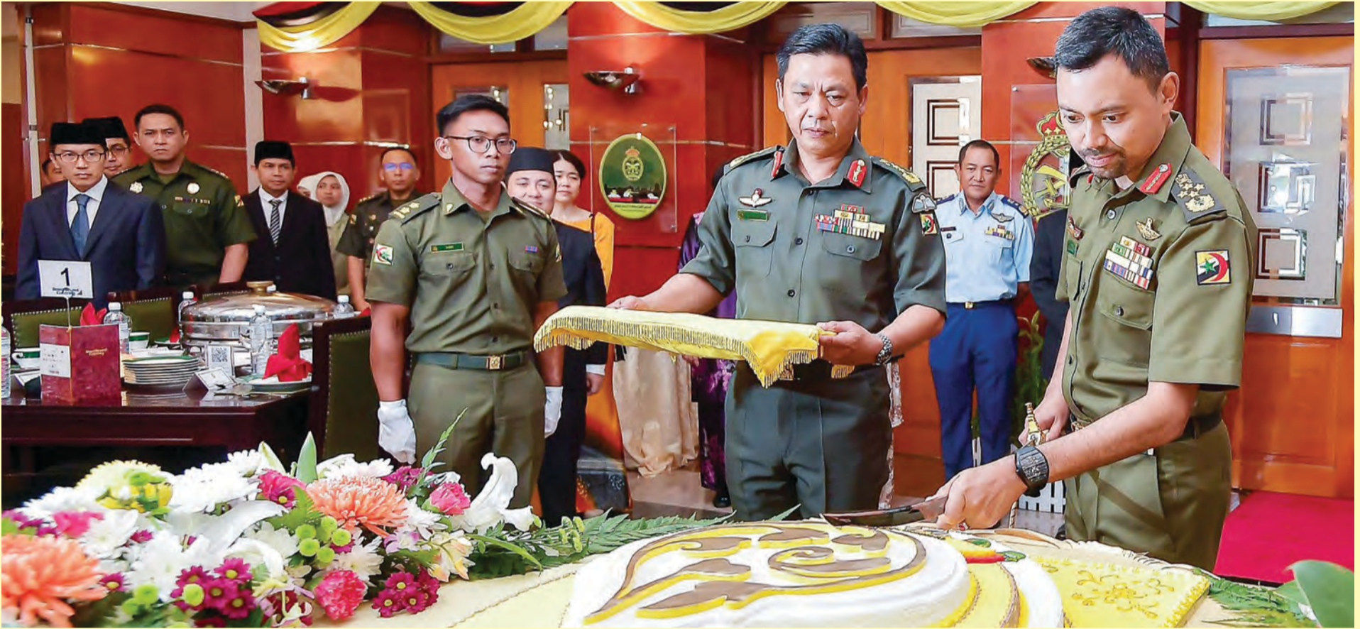
DULI Yang Teramat Mulia Paduka Seri Pengiran Muda Mahkota Jeneral Pengiran Muda Haji Al-Muhtadee Billah ibni Kebawah Duli Yang Maha Mulia Paduka Seri Baginda Sultan Haji Hassanal Bolkiah Mu'izzaddin Waddaulah, Menteri Kanan di Jabatan Perdana Menteri dan Jeneral Angkatan Bersenjata Diraja Brunei (ABDB) berkenan memotong kek puja usia yang disembahkan oleh ABDB.