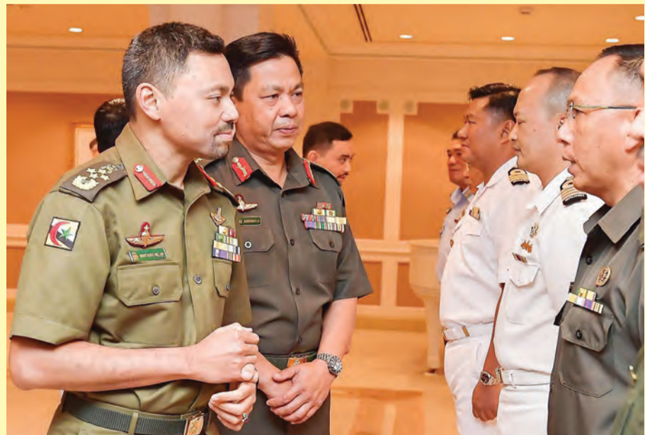
DULI Yang Teramat Mulia Paduka Seri Pengiran Muda Mahkota berkenan menerima senaskhah buku album gambar bertajuk 'Sejambak Ristaan XI' (kiri), manakala gambar kanan, Duli Yang Teramat Mulia berkenan beramah mesra dengan pegawai-pegawai ABDB serta pegawai-pegawai bertauliah baharu yang menerima anugerah kecemerlangan di Sekolah Pegawai Kadet Pengambilan Ke-16.