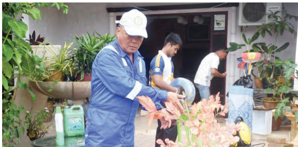
AHLI-AHLI sukarelawan yang turut melibatkan diri dalam aktiviti kemasyarakatan tersebut.