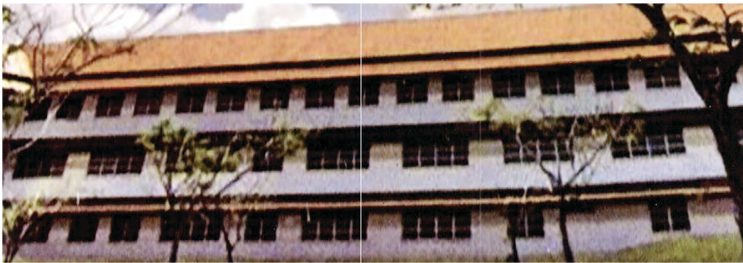
GAMBAR bekas Kampus Institut Pengajian Islam Sultan Haji Omar 'Ali Saifuddin (IPISHOAS).