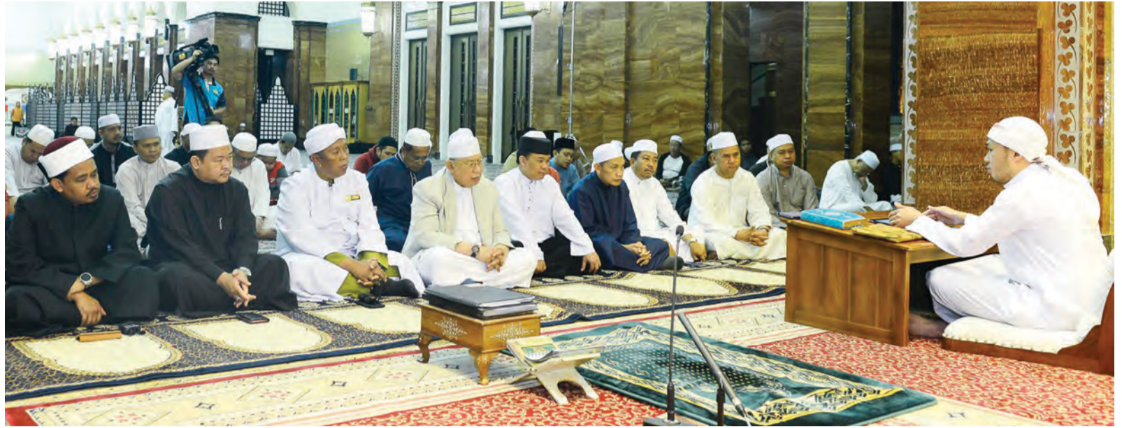
MENTERI di Jabatan Perdana Menteri, Yang Berhormat Dato Seri Paduka Awang Haji Abdul Mokti bin Haji Mohd. Daud; Menteri Kebudayaan, Belia dan Sukan, Yang Berhormat Mejar Jeneral (B) Dato Paduka Seri Haji Aminuddin Ihsan bin Pehin Orang Kaya Saiful Mulok Dato Seri Paduka Haji Abidin dan Timbalan Menteri Hal Ehwal Ugama, Yang Mulia Pengiran Dato Seri Paduka Haji Bahrom bin Pengiran Haji Bahar antara yang hadir pada Program Masjidku Makmur, Negara Berkah yang diadakan di Masjid Omar 'Ali Saifuddin.