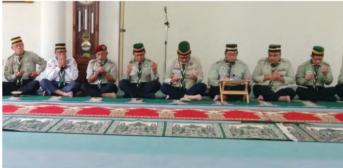
PERSEKUTUAN Pengakap Negara Brunei Darussalam (PPNBD) mengadakan Majlis Doa Kesyukuran sempena Hari Puja Usia Duli Yang Teramat Mulia Paduka Seri Pengiran Muda Mahkota Pengiran Muda Haji Al-Muhtadee Billah ibni Kebawah Duli Yang Maha Mulia Paduka Seri Baginda Sultan Haji Hassanal Bolkiah Mu'izzaddin Waddaulah, Menteri Kanan di Jabatan Perdana Menteri yang juga selaku Ketua Pengakap Ke-44 Tahun.