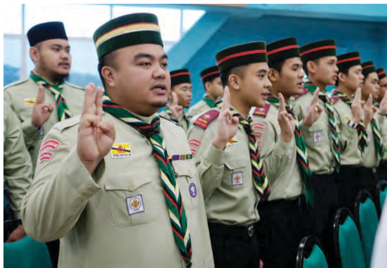
PESERTA Perhimpunan Pengakap Kelana Senegara Ke-2 sempena Sambutan 85 Tahun Pergerakan Pengakap di Negara Brunei Darussalam dan Sambutan 100 Tahun Pengakap Kelana Sedunia semasa membaca Persewaan Pengakap.