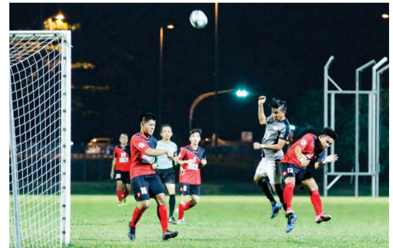
ANTARA aksi perlawanan pasukan Kasuka FC ketika menentang pasukan Najip I-Team (jersi merah) (kiri), sementara gambar kanan, keadaan mencemaskan di depan pintu gol pertemuan pasukan Kasuka FC menentang pasukan Najip I-Team.

Oleh : Marlinawaty Hussin