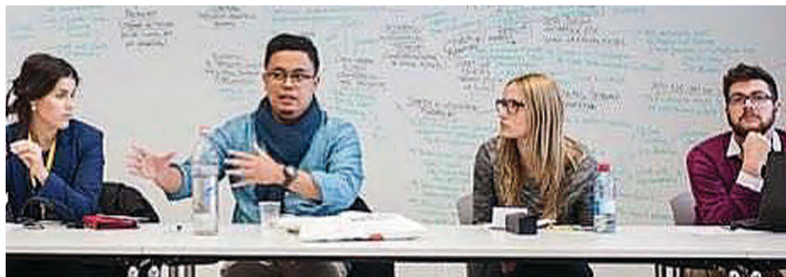
BELIAU juga menjadi wakil tunggal Negara Brunei Darussalam pada Simposium Pemimpin Muda Asia Eropah di Luxembourg pada tahun 2015.

"Sentiasalah menjadi belia yang sentiasa peka akan keadaan sekeliling dan juga keperluan semasa yang sentiasa berubah-ubah dan jadikanlah setiap cabaran ini sebagai pendorong yang kuat untuk kita lebih banyak berbakti kepada agama bangsa, negara dan masyarakat," saran beliau lagi.