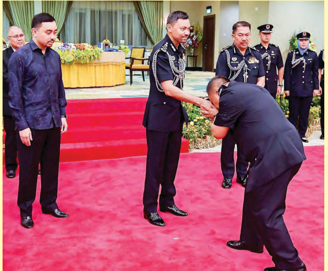
DULI Yang Teramat Mulia Paduka Seri Pengiran Muda Mahkota Timbalan Inspektor Jeneral Polis Pengiran Muda Haji Al-Muhtadee Billah ibni Kebawah Duli Yang Maha Mulia Paduka Seri Baginda Sultan Haji Hassanal Bolkiah Mu'izzaddin Waddaulah, Menteri Kanan di Jabatan Perdana Menteri ketika berkenan berangkat ke Majlis Santap Petang sempena Puja Usia Duli Yang Teramat Mulia Ke-44 Tahun (kiri). Sementara gambar kanan, Duli Yang Teramat Mulia berkenan menerima junjung ziarah daripada pegawai dan anggota Pasukan Polis Diraja Brunei (PDB). Berangkat sama, Duli Yang Teramat Mulia Paduka Seri Pengiran Muda 'Abdul Malik ibni Kebawah Duli Yang Maha Mulia Paduka Seri Baginda Sultan Haji Hassanal Bolkiah Mu'izzaddin Waddaulah.