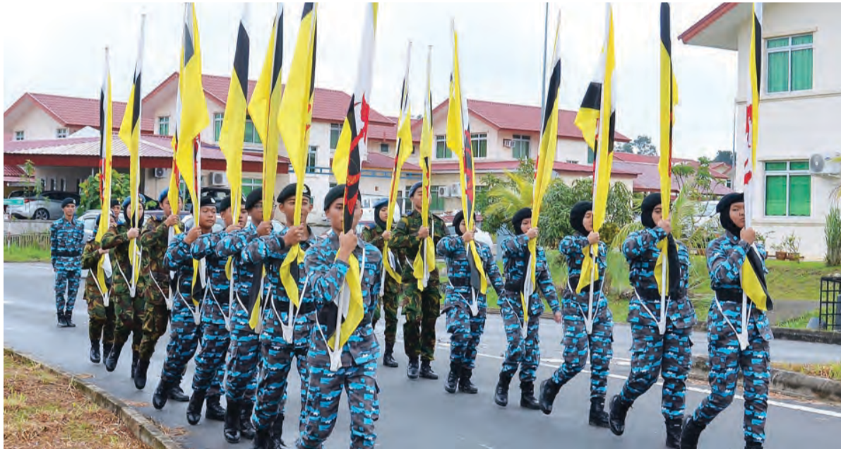
PERBARISAN lalu daripada Pelatih-pelatih Program Khidmat Bakti Negara (PKBN) dan Kadet Tentera Udara Maktab Sains Paduka Seri Begawan Sultan (MSPSBS).