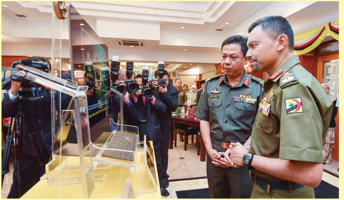
DULI Yang Teramat Mulia Paduka Seri Pengiran Muda Mahkota Jeneral Pengiran Muda Haji Al-Muhtadee Billah, Menteri Kanan di Jabatan Perdana Menteri dan Jeneral Angkatan Bersenjata Diraja Brunei berkenan menandatangani Lembaran Kenangan (kiri). Manakala gambar kanan, DYTM ketika berkenan menerima pesambah.