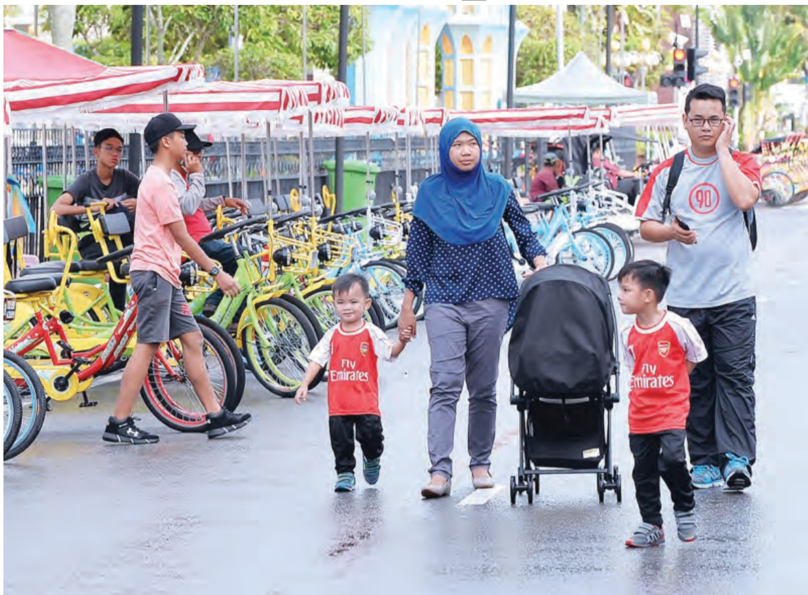
ANTARA aktiviti di Bandarku Ceria.

Oleh itu, beliau berharap permainan itu akan dapat menceriai lagi Bandarku Ceria sekali gus menambah lagi pendapatan mereka sekeluarga di hujung minggu program berkenaan.