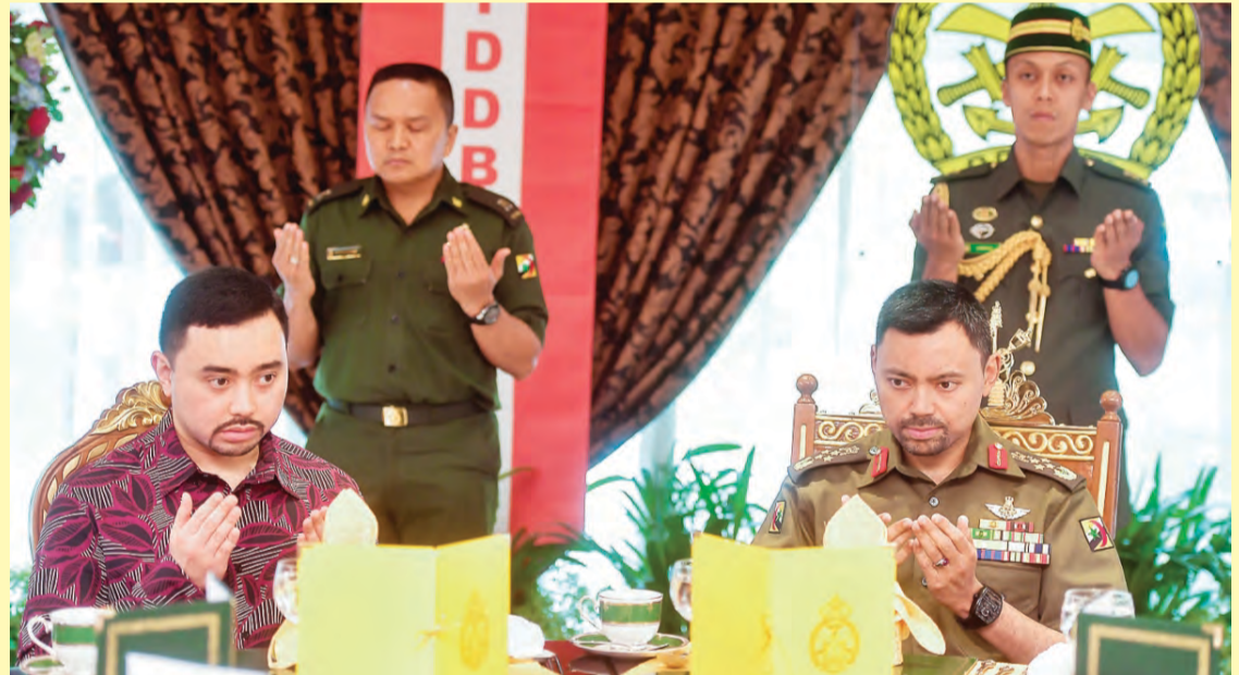
DULI Yang Teramat Mulia Paduka Seri Pengiran Muda Mahkota Jeneral Pengiran Muda Haji Al-Muhtadee Billah berkenan berangkat ke Majlis Santap sempena Hari Puja Usia Duli Yang Teramat Mulia Ke-44 Tahun. Berangkat sama ialah paduka adinda Duli Yang Teramat Mulia, iaitu Duli Yang Teramat Mulia Paduka Seri Pengiran Muda 'Abdul Malik.