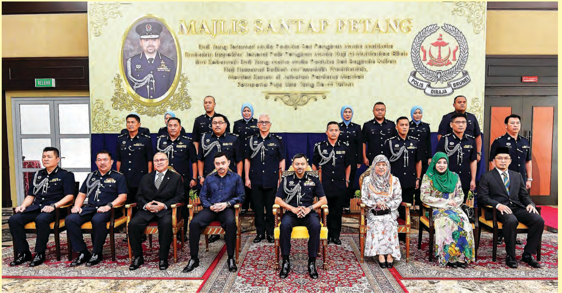
DULI Yang Teramat Mulia Paduka Seri Pengiran Muda Mahkota Timbalan Inspektor Jeneral Polis Pengiran Muda Haji Al-Muhtadee Billah ibni Kebawah Duli Yang Maha Mulia Paduka Seri Baginda Sultan Haji Hassanal Bolkiah Mu'izzaddin Waddaulah, Menteri Kanan di Jabatan Perdana Menteri semasa berkenan bergambar ramai.