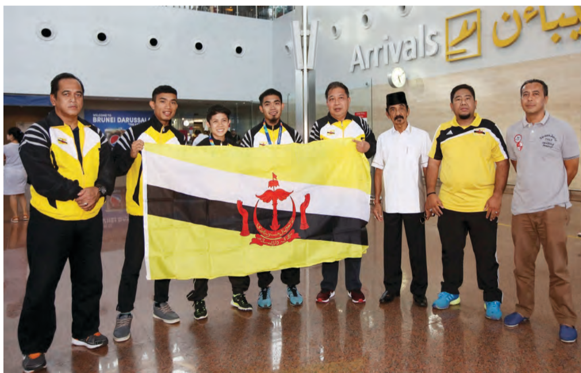
KONTINJEN Negara Brunei Darussalam selamat tiba ke tanah air selepas menyertai Kejohanan Pencak Silat Jemputan Laluan ke Sukan Asia 2018, yang berlangsung di Padepokan, Jakarta, Indonesia.