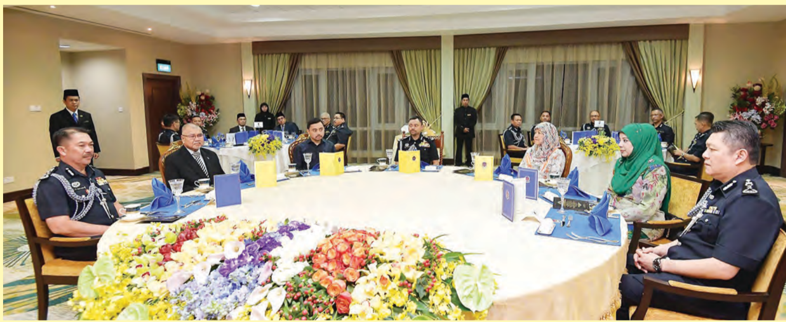
DULI Yang Teramat Mulia bersama kerabat diraja semasa berkenan berangkat ke Majlis Santap di Dewan Bankuet.