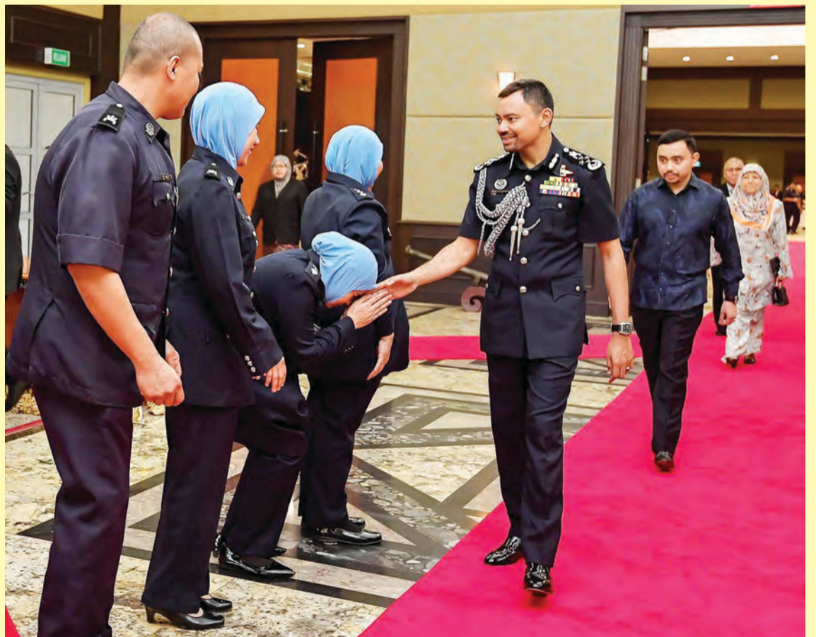
DULI Yang Teramat Mulia Paduka Seri Pengiran Muda Mahkota Timbalan Inspektor Jeneral Polis Pengiran Muda Haji Al-Muhtadee Billah berkenan menandatangani 'Lembaran Kenangan Keberangkatan' (kiri). Manakala gambar kanan, DYT Paduka Seri Pengiran Muda Mahkota Timbalan Inspektor Jeneral Polis berkenan menerima junjung ziarah daripada para pegawai PDB sebelum berangkat meninggalkan Dewan Bankuet, Mes Pegawai Polis Gadong.