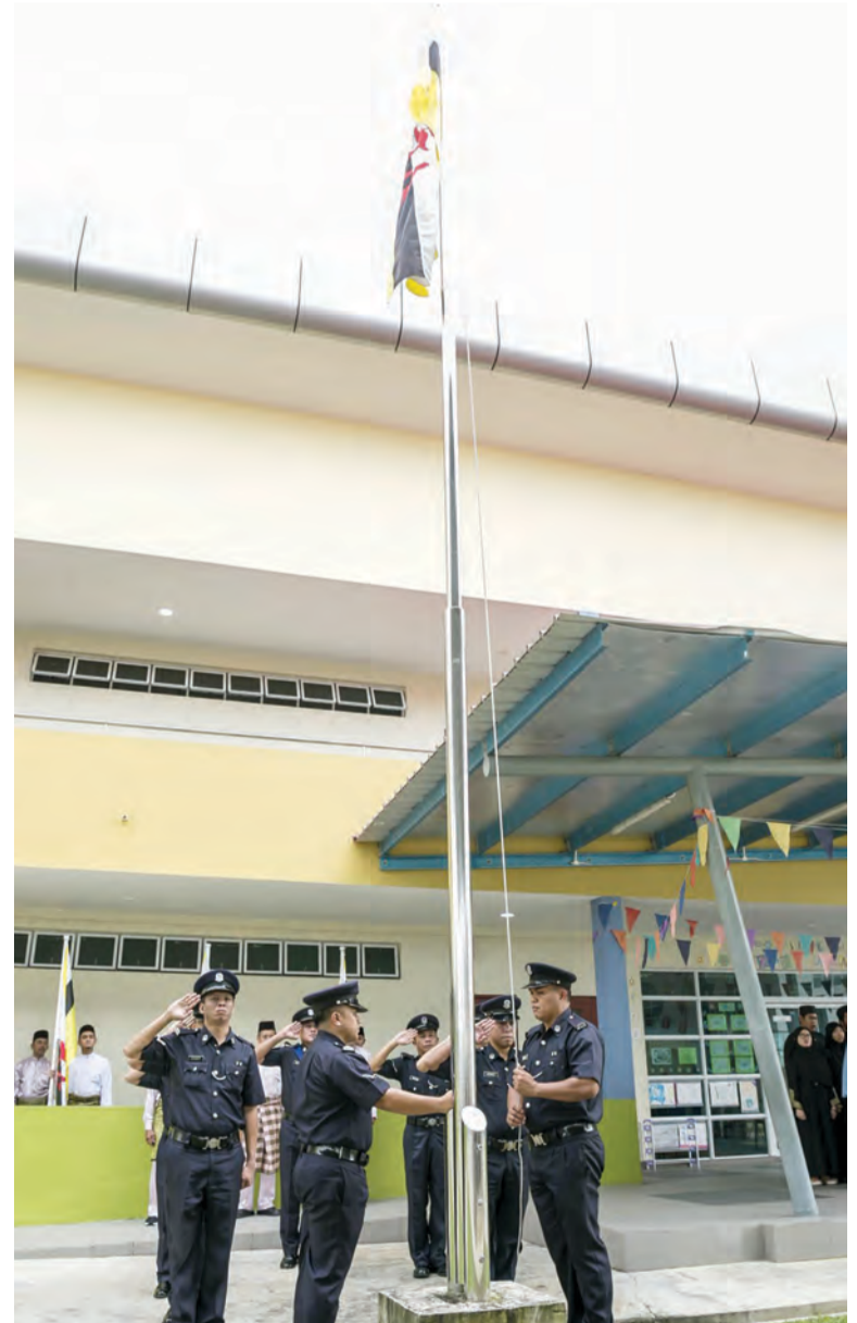
PASUKAN Polis Diraja Brunei menaikkan bendera negara sambil diiringi Lagu Kebangsaan oleh Kumpulan Koir Pusat Tingkatan Enam Sengkurong.