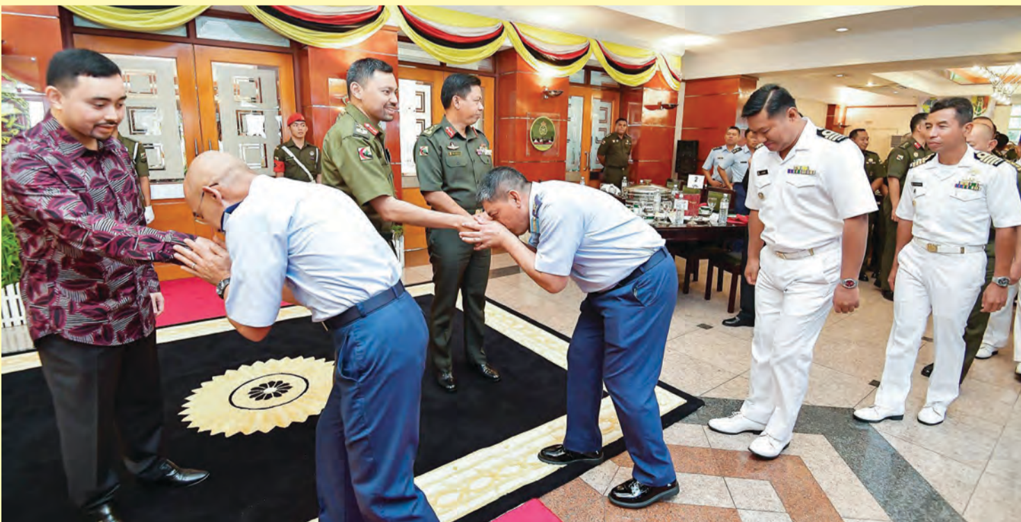
DYTM Paduka Seri Pengiran Muda Mahkota Jeneral Pengiran Muda Haji Al-Muhtadee Billah berkenan berangkat ke Majlis Santap sempena Hari Puja Usia Duli Yang Teramat Mulia Ke-44 Tahun. Berangkat sama ialah DYTM Paduka Seri Pengiran Muda 'Abdul Malik (atas).