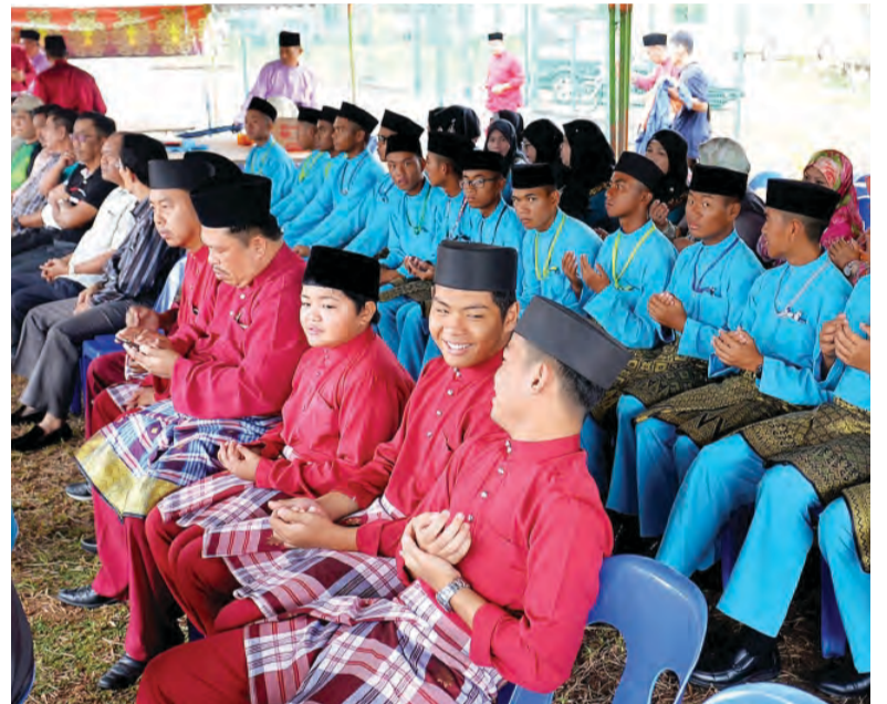
ANTARA penduduk kampung dan para belia yang hadir pada Majlis Perasmian Gerbang dan Penaikan Bendera Negara Brunei Darussalam.