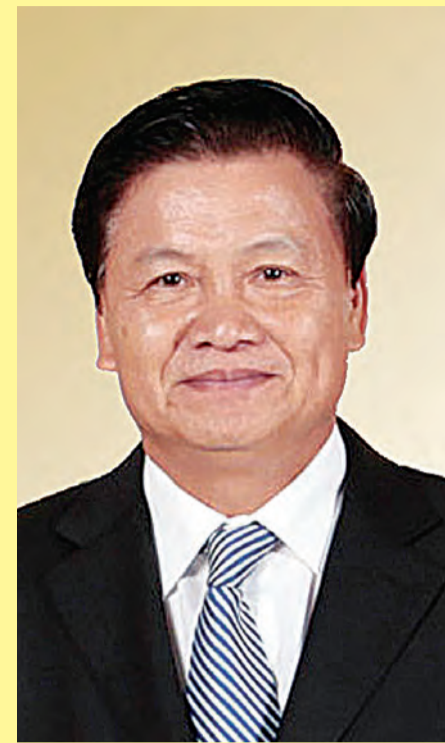
KEBAWAH Duli Yang Maha Mulia Paduka Seri Baginda Sultan Haji Hassanal Bolkiah Mu'izzaddin Waddaulah ibni Al-Marhum Sultan Haji Omar 'Ali Saifuddien Sa'adul Khairi Waddien, Sultan dan Yang Di-Pertuan Negara Brunei Darussalam berkenan menghantar titah-titah perutusan tahniah kepada Presiden Republik Demokratik Rakyat Lao, Tuan Yang Terutama Bounnhang Vorachith dan Perdana Menteri Republik Demokratik Rakyat Lao, Tuan Yang Terutama Dr. Thongloun Sisoulith serta kerajaan dan rakyat Republik Demokratik Rakyat Lao sempena dengan Hari Kebangsaan republik berkenaan Yang Ke-43.

atas persahabatan yang akrab dan perkembangan hubungan dua hala yang dikecapi selama ini.