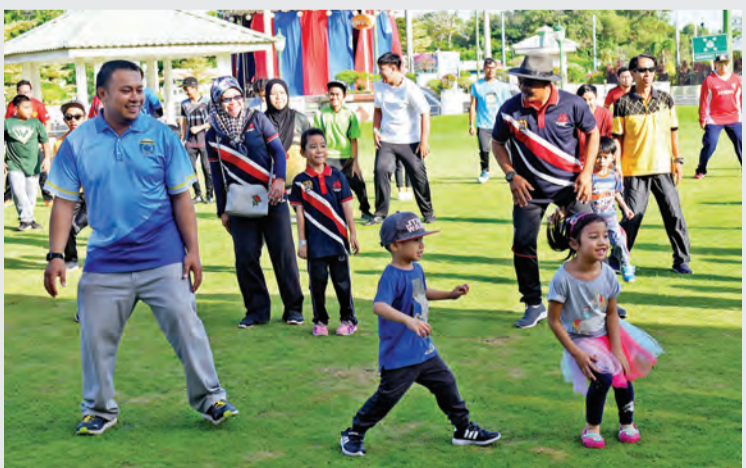
SAMBUTAN Hari Keluarga Tabung Amanah Pekerja 2018 dimeriahkan dengan acara senamrobik, walkaton dan aktiviti keluarga dan permainan bertempat di Jerudong Park Colonnade, Jerudong Park and Country Club.

Sambutan Hari Keluarga TAP bertujuan untuk memupuk semangat bekerjasama, perpaduan serta mengeratkan lagi hubungan silaturahim bukan sahaja dalam kalangan warga kerja TAP bahkan juga di antara ahli-ahli keluarga mereka dengan melakukan bersama aktiviti senamrobik, walkaton, serta beberapa permainan keluarga.