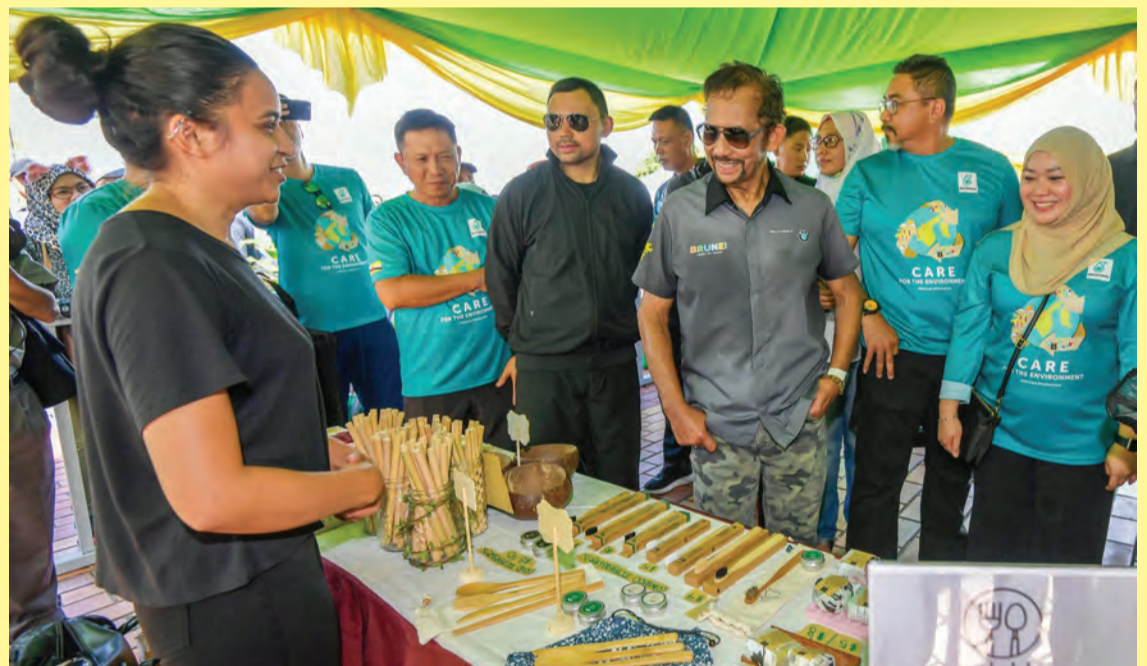
KEBAWAH Duli Yang Maha Mulia Paduka Seri Baginda Sultan dan Yang Di-Pertuan Negara Brunei Darussalam bersama paduka anakanda baginda semasa berkenan menyaksikan pameran (kanan), sementara gambar kiri, baginda berkenan mencuba sukan memanah di BDF 2018.