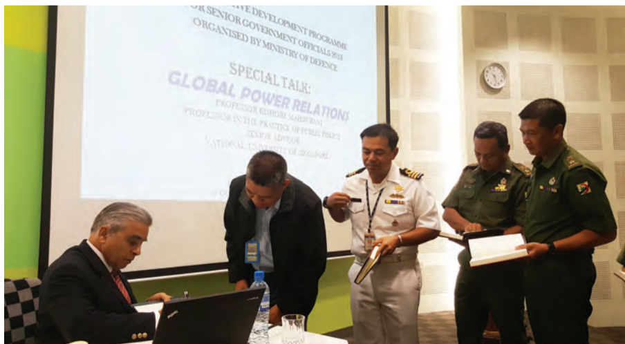
SESI Ceramah Khas bersama Professor in the Practice of Public Policy / Senior Advisor, National University of Singapore, Profesor Kishore Mahbubani yang diadakan pada 29 Oktober 2018.