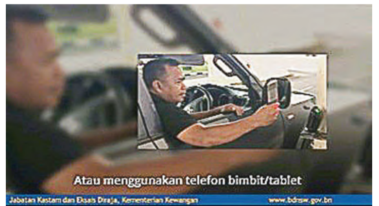
Atau menggunakan telefon bimbit/tablet

Maklumat lanjut mengenai perkara ini boleh didapati dengan melayari laman sesawang www.tradingacrossborders.gov.bn atau www.bdnsw.gov.bn ; atau menghubungi terus Kaunter Pelanggan di Perkhidmatan talian +673 2382361 atau +673 2382333; atau melalui e-mel ke info@customs.gov.bn .