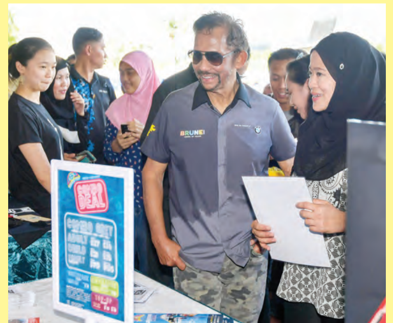
KEBAWAH Duli Yang Maha Mulia bersama paduka anakanda baginda semasa berkenan bergambar ramai bersama para pegawai dari Pusat Da'wah Islamiah pada BDF 2018 (kiri), sementara gambar kanan, baginda semasa berkenan menyaksikan dan mendengar sembah penerangan daripada salah satu rakan strategik BDF 2018.