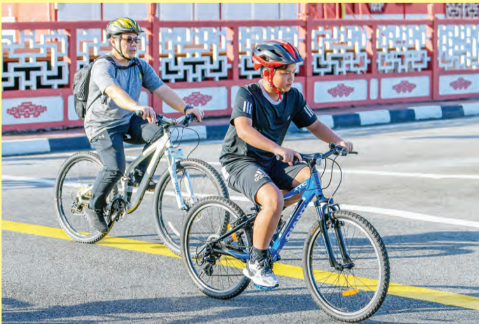
DULI Yang Teramat Mulia Paduka Seri Pengiran Muda 'Abdul Wakeel dan Yang Teramat Mulia Paduka Seri Pengiran Anak Puteri Ameerah Wardatul Bolkiah ketika berkenan menyertai acara Kayuhan Basikal sempena BDF 2018 (kiri dan kanan).