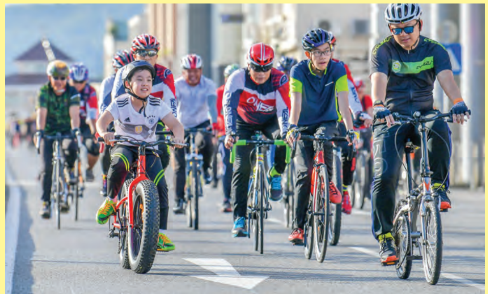
YANG Berhormat Menteri Perhubungan (dua, kiri) dan pelbagai lapisan masyarakat sama-sama menjayakan dan berkongsi kegembiraan pada acara kayuhan berkenaan (kiri dan kanan).