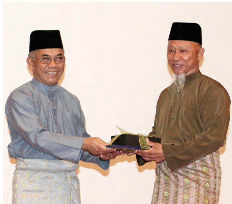
MENTERI Sumber-Sumber Utama dan Pelancongan, Yang Berhormat Dato Seri Setia Awang Haji Ali bin Haji Apong (kiri) semasa menyampaikan Sijil Perkhidmatan kepada pesara Kementerian Sumber-Sumber Utama dan Pelancongan.

Ceramah antara lain menyentuh mengenai beberapa peristiwa bersejarah Nabi Muhammad Sallallahu Alaihi Wasallam juga melihat bagaimana keperluannya