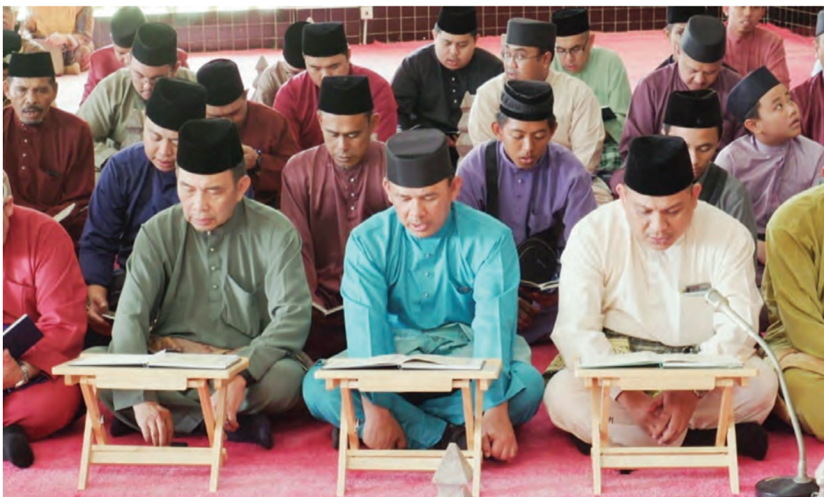
MENTERI Kebudayaan, Belia dan Sukan, Yang Berhormat Mejar Jeneral (B) Dato Paduka Seri Haji Aminuddin Ihsan bin Pehin Orang Kaya Saiful Mulok Dato Seri Paduka Haji Abidin (tengah) semasa hadir pada Majlis Tahlil bagi Al-Marhum Sultan Haji Omar 'Ali Saifuddin Sa'adul Khairi Waddien ibni Al-Marhum Sultan Muhammad Jamalul Alam di Kubah Makam Diraja bagi memperingati Hari Antarabangsa Orang Kelainan Upaya.