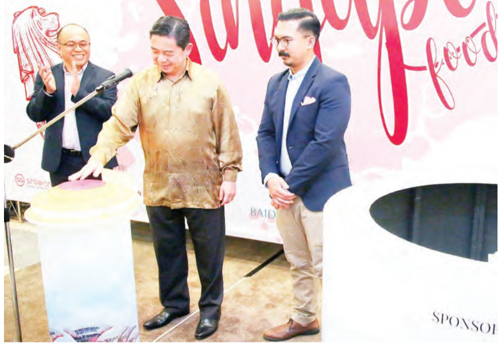
MENTERI di Jabatan Perdana Menteri dan Menteri Kewangan dan Ekonomi II, Yang Berhormat Dato Seri Setia Dr. Awang Haji Mohd. Amin Liew bin Abdullah melancarkan Festival Makanan Singapura (kanan), sementara gambar kiri, Yang Berhormat Dato Seri Setia Dr. Awang Haji Mohd. Amin Liew melihat lebih dekat makanan yang disajikan pada Festival Makanan Singapura.