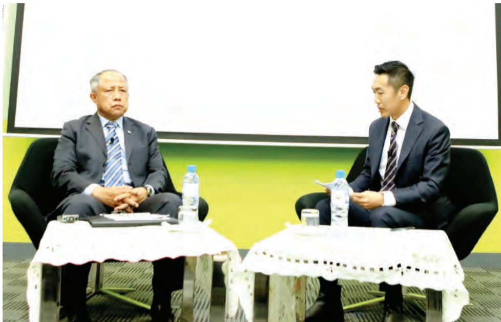
SESI Khas bersama Yang Berhormat Menteri Pertahanan Kedua yang diadakan di Dewan Kuliah, Institut Pengajian Pertahanan dan Strategik Sultan Haji Hassanal Bolkiah pada 21 November 2018.