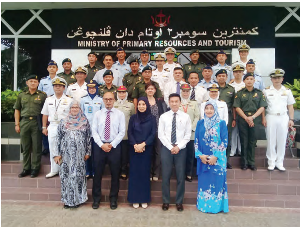
PARA peserta Program Perkembangan Eksekutif mengadakan Lawatan sambil Belajar ke Kementerian Sumber-Sumber Utama dan Pelancongan pada 16 Oktober 2018.