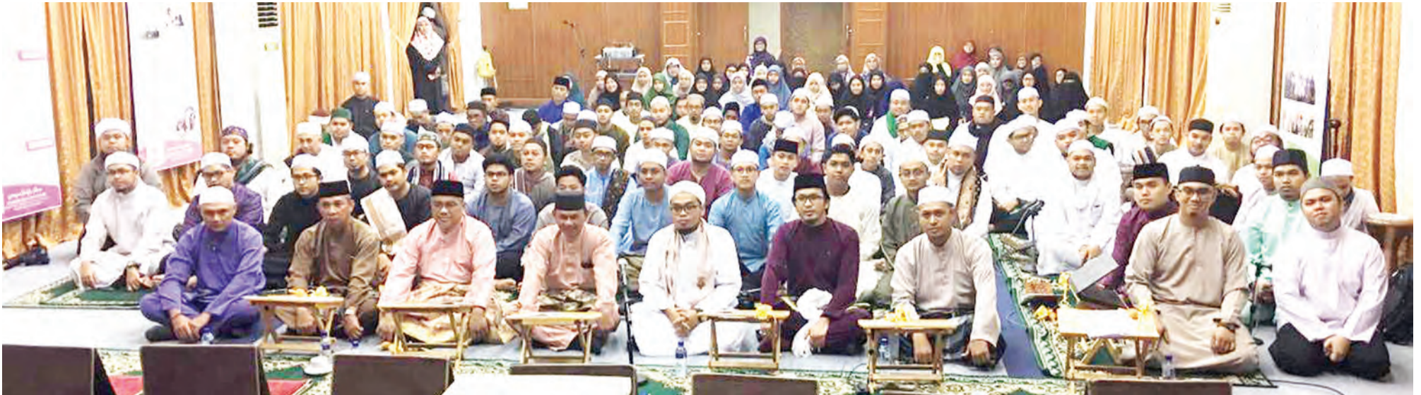
MENTERI Kebudayaan, Belia dan Sukan, Yang Berhormat Mejar Jeneral (B) Dato Paduka Seri Haji Aminuddin Ihsan bin Pehin Orang Kaya Saiful Mulok Dato Seri Paduka Haji Abidin (empat, kiri) hadir selaku tetamu kehormat pada Majlis Selawat Ke Atas Rasulullah Sallallahu Alaihi Wasallam; Rasulullah Sallallahu Alaihi Wasallam Di Hati Kami kelolaan oleh Kelab Komuniti Belia Transformasi.