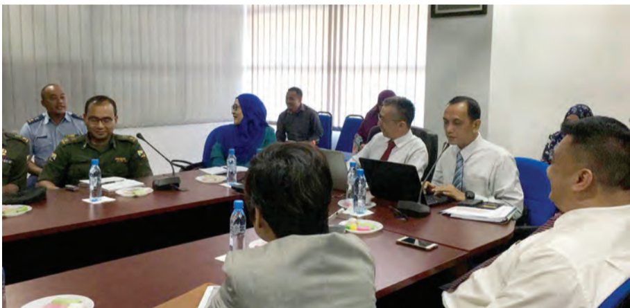
PARA peserta mengadakan Lawatan sambil Belajar ke Kementerian Pendidikan pada 17 Oktober 2018.