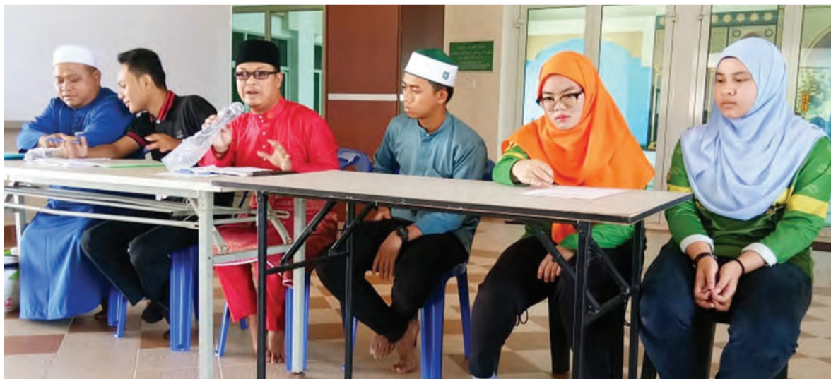
MUZAKARAH dan perjumpaan belia-beliawanis Masjid Pengiran Anak Haji Mohammad Alam Kampung Sengkarai.

Muzakarah ini diharap dapat memberikan suntikan semangat kepada belia-beliawanis masjid berkenaan untuk terus maju dan bergiat aktif.