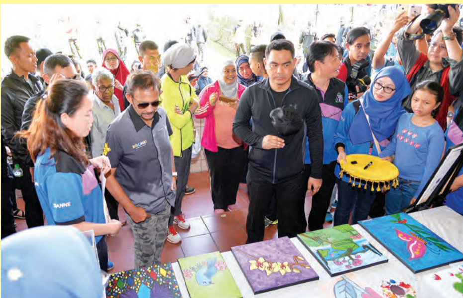
KEBAWAH Duli Yang Maha Mulia Paduka Seri Baginda Sultan dan Yang Di-Pertuan Negara Brunei Darussalam bersama paduka anakanda baginda semasa berkenan menyaksikan pameran dan mendengar sembah penerangan daripada para rakan strategik yang ikut serta pada pameran semasa Pelancaran BDF 2018 di ibu negara (kanan dan kiri).