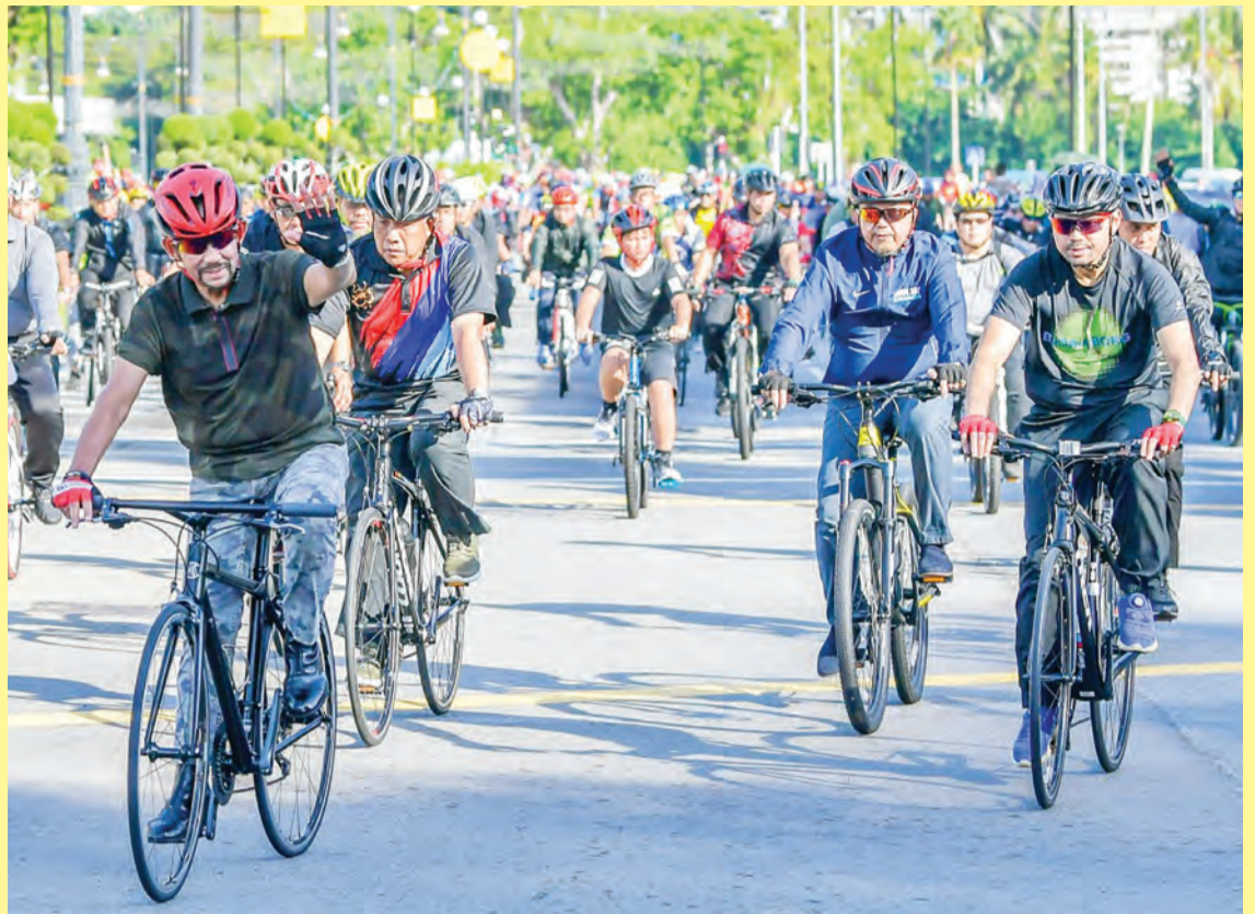
KEBAWAH Duli Yang Maha Mulia Paduka Seri Baginda Sultan Haji Hassanal Bolkiah Mu'izzaddin Waddaulah ibni Al-Marhum Sultan Haji Omar 'Ali Saifuddin Sa'adul Khairi Waddien, Sultan dan Yang Di-Pertuan Negara Brunei Darussalam bersama paduka-paduka anakanda baginda berkenan menyertai acara Kayuhan Basikal sejauh 11.5 kilometer mengelilingi Pusat Bandar sempena Brunei December Festival (BDF) 2018.

Selain berkenan menyaksikan pameran-pameran dan demonstrasi daripada pihak-pihak penganjur serta peserta pameran yang ikut serta pada BDF 2018, baginda sebagai seorang raja yang berjiwa rakyat juga berkenan mengabdikan