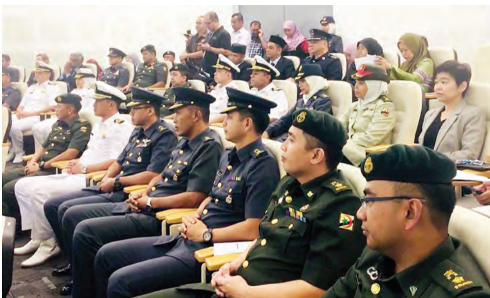
PARA peserta Program Perkembangan Eksekutif bagi Pegawai-pegawai Kanan Kerajaan Siri Ke-14 anjuran Kementerian Pertahanan yang diraikan pada majlis penutup program pada 30 November 2018.