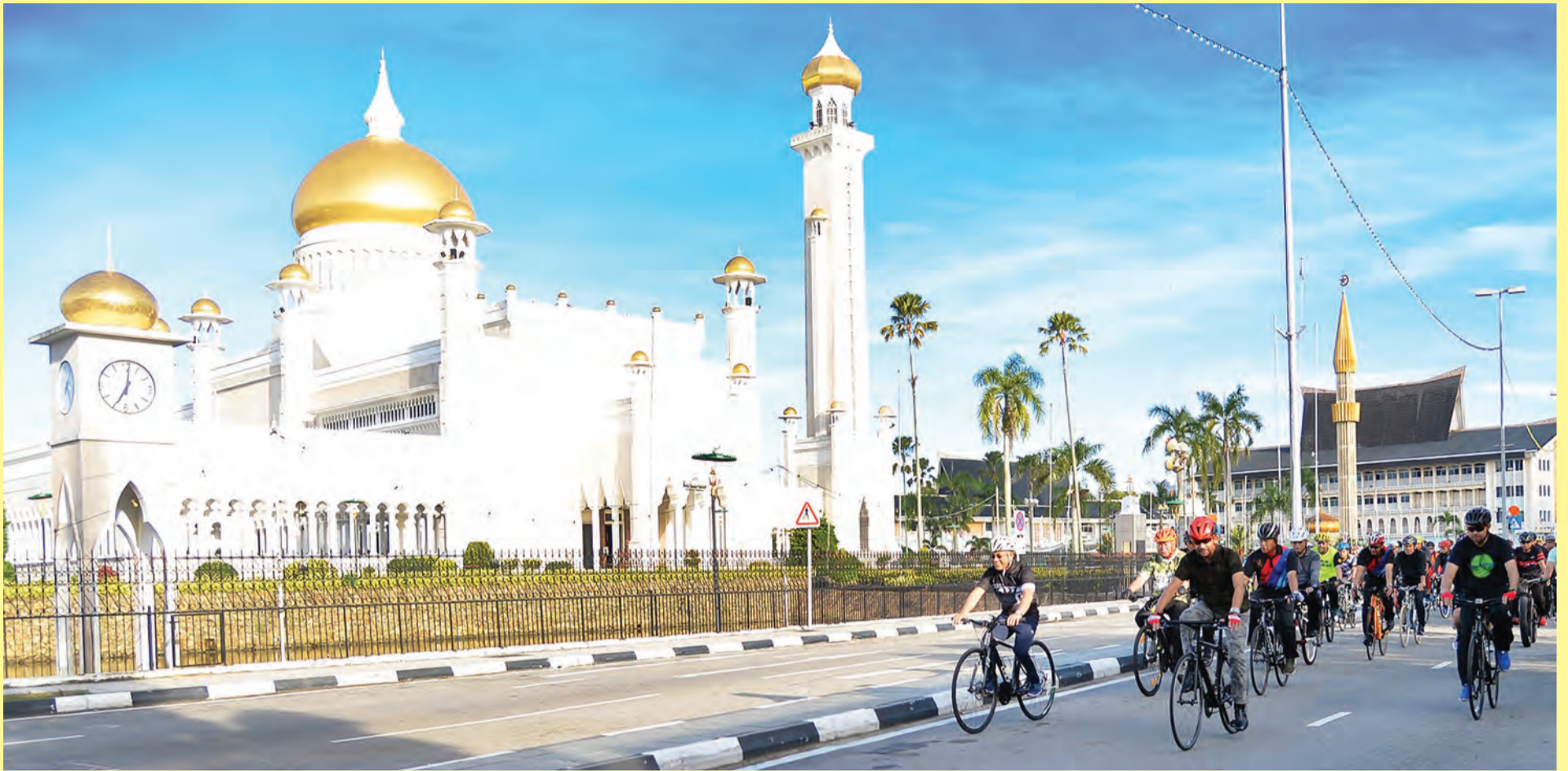
KEBAWAH Duli Yang Maha Mulia Paduka Seri Baginda Sultan Haji Hassanal Bolkiah Mu'izzaddin Waddaulah ibni Al-Marhum Sultan Haji Omar 'Ali Saifuddien Sa'adul Khairi Waddien, Sultan dan Yang Di-Pertuan Negara Brunei Darussalam bersama paduka anakanda baginda berkenan menyertai acara Kayuhan Basikal sejauh 11.5 kilometer bersama para Menteri Kabinet juga rakyat dan penduduk dalam sama-sama memeriahkan Pelancaran Brunei December Festival (BDF) 2018 ketika melintasi salah satu pemandangan indah, iaitu Masjid Omar 'Ali Saifuddien yang merupakan salah satu ikonik yang terdapat di Bandar Seri Begawan.