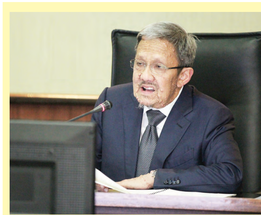
SABDA Duli Yang Teramat Mulia Paduka Seri Pengiran Bendahara Seri Maharaja Permaisua Pengiran Muda Haji Sufri Bolkiah ibni Al-Marhum Sultan Haji Omar 'Ali Saifuddin Sa'adul Khairi Waddien, Presiden Majlis Olimpik Kebangsaan Negara Brunei Darussalam (BDNOC) pada Mesyuarat Post Mortem Kejohanan Sukan Olimpik Belia Musim Panas Kali Ke-3 di Buenos Aires, Argentina pada Sabtu, 2 Rabiulawal 1440 Hijrah bersamaan 10 November 2018 Masihi di Bilik Persidangan, Stadium Negara Hassanal Bolkiah.

Di sini saya ingin menanyakan beberapa perkara mengenai dengan penglibatan kontinjen kita semasa di Buenos Aires Youth Olympic Games 2018, di mana saya mendapati ada atlet kita yang tidak memakai pakaian rasmi kontinjen semasa menjalani latihan. Adakah tidak diperlukan bagi atlet ataupun pegawai kita untuk tidak memakai pakaian rasmi kontinjen yang diberikan daripada Kementerian Kebudayaan, Belia dan Sukan (KKBS)? Jika sekiranya tidak perlu maka di masa-masa akan datang tidak perlulah kita bersusah payah untuk memberikan pakaian lagi kepada kontinjen kita. Bagi saya, pemberian pakaian rasmi kontinjen dari KKBS ini adalah bagi membina identiti kita selaku atlet ataupun pegawai yang berkontinjen yang mana boleh menunjukkan kita adalah wakil yang sah dari Negara Brunei Darussalam, dengan ini kita seharusnya berasa bersyukur kerana diberikan pakaian yang seumpamanya. Bukanlah hasrat saya untuk mencari kesalahan sesiapa ataupun menyalahkan sesiapa, akan tetapi saya hanya ingin menasihati dan mengingatkan abiskita semua supaya perkara yang mungkin dianggap kecil ini tidak akan terlepas pandang di masa akan datang kerana perkara kecil inilah nanti yang akan menjadi besar apabila ianya tidak diberikan perhatian awal. Ini adalah juga salah satu tanggungjawab pengurus, jurulatih mahupun atlet itu sendiri kerana pemergian abiskita adalah berdasarkan kepada perbelanjaan dan usaha Majlis Olimpik Kebangsaan Negara Brunei