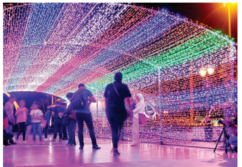
TEROWONG cahaya yang menampilkan lima kisah dongeng Aesop untuk para pengunjung.

Untuk mengetahui lebih lanjut mengenai tawaran-tawaran terkini Jerudong Park, bolehlah mengikuti Instagram dan Facebook Jerudong Park.