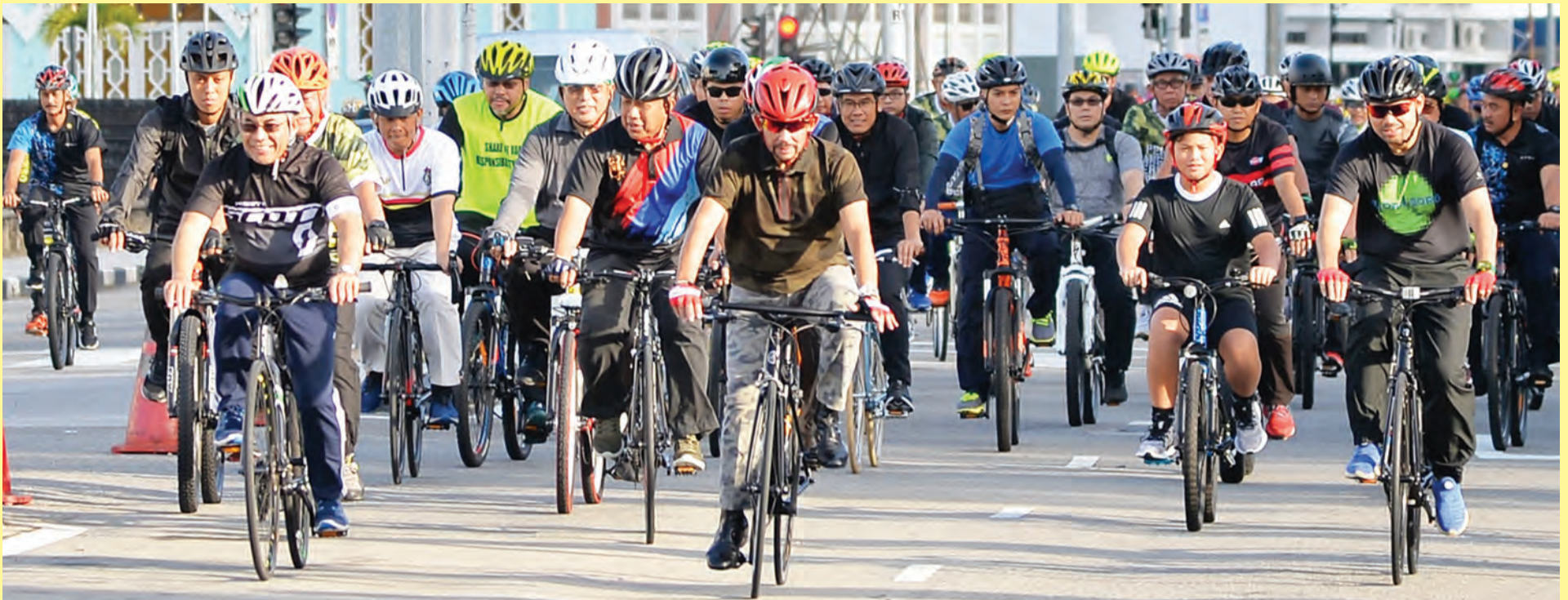
KEBAWAH Duli Yang Maha Mulia Paduka Seri Baginda Sultan Haji Hassanal Bolkiah Mu'izzaddin Waddaulah ibni Al-Marhum Sultan Haji Omar 'Ali Saifuddien Sa'adul Khairi Waddien, Sultan dan Yang Di-Pertuan Negara Brunei Darussalam dan paduka-paduka anakanda baginda, Duli Yang Teramat Mulia Paduka Seri Pengiran Muda Mahkota Pengiran Muda Haji Al-Muhtadee Billah, Menteri Kanan di Jabatan Perdana Menteri dan Duli Yang Teramat Mulia Paduka Seri Pengiran Muda 'Abdul Wakeel berkenan menyertai acara Kayuhan Basikal sempena Brunei December Festival (BDF) 2018.