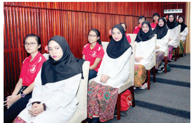
SEBAHAGIAN daripada pelajar yang menyertai Perkhemahan Pengembaraan Kepimpinan Pelajar Brunei - Singapura Kali Ke-12.

Tujuan perkhemahan tersebut adalah bagi membangun kepimpinan, pemikiran, penyelesaian masalah dan kemahiran membuat keputusan dalam setiap diri pelajar yang menyertai BSAC.