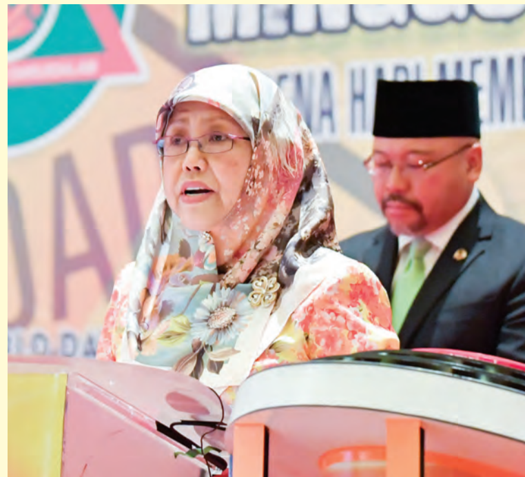
YANG Teramat Mulia Paduka Seri Pengiran Anak Puteri Hajah Masna binti Al-Marhum Sultan Haji Omar 'Ali Saifuddin Sa'adul Khairi Waddien, Ambassador-at-Large di Kementerian Hal Ehwal Luar Negeri selaku Penaung Diraja Majlis Keselamatan Jalan Raya Negara Brunei Darussalam semasa berkenan mengurniakan sabda pada Majlis Pelancaran Minggu Keselamatan Jalan Raya sempena Memperingati Mangsa-mangsa Lalu Lintas Jalan Raya Sedunia 2018.

Antara penyelerasan di peringkat serantau yang dilaksanakan sabda YTM ialah Penubuhan Pusat Penyelidikan ASEAN, khusus mengenai keselamatan jalan raya, yang ditempatkan di bawah Malaysia Institute of Road Safety Research (MIROS), selain itu, rakan-rakan dialog ASEAN seperti Jepun dan