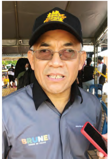
MENTERI Sumber-Sumber Utama dan Pelancongan, Yang Berhormat Dato Seri Setia Awang Haji Ali bin Haji Apong semasa ditemu bual Pelita Brunei.

Daripada aspek masa akan datang katanya, mereka akan meneruskan usaha ini dengan menjemput lebih banyak lagi penyertaan bagi pengisian acara-acara yang menarik dan menjadikan Brunei sebagai destinasi pilihan pada masa akan datang, terutama pada bulan Disember.