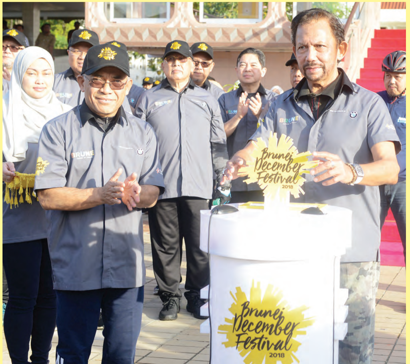
KEBAWAH Duli Yang Maha Mulia Paduka Seri Baginda Sultan Haji Hassanal Bolkiah Mu'izzaddin Waddaulah ibni Al-Marhum Sultan Haji Omar 'Ali Saifuddin Sa'adul Khairi Waddien, Sultan dan Yang Di-Pertuan Negara Brunei Darussalam berkenan berangkat dan merasmikan Brunei December Festival 2018. (Lihat muka 3 hingga 6).