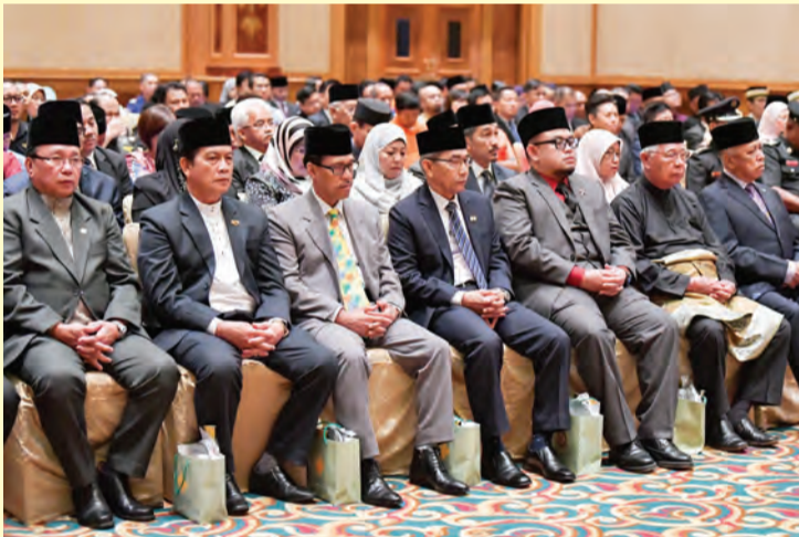
YANG Teramat Mulia berkenan menandatangani ikrar (pledging) untuk memandu dengan selamat (kiri), sementara gambar kanan, antara yang hadir pada Majlis Pelancaran Minggu Keselamatan Jalan Raya sempena Hari Memperingati Mangsa-mangsa Lalu Lintas Jalan Raya Sedunia Tahun 2018.