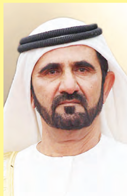
KEBAWAH Duli Yang Maha Mulia Paduka Seri Baginda Sultan Haji Hassanal Bolkiah Mu'izzaddin Waddaulah ibni Al-Marhum Sultan Haji Omar 'Ali Saifuddien Sa'adul Khairi Waddien, Sultan dan Yang Di-Pertuan Negara Brunei Darussalam telah berkenan menghantar titah-titah perutusan tahniah kepada Presiden Emiriah Arab Bersatu dan Pemerintah Abu Dhabi, Emiriah Arab Bersatu, His Highness Sheikh Khalifa bin Zayed Al Nahyan dan kepada Naib Presiden, Perdana Menteri, Pemerintah Dubai dan Menteri Pertahanan Emiriah Arab Bersatu, His Highness Sheikh Mohammed bin Rashid Al Maktoum dan kepada ahli kerabat diraja serta kerajaan dan rakyat Emiriah Arab Bersatu sempena menyambut Hari Kebangsaan Emiriah Arab Bersatu.

BANDAR SERI BEGAWAN , Ahad, 2 Disember. - Kebawah Duli Yang Maha Mulia Paduka Seri Baginda Sultan Haji Hassanal Bolkiah Mu'izzaddin Waddaulah ibni Al-Marhum Sultan Haji Omar 'Ali Saifuddien Sa'adul Khairi Waddien, Sultan dan Yang Di-Pertuan Negara Brunei