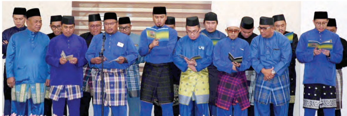
PERSEMBAHAN Dikir Maulud daripada pegawai-pegawai dan kakitangan Jabatan Imigresen dan Pendaftaran Kebangsaan (JIPK).

setiausaha Tetap dan Timbalan-timbalan Setiausaha Tetap KHEDN, ketua-ketua jabatan, pegawai-pegawai kanan KHEDN dan jabatan-jabatan di bawahnya, para pegawai dan kakitangan JIPK.