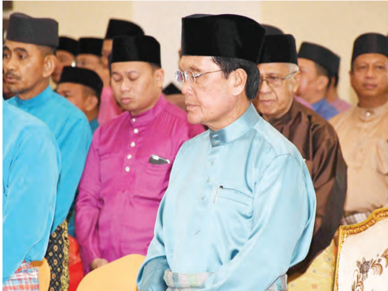
MENTERI Hal Ehwal Dalam Negeri, Yang Berhormat Pehin Orang Kaya Seri Kerna Dato Seri Setia (Dr.) Haji Awang Abu Bakar bin Haji Apong hadir selaku tetamu kehormat pada Majlis Sambutan Maulud Nabi Muhammad Sallallahu Alaihi Wasallam bagi Tahun 1440 Hijrah / 2018 Masihi di Dewan Masjid Suri Seri Begawan Raja Pengiran Anak Damit, Kampung Madang / Manggis.

Majlis kemudian diteruskan lagi dengan Persembahan Dikir Maulud daripada pegawai-pegawai dan kakitangan Jabatan