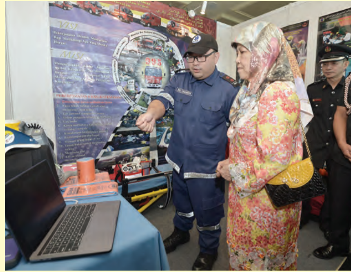
YANG Teramat Mulia Paduka Seri Pengiran Anak Puteri Hajah Masna binti Al-Marhum Sultan Haji Omar 'Ali Saifuddien Sa'adul Khairi Waddien, Ambassador-at-Large di Kementerian Hal Ehwal Luar Negeri, selaku Penaung Diraja Majlis Kebangsaan Keselamatan Jalan Raya berkenan menyampaikan Anugerah Penghargaan Sumbangan Program Keselamatan Jalan Raya kepada Syarikat-syarikat Swasta dan Agensi Berkepentingan, antaranya Brunei Shell Petroleum Sdn. Bhd.; Brunei Shell Marketing; Persatuan Insurans dan Takaful Brunei (BITA) dan Persatuan Motorsikal Darussalam (PEMODA). Sebelum berangkat meninggalkan majlis, YTM berkenan menyaksikan Pameran Keselamatan Jalan Raya dan dijunjung bergambar ramai bersama Ahli-ahli MKKJR 2018. Keberangkatan YTM ke majlis tersebut membuktikan komitmen YTM dalam mendukung segala inisiatif peningkatan keselamatan jalan raya di negara ini. Inisiatif Hari Memperingati Mangsa-mangsa Lalu Lintas Jalan Raya Sedunia memberikan peluang untuk menggariskan peranan pelbagai pihak yang terlibat seperti perkhidmatan perubatan dan kecemasan, penyelamat, sektor swasta, penyelidik dan akademia, juga masyarakat umum dalam menangani kesan dan akibat daripada kemalangan jalan raya. Pada tahun ini, Sambutan Hari Memperingati Mangsa-mangsa Lalu Lintas Jalan Raya Sedunia membawa tema "Roads Have Stories" atau "Jalan Raya Mempunyai Cerita", yang mana dapat difahami bahawa jalan raya membawa pelbagai cerita, yang ada kalanya menyedihkan, tetapi perlu untuk kita sama-sama mengambil iktibar daripadanya. Dalam kesempatan ini, MKKJR Negara Brunei Darussalam menyeru kepada semua pengguna jalan raya supaya meningkatkan kewaspadaan dengan memberikan tumpuan juga perhatian penuh ketika berada di jalan raya dan sentiasa mengamalkan sikap memandu yang berhemah. Pemandu berhemah sentiasa mementingkan keselamatan, baik sebelum memandu ataupun semasa memandu. Semasa berada di jalan raya, seseorang pemandu hendaklah sentiasa mengamalkan sikap yang baik bagi mengelakkan perkara-perkara yang tidak diingini berlaku.