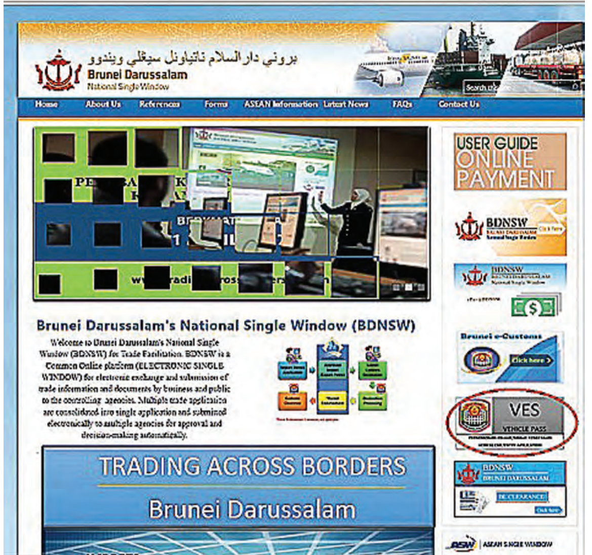
JABATAN Kastam dan Eksais Diraja memperkenalkan Sistem Maklumat Kenderaan Keluar / Masuk secara online (Vehicle Exit / Entry System) atau VES yang mana boleh didapati dengan melayari laman sesawang www.tradingacrossborders.gov.bn atau www.bdnsw.gov.bn .

Pemandu adalah dikehendaki untuk membawa bersama pas kenderaan yang lama (jika ada)