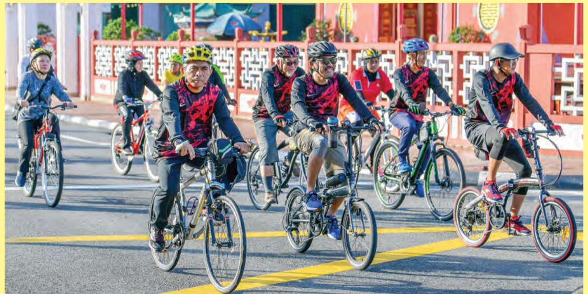
KEBAWAH Duli Yang Maha Mulia Paduka Seri Baginda Sultan dan Yang Di-Pertuan Negara Brunei Darussalam berkenan menandatangani The Brunei Book of Records (kiri), sementara gambar kanan, antara peserta yang ikut serta pada acara Kayuhan Basikal sejauh 11.5 kilometer mengelilingi Pusat Bandar sempena BDF 2018.