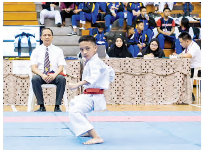
ANTARA peserta yang menyertai Kejohanan Terbuka Karate-do Shitokai Brunei 2018 (kiri dan kanan).

BERITA-BERITA HARIAN BOLEH DIKUTI DI LAMAN SESAWANG : www.pelitabrunei.gov.bn