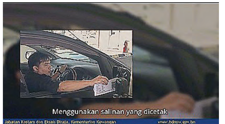
Menggunakan salinan yang dicetak

PEMILIK atau pemandu kenderaan boleh menyimpan pas kebenaran VES tersebut dalam format digital atau dicetak dan hendaklah sentiasa dibawa semasa pemeriksaan dan seterusnya untuk diimbas menggunakan mesin pengimbas yang disediakan di pos-pos kawalan (atas dan bawah).