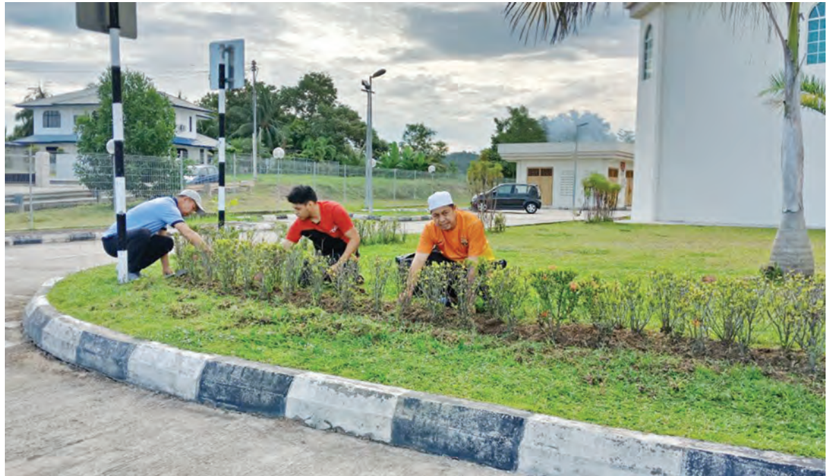
MENTERI Sumber-Sumber Utama dan Pelancongan, Yang Berhormat Dato Seri Setia Awang Haji Ali bin Haji Apong (kiri) yang juga selaku Penaung AJK Takmir Masjid Rashidah Sa'adatul Bolkiah, Kampung Sungai Akar menyertai Kempen Kebersihan membersihkan masjid tersebut bersama-sama takmir masjid yang lain.

SUNGAI AKAR , Ahad, 29 April. - Ahli Jawatankuasa (AJK) Takmir Masjid Rashidah Sa'adatul Bolkiah, Kampung Sungai Akar dengan kerjasama Ahli Muslimah masjid tersebut, penduduk Kampung Sungai Akar termasuk para sukarelawan bergotong-royong mengadakan Kempen Kebersihan di dalam dan luar masjid itu.