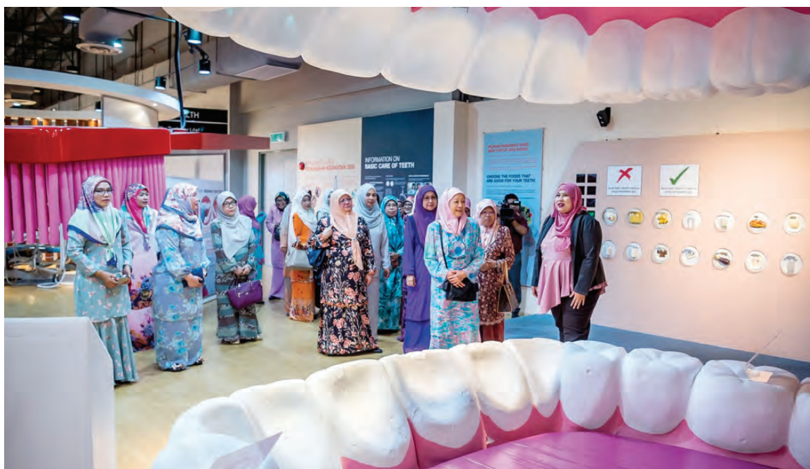
KUMPULAN Isteri Menteri-menteri Kabinet, Timbalan-timbalan Menteri, Setiausaha-setiausaha Tetap, Timbalan-timbalan Setiausaha Tetap dan Ahli-ahli Bersekutu (KI) semasa membuat lawatan ke Pusat Promosi Kesihatan, Kementerian Kesihatan, Jalan Commonwealth, Berakas.

Oleh : Dk. Vivy Malessa Pg. Ibrahim