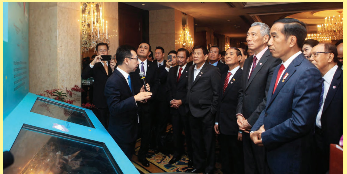
PERDANA Menteri Republik Singapura, Tuan Yang Terutama Lee Hsien Loong selaku Pengerusi ASEAN ketika memberi ucapan pembukaan bagi mengalu-alukan kehadiran Ketua-ketua Negara dan Kerajaan ASEAN ke Singapura (kiri), sementara gambar kanan, Kebawah Duli Yang Maha Mulia bersama-sama Ketua-ketua Negara dan Kerajaan ASEAN lainnya beredar ke pekarangan Island Ballroom bagi menyaksikan pameran 'Smart Nation Showcase'.