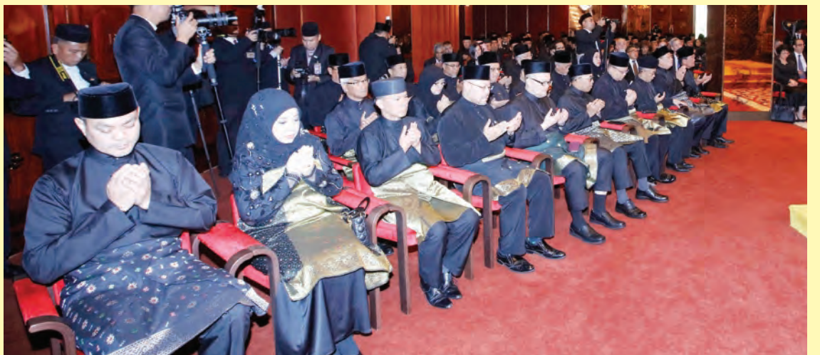
YANG Amat Mulia Pengiran-Pengiran Cheteria; Menteri-menteri Kabinet; Ahli-ahli Majlis Mesyuarat; Timbalan-timbalan Menteri; Pengiran-Pengiran Peranakan; Pehin-pehin Manteri; Manteri-manteri Pendalaman; Pesuruhjaya-pesuruhjaya Tinggi; Duta-duta Besar antara yang hadir pada Istiadat Pengurniaan Pingat tersebut yang berlangsung di Balai Singgahsana Indera Kenchana, Istana Nurul Iman.