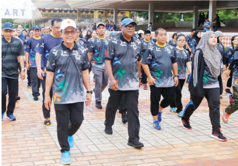
Oleh : Nooratini Haji Abas