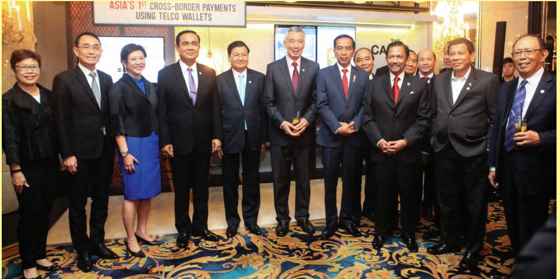
KEBAWAH Duli Yang Maha Mulia Paduka Seri Baginda Sultan Haji Hassanal Bolkiah Mu'izzaddin Waddaulah ibni Al-Marhum Sultan Haji Omar 'Ali Saifuddin Sa'adul Khairi Waddien, Sultan dan Yang Di-Pertuan Negara Brunei Darussalam berkenan bergambar bersama-sama Ketua-ketua Negara dan Kerajaan ASEAN lainnya pada pameran 'Smart Nation Showcase'.

Siaran Akhbar : Jabatan Perdana Menteri