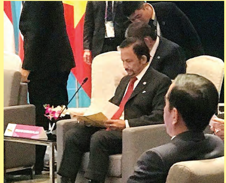
KEBAWAH Duli Yang Maha Mulia Paduka Seri Baginda Sultan Haji Hassanal Bolkiah Mu'izzaddin Waddaulah ibni Al-Marhum Sultan Haji Omar 'Ali Saifuddien Sa'adul Khairi Waddien, Sultan dan Yang Di-Pertuan Negara Brunei Darussalam berkenan berangkat menghadiri Sesi Retreat Sidang Kemuncak ASEAN Ke-32.

SINGAPURA, Sabtu, 28 April. - Kebawah Duli Yang Maha Mulia Paduka Seri Baginda Sultan Haji Hassanal Bolkiah Mu'izzaddin Waddaulah ibni Al-Marhum Sultan Haji Omar 'Ali Saifuddien Sa'adul Khairi Waddien, Sultan dan Yang Di-Pertuan Negara Brunei Darussalam hari ini berkenan berangkat menghadiri Sesi Retreat Sidang Kemuncak ASEAN Ke-32. Sesi berlangsung di Tower B Ballroom, Hotel Shangri-La, Republik Singapura. Sesi Retreat Sidang Kemuncak ASEAN Ke-32 turut dihadiri oleh Setiausaha Agung ASEAN, Tuan Yang Terutama Dato Paduka Lim Jock Hoi. Sesi Retreat itu dimulakan dengan ucapan pembukaan daripada Perdana Menteri Republik Singapura dan Pengerusi ASEAN, Tuan Yang Terutama Lee Hsien Loong