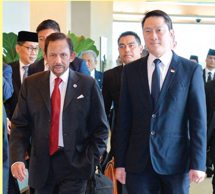
KEBAWAH Duli Yang Maha Mulia Paduka berkenan berangkat meninggalkan Republik Singapura selepas menghadiri Sidang Kemuncak ASEAN Ke-32.