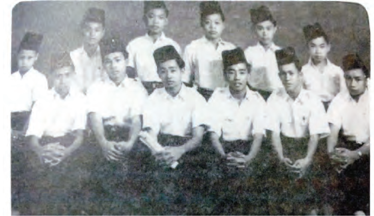
PENGHANTARAN anak tempatan keluar negara untuk melanjutkan pengajian dalam bidang ugama dalam tahun 50-an.

Masalah yang timbul sejak Brunei mula memasuki era moden di zaman pemerintahan Al-Marhum Sultan Haji Omar 'Ali Saifuddin Sa'adul Khairi Waddien ialah kekurangan man power (tenaga manusia) yang berkualiti untuk