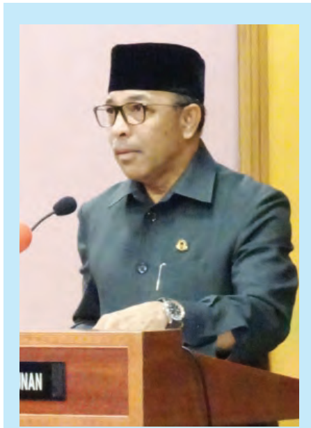
MENTERI Pembangunan, Yang Berhormat Dato Seri Paduka Awang Haji Suhaimi bin Haji Gafar semasa berucap pada Majlis Pelancaran Penambahan Hari Khamis Sebagai Hari Tanpa Beg Plastik pada Khamis, 3 Syaaban 1439 Hijrah bersamaan 19 April 2018 Masihi di Dewan Betabur, Kementerian Pembangunan.

Alhamdulillah, hari ini, 3 Syaaban 1439 Hijrah bersamaan dengan 19 April 2018 Masihi, inisiatif ini dapat diteruskan lagi dengan menambah hari Khamis sebagai Hari Tanpa Plastik menjadikan empat hari dalam seminggu tanpa beg plastik yang mana juga bersempena dengan Sambutan Hari Bumi 2018 yang bertemakan 'End Plastic Pollution' ataupun 'Akhiri