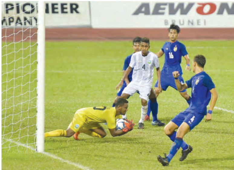
PENJAGA gawang pasukan Timor Leste berjaya menyelamatkan gawang pasukannya daripada dibolosi oleh para pemain pasukan Thailand.

Oleh : Ak. Syi'aruddin Pg. Daudin