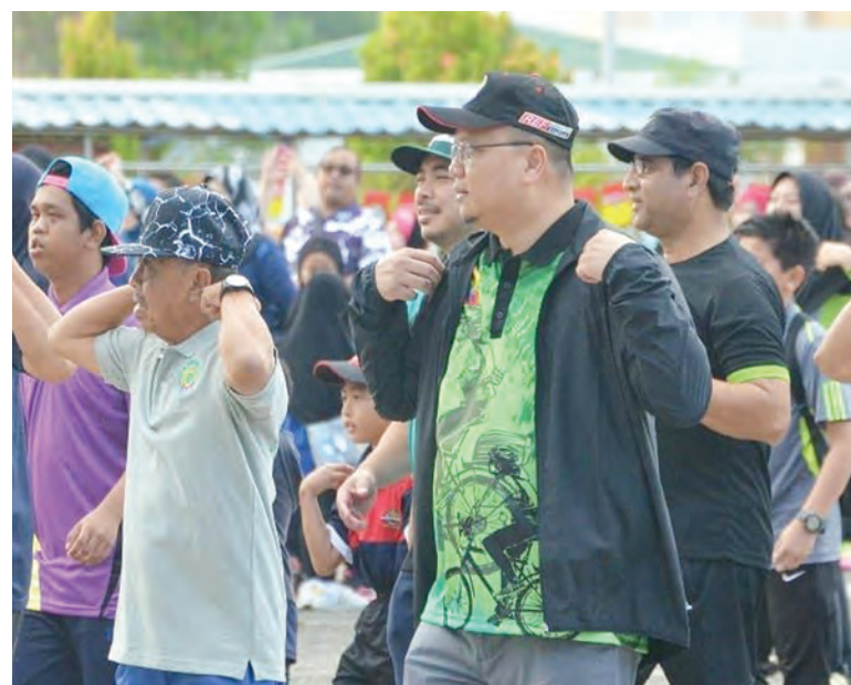
MENTERI Kesihatan, Yang Berhormat Dato Paduka Dr. Awang Haji Md. Isham bin Haji Jaafar semasa menyampaikan sijil penghargaan kepada salah seorang peserta pada Program Mukim Sihat bagi Mukim Mentiri (kiri). Sementara gambar kanan, Yang Berhormat Menteri Kesihatan ketika menyertai Program Mukim Sihat bagi Mukim Mentiri.