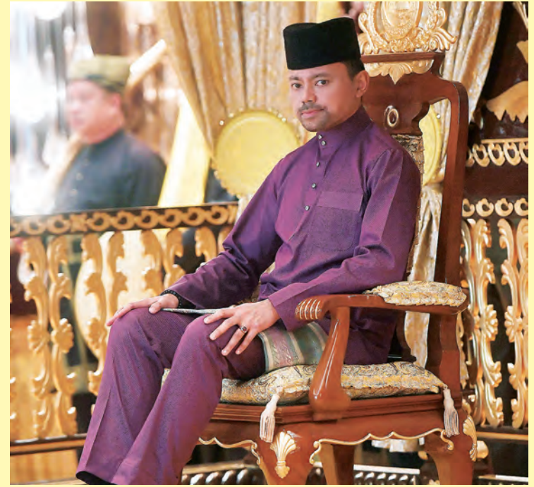
DULI Yang Teramat Mulia Paduka Seri Pengiran Muda Mahkota Pengiran Muda Haji Al-Muhtadee Billah ibni Kebawah Duli Yang Maha Mulia Paduka Seri Baginda Sultan Haji Hassanal Bolkiah Mu'izzaddin Waddaulah, Timbalan Sultan berkenan berangkat mengurniakan Pingat-pingat Kehormatan Negara, selaku Wakil Peribadi Kebawah Duli Yang Maha Mulia Paduka Seri Baginda Sultan dan Yang Di-Pertuan Negara Brunei Darussalam. Berangkat sama ialah Duli Yang Teramat Mulia Paduka Seri Pengiran Muda 'Abdul Malik.