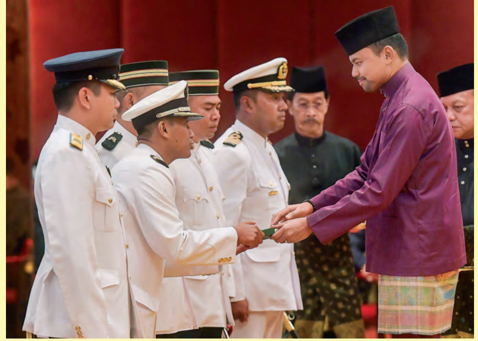
DULI Yang Teramat Mulia Paduka Seri Pengiran Muda Mahkota Pengiran Muda Haji Al-Muhtadee Billah berkenan mengurniakan Pingat-pingat Kehormatan Negara, iaitu Pingat Indah Kerja Baik (P.I.K.B) kepada para pegawai beruniform (atas kiri, atas kanan dan bawah kanan). Sementara gambar bawah kiri, Duli Yang Teramat Mulia berkenan mengurniakan Pingat Jasa Kebaktian (P.J.K) kepada para penerima wanita.