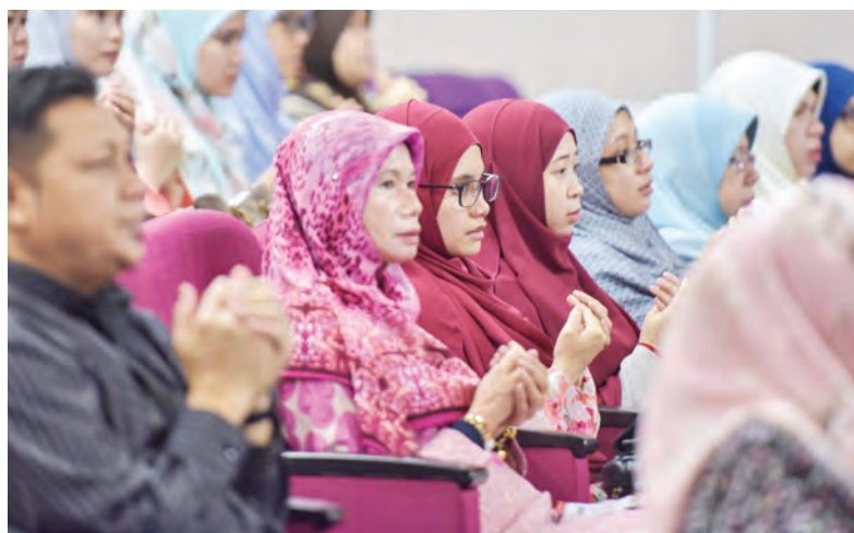
ANTARA peserta yang menyertai Program Perkampungan Sivik Lepas Ijazah Negara Brunei Darussalam Kali Pertama 2018.

Program itu telah dikendalikan sejak tahun 1976 ini bukan sahaja memfokuskan kepada lepasan ijazah seberang laut tetapi kini dilaratkan kepada lepasan ijazah tempatan yang belum bekerja atau yang berminat untuk menjadi pengusaha.