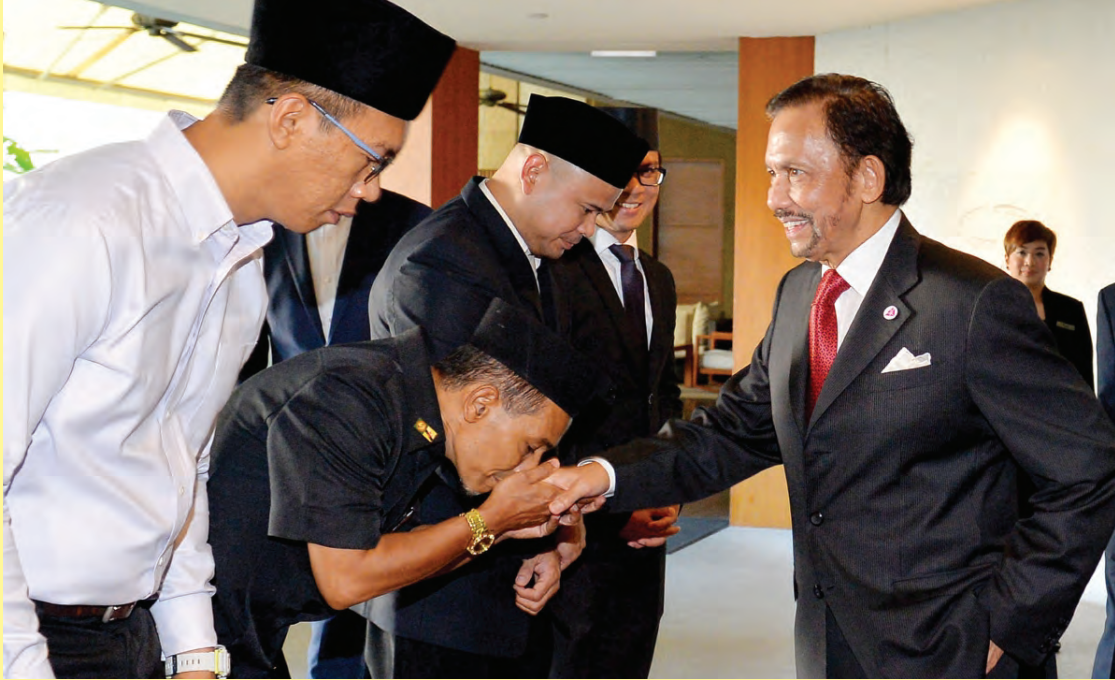
KEBAWAH Duli Yang Maha Mulia Paduka Seri Baginda Sultan Haji Hassanal Bolkiah Mu'izzaddin Waddaulah ibni Al-Marhum Sultan Haji Omar 'Ali Saifuddien Sa'adul Khairi Waddien, Sultan dan Yang Di-Pertuan Negara Brunei Darussalam berkenan menerima junjung ziarah sejurus sebelum berangkat meninggalkan hotel persemayaman baginda (atas), sementara gambar kanan, Kebawah Duli Yang Maha Mulia menadah tangan ketika Doa Selamat dibacakan oleh Mufti Kerajaan.