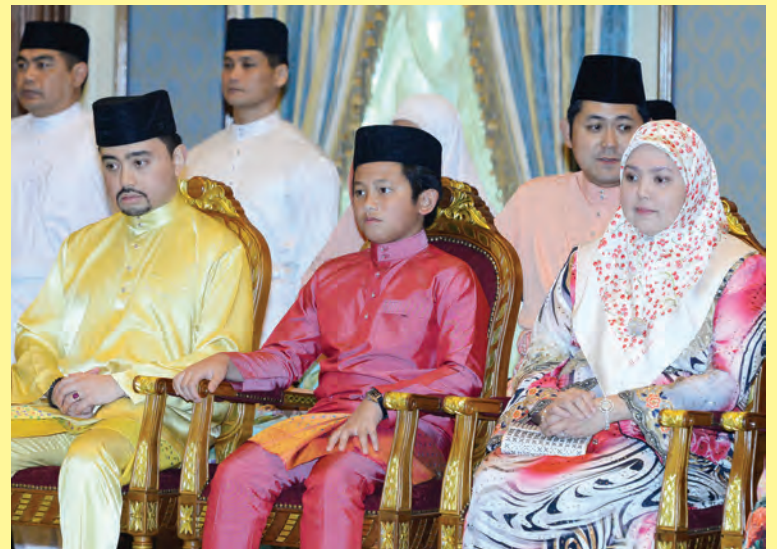
BERANGKAT sama, paduka-paduka anakanda dan adinda Kebawah DYMM, Duli Yang Teramat Mulia Paduka Seri Pengiran Muda Mahkota Pengiran Muda Haji Al-Muhtadee Billah dan Yang Teramat Mulia Paduka Seri Pengiran Anak Isteri Pengiran Anak Sarah; DYT Paduka Seri Pengiran Muda 'Abdul Malik; Duli Yang Teramat Mulia Paduka Seri Pengiran Muda 'Abdul Wakeel; DYT Paduka Seri Pengiran Perdana Wazir Sahibul Himmah Wal-Waqar Pengiran Muda Mohamed Bolkiah dan YTM Pengiran Anak Isteri Pengiran Anak Hajah Zariah dan YTM Paduka Seri Pengiran Anak Puteri Hajah Rashidah Sa'adatul Bolkiah.