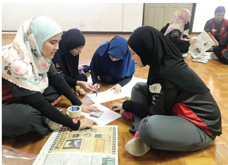
ANTARA aktiviti Program Team Building Perkampungan Sivik diadakan bagi para mahasiswa dan mahasiswi lepasan ijazah.

memberikan ruang untuk berbincang dan memahami keperluan semasa bagi kemajuan bangsa dan negara dalam pelbagai bidang.