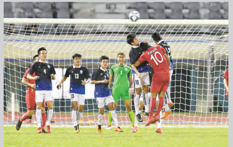
AKSI perlawanan di antara pasukan Kemboja dan pasukan Lao PDR pada HBT 2018.

Oleh : Haniza Abdul Latif Foto : Mohamad Azmi Awang Damit, Hamzah Mohidin