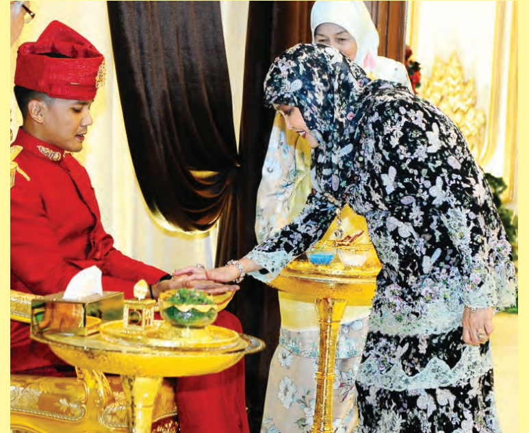
KEBAWAH Duli Yang Maha Mulia Paduka Seri Baginda Raja Isteri Pengiran Anak Hajah Saleha berkenan menculiki bedak kepada Yang Amat Mulia Pengiran Anak Haji Mohammed Saifullah.