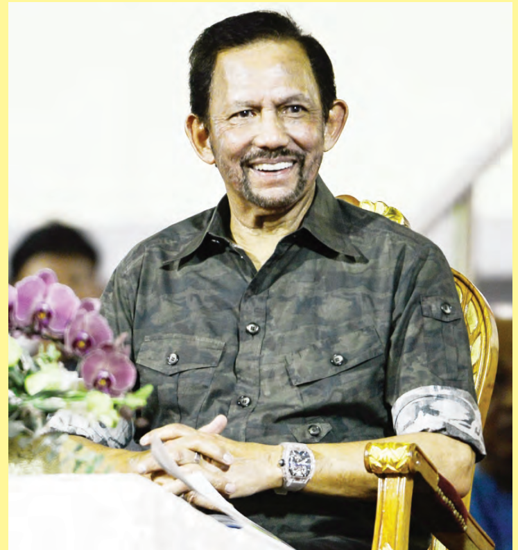
KEBAWAH Duli Yang Maha Mulia Paduka Seri Baginda Sultan Haji Hassanal Bolkiah Mu'izzaddin Waddaulah ibni Al-Marhum Sultan Haji Omar 'Ali Saifuddien Sa'adul Khairi Waddien, Sultan dan Yang Di-Pertuan Negara Brunei Darussalam berkenan berangkat pada Perlawanan Pembukaan Piala Hassanal Bolkiah Kejohanan Bola Sepak Bagi Belia ASEAN 2018 (HBT 2018). Berangkat sama ialah paduka-paduka adinda baginda, Duli Yang Teramat Mulia Paduka Seri Pengiran Bendahara Seri Maharaja Permaisura Pengiran Muda Haji Sufri Bolkiah, Presiden Persatuan Bola Sepak Kebangsaan Brunei Darussalam, selaku Penasihat Jawatankuasa Tertinggi HBT 2018 dan Duli Yang Teramat Mulia Paduka Seri Pengiran Digadong Sahibul Mal Pengiran Muda Haji Jefri Bolkiah.