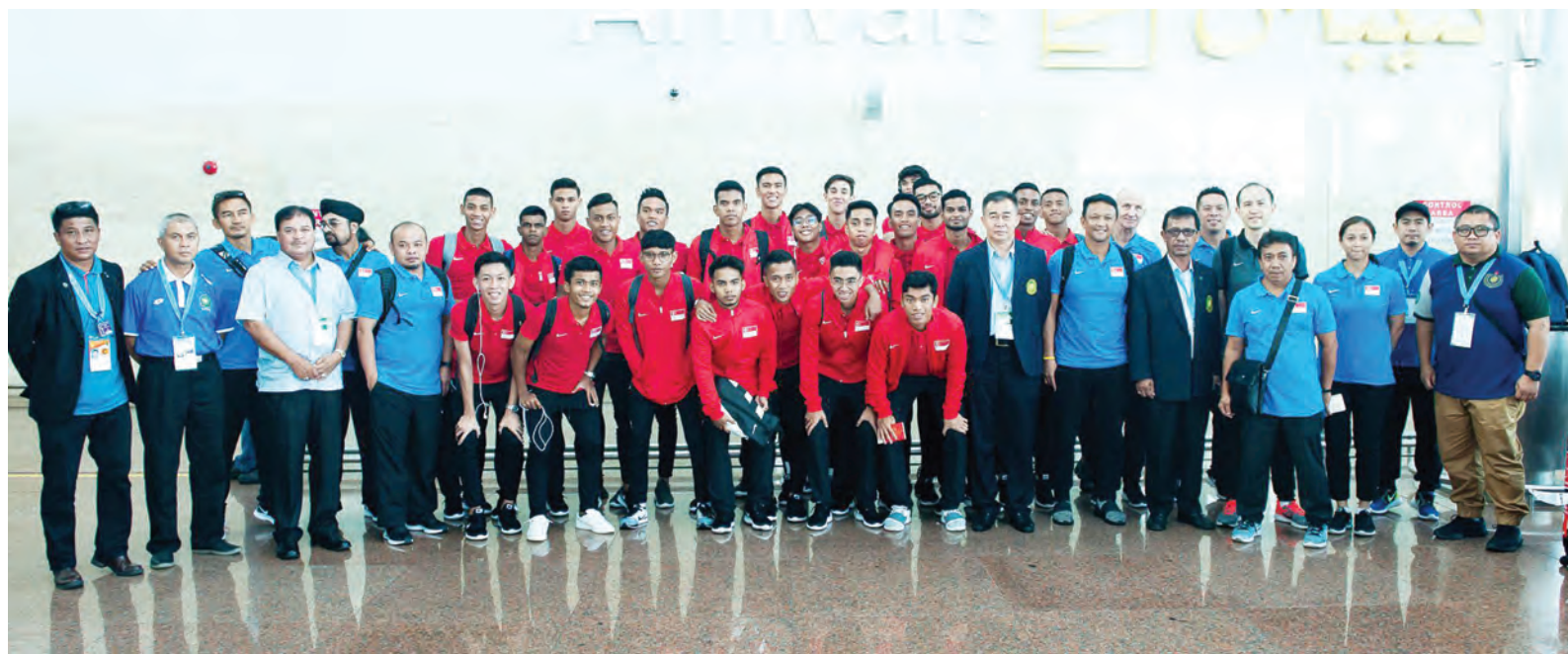
KETIBAAN pasukan bola sepak Singapura (atas) dan pasukan Kemboja (bawah) di ruang ketibaan Lapangan Terbang Antarabangsa Brunei dialu-alukan oleh para pegawai dari Kementerian Kebudayaan, Belia dan Sukan (KKBS) dan Persatuan Bola Sepak Kebangsaan Brunei Darussalam (NFABD).