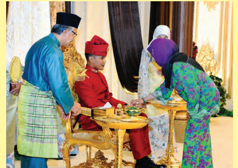
YANG Teramat Mulia Pengiran Anak Isteri Pengiran Anak Hajah Zariah berkenan menculiki bedak kepada Yang Amat Mulia Pengiran Anak Haji Mohammed Saifullah.

YANG Teramat Mulia Paduka Seri Pengiran Anak Puteri Hajah Masna dan Yang Teramat Mulia Paduka Seri Pengiran Anak Puteri Hajah Amal Umi Kalthum Al-Islam, bonda Yang Amat Mulia Pengiran Anak Haji Mohammed Saifullah berkenan menculiki bedak pada majlis berkenaan (kanan dan kanan sekali).