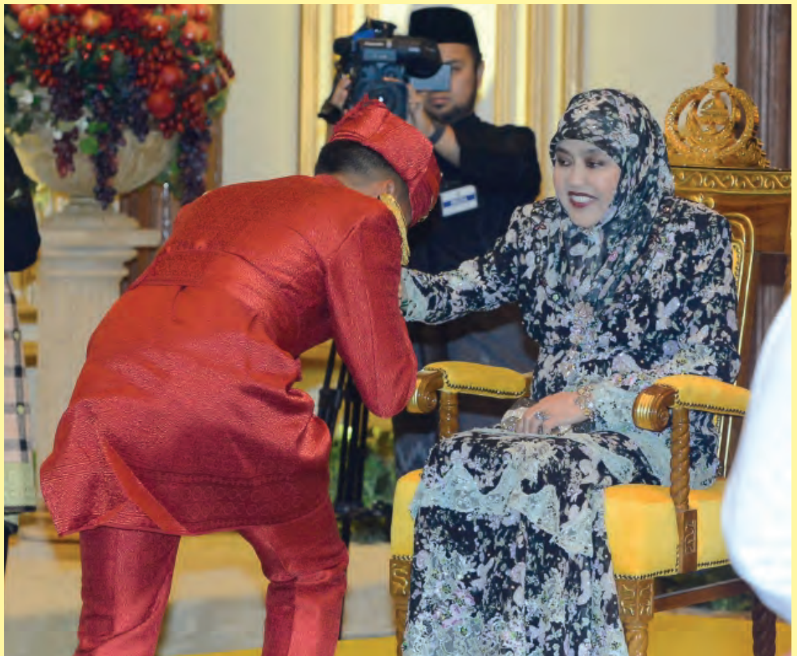
KEBAWAH Duli Yang Maha Mulia Paduka Seri Baginda Raja Isteri berkenan menerima junjung ziarah daripada Yang Amat Mulia Pengiran Anak Haji Mohammed Saifullah bin Pengiran Indera Setia Diraja Sahibul Karib Pengiran Anak Haji Idris.

Juga berangkat dan hadir ialah Yang Amat Mulia Pengiran-Pengiran Cheteria, Menteri-menteri Kabinet, Timbalan-timbalan Menteri, Setiausaha-setiausaha Tetap, Timbalan-timbalan Setiausaha Tetap, pegawai-pegawai kanan kerajaan dan ahli-ahli keluarga.