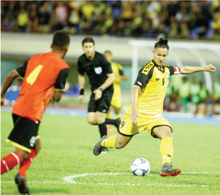
AKSI Faiq Jefri Bolkiah pada perlawanan di antara pasukan Negara Brunei Darussalam menentang pasukan Timor Leste.