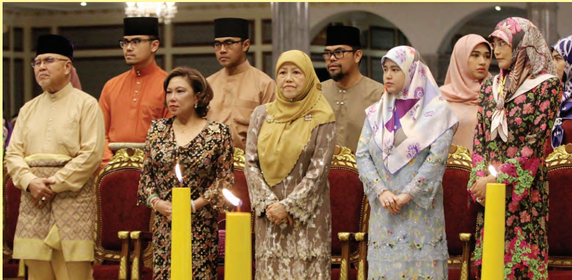
BERANGKAT sama ialah Yang Teramat Mulia Paduka Seri Pengiran Anak Puteri Hajah Majeedah Nuurul Bolkiah; Yang Teramat Mulia Paduka Seri Pengiran Anak Puteri Hajah Hafizah Sururul Bolkiah; Yang Teramat Mulia Paduka Seri Pengiran Anak Puteri Hajah Masna; Yang Teramat Mulia Paduka Seri Pengiran Anak Puteri Hajah Amal Rakiah serta kerabat diraja yang lain.