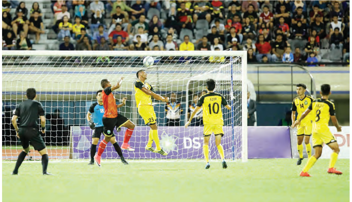
PEMAIN negara ketika cuba menghalang bola dari masuk ke kawasan gawang.

Oleh: Ak. Syi'aruddin Pg. Daudin