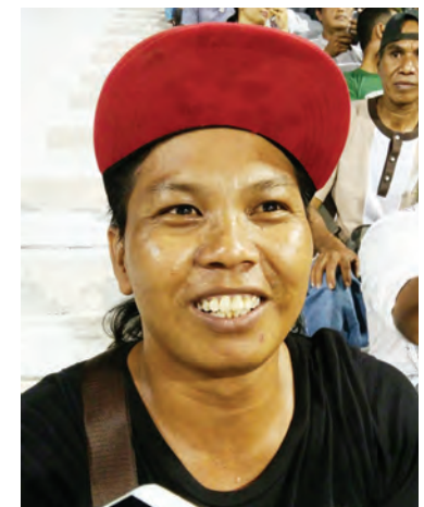
BAGO Man yang berasal dari Lombok, Indonesia mewakili penyokong pasukan Timor Leste.

memberikan sokongan dan kata-kata semangat.