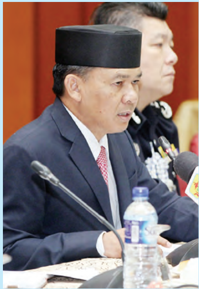
MENTERI Kebudayaan, Belia dan Sukan, Yang Berhormat Mejar Jeneral (B) Dato Paduka Seri Awang Haji Aminuddin Ihsan bin Pehin Orang Kaya Saiful Mulok Dato Seri Paduka Haji Abidin semasa menyampaikan ucapan mukadimah pada Mesyuarat Jawatankuasa Tertinggi Ke-2 Sambutan Hari Keluarga Kebangsaan (HKK) Kali Ke-7 / 2018 pada Isnin, 29 Rejab 1439 Hijrah bersamaan 16 April 2018 Masihi di Dewan Digadong, Kementerian Kebudayaan, Belia dan Sukan.

Kita menyedari bahawa program-program kekeluargaan yang dilaksanakan tidak sepatutnya hanya tertumpu kepada memeriahkan sambutan, malah apa yang lebih penting ialah bagi mencapai matlamat-matlamat yang telah dipersetujui dari awal pengisytiharan HKK pada tahun 2012. Dalam hubungan