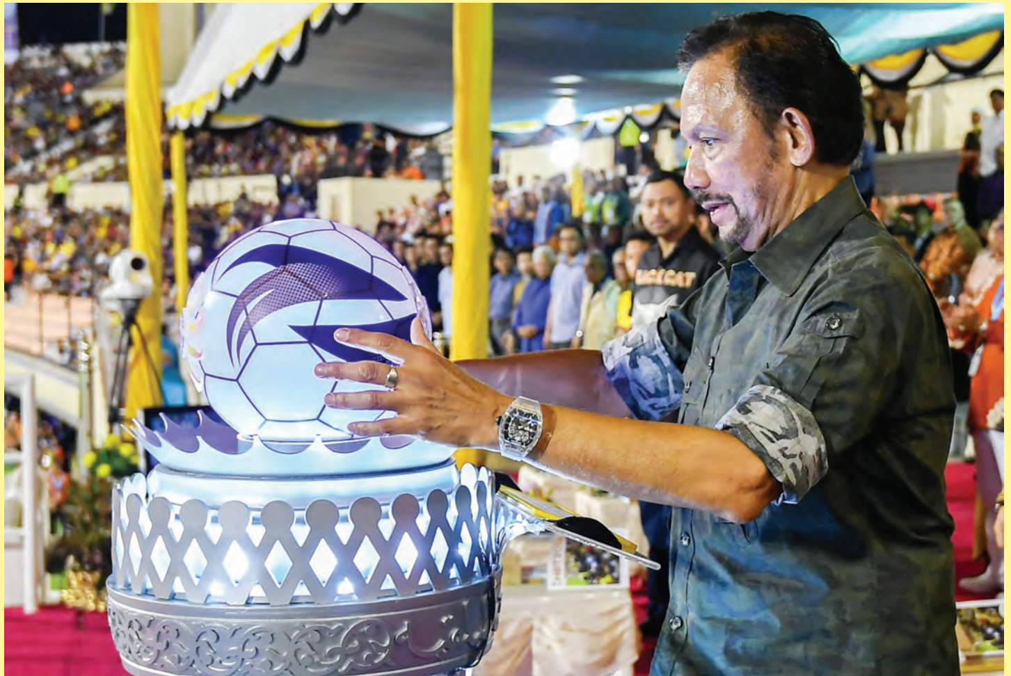
KEBAWAH Duli Yang Maha Mulia Paduka Seri Baginda Sultan Haji Hassanal Bolkiah Mu'izzaddin Waddaulah ibni Al-Marhum Sultan Haji Omar 'Ali Saifuddien Sa'adul Khairi Waddien, Sultan dan Yang Di-Pertuan Negara Brunei Darussalam berkenan berangkat merasmikan Piala Hassanal Bolkiah Kejohanan Bola Sepak bagi Belia ASEAN 2018. (Lihat muka 3, 12 dan 13).