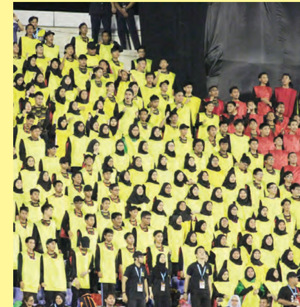
ANTARA peserta gabungan penuntut-penuntut dari 11 buah sekolah menengah serta pegawai dan kakitangan kerajaan pada persembahan Human LED (kiri), sementara gambar kanan, antara penyokong pasukan negara pada perlawanan tersebut.