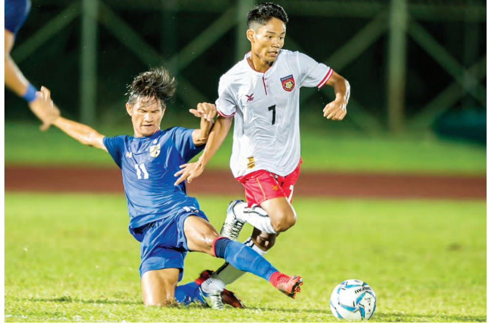
PEMAIN Thailand (kiri) cuba menghalang gerakan pemain Myanmar.