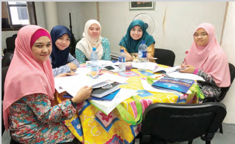
ANTARA peserta Bengkel Penulisan Cerpen anjuran Dewan Bahasa dan Pustaka.

Ia juga diharap dapat memberi peluang kepada para peserta bertukar-tukar fikiran, berkongsi pengalaman serta mengemukakan usul atau cadangan demi meningkatkan citra sastra tanah air serta menggalakkan para peserta mencurahkan idea dan perasaan menerusi wadah penulisan kreatif.