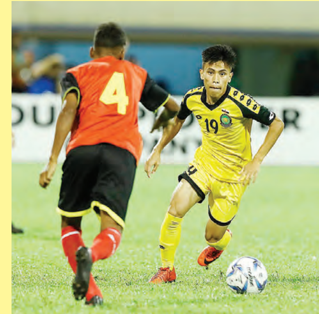
ANTARA aksi yang dipamerkan oleh pasukan Negara Brunei Darussalam menentang pasukan Timor Leste pada HBT 2018.