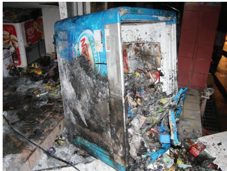
KEROSAKAN sistem pendawaian elektrik bagi kegunaan alat peti sejuk aiskrim dipercayai menjadi punca kebakaran.

dan Penyelamat antara lain menyarankan agar penggunaan elektrik tidak mencapai tahap lebih bebanan dan pastikan menutup