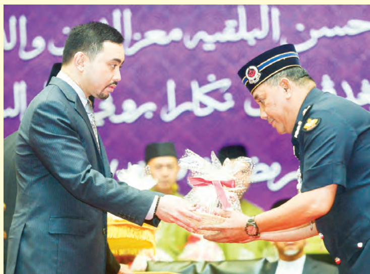
DYTM berkenan menyempurnakan pengagihhan Kurma Kurnia Peribadi Kebawah DYMM kepada wakil jabatan Pasukan Polis Diraja Brunei.

DULI Yang Teramat Mulia Paduka Seri Pengiran Muda 'Abdul Malik ibni Kebawah Duli Yang Maha Mulia Paduka Seri Baginda Sultan Haji Hassanal Bolkhiah Mu'izzaddin Waddaulah, Pengerusi Jemaah Tadbir Yayasan Sultan Haji Hassanal Bolkhiah (YSHHB) berkenan berangkat ke Majlis Pelancaran Pengagihhan Kurma Kurnia Peribadi Kebawah Duli Yang Maha Mulia Paduka Seri Baginda Sultan Haji Hassanal Bolkhiah Mu'izzaddin Waddaulah, Sultan dan Yang Di-Pertuan Negara Brunei Darussalam sempena bulan Ramadan 1439 Hijrah / 2018 Masihi (kiri). Manakala gambar kanan, Duli Yang Teramat Mulia berkenan mengurniakan sabda pada majlis tersebut.