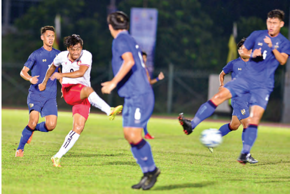
PEMAIN Myanmar melepaskan rembatan ke gawang Thailand pada aksi Kumpulan 'A' Piala Hassanal Bolkiah (HBT) Kejujutan Bola Sepak bagi Belia ASEAN 2018.