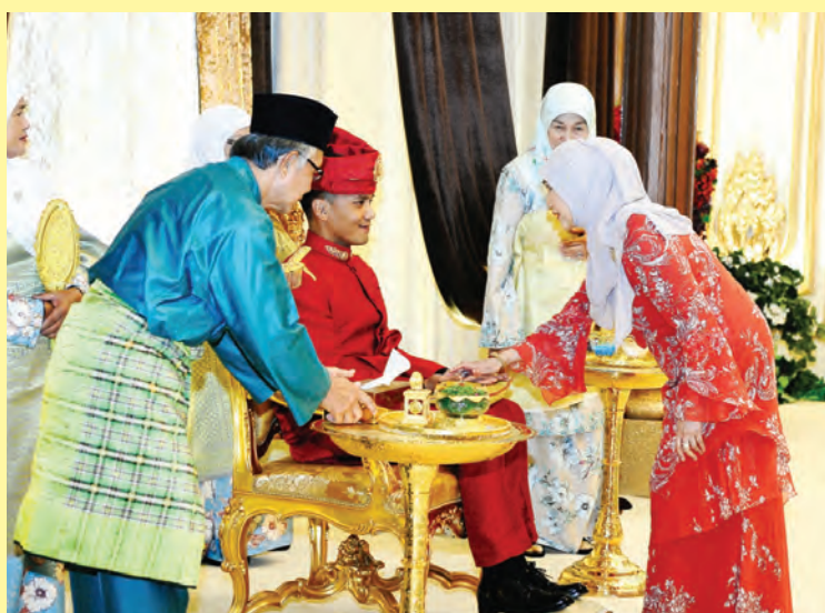
YANG Teramat Mulia Paduka Seri Pengiran Anak Puteri Hajah Amal Nasibah dan ayahanda Yang Amat Mulia Pengiran Anak Haji Mohammed Saifullah, Yang Amat Mulia Pengiran Indera Setia Diraja Sahibul Karib Pengiran Anak Haji Idris berkenan menculiki bedak pada Majlis Berbedak tersebut.