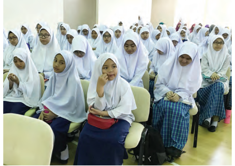
ANTARA pelajar yang hadir pada majlis tersebut.

Majlis yang buat julung kalinya diadakan ini turut diisikan dengan