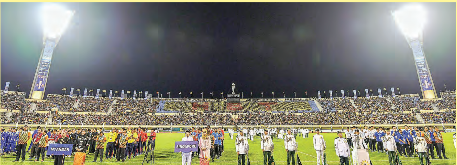
SUASANA warna-warni pada Perasmian HBT 2018.