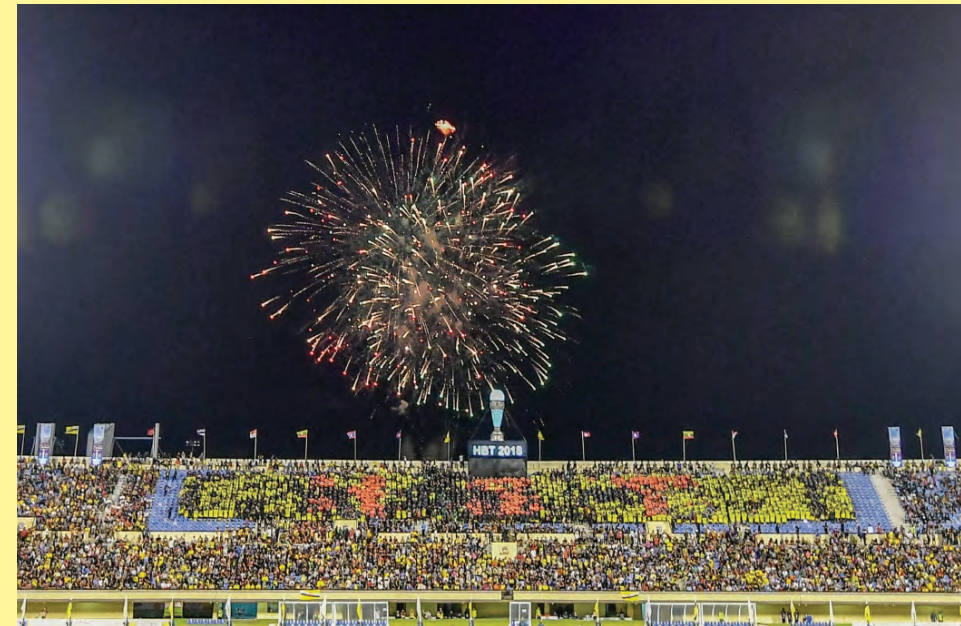
WARNA-WARNI mercun menyemarakkan lagi kemeriahan di Stadium Negara Hassanal Bolkiah, Berakas.