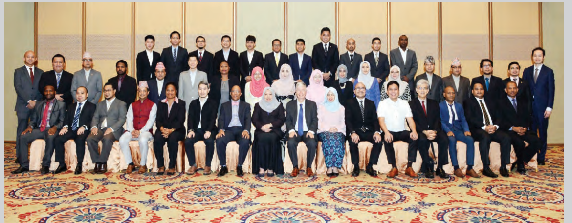
PARA peserta yang menghadiri Kursus SEACEN mengenai Risiko Teknologi Maklumat dan Komunikasi (ICT) di Bank semasa bergambar ramai.