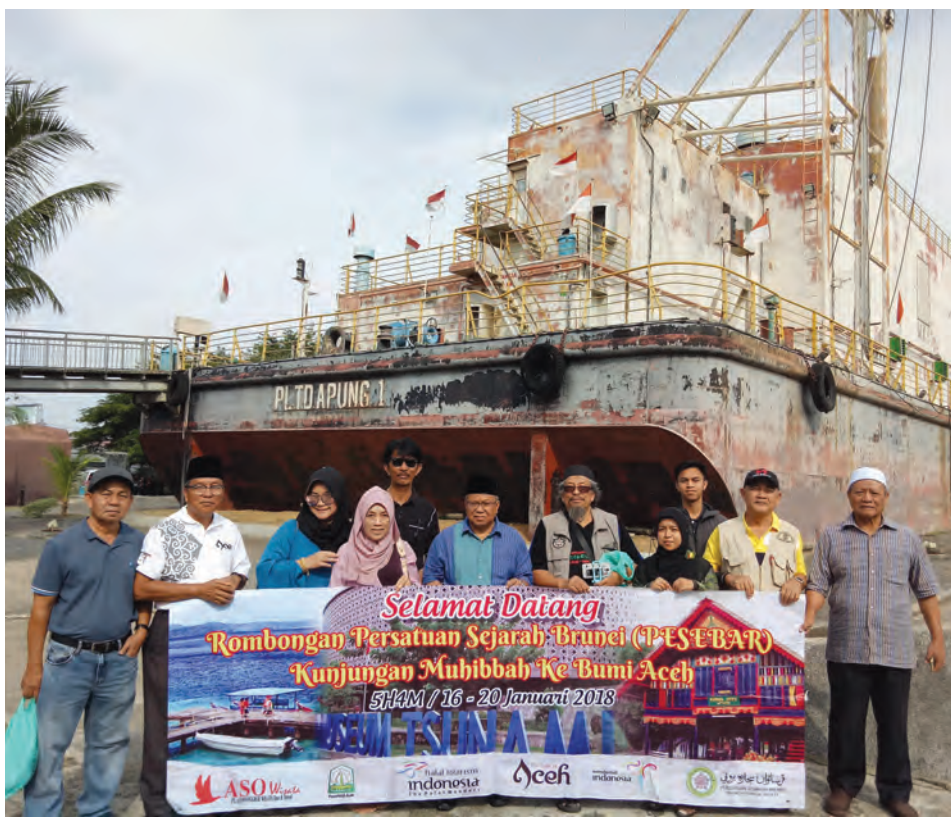
ROMBONGAN penulis bergambar kenangan di depan Kapal PLTD yang seberat 2,600 tan terdampar di daratan.