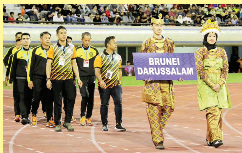
BARISAN lalu pasukan Negara Brunei Darussalam.

YANG Teramat Mulia Paduka Seri Pengiran Anak Isteri Pengiran Anak Sarah binti Pengiran Haji Salleh Ab. Rahman bersama paduka-paduka anakanda Yang Teramat Mulia, Yang Teramat Mulia Pengiran Muda 'Abdul Muntagim dan Yang Teramat Mulia Pengiran Anak Muneerah Madhul Bolkiah turut berangkat menyaksikan kejuhanan tersebut.