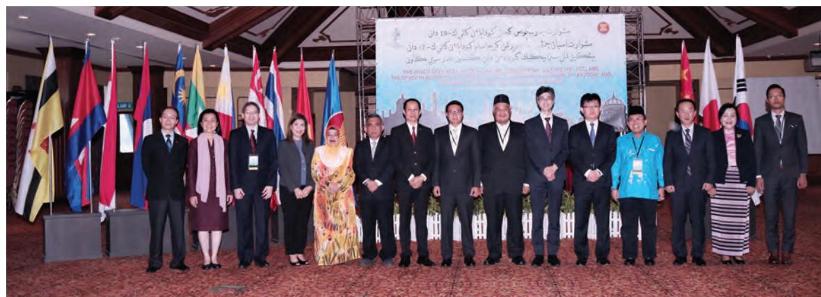
SESI bergambar ramai wakil-wakil Mesyuarat Ke-19 ASEAN-COCI Sub-Committee on Culture (SCC) dan Mesyuarat Ke-7 ASEAN Plus Three Cultural Cooperation Network (APTCCN).