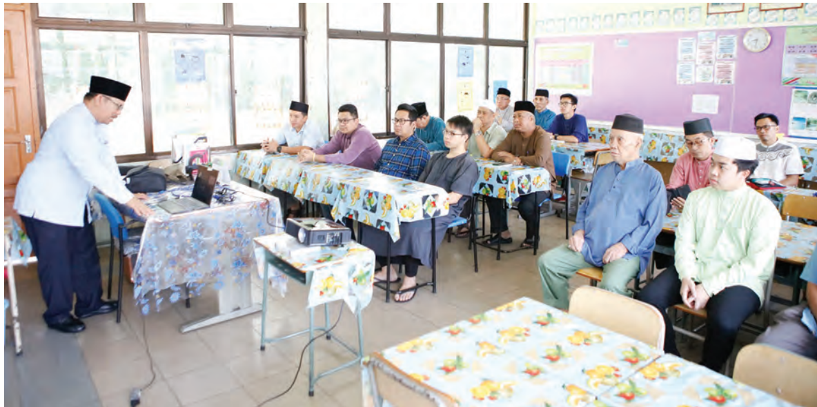
SEBAHAGIAN daripada bakal jemaah haji Daerah Brunei dan Muara yang menghadiri Kursus Ibadat Haji.