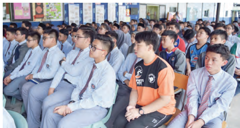
PENUNTOT Sekolah Menengah Seri Mulia Sarjana mendengar taklimat berkenaan.

kalangan penuntut-penuntut, dalam sama-sama menghayati fungsi dan tujuan ASEAN ditubuhkan, dalam masa yang sama mengukuhkan hubungan antara Jabatan Penerangan dengan masyarakat, khususnya penuntut-penuntut di Negara Brunei Darussalam.