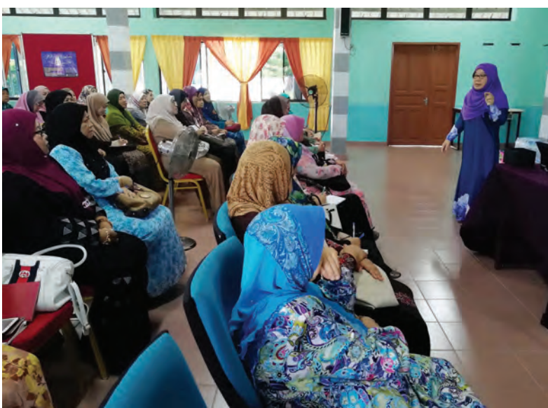
KURSUS Ibadat Haji bagi peserta perempuan diadakan di Dewan Sekolah Ugama Pengiran Anak Puteri Norain, Pekan Tutong.

Bakal jemaah haji diberi peluang untuk mengajukan persoalan berkaitan dengan Manasik Haji kepada pengkursus-pengkursus di luar daripada pusat kursus sekiranya diperlukan untuk