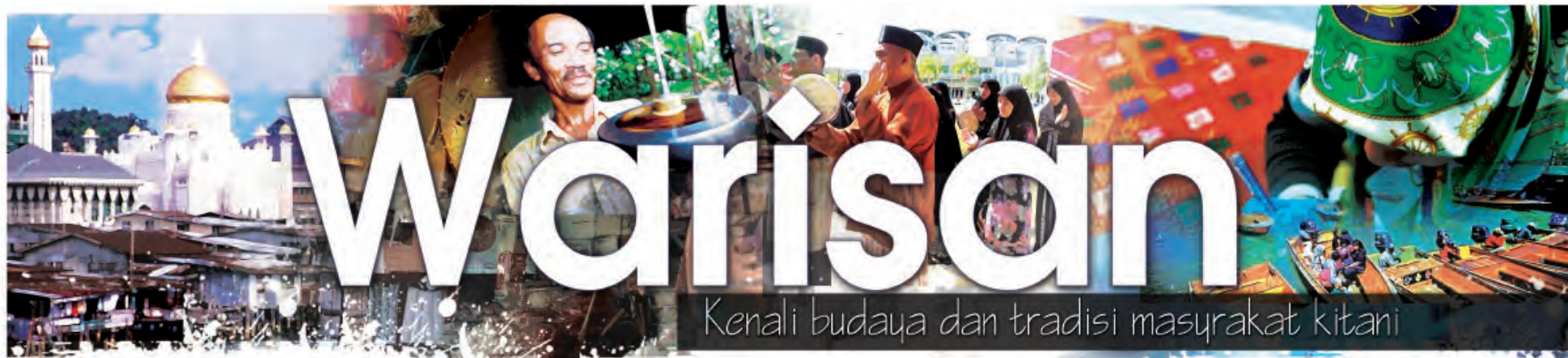
Oleh dan Foto : Dk. Siti Redzaimi Pg. Haji Ahmad