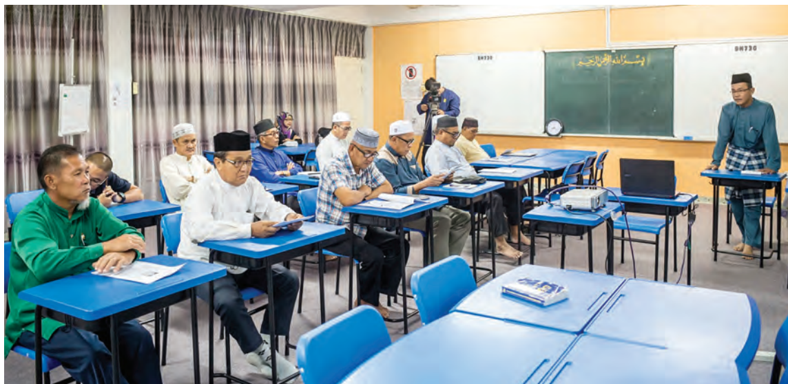
PARA jemaah lelaki semasa mengikuti Kursus Ibadat Haji bagi Musim Haji Tahun 1439H / 2018M bagi Daerah Temburong bertempat di Sekolah Persediaan Arab, Pekan Bangar.

Menerusi kursus ini juga, bakal jemaah haji ditekankan tentang perlunya mematuhi peraturan yang dikuatkuasakan oleh pihak Kerajaan Arab Saudi demi kebajikan dan kebaikan bersama.