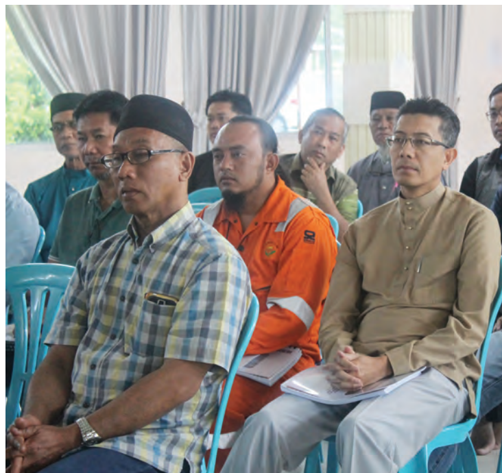
SEBAHAGIAN bakal jemaah haji lelaki yang hadir pada Kursus Ibadah Haji Bagi Musim Haji Tahun 1439H / 2018M bagi Daerah Belait diadakan di Sekolah Agama Pengiran Anak Puteri Rashidah Sa'adatul Bolkiah di Pekan Seria.

Berita dan Foto : Noraisah Haji Muhammed