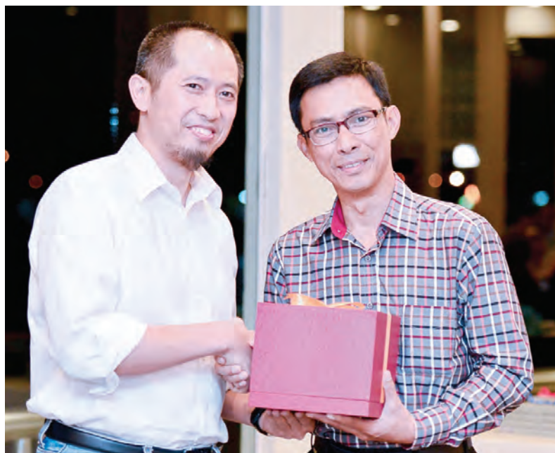
TIMBALAN Setiausaha Tetap Kementerian Perhubungan menyampaikan cenderahati kepada wakil delegasi yang menghadiri mesyuarat berkenaan.

(ARISE) selaku rakan Dialog ASEAN, AFFA dan ATF.