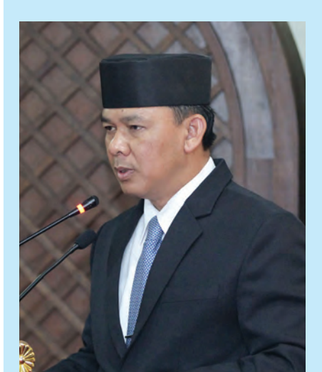
MENTERI Kebudayaan, Belia dan Sukan, Yang Berhormat Mejar Jeneral (B) Dato Paduka Seri Awang Haji Aminuddin Ihsan bin Pehin Orang Kaya Saiful Mulok Dato Seri Paduka Haji Abidin dalam sembah alu-aluan pada Majlis Penyerahan Bendera Negara kepada Kontinjen Negara Brunei Darussalam ke Sukan Komanwel Kali Ke-21 Gold Coast, Australia pada 4 hingga 15 April 2018 pada Sabtu, 6 Rejab 1439 Hijrah / 24 Mac 2018 Masihi di Bilik Hijau Stadium Negara Hassanal Bolkiah, Berakas.

Terlebih dahulu, izinkan peramba / saya dan bagi pihak Kementerian Kebudayaan, Belia dan Sukan serta Kontinjen Negara Brunei Darussalam