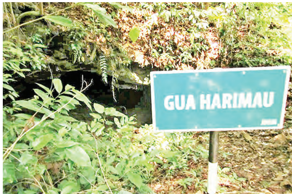
INILAH lagenda bersejarah Kampung Kapok iaitu kisah Gua Harimau.

Di bawah pentadbiran ketua kampung sekarang, kampung ini dibahagikan kepada tiga bahagian, iaitu Kapok Kanan, Kapok Kiri dan Meragang, Pengalayan dan Bukit Kebun. Pembahagian ini adalah bertujuan untuk memudahkan pengendalian dalam pentadbiran ketua kampung merancang dan membuat aktiviti-aktiviti kampung.