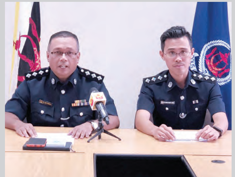
PASUKAN Polis Diraja Brunei semasa mengadakan sidang media mengenai seorang lelaki ditemui mati selepas dipercayai menggantung diri di dalam sebuah bilik kosong.

Siaran Akhbar dan Foto : Pasukan Polis Diraja Brunei