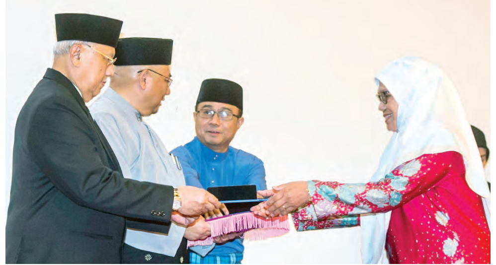
MENTERI di Jabatan Perdana Menteri (JPM), Yang Berhormat Dato Seri Paduka Awang Haji Abdul Mokti bin Haji Mohd. Daud menyampaikan Sijil Persaraan kepada para pesara warga JPM dan jabatan-jabatan di bawahnya bagi Tahun 2015 - 2017 (kiri dan kanan).