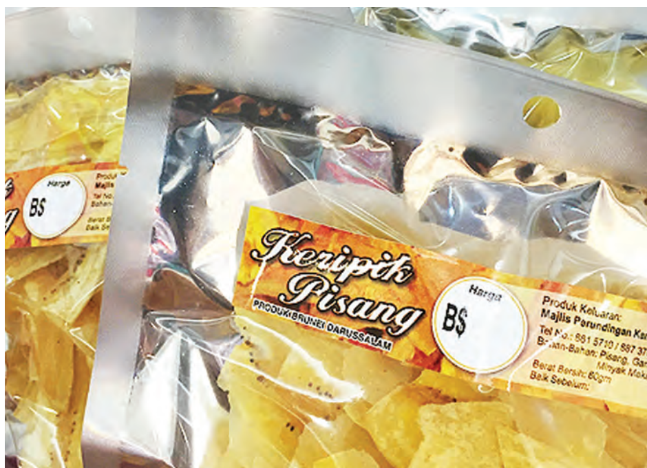
PRODUK keripik pisang rangup dan sedap merupakan produk terkenal di Kampung Kapok.

MPK Kapok menggunakan kaedah perniagaan secara dalam talian melalui Facebook dan sebagainya dengan menghasilkan kerepek pisang sehingga mereka berjaya menghasilkan lima perisa kerepek pisang merangkumi perisa kopi, pandan, milo, jagung dan durian dan pada tahun 2016, MPK Kapok menambah lagi dua perisa baharu, iaitu strawberi dan nangka. Selain itu, MPK Kapok juga menghasilkan agar-agar kering, kuih cacah, bahu dan sebagainya yang juga menjadi tarikan pelancong untuk dijadikan buah tangan.