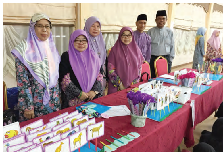
ANTARA bahan-bahan pameran yang mengisikan Program Hayya Ilal Arabiah.