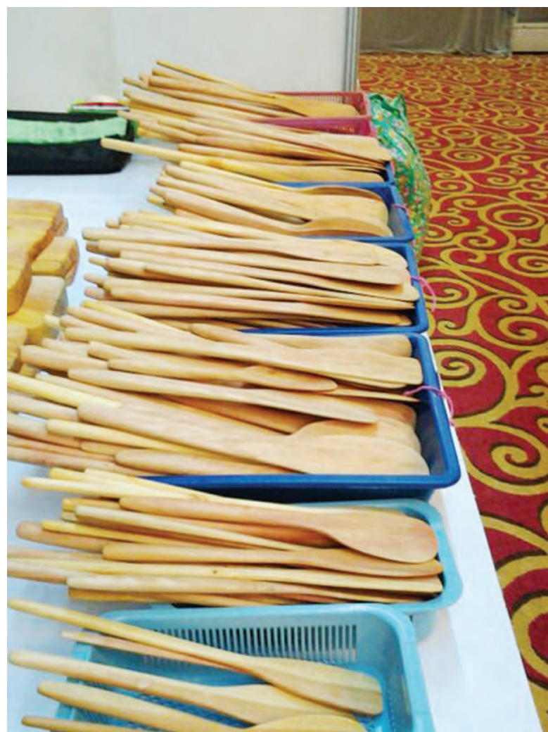
GEGAWI-GEGAWI yang dijual semasa menyertai Ekspo China-ASEAN (CAEXPO) di Nanning, Republik Rakyat China tahun lalu (kiri dan atas).

Apa yang pasti, kita perlu harga produk tempatan kerana ia sebenarnya berfungsi menunjukkan identiti kita sebagai rakyat Brunei yang ada nilai sentimental tersendiri.