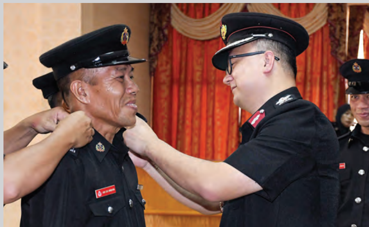
TIMBALAN Pengarah Bomba dan Penyelamat, Awang Lim Hock Guan semasa menyempurnakan penyampaian tanda pangkat pada majlis tersebut.

Juga hadir ialah penolong-penolong pengarah, pegawai-pegawai kanan, pegawai-pegawai, anggota dan kakitangan dari JBP serta ahli-ahli keluarga penolong-penolong pegawai yang diraikan.