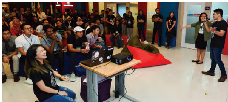
ANTARA pengusaha belia yang menyertai Startup Weekend.

Di samping itu, mempromosikan, meningkatkan dan memajukan kerjasama antara ASEAN di bawah arahan dan kelulusan Menteri-Menteri Bertanggungjawab untuk Kebudayaan dan Kesenian (AMCA), Mesyuarat Pegawai-Pegawai Kanan yang Bertanggungjawab bagi Kebudayaan dan Kesenian (SOMCA) dan Jawatankuasa ASEAN mengenai Kebudayaan dan Penerangan (ASEAN-COCI).