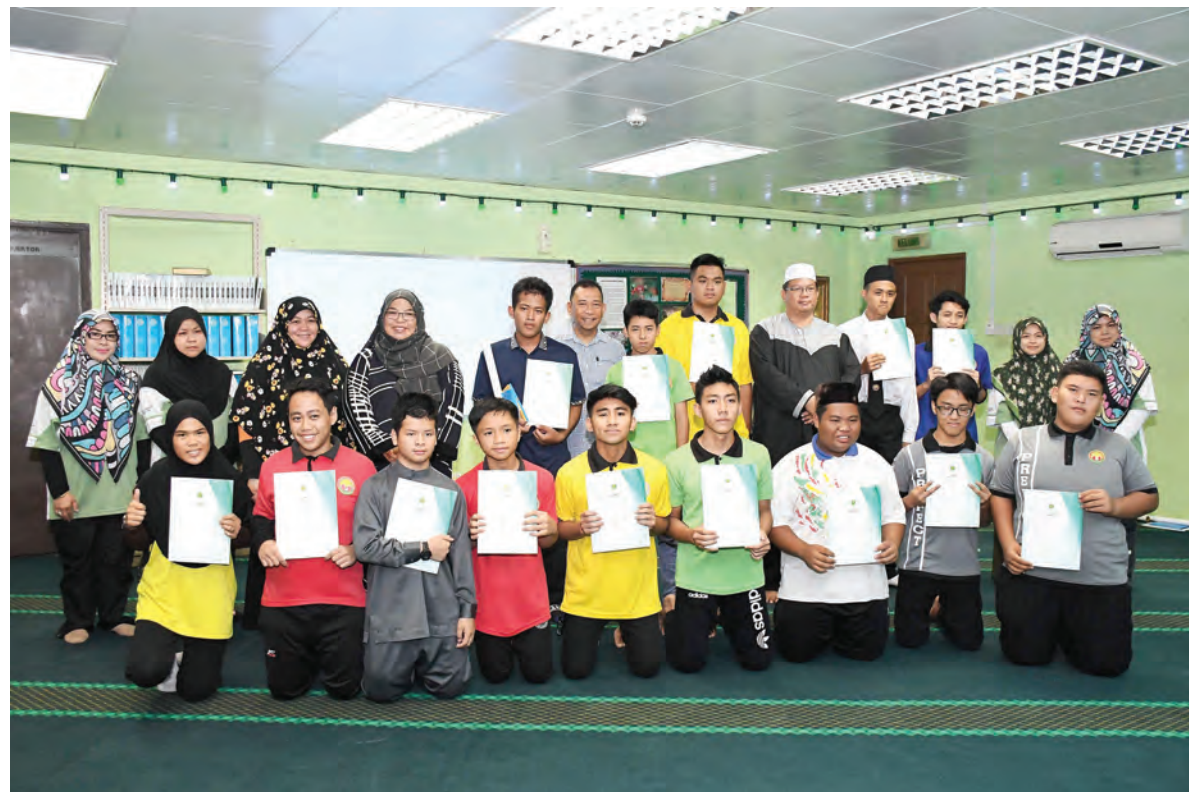
PARA peserta Program Qalbun Saleem bergambar ramai.

Pusat Da'wah Islamiah berharap dengan program ini akan dapat memberi kesedaran tentang kepentingan ilmu pengetahuan dan kefahaman, mengulangkaji pengetahuan yang ada dan meningkatkan lagi kefahaman mengenai ajaran Islam agar ianya dapat diamalkan dalam kehidupan dengan penuh keyakinan serta ketakwaan kepada Allah Subhanahu Wata'ala.