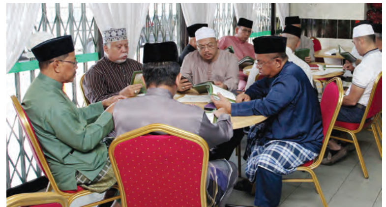
SUASANA Majlis Tahliil dan Doa Arwah anjuran matan pelajar dan pegawai kerajaan yang menuntut serta menjalani kursus di Manchester, United Kingdom pada tahun 1980 - 1983.