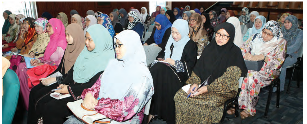
BAKAL jemaah haji perempuan semasa mengikuti kursus berkenaan.

ini adalah sangat penting dan dititikberatkan agar tidak tercalar mendapatkan ilmu Manasik Haji selain memahami pengisian kursus di samping menjadikannya sebagai bekal diri ketika berada di Tanah Suci agar dapat melaksanakan ibadat haji dengan lebih sempurna dan mendapat keredaan Allah.