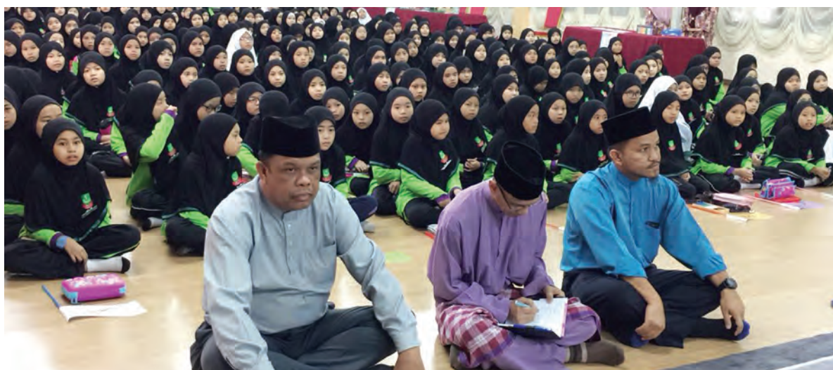
PROGRAM Hayya Ilal Arabiah kelolaan Kementerian Hal Ehwal Ugama melalui Jabatan Pengajian Islam meneruskan lagi usaha menyebarkan penggunaan bahasa Arab ke Sekolah Persediaan Arab Bandar Seri Begawan.