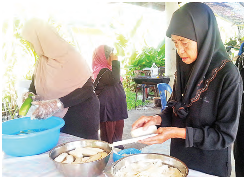
KAUM wanita sedang mengusahakan produk keripik pisang pelbagai rasa.