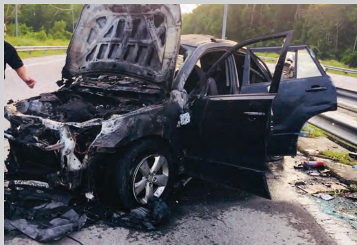
RANGKA kereta mangsa kemalangan yang berlaku di Kawasan Lebuhraya Muara - Tutong menghala Bandar Seri Begawan berdekatan Pusingan-U Meragang, Muara.

Turut memberikan bantuan di tempat kejadian adalah Jabatan Bomba dan Penyelamat serta orang ramai.