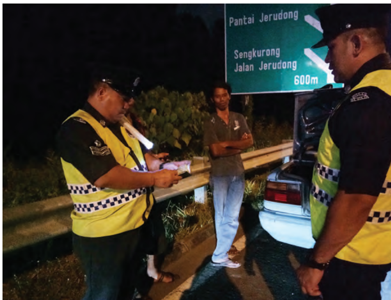
ANGGOTA Pasukan Polis Diraja Brunei memeriksa dokumen salah seorang pemandu.