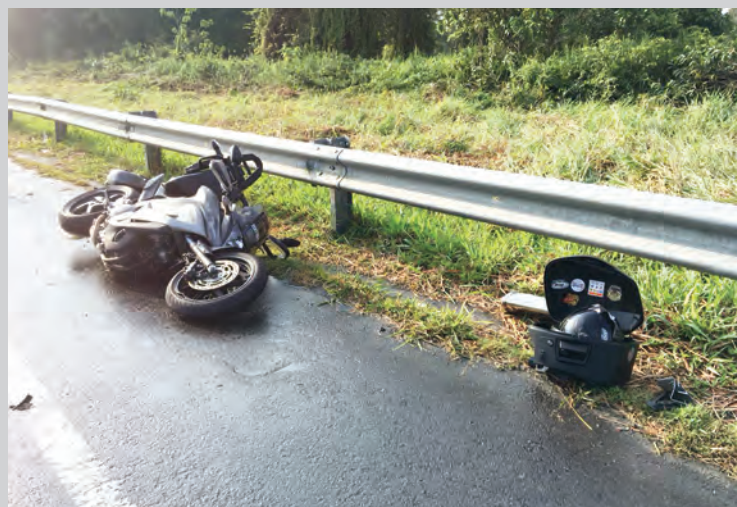
MOTOSIKAL yang dipercayai milik mangsa terhumban di bahu jalan di tempat kejadian.

Justeru itu, PDB menggesa dan menasihatkan para penunggang motosikal supaya lebih berhati-hati apabila menunggang motosikal semasa waktu hujan dan semasa meredah laluan air bertakung dan dinasihatkan agar menunggang dengan perlahan kerana percikan air secara tidak langsung boleh menyebabkan hilang kawalan dan menyebabkan kemalangan berlaku.