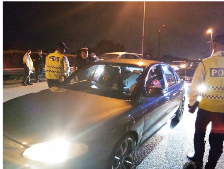
JABATAN Siasatan dan Kawalan Lalu Lintas (JSKLL) Daerah-Daerah Pasukan Polis Diraja Brunei dengan kerjasama Jabatan Pengangkutan Darat, Jabatan Kastam dan Eksais Diraja, Biro Kawalan Narkotik serta Bahagian Penguatkuasa Ugama menjalankan Operasi Sepadu serentak di keempat-empat daerah semalam.

dan mematuhi undang-undang lalu lintas bagi mengelakkan tindakan undang-undang dijalankan ke atas mereka.