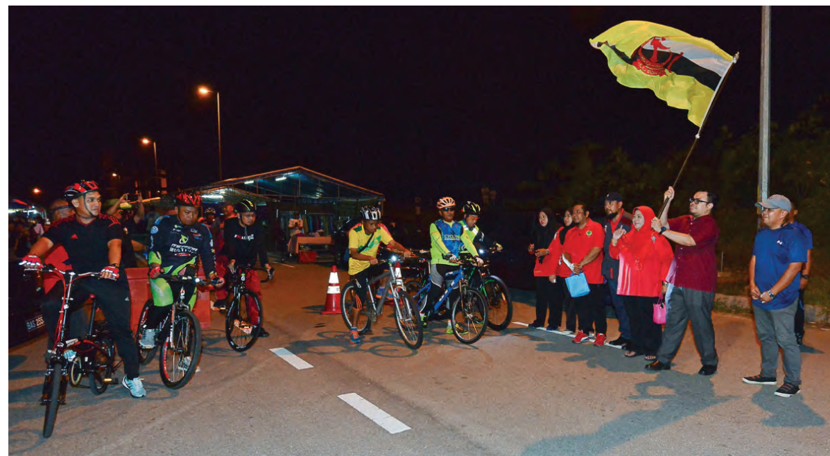
YANG Berhormat semasa menyempurnakan perlepasan acara Fun Night Ride yang bermula dan berakhir di Taman Riadah, Bukit Mengkubau Jalan Tanjong Selasih, RPN Panchor Mengkubau.

MPK RPN Panchor Mengkubau ditubuhkan secara rasmi pada 29 Mei 2016, yang mana antara lain bertujuan untuk berganding bahu bersama pemimpin akar umbi dalam memajukan kampung.