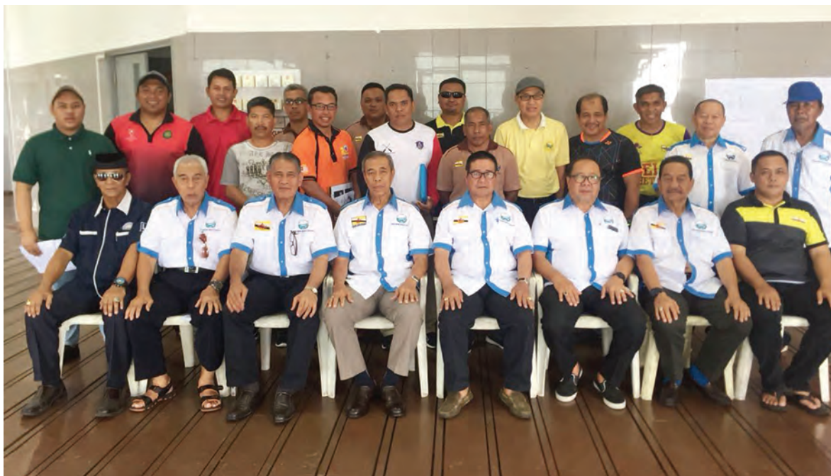
JAWATANKUASA Mesyuarat Kejohanan Lumba Perahu Tradisional Kebangsaan Ke-24, 2018 semasa bergambar ramai.

Pada mesyuarat tersebut turut diselenggarakan dengan undian lorong dan perahu bagi pasukan-pasukan yang mengambil bahagian. Kategori yang bakal dipertandingkan pada Kejohanan Lumba Perahu Tradisional Kebangsaan Ke-24, 2018 antaranya ialah 25 Pekayuh Terbuka Tempatan, 10 Pekayuh Jemputan Swasta, 20 Pekayuh Antara Kementerian, 15 Pekayuh Campuran Terbuka Tempatan, 10