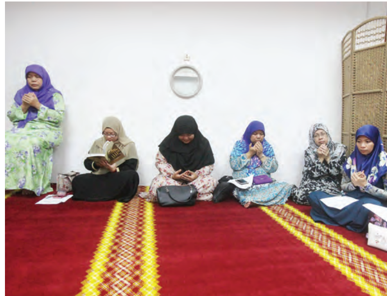
PARA pegawai dan kakitangan Jabatan Penerangan ketika hadir pada Majlis Doa Kesyukuran sempena memperingati penubuhan jabatan berkenaan (kiri dan kanan).