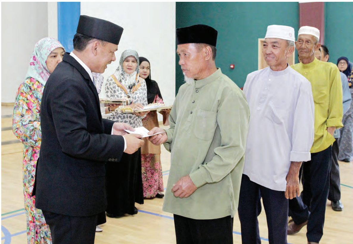
MENTERI Kebudayaan, Belia dan Sukan, Yang Berhormat Mejar Jeneral (B) Dato Paduka Seri Awang Haji Aminuddin Ihsan bin Pehin Orang Kaya Saiful Mulok Dato Seri Paduka Haji Abidin semasa menyempurnakan bantuan kepada para mangsa banjir bagi Daerah Temburong.

Darussalam seterusnya menyampaikan ucapan takziah yang mendalam kepada kerajaan dan rakyat Persekutuan Rusia, terutama sekali kepada keluarga mangsa yang terkorban dalam tragedi itu.