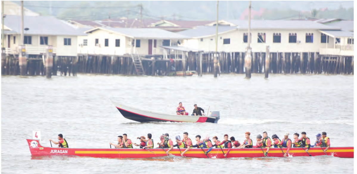
SUASANA Bandarku Ceria di Taman Haji Sir Muda Omar 'Ali Saifuddin di mana orang ramai berkesempatan melakukan pelbagai aktiviti seperti bermain buih sabun (kiri). Manakala gambar kanan, Acara Lumba Perahu Tradisi anjuran Majlis Perundingan Kampung Kota Batu, Kampung Sungai Lampai dan Pintu Malim Mukim Kota Batu dengan kerjasama Jabatan Daerah Brunei dan Muara.

BANDAR SERI BEGAWAN, Ahad, 1 April. - Program Bandarku Ceria Hari Tanpa Kereta setiap hari Ahad di ibu negara masih menjadi pilihan tempat beriadah hujung minggu bagi orang ramai terutama bersama keluarga.