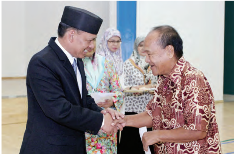
MENTERI Kebudayaan, Belia dan Sukan, Yang Berhormat Mejar Jeneral (B) Dato Paduka Seri Awang Haji Aminuddin Ihsan bin Pehin Orang Kaya Saiful Mulok Dato Seri Paduka Haji Abidin semasa menyampaikan bantuan kepada salah seorang mangsa banjir.