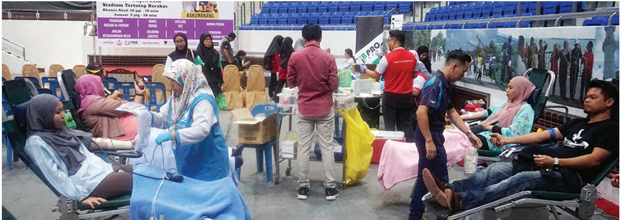
ANTARA belia yang menyertai Kempen Menderma Darah pada Pra Letop 2018 tersebut.