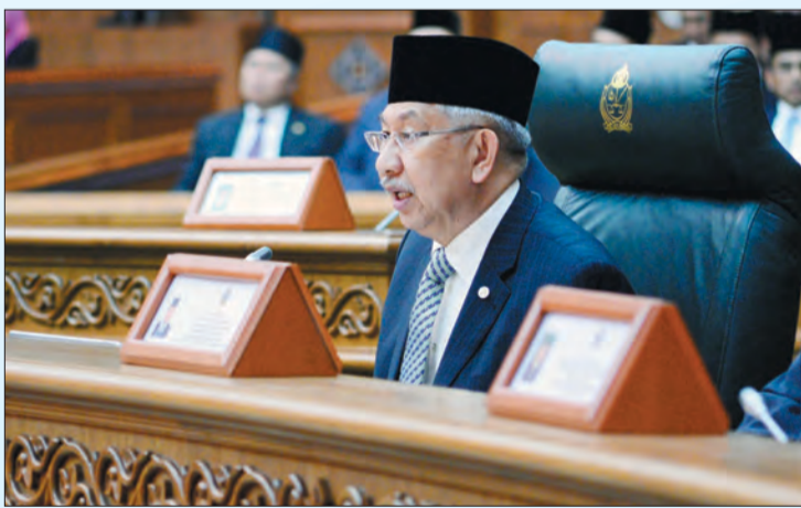
MENTERI di Jabatan Perdana Menteri dan Menteri Kewangan II (Kedua), Yang Berhormat Pehin Orang Kaya Laila Setia Dato Seri Setia Awang Haji Abdul Rahman bin Haji Ibrahim.

Perkara itu dinyatakan oleh Menteri di JPM dan Menteri Kewangan II (Kedua), Yang Berhormat Pehin Orang Kaya Laila Setia Dato Seri Setia Awang Haji Abdul Rahman bin Haji Ibrahim, ketika pembentangan Kertas Kerja