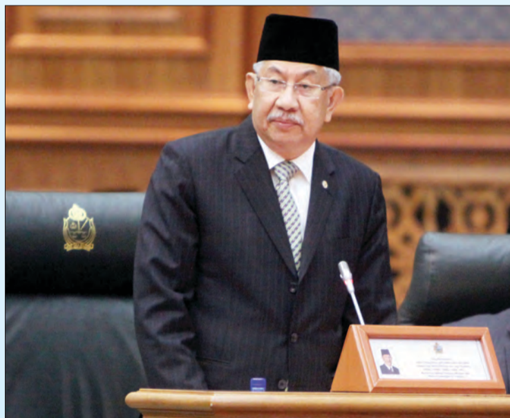
MENTERI di Jabatan Perdana Menteri (JPM) dan Menteri Kewangan II (Kedua), Yang Berhormat Pehin Orang Kaya Laila Setia Dato Seri Setia Awang Haji Abdul Rahman bin Haji Ibrahim.

Seramai 11 orang Ahli MMN telah memberikan pendapat dan menyebarkan sepenuh-penuhnya menjunjung kasih ke hadapan majlis Kebawah Duli Yang Maha Mulia