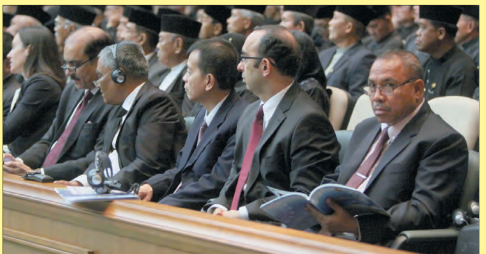
ANTARA jemputan khas dan para diplomat asing ke negara ini yang hadir semasa istiadat perasmian tersebut (kiri dan kanan).