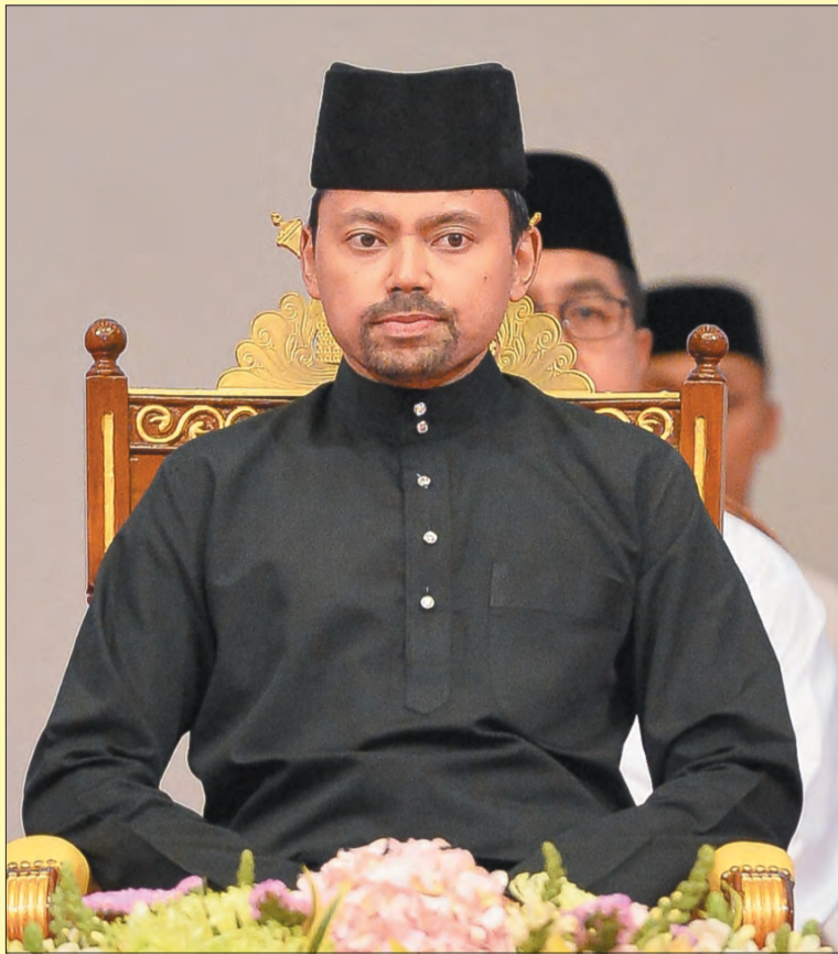
DULI Yang Teramat Mulia Paduka Seri Pengiran Muda Mahkota Pengiran Muda Haji Al-Muhtadee Billah, Menteri Kanan di Jabatan Perdana Menteri berkenan berangkat merasmikan Musabaqah Membaca Al-Quran Bahagian Dewasa Peringkat Akhir Kebangsaan Tahun 1438 Hijrah / 2017 Masihi.