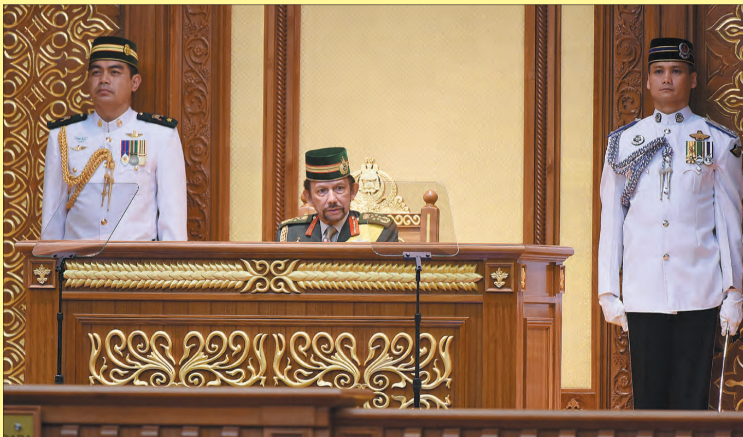
KEBAWAH Duli Yang Maha Mulia Paduka Seri Baginda Sultan Haji Hassanal Bolkiah Mu'izzaddin Waddaulah ibni Al-Marhum Sultan Haji Omar 'Ali Saifuddin Sa'adul Khairi Waddien, Sultan dan Yang Di-Pertuan Negara Brunei Darussalam berkenan mengurniakan titah pada Majlis Istiadat Pembukaan Rasmi Mesyuarat Pertama dari Musim Permesyuaratan Ke-13 Majlis Mesyuarat Negara (MMN) di Dewan Persidangan MMN, Bangunan Dewan Majlis. (Lihat muka 3, 4, 12 dan 13).