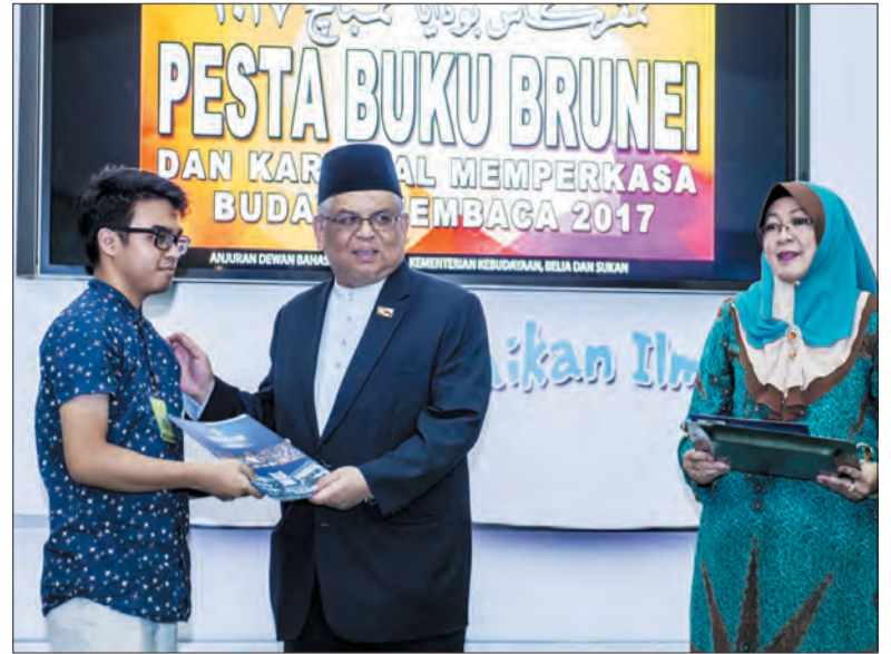
TIMBALAN Menteri Pendidikan, Yang Mulia Pengiran Dato Paduka Haji Bahrom bin Pengiran Haji Bahar (tengah) semasa menyampaikan sijil penghargaan kepada syarikat yang menyertai Pesta Buku Brunei.

Ia juga bagi mendukung Wawasan Brunei 2035 dalam melahirkan masyarakat yang bermaklumat,