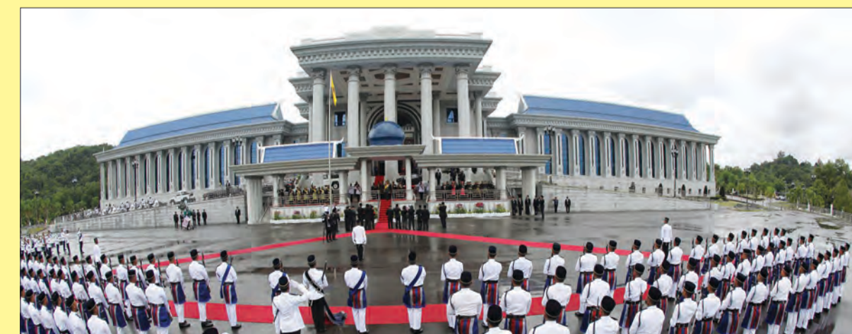
SUASANA UPACARA Perbarisan Kawalan Kehormatan yang terdiri daripada lebih 100 anggota Pasukan Polis Diraja Brunei.