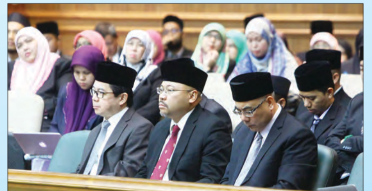
ANTARA yang hadir mendengarkan perbincangan yang berlangsung di Dewan Persidangan MMN, Bangunan Dewan Majlis.

"Dalam hal sedemikian, salah satu langkah mempertingkatkan lagi kualiti pengajaran literasi dan numerasi di sekolah-sekolah di Brunei Darussalam, pada tahun 2016 satu perjanjian telah ditandatangani di antara pihak CFBT dan Kementerian Pendidikan yang diharap dapat menyumbang bagi meningkatkan kualiti pelajar-pelajar di sekolah rendah dan menengah di negara ini," ujar Yang Berhormat.