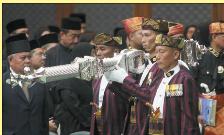
BENTARA Dewan yang membawa Cokmar masuk ke dalam Dewan Persidangan MMN, Bangunan Dewan Majlis.

Ugama Islam, Duta-Duta Besar, Pesuruhjaya-Pesuruhjaya Tinggi Luar Negeri, Setiausaha-Setiausaha Tetap dan pegawai-pegawai kanan kerajaan.