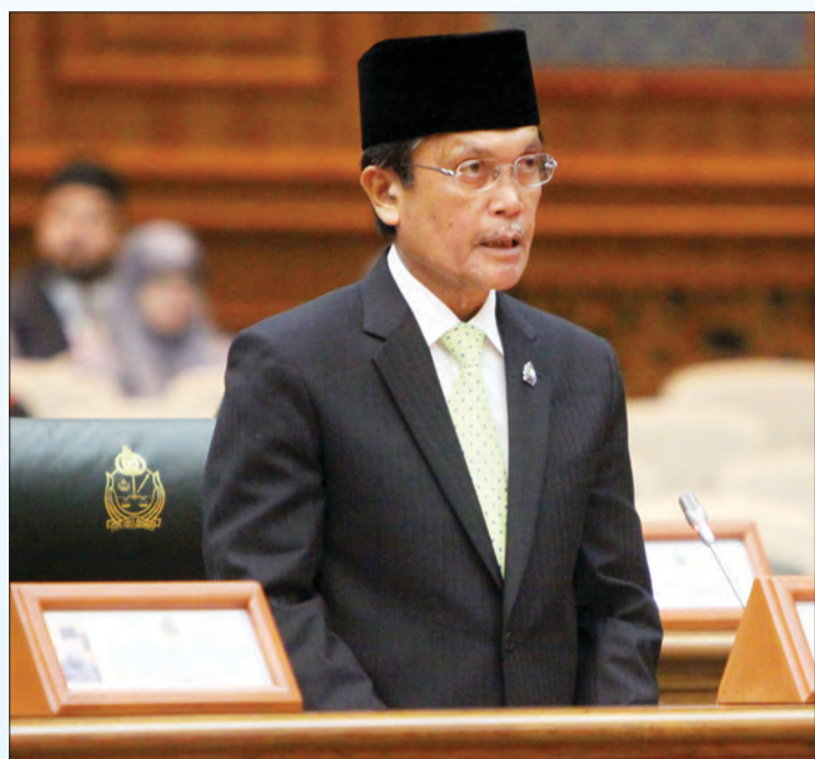
MENTERI Hal Ehwal Dalam Negeri, Yang Berhormat Pehin Orang Kaya Seri Kerna Dato Seri Setia (Dr.) Haji Awang Abu Bakar bin Haji Apong.

"Usaha-usaha kita dalam menghadapi cabaran ini perlu diteruskan. Kita juga perlu sama-sama bertindak dan bergerak melaksanakan kaedah-kaedah dan langkah-langkah yang wajar dalam menangani situasi ini secara lebih efektif melalui pendekatan whole of nation bagi meningkatkan produktiviti negara," jelas Yang Berhormat.