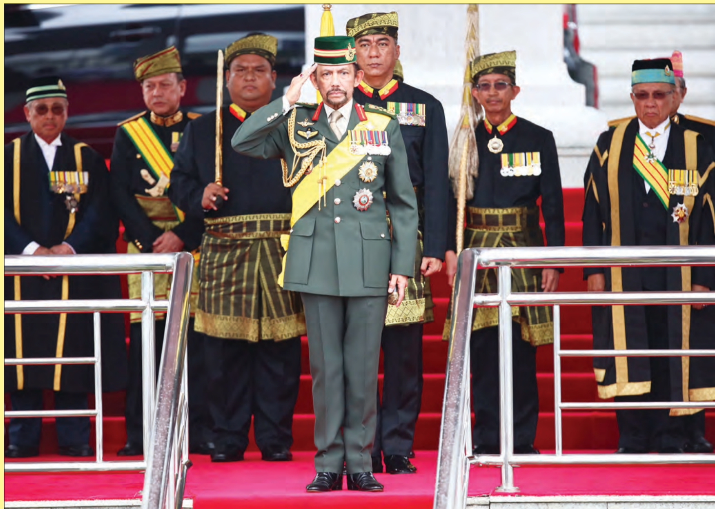
KEBAWAH Duli Yang Maha Mulia Paduka Seri Baginda Sultan Haji Hassanal Bolkiah Mu'izzaddin Waddaulah ibni Al-Marhum Sultan Haji Omar 'Ali Saifuddien Sa'adul Khairi Waddien, Sultan dan Yang Di-Pertuan Negara Brunei Darussalam berkenan menerima tabik hormat diraja ketika berangkat menyempurnakan Istiadat Pembukaan Rasmi Mesyuarat Pertama dari Musim Permesyuaratan Ke-13 Majlis Mesyuarat Negara (MMN).

BANDAR SERI BEGAWAN , Isnin, 6 Mac. - Ke-13 Majlis Mesyuarat Negara (MMN) untuk kepentingan negara dan kesejahteraan Mesyuarat Pertama dari Musim Permesyuaratan telah bermula bagi membincangkan pelbagai isu rakyat.