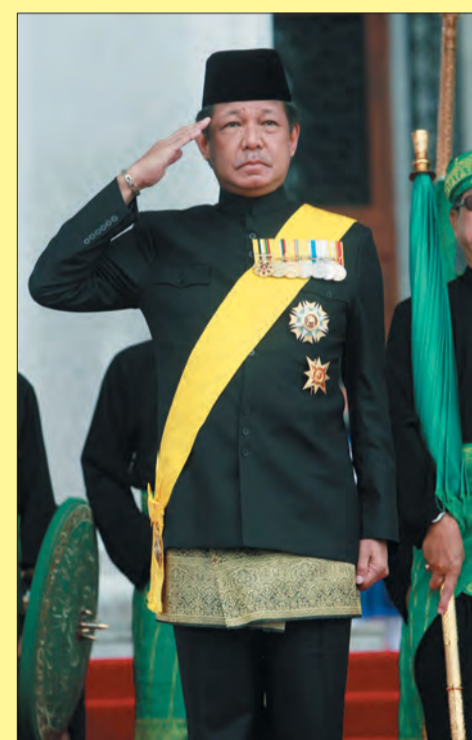
DYTM Paduka Seri Pengiran Muda Mahkota Pengiran Muda Haji Al-Muhtadee Billah, DYTM Paduka Seri Pengiran Perdana Wazir Sahibul Himmah Wal-Waqar Pengiran Muda Mohamed Bolkiah; DYTM Paduka Seri Pengiran Bendahara Seri Maharaja Permaisura Pengiran Muda Haji Sufri Bolkiah dan DYTM Paduka Seri Pengiran Digadong Sahibul Mal Pengiran Muda Haji Jefri Bolkiah semasa berkenan menerima tabik hormat diraja.

Perlembagaan Negeri Brunei, 1959 dan ahli-ahlinya dilantik menurut Bab 24. MMN telah dibubarkan pada tahun 1984.