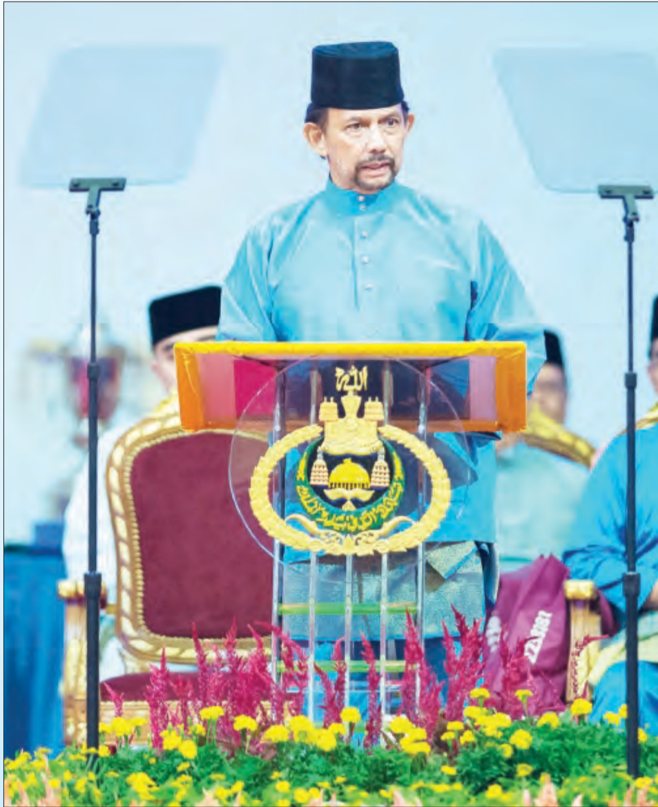
KEBAWAH Duli Yang Maha Mulia Paduka Seri Baginda Sultan Haji Hassanal Bolkiah Mu'izzaddin Waddaulah ibni Al-Marhum Sultan Haji Omar 'Ali Saifuddien Sa'adul Khairi Waddien, Sultan dan Yang Di-Pertuan Negara Brunei Darussalam berkenan mengurniakan titah pada Musabaqah Membaca Al-Quran Bahagian Dewasa Peringkat Akhir Kebangsaan Tahun 1437 Hijrah/2016 Masihi.

M AKA akan bergemalah kemerduan alunan bacaan ayat-ayat suci Al-Quran oleh seramai kira-kira 12 peserta peringkat akhir Musabaqah Membaca Al-Quran Bahagian Dewan bagi Tahun 1438 Hijrah / 2017 Masihi memenuhi ruang Dewan Plenari, Pusat Persidangan Antarabangsa, Berakas, iaitu pada 7 Mac hingga 9 Mac 2017 selama tiga malam berturut-turut. Seramai empat peserta memperdengarkan bacaan mereka pada hari pertama dan lapan orang lagi pada hari kedua.