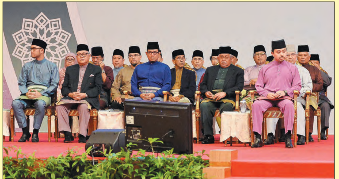
BERANGKAT sama paduka adinda DYTМ, Yang Teramat Mulia Paduka Seri Duli Pengiran Muda 'Abdul Malik. Juga berangkat ialah kerabat diraja yang lain serta Yang Amat Mulia Pengiran-Pengiran Cheteria dan juga para jemputan khas.