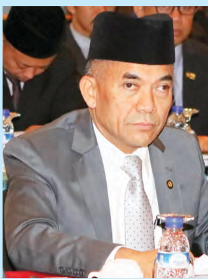
MENTERI Sumber-Sumber Utama dan Pelancongan, Yang Berhormat Dato Seri Setia Awang Haji Ali bin Haji Apong semasa berucap pada Sesi Muzakarah di antara Kementerian Sumber-Sumber Utama dan Pelancongan Bersama dengan Yang Berhormat Ahli-Ahli Majlis Mesyuarat Negara pada hari Khamis, 12 Jamadilawal 1438 Hijrah bersamaan 9 Februari 2017 Masihi bertempat di Dewan Setia Pahlawan Kementerian Sumber-Sumber Utama dan Pelancongan.

Walau bagaimanapun, sukacita dimaklumkan bahawa antara asas utama Pelan Strategik Kementerian Sumber-Sumber Utama adalah titah Kebawah Duli Yang Maha Mulia Paduka Seri Baginda Sultan