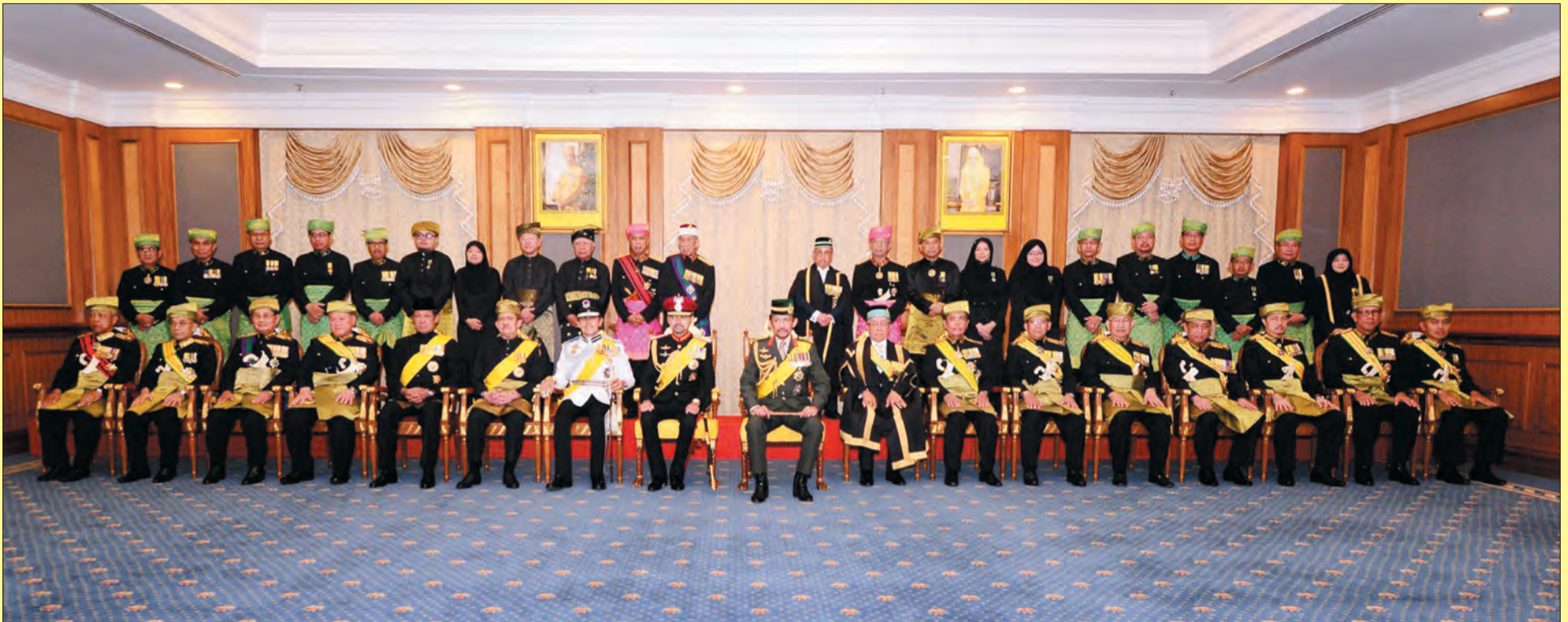
KEBAWAH Duli Yang Maha Mulia Paduka Seri Baginda Sultan Haji Hassanal Bolkiah Mu'izzaddin Waddaulah ibni Al-Marhum Sultan Haji Omar 'Ali Saifuddin Sa'adul Khairi Waddien, Sultan dan Yang Di-Pertuan Negara Brunei Darussalam bersama paduka-paduka anakanda dan adinda baginda berkenan bergambar ramai bersama Ahli-Ahli Majlis Mesyuarat Negara (MMN) pada Istiadat Pembukaan Rasmi Mesyuarat Pertama dari Musim Permesyuaratan Ke-13 MMN.