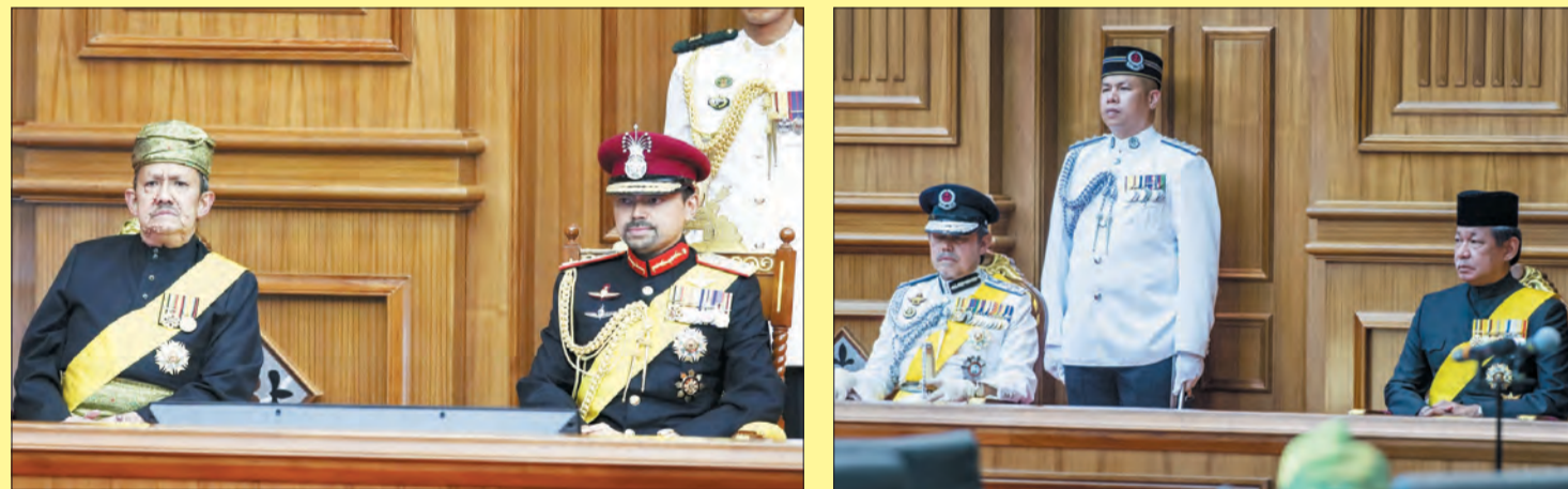
BERANGKAT sama ialah Duli Yang Teramat Mulia Paduka Seri Pengiran Muda Mahkota Pengiran Muda Haji Al-Muhtadee Billah ibni Kebawah Duli Yang Maha Mulia Paduka Seri Baginda Sultan Haji Hassanal Bolkiah Mu'izzaddin Waddaulah, Menteri Kanan di Jabatan Perdana Menteri yang juga merupakan Ahli Rasmi Kerana Jawatan; Duli Yang Teramat Mulia Paduka Seri Pengiran Perdana Wazir Sahibul Himmah Wal-Waqar Pengiran Muda Mohamed Bolkiah; Duli Yang Teramat Mulia Paduka Seri Pengiran Bendahara Seri Maharaja Permaisura Pengiran Muda Haji Sufri Bolkiah dan Duli Yang Teramat Mulia Paduka Seri Pengiran Digadong Sahibul Mal Pengiran Muda Haji Jefri Bolkiah.

BANDAR SERI BEGAWAN , Isnin, 6 Mac. - Ke-13 Majlis Mesyuarat Negara (MMN) untuk kepentingan negara dan kesejahteraan Mesyuarat Pertama dari Musim Permesyuaratan telah bermula bagi membincangkan pelbagai isu rakyat.