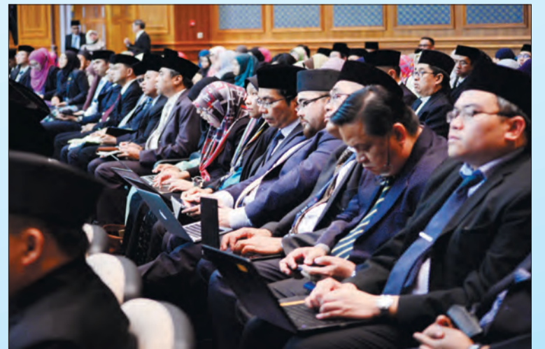
PEGAWAI-PEGAWAI kanan kerajaan yang hadir semasa pembentangan Kertas Cadangan Rang Undang-Undang (2017) Perbekalan 2017 / 2018 Majlis Mesyuarat Negara.

Di samping juga tambah Yang Berhormat, peruntukan sejumlah $500,000.00 telah disediakan di bawah Kementerian Hal Ehwal Luar Negeri dan Perdagangan bagi Perkembangan Perdagangan dan Penyediaan peruntukan bagi meningkatkan kapasiti Competent Authority dalam bidang Hazard Analysis and Critical Control Points (HACCP) yang bertujuan untuk memberikan akreditasi keselamatan makanan ke atas kilang-kilang pengeluaran makanan.