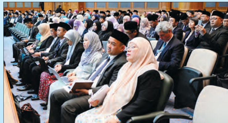
SEBAHAGIAN daripada yang hadir pada persidangan berkenaan.

"Kementerian Sumber-Sumber Utama dan Pelancongan (KSSUP) juga telah melancarkan pakej pelancongan baharu untuk meningkatkan kemasukan pelancong dan memanjangkan tempoh keberadaan mereka di negara ini," ujar Yang Berhormat.