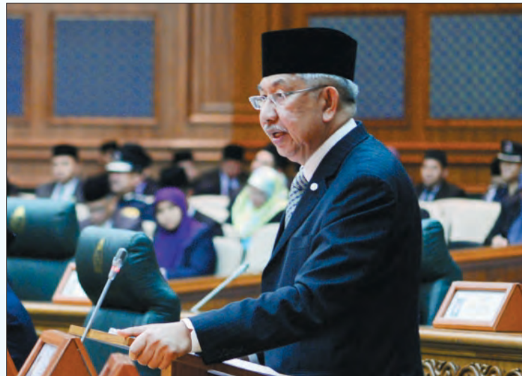
MENTERI di Jabatan Perdana Menteri dan Menteri Kewangan II (Kedua), Yang Berhormat Pehin Orang Kaya Laila Setia Dato Seri Setia Awang Haji Abdul Rahman bin Haji Ibrahim.

Dalam pembentangan kertas cadangan itu, Yang Berhormat turut menyentuh mengenai keutamaan belanjawan keempat iaitu membina kapasiti dan modal insan, di mana menurutnya modal insan yang berpengetahuan dan berkemahiran tinggi adalah sumber utama yang diperlukan untuk perkembangan dan kemajuan negara secara progresif.