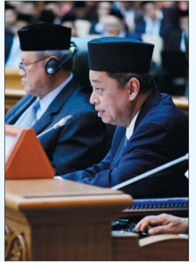
ANTARA Yang Berhormat Menteri-Menteri Kabinet yang hadir semasa Persidangan Majlis Mesyuarat Negara pada sebelah petang.

akan terus bertindak merangka strategi untuk memelihara kestabilan politik, mempertahankan kedaulatan negara serta menghubungkan keupayaan pertahanan dan keupayaan diplomatik dan juga persediaan negara dalam menangani ancaman keselamatan.