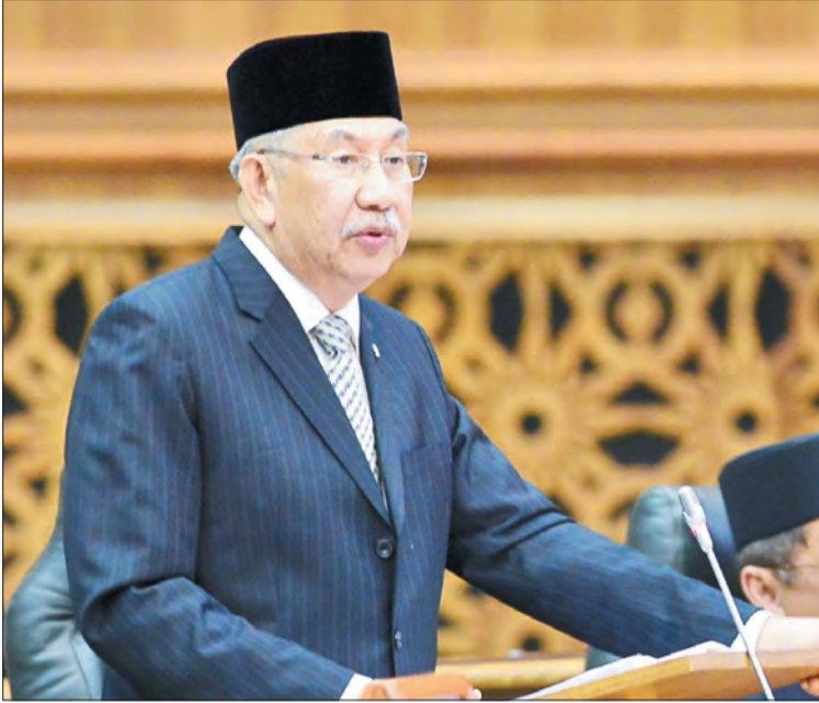
MENTERI di Jabatan Perdana Menteri dan Menteri Kewangan II (Kedua), Yang Berhormat Pehin Orang Kaya Laila Setia Dato Seri Setia Awang Haji Abdul Rahman bin Haji Ibrahim.