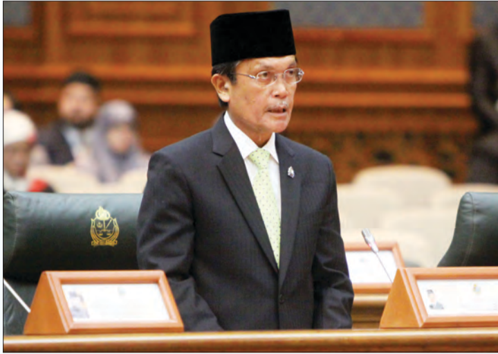
MENTERI Hal Ehwal Dalam Negeri, Yang Berhormat Pehin Orang Kaya Seri Kerna Dato Seri Setia (Dr.) Haji Awang Abu Bakar bin Haji Apong.

BANDAR SERI BEGAWAN , Selasa, 7 Mac. - Beberapa syarikat dari Pelaburan Langsung Asing (FDI) telah mula bertapak dan menjalankan operasi mereka di negara ini seperti dalam bidang pharmaceutical , bioteknologi, dan sebagainya sementara sebilangan syarikat FDI akan memulakan