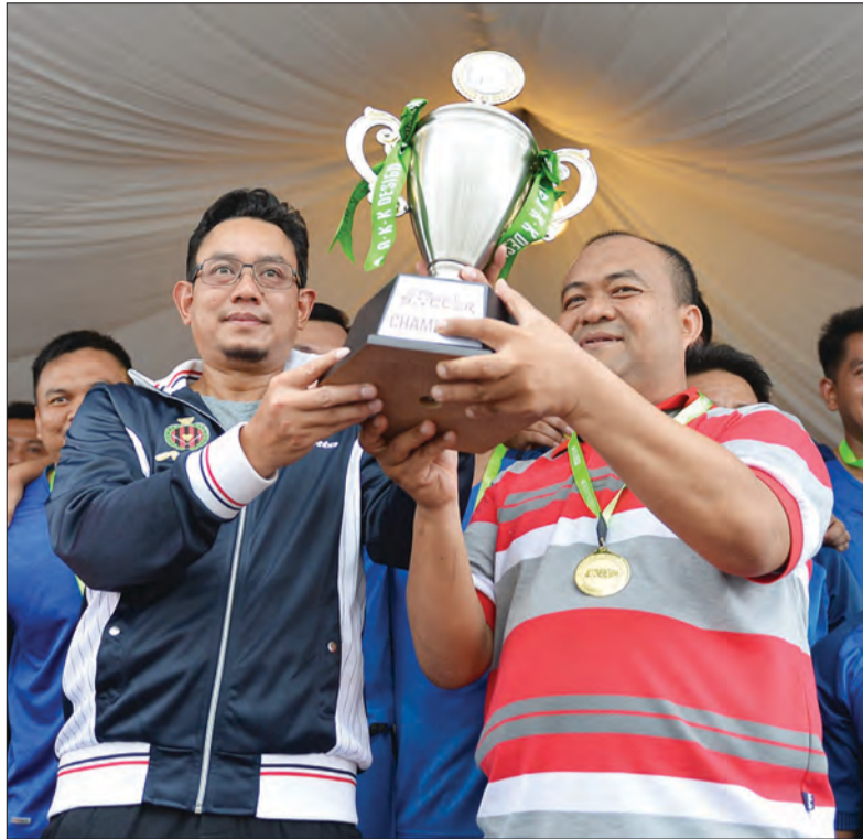
YANG Amat Mulia Pengiran Maharaja Setia Laila Diraja Sahibul Irshad Pengiran Anak Haji Abdul Rahim bin Pengiran Indera Mahkota Pengiran Anak Dr Kamaludin Al-Haj, Timbalan Pengerusi DPMM FC berkenan menyempurnakan penyampaian hadiah perlawanan kepada Ketua Pasukan J.I.P.K.

BERAKAS , Isnin, 6 Mac. - Pasukan J.I.P.K. muncul juara sekali gus merebut piala pada Kejohanan 'Street Soccer' di Karnival Majalah Matchday Brunei DPMM FC 2017 selepas mengalahkan pasukan Al-Rawda dengan jaringan 3-2.