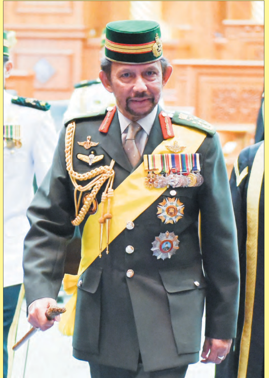
KEBAWAHA Duli Yang Maha Mulia Paduka Seri Baginda Sultan Haji Hassanal Bolkiah Mu'izzaddin Waddaulah ibni Al-Marhum Sultan Haji Omar 'Ali Saifuddien Sa'adul Khairi Waddien, Sultan dan Yang Di-Pertuan Negara Brunei Darussalam ketika berkenan berangkat ke Majlis Istiadat Pembukaan Rasmi Mesyuarat Pertama dari Musim Permesyuaratan Ke-13 Majlis Mesyuarat Negara (MMN) di Dewan Persidangan MMN, Bangunan Dewan Majlis.

Namun dalam keghairahan memanfaatkan teknologi canggih itu tegas baginda, kita juga dikehendaki supaya jangan lalai dari anasir-anasir yang tidak bertanggungjawab yang menggunakan teknologi untuk tujuan-tujuan keburukan termasuk penggunaan media sosial untuk menyebarkan berita-berita palsu dan fitnah, semua ini boleh mengundang kepada