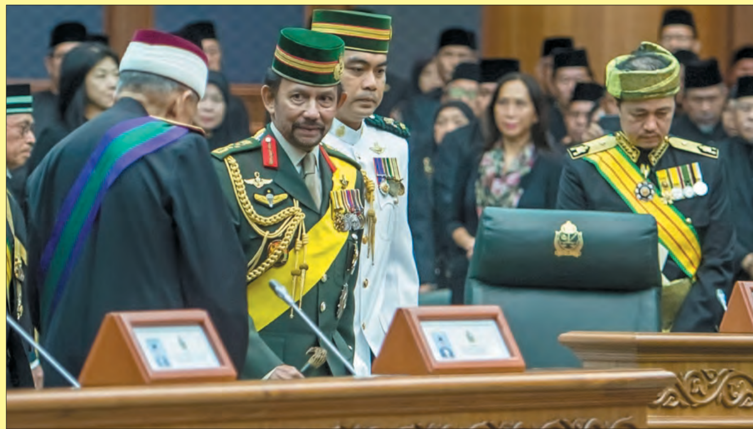
KEBAWAH Duli Yang Maha Mulia Paduka Seri Baginda Sultan Haji Hassanal Bolkiah Mu'izzaddin Waddaulah, Sultan dan Yang Di-Pertuan Negara Brunei Darussalam berkenan berangkat menyempurnakan Istiadat Pembukaan Rasmi Mesyuarat Pertama dari Musim Permesyuaratan Ke-13 MMN yang berlangsung di Dewan Persidangan MMN, Bangunan Dewan Majlis.