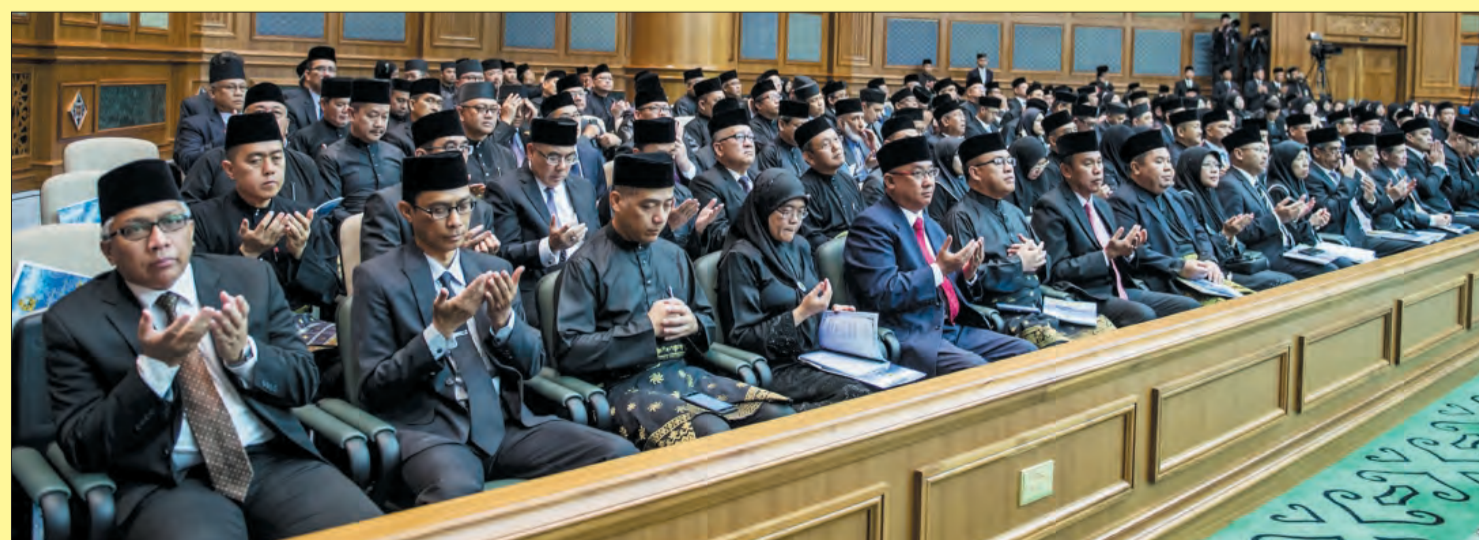
PARA jemputan dan pegawai-pegawai kanan kerajaan hadir semasa istiadat perasmian tersebut.

Kebawah Duli Yang Maha Mulia Paduka Seri Baginda Sultan Haji Hassanal Bolkiah Mu'izzaddin Waddaulah ibni Al-Marhum Sultan Haji Omar 'Ali Saifuddien Sa'adul Khairi Waddien, Sultan dan Yang Di-Pertuan Negara Brunei Darussalam berkenan berangkat menyempurnakan Istiadat Pembukaan Rasmi Mesyuarat Pertama dari Musim Permesyuaratan Ke-13 MMN yang berlangsung penuh tradisi di Dewan Persidangan MMN, Bangunan Dewan Majlis.