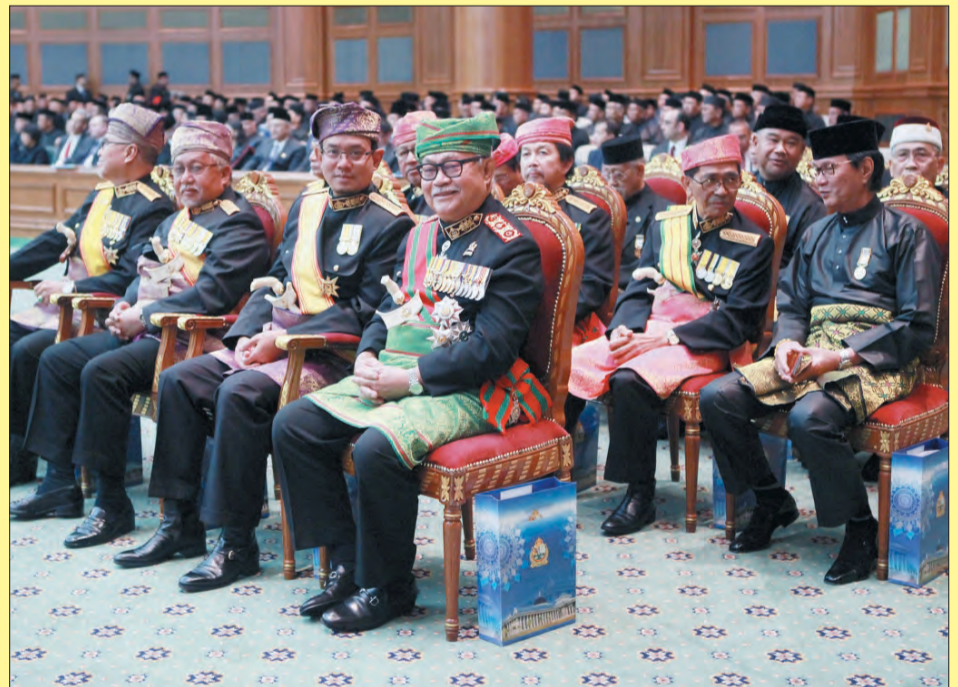
HADIR sama pada Istiadat Pembukaan Rasmi tersebut ialah Yang Amat Mulia Pengiran- Pengiran Cheteria, Ahli Majlis Mesyuarat Di-Raja dan Ahli Majlis Mengangkat Raja.

"Kita semua sudah maklum bahawa keadaan ekonomi dunia terus mengalami ketidakpastian walaupun pada akhir-akhir ini harga minyak dunia menunjukkan tanda-tanda positif," tegas baginda.