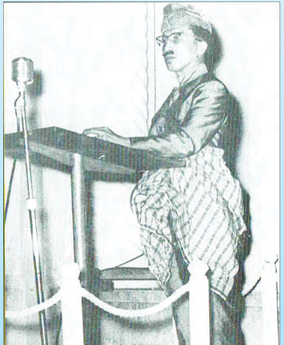
IMBASAN KEMBALI ... Duli Yang Teramat Mulia Paduka Seri Begawan Sultan Haji Omar 'Ali Saifuddien Sa'adul Khairi Waddien (Al-Marhum Sultan Haji Omar 'Ali Saifuddien Sa'adul Khairi Waddien) ketika merasmikan Peraduan Membaca Al-Quran Peringkat Senegeri pada 16 Oktober 1969.