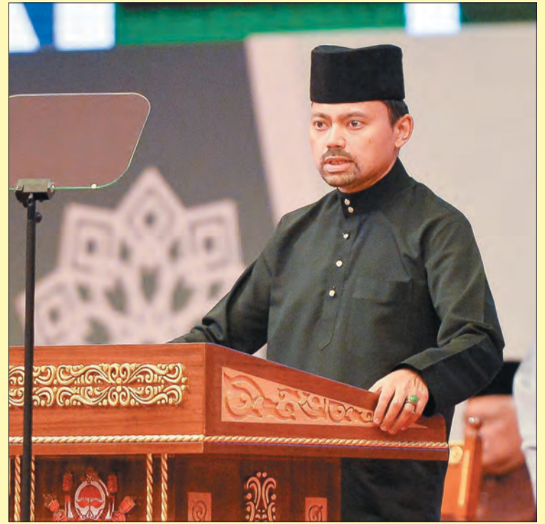
DULI Yang Teramat Mulia Paduka Seri Pengiran Muda Mahkota Pengiran Muda Haji Al-Muhtadee Billah ibni Kebawah Duli Yang Maha Mulia Paduka Seri Baginda Sultan Haji Hassanal Bolkiah Mu'izzaddin Waddaulah, Menteri Kanan di Jabatan Perdana Menteri ketika bersabda merasmikan Majlis Musabaqah Membaca Al-Quran Bahagian Dewasa Peringkat Akhir Kebangsaan Tahun 1438 Hijrah / 2017 Masihi.

"Dengan kata lain, Al-Quran merupakan pedoman hidup untuk mencapai kebahagiaan dunia dan akhirat. Ternyata manfaat terbesar dari bersahabat dengan Al-Quran adalah syafaat yang dijanjikan sebagai ganjaran untuk alam akhirat," sabda DYTMM.