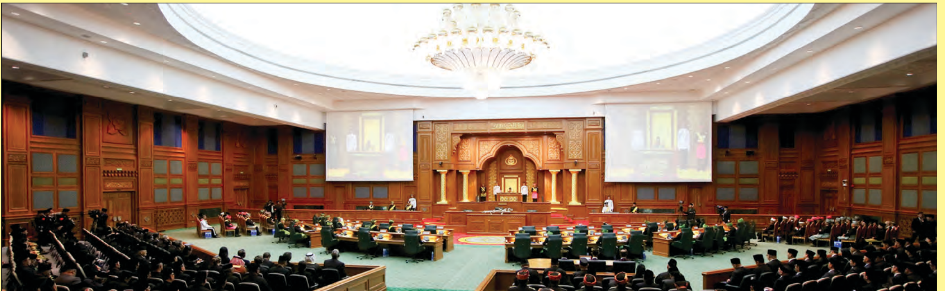
SUASANA Majlis Istiadat Pembukaan Rasmi Mesyuarat Pertama dari Musim Permesyuaratan Ke-13 MMN.

Ahli-ahli Yang Berhormat titah baginda juga diharapkan dapat mengemukakan pandangan-pandangan dan saranan-saranan bernas tanpa takut-takut atau ragu-ragu untuk kepentingan masyarakat dan negara.