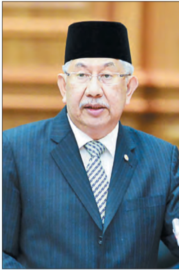
MENTERI di Jabatan Perdana Menteri dan Menteri Kewangan II (Kedua), Yang Berhormat Pehin Orang Kaya Laila Setia Dato Seri Setia Awang Haji Abdul Rahman bin Haji Ibrahim.

"Kadar defisit tinggi ini direkodkan walaupun kerajaan telah berjaya mengawal perbelanjaannya, yang berkurangan sebanyak 13% kepada $6.3 bilion berbanding $7.3 bilion pada Tahun Kewangan sebelumnya. Demikian juga, bagi tempoh sembilan (9) bulan pertama Tahun Kewangan 2016/2017,