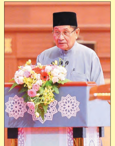
MENTERI Hal Ehwal Ugama, Yang Berhormat Pehin Udana Khatib Dato Paduka Seri Setia Ustaz Haji Awang Badaruddin selaku pengerusi majlis menyembahkan ucapan alu-aluan.

Yang Berhormat Menteri Hal Ehwal Ugama seterusnya menyembahkan, bahawa pada tahun ini jawatankuasa musabaqah telah mendatangkan tiga qari jemputan iaitu seorang dari Republik Arab Mesir dan dua orang dari Republik