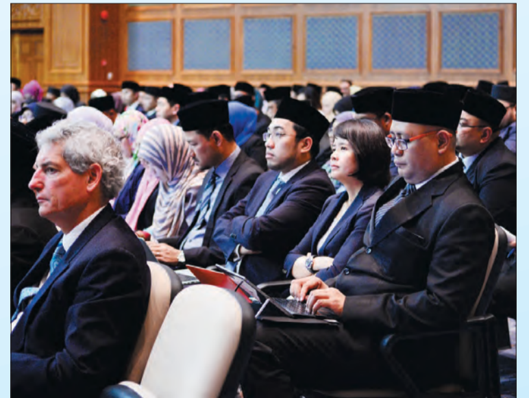
ANTARA yang hadir mendengarkan Persidangan Majlis Mesyuarat Negara (MMN) yang berlangsung di Dewan Persidangan MMN, Bangunan Dewan Majlis.

"Darussalam Assets juga bekerja rapat dengan pihak pengurusan GLCs bagi menyediakan pelan perniagaan strategik untuk menetapkan hala tuju setiap GLC. Usaha sama dengan Darussalam Assets setakat ini telah dapat memperbaiki prestasi kewangan dan operasi syarikat dan mendukung usaha pengukuhan sektor swasta di negara ini. Melalui operasi GLC yang kukuh, selain dari menyumbang kepada perkembangan