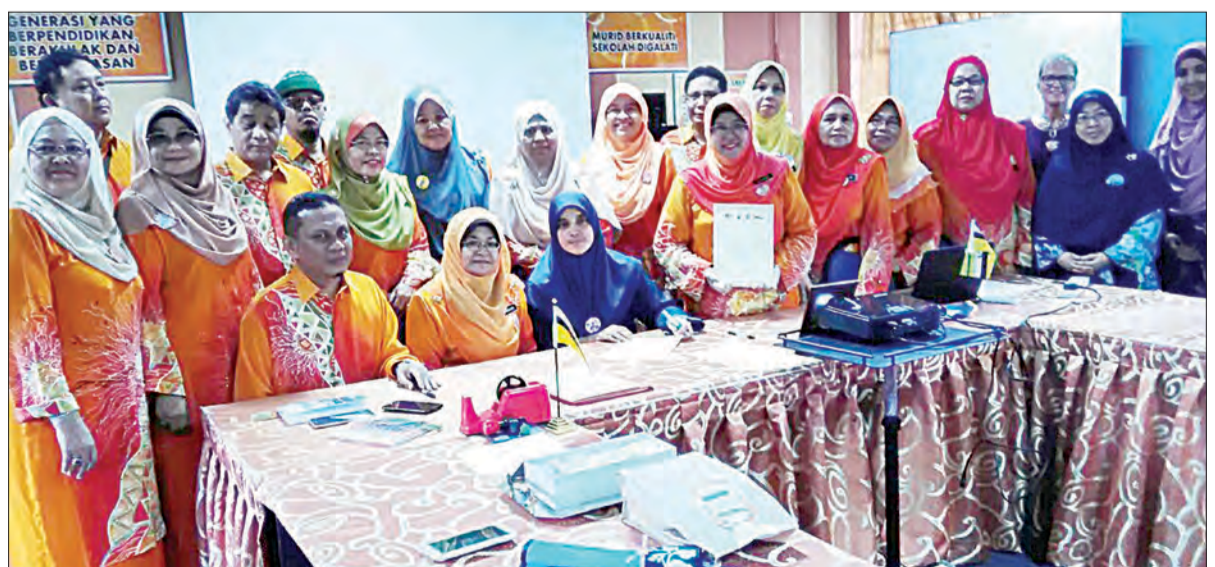
DELEGASI dari Majlis Guru Besar Hulu Langat, Selangor, Malaysia bergambar ramai.

Delegasi dari Selangor tersebut akan meneruskan lawatan ke SR Datu Ratna Haji Muhammad Jaafar, Kiarong pada hari Selasa.