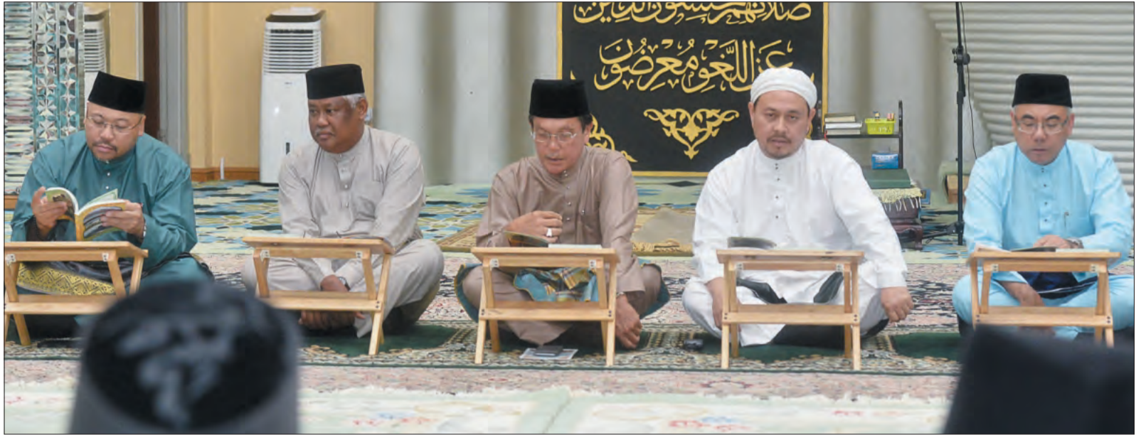
MENTERI Hal Ehwal Dalam Negeri, Yang Berhormat Pehin Orang Kaya Seri Kerna Dato Seri Setia (Dr.) Haji Awang Abu Bakar bin Haji Apong (tengah) hadir selaku tetamu kehormat pada Majlis Doa Kesyukuran dan Majlis Khatam Al-Quran Sempena Memperingati Penubuhan Jabatan Penjara Ke-63 Tahun yang berlangsung di Masjid Jubli Perak.