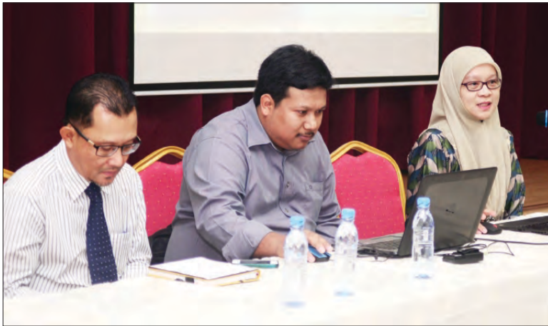
KUMPULAN Syura BMT dari Suruhanjaya Perkhidmatan Awam mengongsikan kertas projek bertajuk 'Pemodenan Sistem Bermesyuarat' pada majlis tersebut.