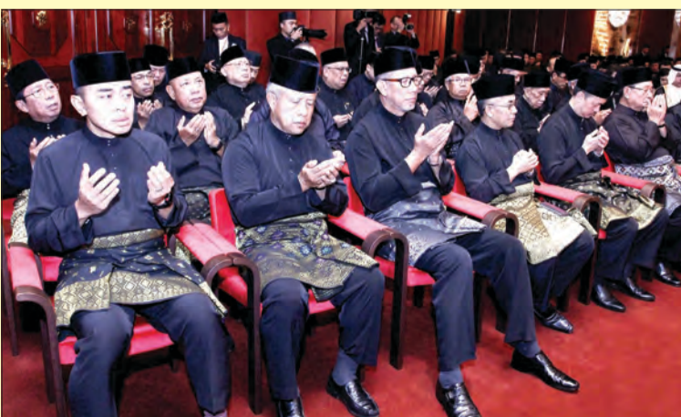
ANTARA jemputan yang hadir pada Istiadat Pengurniaan Pingat-Pingat Kehormatan Negara sempena Hari Keputeraan Kebawah Duli Yang Maha Mulia Ke-70 Tahun tersebut ialah Yang Amat Mulia Pengiran-Pengiran Cheteria dan Pengiran-Pengiran Peranakan.