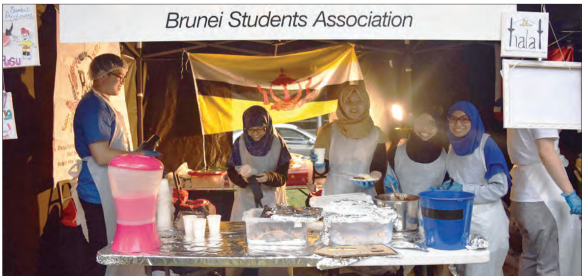
PERSATUAN Penuntut Brunei Darussalam di New Zealand menyertai Pesta Makanan Antarabangsa.

Untuk mengikuti aktiviti-aktiviti RTB, orang awam boleh mengikutinya melalui media sosial Facebook / Instagram : rtb.bn dan Twitter : rtb_bn .