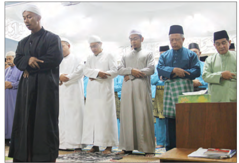
MENTERI Kebudayaan, Belia dan Sukan, Yang Berhormat Pehin Datu Lailaraja Mejar Jeneral (B) Dato Paduka Seri Haji Awang Halbi bin Haji Mohd Yussof (dua, kanan) bersama para pegawai, jurulatih dan para Pelatih PKBN Pengambilan Ke-6 semasa menunaikan Sembahyang Subuh Berjemaah.

Majlis Sembahyang Subuh Berjemaah bersama Menteri Kebudayaan, Belia dan Sukan ini merupakan salah satu pengisian yang disusun menerusi komponen kenegaraan dan keagamaan, iaitu bagi mendedahkan para pelatih untuk sentiasa cenderung kepada aspek-aspek keagamaan dengan secara