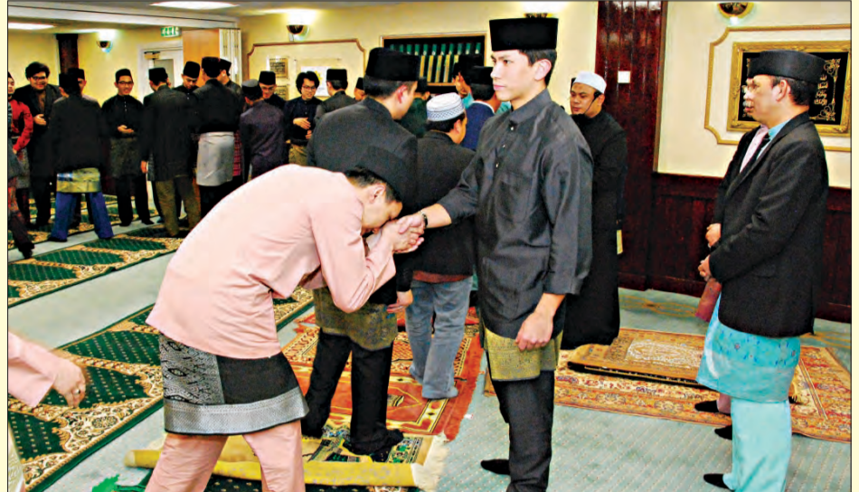
YANG Teramat Mulia Paduka Seri Duli Pengiran Muda 'Abdul Mateen ibni Kebawah Duli Yang Maha Mulia Paduka Seri Baginda Sultan Haji Hassanal Bolkiah Mu'izzaddin Waddaulah berangkat ke Majlis Doa Kesyukuran sempena Sambutan Hari Kebangsaan Negara Brunei Darussalam Ke-33 Tahun di Surau Brunei Hall, Norfolk Square, London (kiri). Sementara gambar kanan, Yang Teramat Mulia Paduka Seri Duli Pengiran Muda 'Abdul Mateen berkenan menerima junjung ziarah daripada para penuntut Brunei.

LONDON, UNITED KINGDOM, Isnin, 27 Februari. - Acara kemuncak Majlis Doa Kesyukuran sempena Sambutan Hari Kebangsaan Negara Brunei Darussalam Ke-33 Tahun telah diadakan di Surau Brunei Hall, Norfolk Square, London pada hari