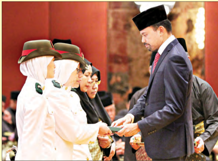
DULI Yang Teramat Mulia Paduka Seri Pengiran Muda Mahkota Pengiran Muda Haji Al-Muhtadee Billah berkenan mengurniakan Pingat-Pingat Kehormatan Negara Brunei Darussalam kepada para penerima wanita.

terus memberikan sumbangan dan berbakti kepada negara yang dicintai ini dan berazam akan berusaha dengan lebih gigih lagi.