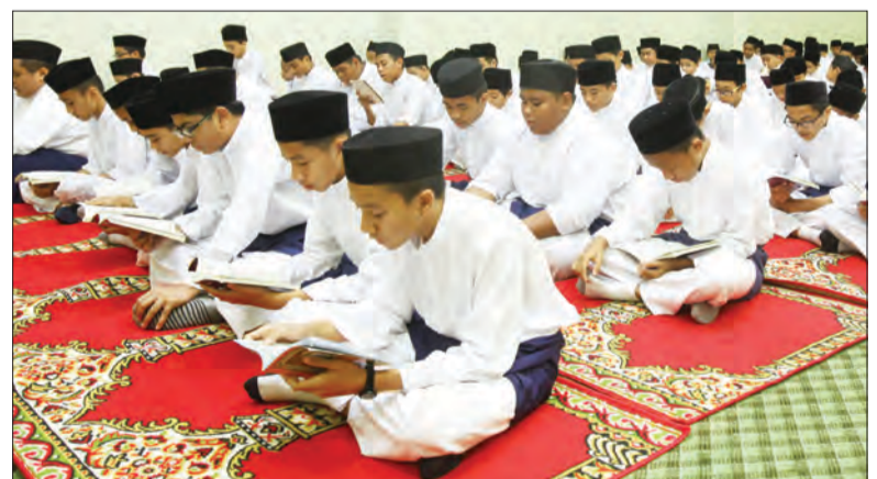
SEBAHAGIAN daripada murid-murid lelaki Sekolah Agama Pengiran Anak Puteri Hafizah Sururul Bolkihah yang hadir pada Program Keagamaan Senegara Persekolahan Ugama dan Arab Bagi Bulan Februari 1438 Hijrah / 2017 Masihi bagi Daerah Brunei dan Muara.

Pelajar dan warga sekolah juga diingatkan agar sentiasa mengamalkan kebersihan iaitu membersihkan mulut dengan bersuci sebelum membaca Al-Quran sewajarnya kerana membaca Al-Quran perlu dalam keadaan suci daripada hadas, membaca di tempat bersih, mengadap kiblat, membaca isti'azah apabila ingin memulakan bacaan, membaca Basmalah pada awal