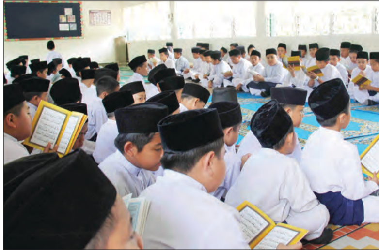
SEBAHAGIAN murid lelaki Darjah Pra hingga 6 Sekolah Ugama Bokok yang menyertai program keagamaan berkenaan.

Program bagi bulan ini diselenggarakan serentak di keempat-empat daerah bermula jam 8.00 pagi bagi sekolah-sekolah ugama sesi pagi dan sekolah-sekolah Arab dan jam 2.00 petang bagi semua sekolah ugama seluruh daerah.