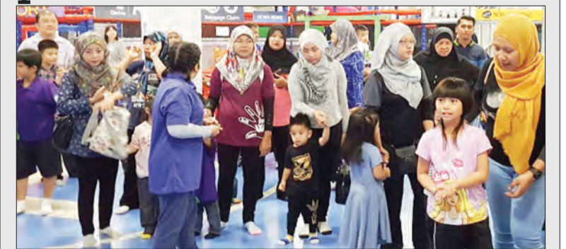
ANTARA pelajar Pusat Ehsan Al-Ameerah Al-Hajjah Maryam, Bengkurong yang membuat lawatan ke Funblock, di Kompleks Membeli-Belah Hua Ho Manggis.

Oleh : Rohani Haji Abdul Hamid