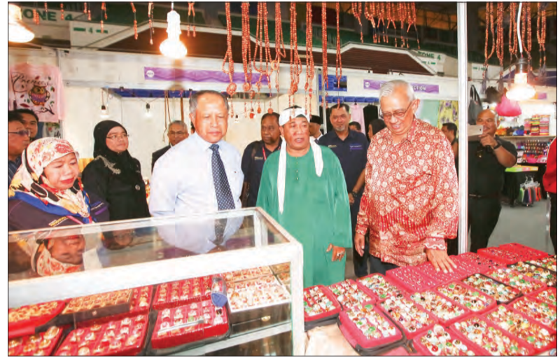
YANG Berhormat Menteri Kebudayaan, Belia dan Sukan semasa meninjau lebih dekat barang-barang yang dijual semasa karnival berkenaan.

Orang ramai yang berminat untuk mendaftar boleh mengunjungi laman sosial Facebook : Karnival Pengguna Antarabangsa Brunei atau berkunjung terus ke petak pameran A18 - PUIM.