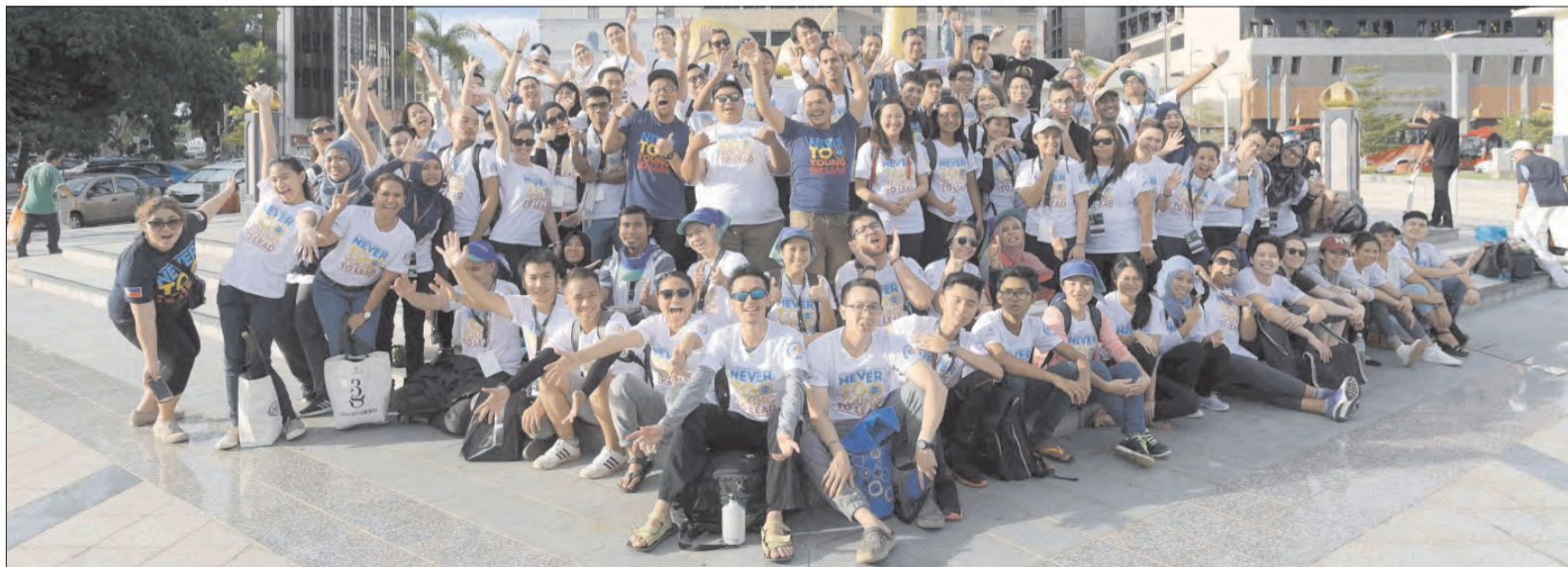
PARA peserta Bengkel Inisiatif Pemimpin Muda Asia Tenggara (YSEALI) Generasi Hijau semasa sesi gambar ramai di Dermaga Diraja, Bandar Seri Begawan sebelum membuat lawatan ke Kampung Eko Sumbiling di Temburong.

Untuk mengetahui lebih lanjut mengenai YSEALI, termasuk bagaimana untuk menyertainya, bolehlah melayari laman sesawang melalui https://asean.usmission.gov/yseali/ .