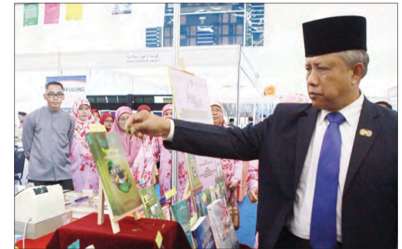
MENTERI Kebudayaan, Belia dan Sukan, Yang Berhormat Pehin Datu Lailaraja Mejar Jeneral (B) Dato Paduka Seri Haji Awang Halbi bin Haji Mohd. Yussof, juga selaku Jawatankuasa Tertinggi Sambutan Ulang Tahun Hari Kebangsaan Negara Brunei Darussalam Ke-33, Tahun 2017 melancarkan buku baharu terbitan Pusat Sejarah Brunei sempena Pesta Buku Brunei 2017.