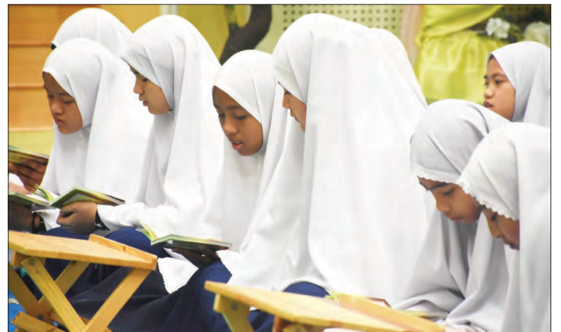
SEBAHAGIAN daripada pelajar perempuan Sekolah Ugama Kupang yang menghadiri program tersebut.

Di samping itu, ia juga bagi meningkatkan keterlibatan guru-guru agama khususnya dalam aktiviti kokurikulum, ia mendorong mereka menghadapi dunia sebenar apabila mereka bergaul dengan masyarakat.