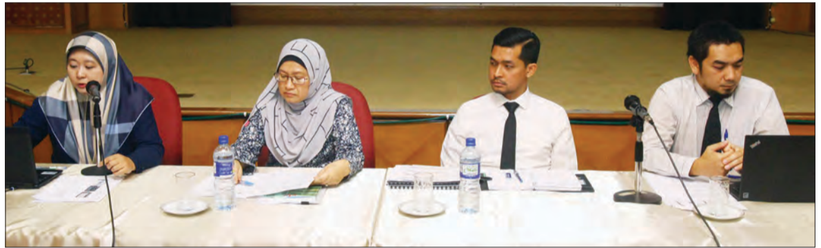
TAKLIMAT disampaikan oleh wakil-wakil dari jabatan-jabatan di bawah Kementerian Pembangunan.

Penguatkuasaan Kanun Tanah (Strata) Bab 189 telah bermula sejak 1 Julai 2009, walau bagaimanapun permohonan hak milik strata belum