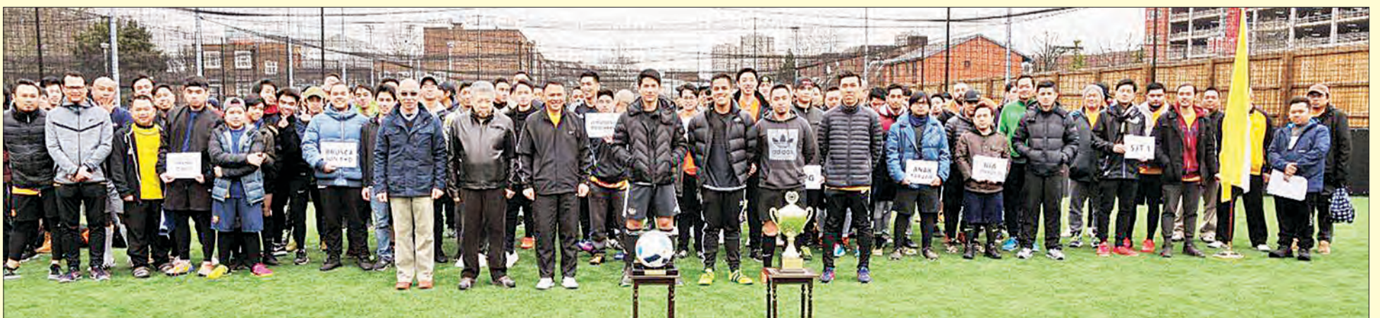
YTM Paduka Seri Duli Pengiran Muda 'Abdul Mateen berkenan bergambar ramai bersama pasukan-pasukan yang menyertai Kejohanan Futsal 6 Orang Sepasukan.