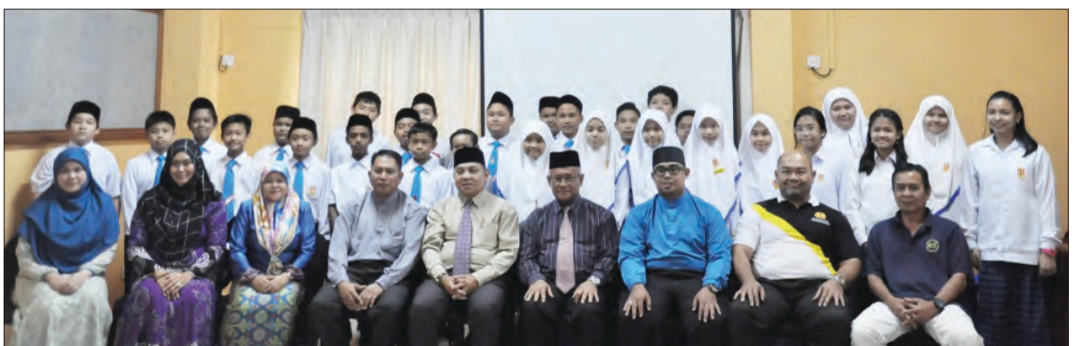
JABATAN Penerangan melalui Cawangan Penerangan Daerah Belait semasa mengadakan program Taklimat Menghayati Bendera dan Lagu Kebangsaan Negara Brunei Darussalam di Sekolah Saint James.

Sementara itu, Pelita Brunei juga berkesempatan mendapatkan pendapat