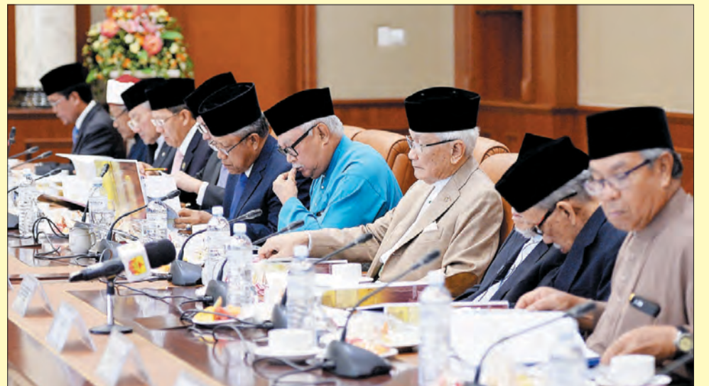
MESYUARAT Kedua Jawatankuasa Tertinggi Sambutan Jubli Emas Kebawah DYMM Paduka Seri Baginda Sultan dan Yang Di-Pertuan Negara Brunei Darussalam Menaiki Takhta menumpukan perbincangan kepada cadangan acara-acara yang akan diadakan bersempena Sambutan Jubli Emas itu nanti.