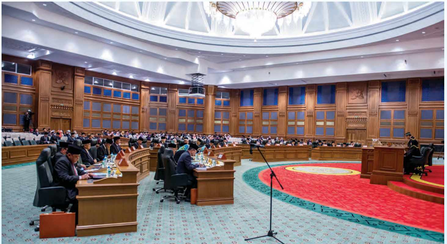
MENGIMBAS kembali suasana semasa berlangsungnya persidangan Majlis Pembukaan Persidangan Musim Permesyuaratan Ke-12 MMN 2016.

S ELURUH rakyat dan penduduk di negara ini akan mula menumpukan perhatian pada Majlis Mesyuarat Negara (MMN) bilamana Ahli-ahli MMN akan mula bersidang setelah mesyuarat dibuka rasmi pada 6 Mac ini nanti. Istiadat Pembukaan Rasmi Mesyuarat Pertama dari Musim Permesyuaratan Ke-13 MMN akan disempurnakan oleh Kebawah Duli Yang Maha Mulia Paduka Seri Baginda Sultan Haji Hassanal Bolkiah Mu'izzaddin Waddaulah ibni Al-Marhum Sultan Haji Omar 'Ali Saifuddien Sa'adul Khairi Waddien, Sultan dan Yang Di-Pertuan Negara Brunei Darussalam, bertempat di Dewan Persidangan MMN, Bangunan Dewan Majlis di Jalan Dewan Majlis.