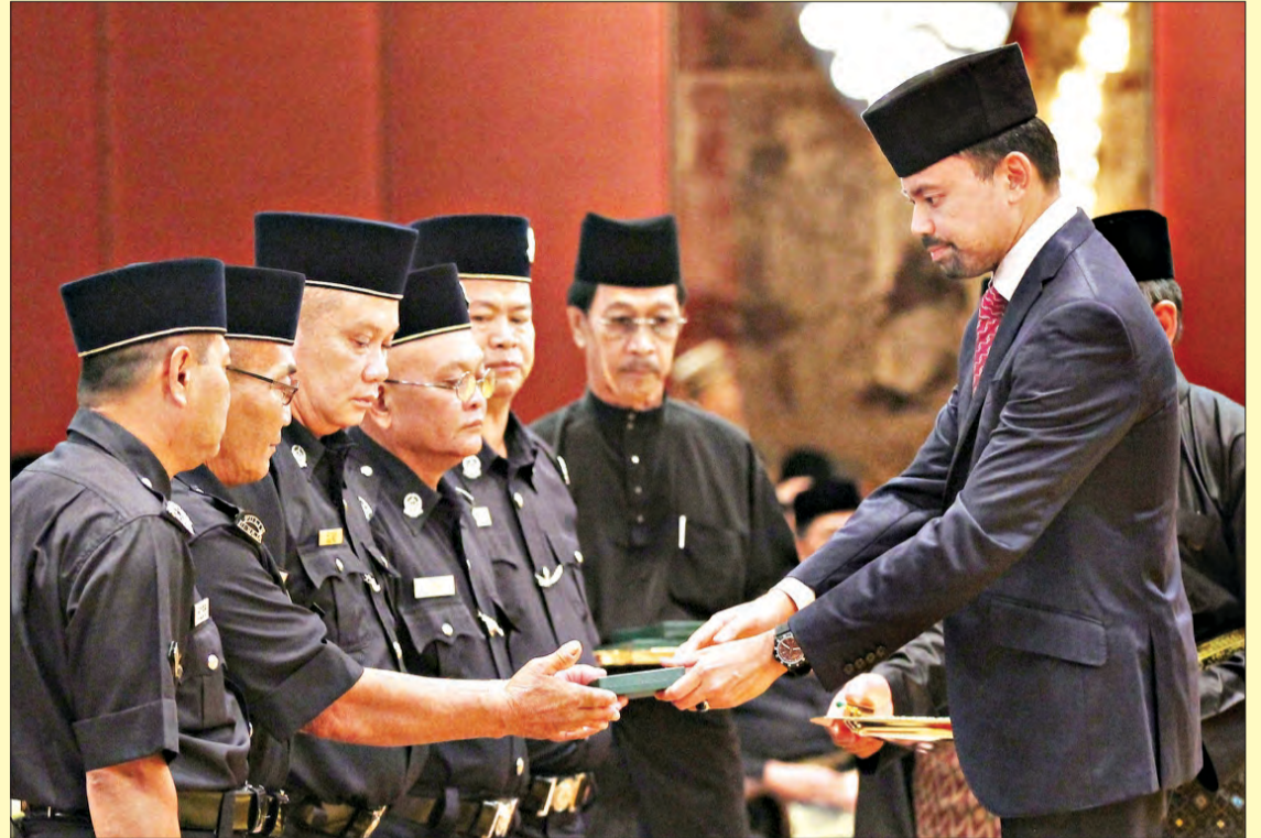
DULI Yang Teramat Mulia Paduka Seri Pengiran Muda Mahkota Pengiran Muda Haji Al-Muhtadee Billah ibni Kebawah Duli Yang Maha Mulia Paduka Seri Baginda Sultan Haji Hassanal Bolkiah Mu'izzaddin Waddaulah, Menteri Kanan di Jabatan Perdana Menteri (JPM) selaku Wakil Peribadi Kebawah Duli Yang Maha Mulia Paduka Seri Baginda Sultan dan Yang Di-Pertuan Negara Brunei Darussalam berkenan mengurniakan Pingat-Pingat Kehormatan Negara Brunei Darussalam kepada para penerima yang terdiri daripada pegawai dan kakitangan kerajaan sempena Hari Keputeraan Kebawah Duli Yang Maha Mulia Ke-70 Tahun.