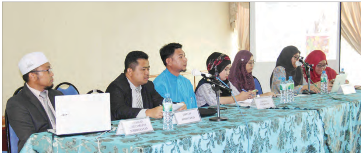
BEBERAPA taklimat telah disampaikan oleh Pegawai-Pegawai Kanan daripada Jabatan Pertanian dan Agrimakanan, Kementerian Sumber-sumber Utama dan Pelancongan.

Ita juga diharapkan akan dapat menambah kefahaman tentang betapa pentingnya mematuhi syarat-syarat yang telah disediakan oleh kerajaan bagi memudahkan urusan pengimportan dan pengeksportan komoditi-komoditi pertanian, perikanan serta perhutanan sama ada secara persendirian ataupun komersil.