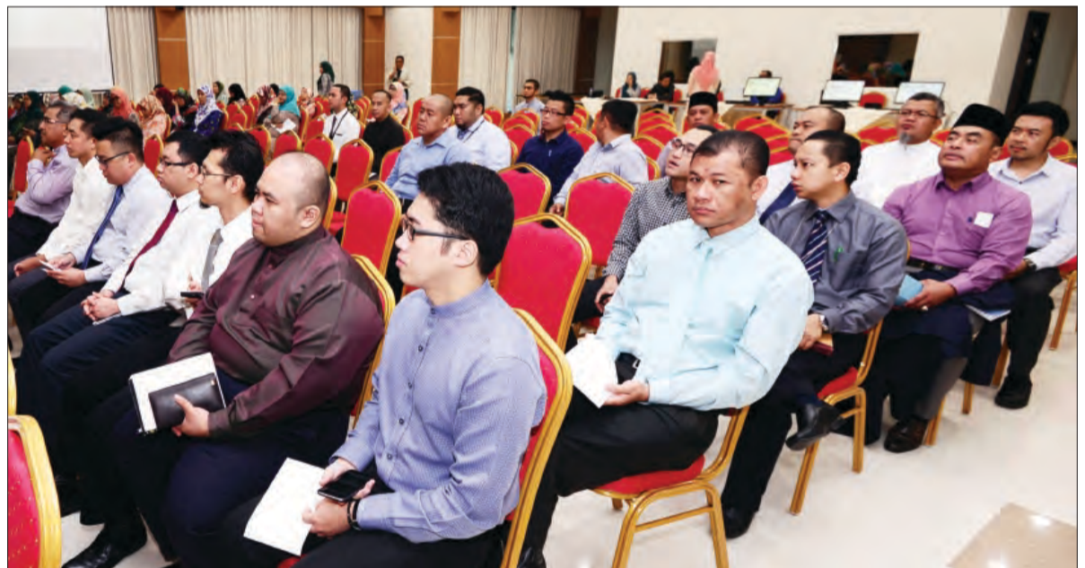
MAJLIS Sesi Perkongsian Anugerah Cemerlang Perkhidmatan Awam 2016 dihadiri oleh wakil-wakil dari kementerian dan jabatan-jabatan kerajaan serta syarikat-syarikat dan persatuan yang dijemput.

Projek ini adalah merupakan salah satu usaha pihak KHEU dalam menyumbang khidmat kemasyarakatan khususnya dalam memberi bantuan dan bimbingan kepada pesakit-pesakit dalam menunaikan tuntutan ibadat sembahyang sesuai dengan tuntutan syariat dengan keadaan dan kemampuan pesakit.