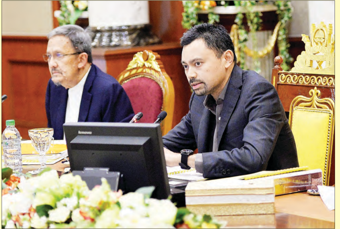
DULI Yang Teramat Mulia Paduka Seri Pengiran Muda Mahkota Pengiran Muda Haji Al-Muhtadee Billah ibni Kebawah Duli Yang Maha Mulia Paduka Seri Baginda Sultan Haji Hassanal Bolkiah Mu'izzaddin Waddaulah, Menteri Kanan di Jabatan Perdana Menteri (JPM), selaku Penaung Jawatankuasa Penasihat Sambutan Jubli Emas Kebawah DYMM Paduka Seri Baginda Sultan dan Yang Di-Pertuan Negara Brunei Darussalam Menaiki Takhta berkenan berangkat ke Mesyuarat Kedua Jawatankuasa Tertinggi Sambutan Jubli Emas Kebawah DYMM Paduka Seri Baginda Sultan dan Yang Di-Pertuan Negara Brunei Darussalam Menaiki Takhta. Berangkat sama, ialah Duli Yang Teramat Mulia Paduka Seri Pengiran Bendahara Seri Maharaja Permaisua Pengiran Muda Haji Sufri Bolkiah ibni Al-Marhum Sultan Haji Omar 'Ali Saifuddin Sa'adul Khairi Waddien, selaku Ahli Jawatankuasa Penasihat Sambutan Jubli Emas.

Turut menjunjung keberangkatan DYTMM Paduka Seri Pengiran Muda Mahkota ialah Pengerusi-Pengerusi Bersama Jawatankuasa Tertinggi Sambutan Jubli Emas, Menteri Hal Ehwal Dalam Negeri, Yang Berhormat Pehin Orang Kaya Seri Kerna Dato Seri Setia (Dr.) Haji Awang Abu Bakar bin Haji Apong; Mufti Kerajaan, Yang Berhormat Pehin Datu Seri Maharaja Dato Paduka Seri Setia (Dr.) Ustaz Haji Awang Abdul Aziz bin Juned dan Setiausaha Sulit dan Laila Rahsia Kebawah DYMM Paduka Seri Baginda Sultan dan Yang Di-Pertuan Negara Brunei Darussalam, Yang Berhormat Pehin Orang Kaya Shahbandar Dato Seri Setia Haji Awang Mohd. Nawawi bin Pehin Orang Kaya Shahbandar Haji Awang Mohd. Taha.