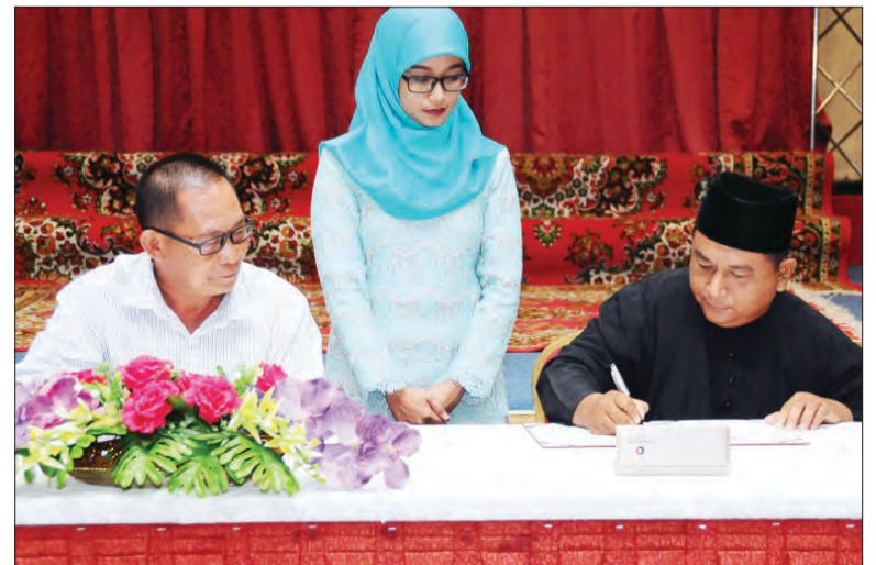
PENANDATANGANAN kontrak di antara salah seorang peserta kursus dengan salah seorang pengusaha jentera berat.

Terdahulu jelasnya, beliau mengikuti kursus ini sejak tahun lepas pada bulan September selama lima bulan dan sebelumnya, iaitu semester pertama di Pusat Latihan Mekanik tahun 2015.