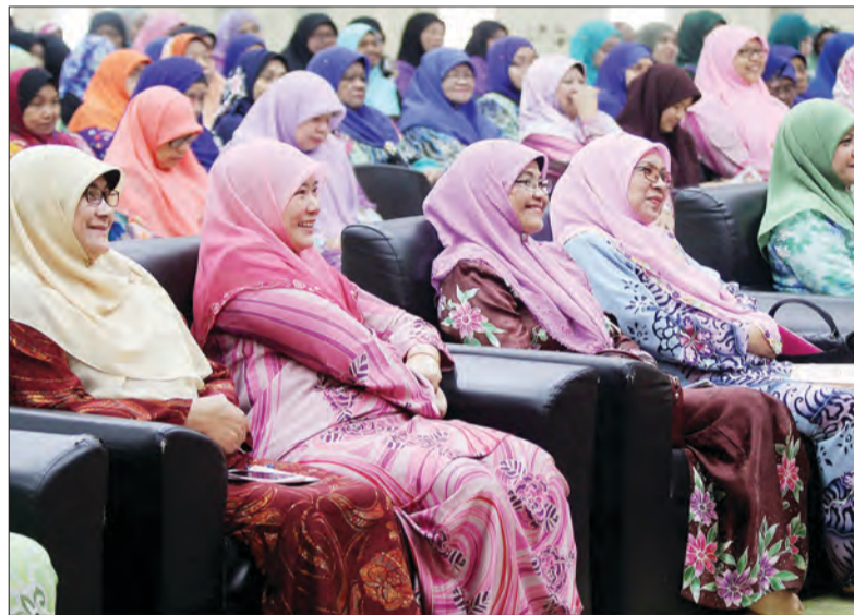
ISTERI Yang Berhormat Menteri Kebudayaan, Belia dan Sukan, Datin Hajah Kalshom binti Haji Suhaili (tiga, kiri) hadir selaku tetamu kehormat semasa forum sempena Sambutan Hari Kebangsaan Negara Brunei Darussalam Ke-33 bagi Kelas Bimbingan Muslimah di Masjid-Masjid Daerah Brunei dan Muara Tahun 1438H / 2017M yang diadakan di Dewan Serbaguna Sekolah Agama Pengiran Anak Puteri Mutawakkilah Hayatul Bolkihah, Kampung Serusop.

BANDAR SERI BEGAWAN , Isnin, 27 Februari. - Dalam memberi kesedaran dan kefahaman akan peranan Muslimah bagi mendukung Wawasan Negara Brunei Darussalam, satu forum sempena Sambutan Hari Kebangsaan Negara Brunei Darussalam Ke-33 bagi Kelas