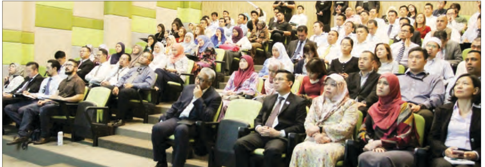
SEBAHAGIAN daripada pihak-pihak yang berkepentingan termasuk beberapa agensi kerajaan dan pengawalseliaan yang berkaitan, syarikat-syarikat teknologi, wakil-wakil industri kewangan dan para usahawan serta pelajar-pelajar institusi pendidikan tinggi yang hadir pada majlis tersebut.

"Tidak kira apa pun penghujung spektrum Syarikat-syarikat FinTech yang diambil, namun peranan AMBD tetap sama, iaitu memelihara kestabilan industri kewangan, pada masa yang sama memastikan kesejahteraan pelanggan dipelihara,"