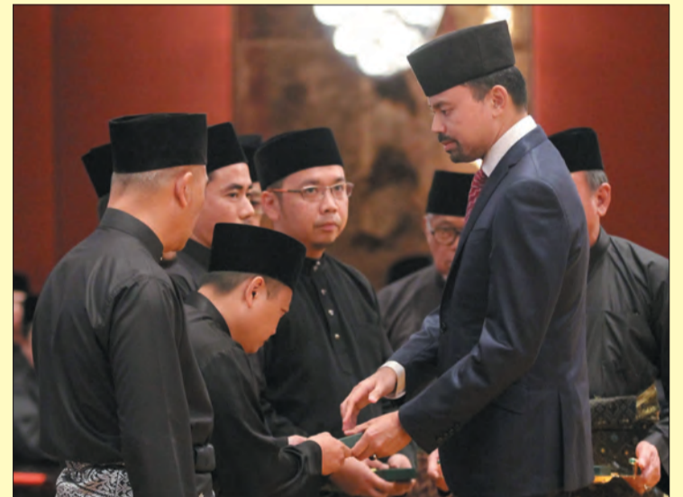
DULI Yang Teramat Mulia Paduka Seri Pengiran Muda Mahkota berkenan mengurniakan Pingat-Pingat Kehormatan Negara Brunei Darussalam kepada para penerima lelaki.