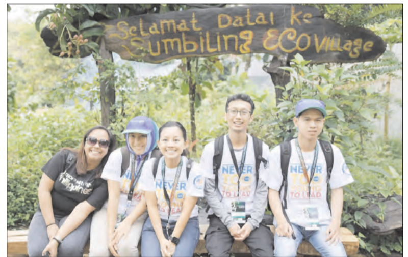
SEBAHAGIAN daripada peserta Bengkel YSEALI Generasi Hijau semasa bergambar di Kampung Eko Sumbiling.

Bengkel berkenaan ditaja oleh Jabatan Amerika Syarikat dan dibiayai melalui Perjanjian Kerjasama daripada Kedutaan Amerika Syarikat di Brunei Darussalam kepada AGREA bagi