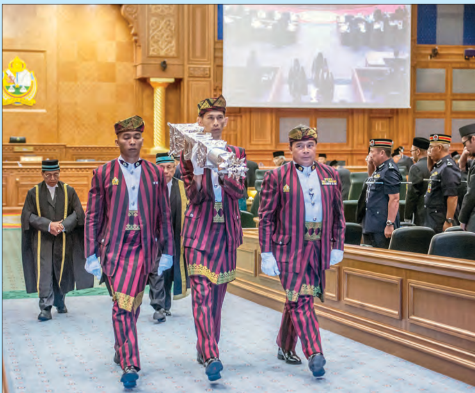
COKMAR akan dibawa masuk ke Dewan Persidangan setiap kali sebelum bermulanya persidangan.

- Petikan titah Kebawah Duli Yang Maha Mulia Paduka Seri Baginda Sultan dan Yang Di-Pertuan Negara Brunei Darussalam.