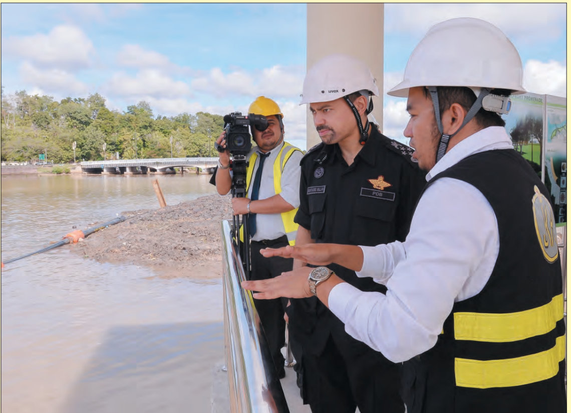
DYTM semasa berkenan mendengarkan sembah penerangan mengenai Projek Jeti Sumbiling.