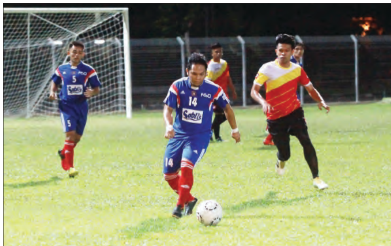
PEMAIN Kilanas FC (jersi biru) melarikan bola dari pemain MSN United FC (jersi oren).

Walau bagaimanapun, pasukan yang layak memasuki Liga Perdana Brunei DST 2017 adalah terdiri dari juara Kumpulan 'A', iaitu Tunas FC dan DSP United dari Kumpulan 'B', yang mana pembukaan perlawanan liga berkenaan akan diumumkan kemudian.