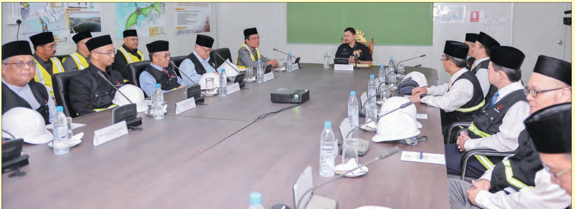
DULI Yang Teramat Mulia semasa berkenan berangkat dan disampaikan taklimat mengenai Projek Revitalisasi Kampung Ayer Zon 'A'.