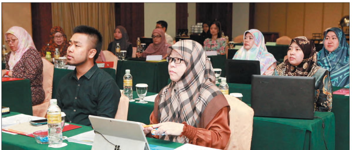
ANTARA pegawai Kementerian Pendidikan yang menyertai Bengkel 'Evidence Based Decision Making and Statistical Meta Analysis with Application'.

Beliau menambah, jabatan tersebut juga akan memperkembangkan lagi kapasiti sumber manusianya secara berterusan untuk menghasilkan penyelidikan dasar yang berkualiti dan mempunyai reputasi yang baik.