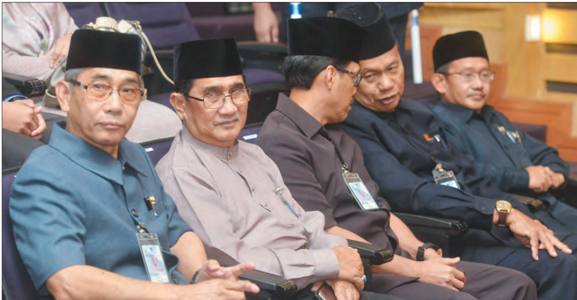
ANTARA Yang Berhormat Ahli-Ahli Majlis Mesyuarat Negara yang menghadiri Majlis Pelancaran dan Penyerahan Poster sempena Sambutan Hari Polis Ke-96 Tahun 2017 yang berlangsung di Auditorium Ibu Pejabat Polis Gadong.