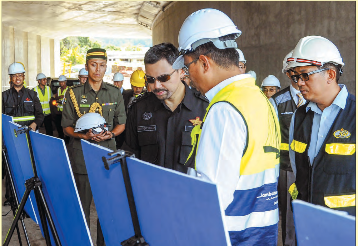
DULI Yang Teramat Mulia semasa berkenan disambahkan taklimat oleh Pemangku Pengarah Jalan Raya, JKR mengenai Projek Pembinaan Jambatan Penghubung dari Sungai Kebun ke Jalan Residency.

Dalam pada itu, lawatan kerja DYTM ke tapak-tapak projek RKN Ke-10 ini mencerminkan kepimpinan DYTM di dalam memastikan pelaksanaan projek-projek yang dirancang berjalan dengan lancar demi mendukung hasrat negara ke arah mencapai Wawasan Brunei 2035.