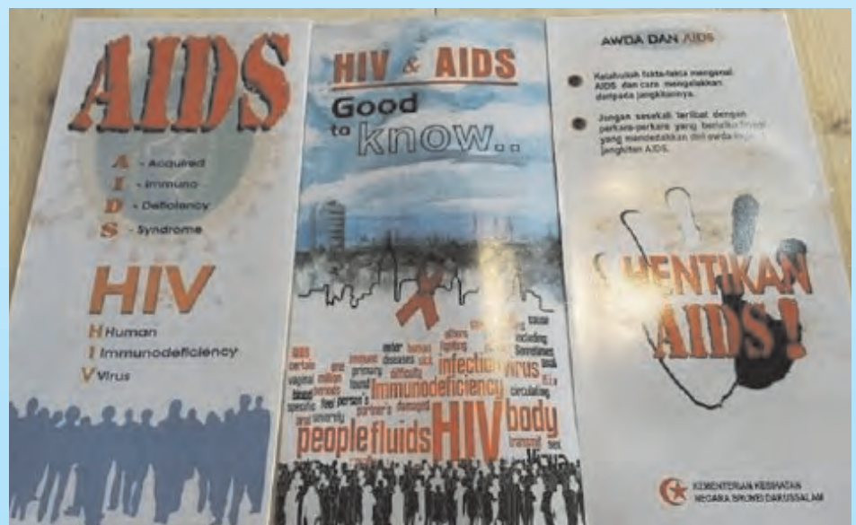
RISALAH-risalah yang telah diagih-agihkan kepada orang ramai sempena Program RED (Re-educate, Empower, Destigmatise) Leaflet Trail 2017.

Menurut laman sesawang mereka, objektif mereka adalah untuk menyebarkan maklumat mengenai HIV / AIDS di Negara Brunei Darussalam, serta membantu masyarakat menangani perkara-perkara yang berkaitan dan memberikan perkhidmatan profesional jika diperlukan. Untuk mewujudkan rangkaian dengan agensi-agensi kerajaan dan swasta di dalam dan luar negara termasuk kerja-kerja belia, kemasyarakatan dan sukarela secara umumnya.