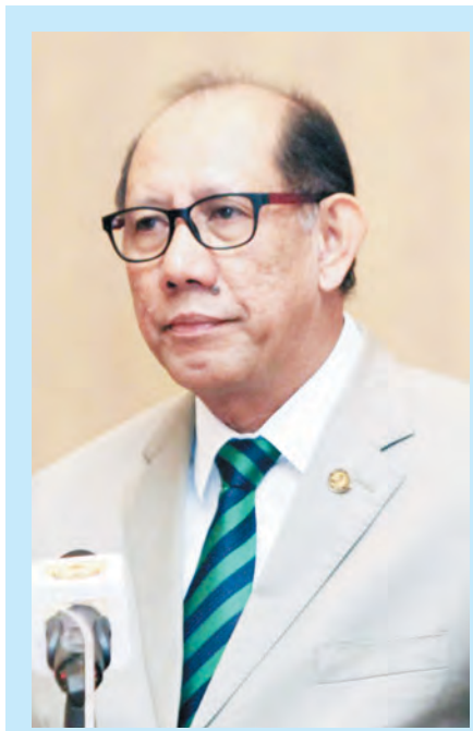
MENTERI Perhubungan, Yang Berhormat Dato Seri Setia Awang Haji Mustappa bin Haji Sirat semasa berucap pada Majlis Launching of Al-Hadid Commercial Diving Safety Seminar pada hari Selasa, 19 Rabiulakhir 1438 Hijrah / 17 Januari 2017 Masihi, di Indera Kayangan Ballroom, The Empire Hotel & Country Club.

Dengan bertumbuhnya sektor-sektor berkenaan, maka peluang-peluang pekerjaan sebagai commercial divers bukan hanya terbuka luas di dalam negara ini sahaja, tetapi