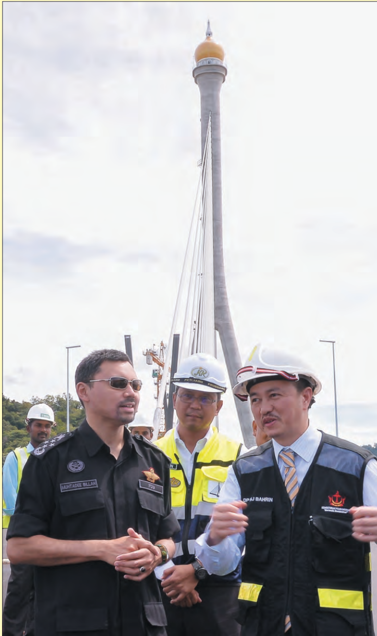
DULI Yang Teramat Mulia Paduka Seri Pengiran Muda Mahkota Pengiran Muda Haji Al-Muhtadee Billah ibni Kebawah Duli Yang Maha Mulia Paduka Seri Baginda Sultan Haji Hassanal Bolkiah Mu'izzaddin Waddaulah, Menteri Kanan di Jabatan Perdana Menteri semasa berkenan menerima sembah taklimat daripada Menteri Yang Berhormat Menteri Pembangunan mengenai Projek Jambatan Penghubung dari Sungai Kebun ke Jalan Residency.