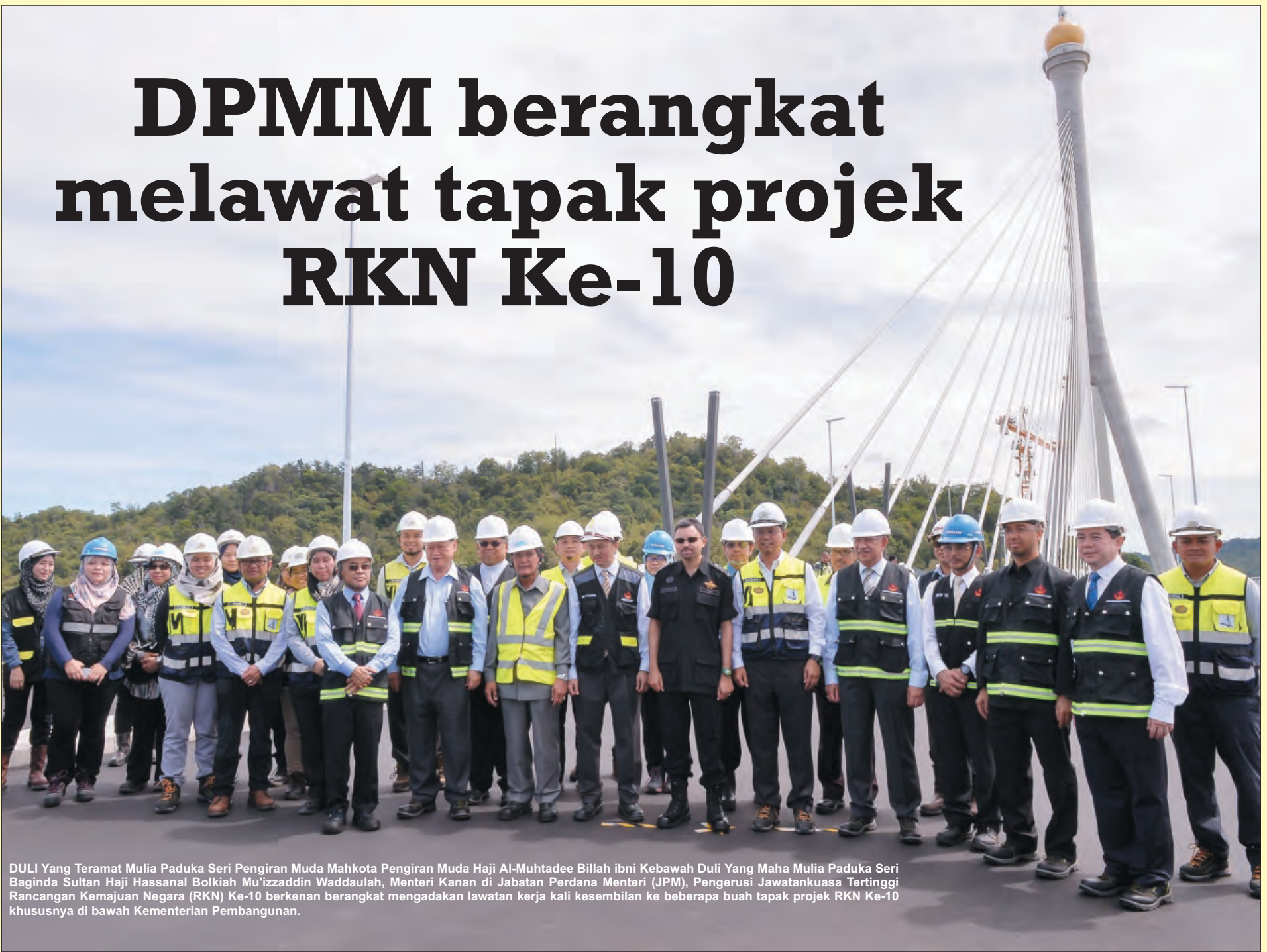
DULI Yang Teramat Mulia Paduka Seri Pengiran Muda Mahkota Pengiran Muda Haji Al-Muhtadee Billah ibni Kebawah Duli Yang Maha Mulia Paduka Seri Baginda Sultan Haji Hassanal Bolkiah Mu'izzaddin Waddaulah, Menteri Kanan di Jabatan Perdana Menteri (JPM), Pengerusi Jawatankuasa Tertinggi Rancangan Kemajuan Negara (RKN) Ke-10 berkenan berangkat mengadakan lawatan kerja kali kesembilan ke beberapa buah tapak projek RKN Ke-10 khususnya di bawah Kementerian Pembangunan.