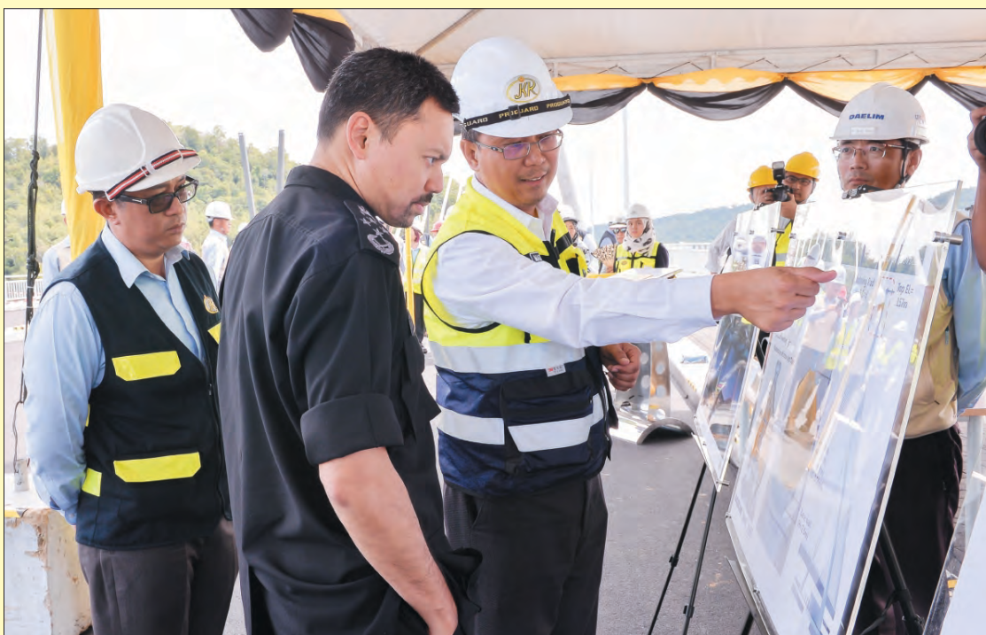
DYTM semasa berkenan mendengarkan sembah penerangan daripada Pemangku Pengarah Jalan Raya, JKR mengenai Projek Pembinaan Jambatan Penghubung dari Sungai Kebun ke Jalan Residency.

Residency; menyediakan ruang pejalan kaki seluas lapan meter; menyediakan pondok-pondok jeti yang lebih selesa dan selamat untuk kemudahan penduduk Kampung Ayer; pembangunan semula Gerai Makan Kianggeh; menyediakan 270 unit letak kereta yang teratur dan selesa; pemasangan lampu isyarat di persimpangan Jalan Subok dan Jalan Baru; membaik pulih stesen pam (PS6) yang sedia ada dan pemasangan lampu jalan.