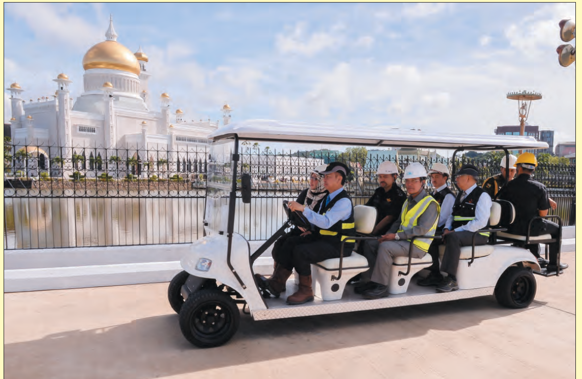
DULI Yang Teramat Mulia semasa berkenan berangkat dengan menggunakan buggy ke tapak Projek Revitalisasi Kampung Ayer Zon 'A'.

Antara skop kerja projek yang dilaksanakan di bawah Fasa 2 termasuk kerja-kerja utama, iaitu membina empat lorong dua hala dari Jambatan Sungai Kianggeh ke Bubungan Dua Belas; menaik taraf persimpangan Jalan Subok ke Jalan