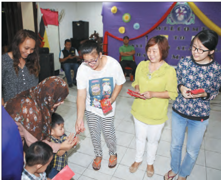
PARA pelajar Pusat Ehsan Al-Ameerah Al-Hajjah Maryam juga menerima sampul merah sempena Sambutan Tahun Baharu Cina.