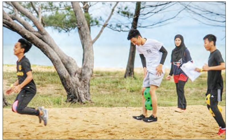
ANTARA permainan yang diadakan oleh KIGS.

KIGS Brunei akan terus berusaha dalam menghasilkan mahasiswa-mahasiswi yang berkualiti tinggi bagi membantu Brunei mencapai Wawasan Brunei 2035.