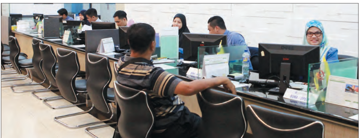
KAUNTER Darussalam Holdings Sdn. Bhd.

Pada akhir lawatan ilmiah itu nanti, mahasiswa dan mahasiswi diharap akan dapat mempelajari sendiri mengenai pengurusan sesebuah persatuan yang berkaitan dengan SHALAWSOC dengan lebih teratur dan teliti.