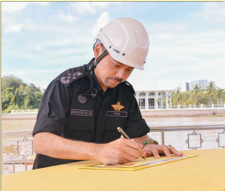
DULI Yang Teramat Mulia Paduka Seri Pengiran Muda Mahkota Pengiran Muda Haji Al-Muhtadee Billah ibni Kebawah Duli Yang Maha Mulia Paduka Seri Baginda Sultan Haji Hassanal Bolkiah Mu'izzaddin Waddaulah, Menteri Kanan di Jabatan Perdana Menteri semasa berkenan menandatangani Lembaran Kenangan.