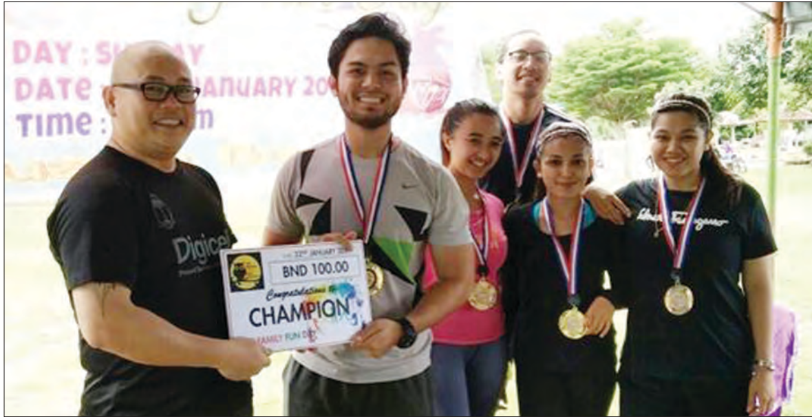
KUMPULAN juara yang menerima hadiah sempena Hari Keluarga Kolej International Graduate Studies (KIGS).