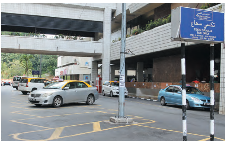
SALAH sebuah tempat teksi yang disediakan di ibu negara.

ini perlu mengamalkan sikap ramah mesra kepada pelancong bagi meningkatkan keyakinan para pelancong dan orang ramai seperti teksi-teksi yang ada di luar negara yang begitu ramah mesra bersama pelanggannya.