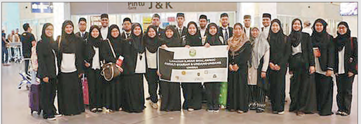
SERAMAI 22 mahasiswa dan mahasiswi Fakulti Syariah dan Undang-Undang, Universiti Islam Sultan Sharif Ali mengikuti lawatan ilmiah ke Malaysia yang dikendalikan oleh Persatuan Mahasiswa juga Mahasiswi Syariah dan Undang-Undang.

Siaran Akhbar dan Foto : Universiti Islam Sultan Sharif Ali