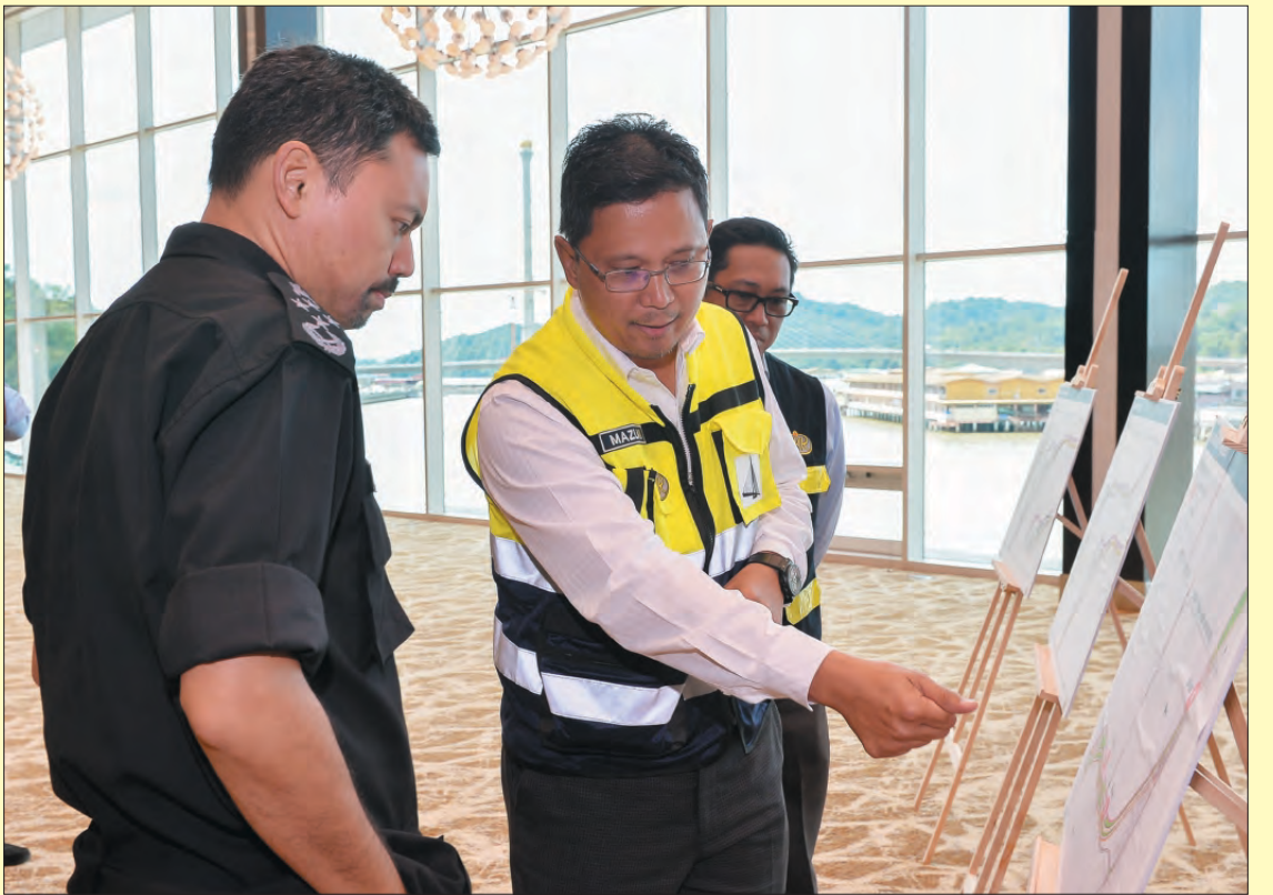
DYTM semasa berkenan mendengarkan sembah taklimat daripada Pemangku Pengarah Jalan Raya, JKR mengenai Projek Pembesaran Jalan Residency (Fasa 2).