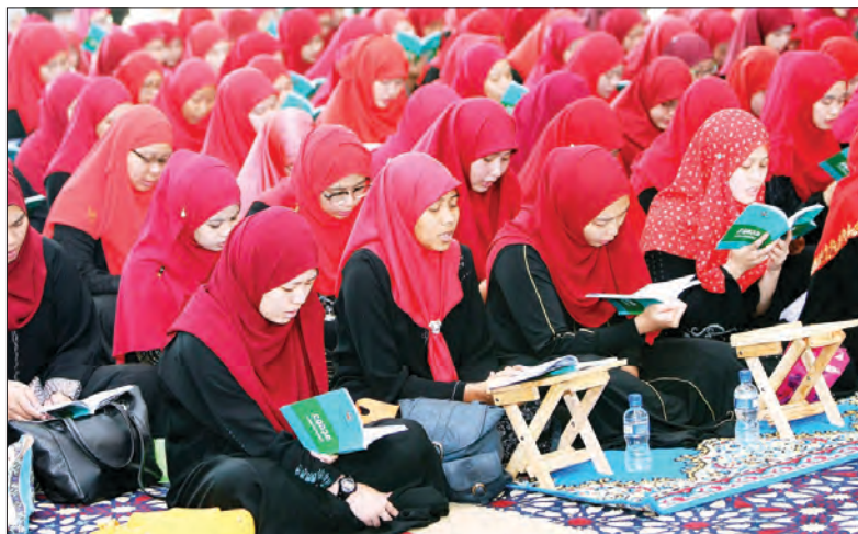
SEBAHAGIAN daripada bakal graduan pelajar lelaki dan perempuan yang turut serta dalam Majlis Khatam Al-Quran sempena Majlis Konvokesyen Politeknik Brunei Ke-3 Tahun 2017.