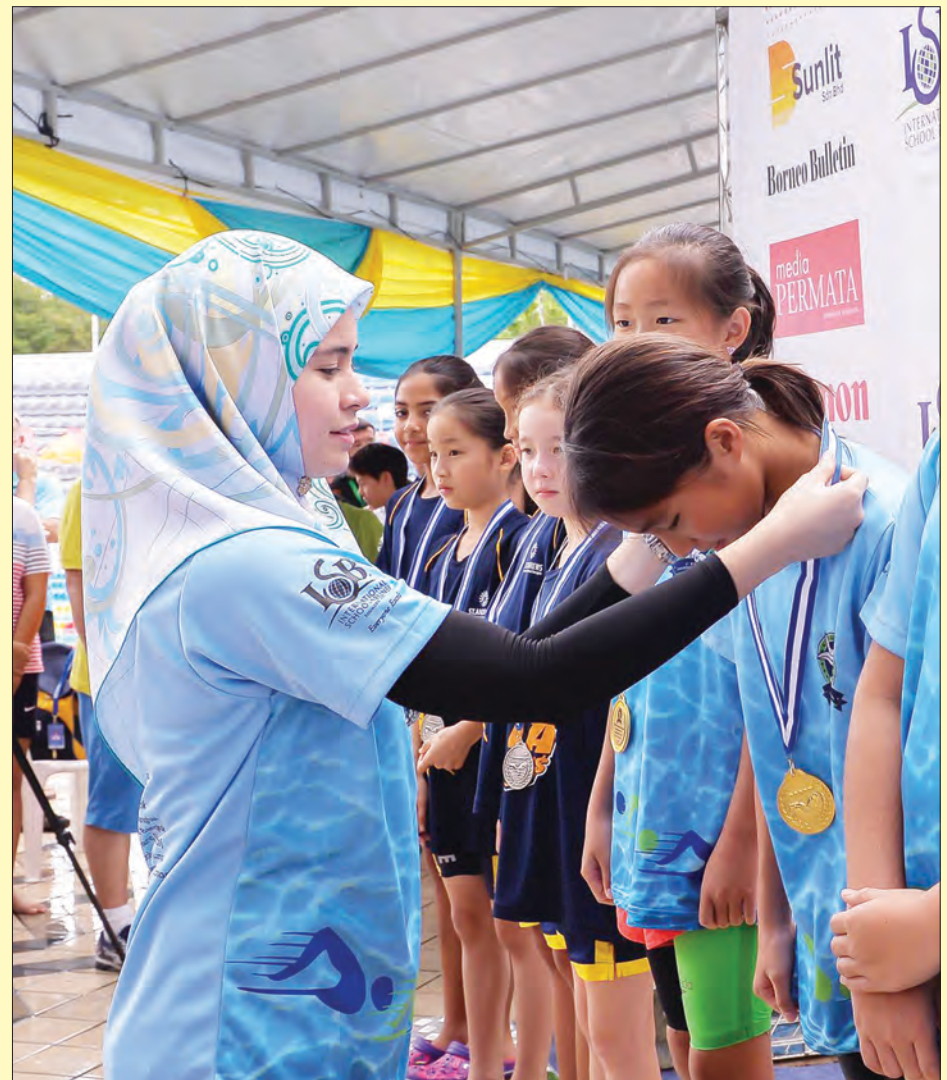
YANG Teramat Mulia Paduka Seri Pengiran Anak Isteri Pengiran Anak Sarah binti Pengiran Haji Salleh Ab. Rahaman berkenan bergambar kenangan bersama paduka-paduka anakanda, Yang Teramat Mulia Pengiran Muda 'Abdul Muntaqim dan Yang Teramat Mulia Pengiran Anak Muneerah Madhul Bolkiah ketika berangkat menyaksikan Kejohanan Renang Jemputan Federation of British International Schools in Asia (FOBISIA) Ke-3 hari terakhir.