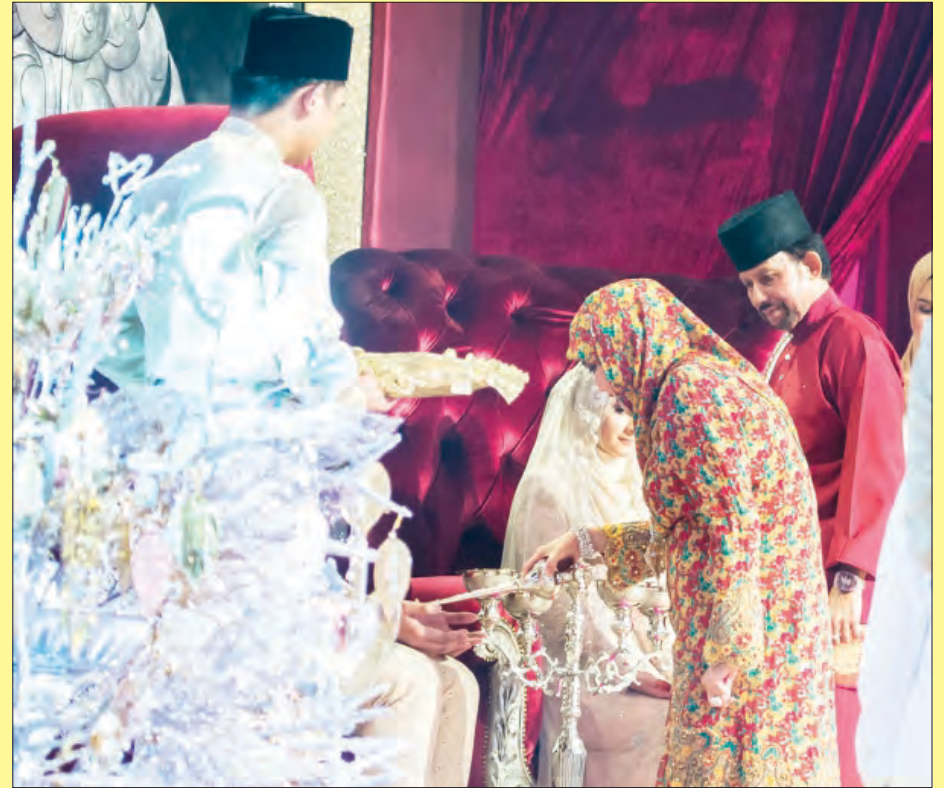
KEBAWAH Duli Yang Maha Mulia Paduka Seri Baginda Sultan Haji Hassanal Bolkiah Mu'izzaddin Waddaulah, Sultan dan Yang Di-Pertuan Negara Brunei Darussalam dan Kebawah Duli Yang Maha Mulia Paduka Seri Baginda Raja Isteri Pengiran Anak Hajah Saleha dijunjung untuk memulakan Acara Merenjjis.