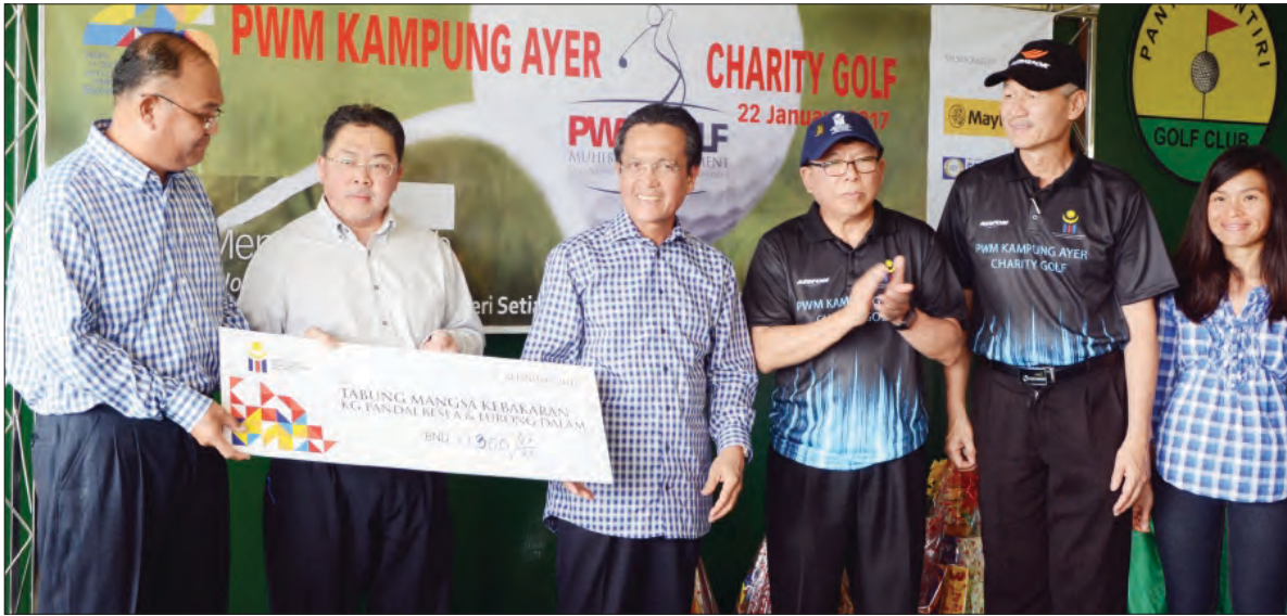
MENTERI Hal Ehwal Dalam Negeri, Yang Berhormat Pehin Orang Kaya Seri Kerna Dato Seri Setia (Dr.) Haji Awang Abu Bakar bin Haji Apong (tiga, kiri) menyerahkan replika cek derma kepada JAPEM sambil disaksikan oleh Presiden PWM dan pengerusi acara berkenaan.

Ia bertujuan untuk meningkatkan hubungan dengan masyarakat tempatan juga menjalani kehidupan yang sihat.