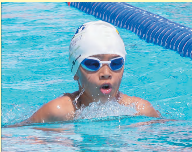
YANG Teramat Mulia Pengiran Muda 'Abdul Muntaqim ibni Duli Yang Teramat Mulia Paduka Seri Pengiran Muda Mahkota Pengiran Muda Haji Al-Muhtadee Billah semasa menyertai Acara Kuak Dada.

Dalam pada itu, FOBISIA ditubuhkan pada tahun 1988 dengan hanya seramai lima ahli dan kini federasi tersebut sudah mempunyai sebanyak 52 buah sekolah antarabangsa, di bawah Kurikulum British di seluruh Asia yang menyediakan platform bagi sekolah-sekolah antarabangsa untuk terhubung, berkongsi sama amalan terbaik, serta memberikan peluang untuk mengadakan pertandingan di antara sekolah melalui program pembangunan kerjasama.