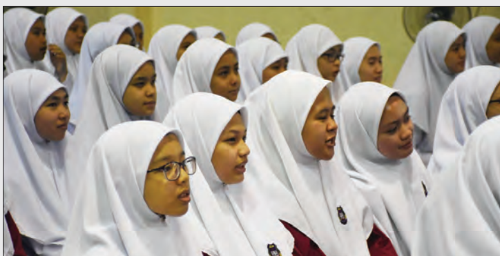
ANTARA pelajar perempuan yang menghadiri Jerayawara Kenali ASEAN yang berlangsung di Dewan Maktab Sains Paduka Seri Begawan Sultan, Berakas.

Program ini adalah salah satu usaha berterusan Jabatan Penerangan untuk mengukuhkan hubungan antara Jabatan Penerangan dengan masyarakat khususnya penuntut di Negara Brunei Darussalam.