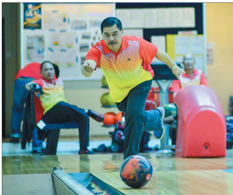
SEBAHAGIAN daripada aksi semasa perlawanan Boling Kingston Trios League yang berlangsung di i-Bowl Utama, Batu Satu.

Oleh : Dk. Siti Redzaimi Pg. Haji Ahmad