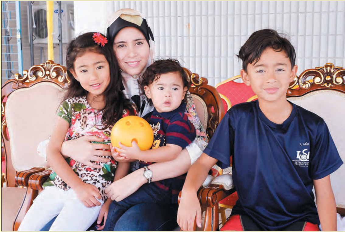
YANG Teramat Mulia Paduka Seri Pengiran Anak Isteri Pengiran Anak Sarah binti Pengiran Haji Salleh Ab. Rahaman berkenan berangkat menyaksikan Kejohanan Renang Jemputan Federation of British International Schools in Asia (FOBISIA) Ke-3. Juga berangkat, Yang Teramat Mulia Pengiran Muda 'Abdul Muntaqim, Yang Teramat Mulia Pengiran Anak Muneerah Madhul Bolkih dan Yang Teramat Mulia Pengiran Muda Muhammad Aiman.

BANDAR SERI BEGAWAN, Sabtu, 21 Januari. - Yang Teramat Mulia Paduka Seri Pengiran Anak Isteri Pengiran Anak Sarah binti Pengiran Haji Salleh Ab. Rahaman berkenan berangkat menyaksikan Kejohanan Renang Jemputan Federation of British International Schools in Asia (FOBISIA) Ke-3.