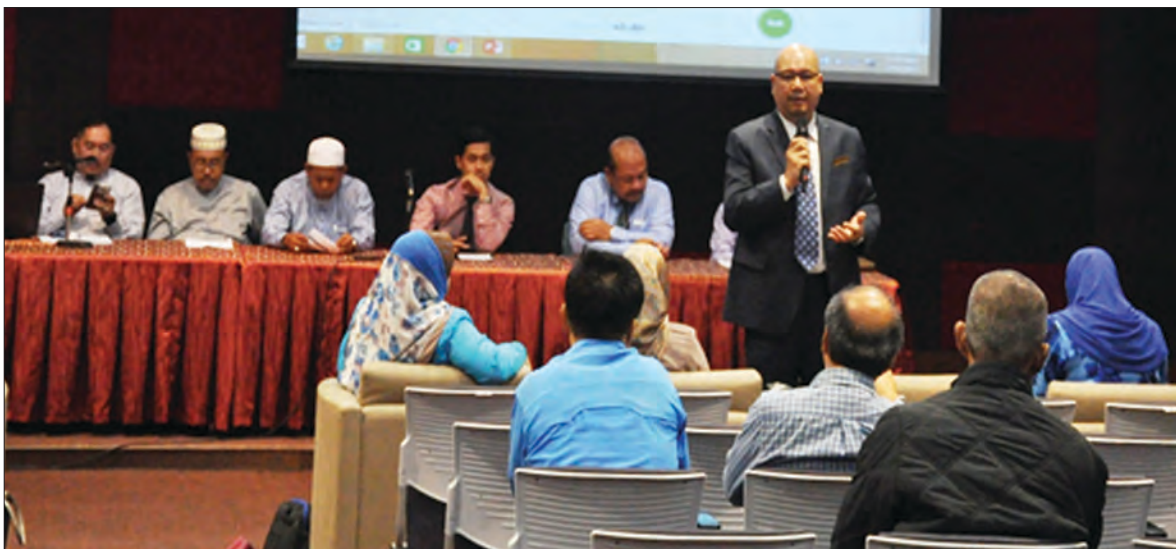
SESI dialog di antara Pihak Berkuasa Yang Layak Kawalan Pemecahan dan Penyatuan Tanah dan Juruukur Tanah Berlesen (LLS) memberi peluang khususnya kepada pemohon LLS untuk berinteraksi dan mengadakan perhubungan dua hala dengan agensi kerajaan yang berkenaan bagi membincangkan isu-isu semasa yang dihadapi.

Siaran Akhbar dan Foto : Jabatan Perancang Bandar dan Desa