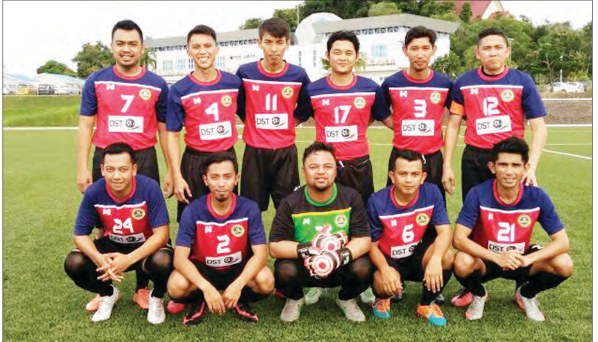
PARA pemain pasukan Hawa FT semasa bergambar ramai.