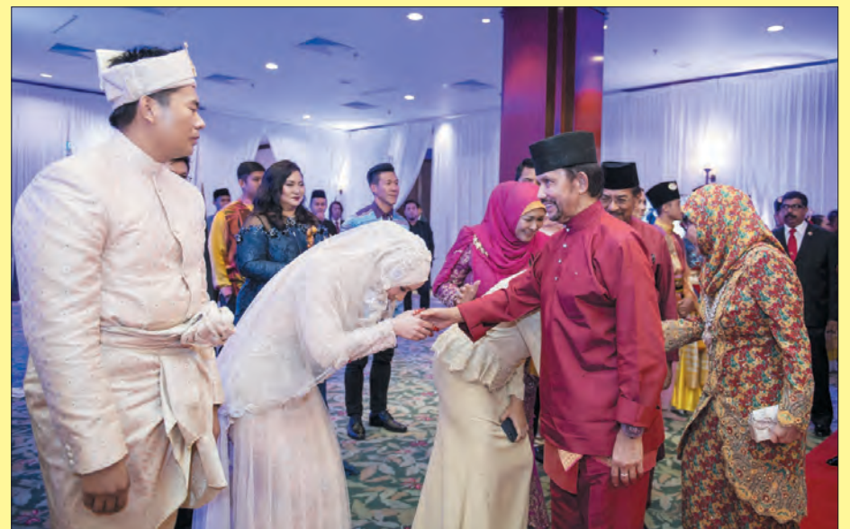
KEBAWAH Duli Yang Maha Mulia Paduka Seri Baginda Sultan dan Yang Di-Pertuan Negara Brunei Darussalam ketika berbual mesra bersama Ketua Menteri Sabah, Yang Amat Berhormat Dato Seri Paduka Datuk Seri Panglima Haji Musa bin Haji Aman.