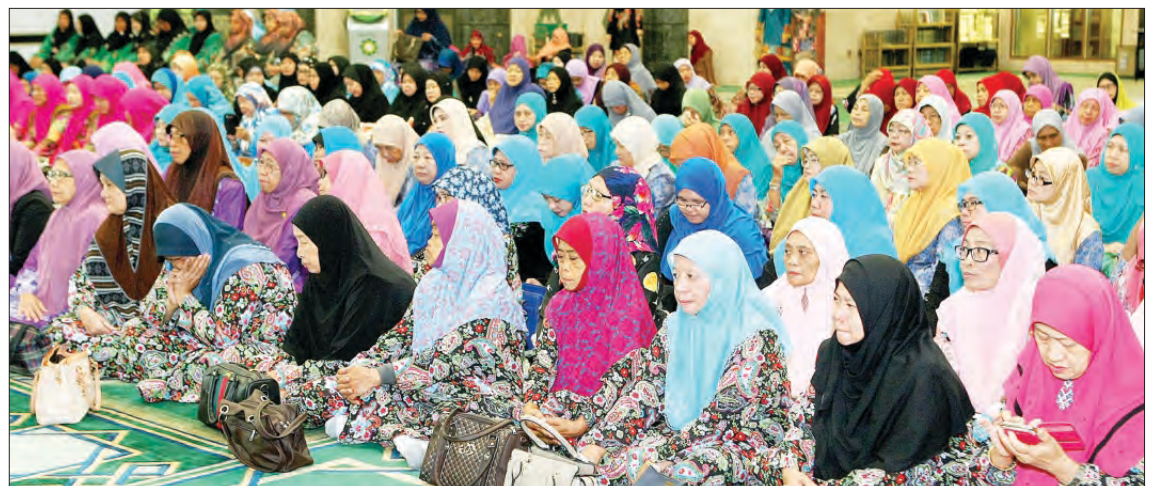
ANTARA jemputan yang hadir pada majlis tersebut.

Ahli Jawatankuasa Takmir Masjid Al-Ameerah Al-Hajjah Maryam, bertujuan untuk menyemarakkan lagi sambutan Maulud Nabi Muhammad Sallallahu Alaihi Wassalam dan sama-sama berpatisipasi dalam mengembangkan syiar Islam, selain memakmurkan masjid dan mengeratkan lagi silaturahim dalam kalangan pegawai dan kakitangan KHEU dengan jemaah masjid dan penduduk kampung khususnya wanita.