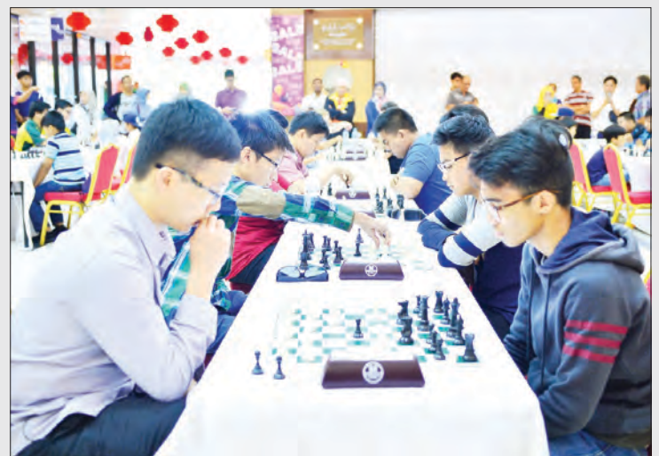
PEMBUKAAN Kejohanan Catur Piala 'Mindquest Intersivity' yang buat julung kalinya bertempat di Times Square, Berakas.

Oleh : Dk. Siti Redzaimi Pg. Haji Ahmad