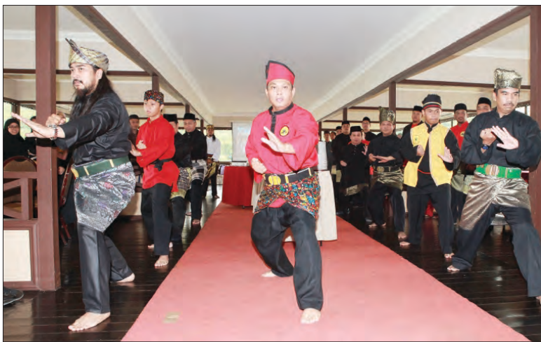
PERSEMBAHAN seni silat daripada Ahli-ahli Seni Pencak Silat Gerak 41.

Antara gelanggang yang pernah dibuka atau aktif menjalankan latihan ialah Gelanggang Khas : Gelanggang Berjasa (Kampung Setia 'B') dan Gelanggang Guru Tua (Kampung Burung Lepas); Gelanggang Pusat, iaitu Gelanggang Guru Utama (Gelanggang Tawakkal, Kampung Mata-mata); Gelanggang Ahli yang sebahagiannya terdiri dari Gelanggang Seri Kemanca, Indera Perkasa, Cahaya Kilat, Samudera, Pusat Belia, Kelab PPMM, Kampung Bengkurong, Mukim Amo dan lain-lain serta Gelanggang Swasta yang dijalankan oleh EMPOWERIOR Silat Academy (Brain Warrior dan Head Strong) terletak di Kiulap.