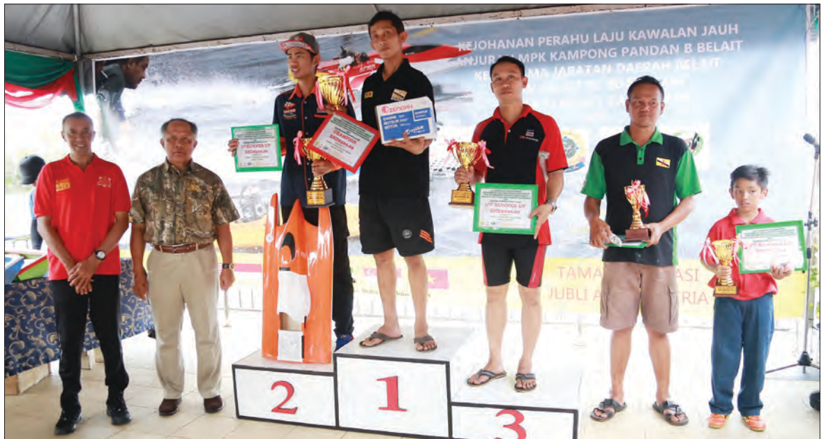
MENTERI Kebudayaan, Belia dan Sukan, Yang Berhormat Pehin Datu Lailaraja Mejar Jeneral (B) Dato Paduka Seri Haji Awang Halbi bin Haji Mohd. Yusof (dua, kiri) bergambar bersama para pemenang.