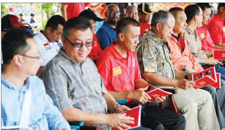
YANG Berhormat Menteri Kebudayaan, Belia dan Sukan hadir selaku tetamu kehormat pada acara akhir Kejohanan Lumba Perahu Laju Kawalan Jauh di Taman Rekreasi Jubli Anduki, Seria.

kerjasama Jabatan Daerah Belait, Belait RC Boat Team dan Syarikat Zainurrah Kuala Belait.