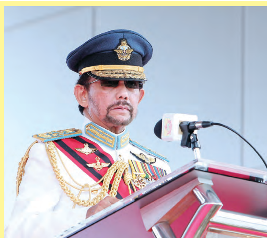
TITAH Kebawah Duli Yang Maha Mulia Paduka Seri Baginda Sultan Haji Hassanal Bolkiah Mu'izzaddin Waddaulah ibni Al-Marhum Sultan Haji Omar 'Ali Saifuddien Sa'adul Khairi Waddien, Sultan dan Yang Di-Pertuan Negara Brunei Darussalam sempena Upacara Sovereign's Parade Pengambilan Ke-15 Sekolah Pegawai Kadet, Akademi Pertahanan Angkatan Bersenjata Diraja Brunei (AP ABDB) pada hari Khamis, 21 Rabiulakhir 1438 Hijrah bersamaan 19 Januari 2017 Masihi bertempat di Padang Kawad AP ABDB, Kampung Tanah Jambu.

Kerjasama latihan di antara Sekolah Pegawai Kadet AP ABDB dengan sekolah-sekolah Pegawai Kadet luar negara juga adalah berguna. Latihan dua hala di peringkat awal dengan angkatan-angkatan tentera negara sahabat, terutama di kalangan negara-negara ASEAN, adalah mampu untuk mengukuhkan