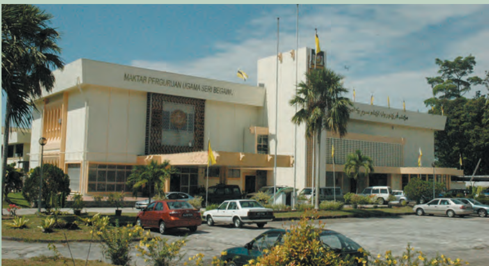
INSTITUT Pengajian Islam Brunei Darussalam memulakan operasinya dengan meminjam sebahagian daripada bangunan Maktab Perguruan Ugama Seri Begawan pada tahun 1988.