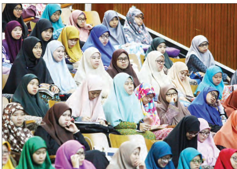
ANTARA yang hadir pada forum bertajuk 'Meningkatkan Pengajaran Inovatif dalam Pendidikan Islam : Cabaran Abad Ke-21' di Dewan Tarbiyyah, kolej berkenaan.

Menerusi forum itu diharap dapat memberikan kesan positif kepada pihak-pihak yang berkepentingan juga sebagai satu hala tuju dalam merealisasikan harapan dan wawasan negara dalam bidang pendidikan Islam dan perguruan agama.