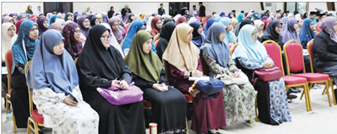
SERAMAI 300 orang terdiri daripada para pegawai dan kakitangan serta mahasiswa / mahasiswi UNISSA yang hadir pada majlis tersebut.

Pada akhir program, para mahasiswa / mahasiswi berpeluang mengajukan beberapa persoalan pada sesi soal jawab bersama penceramah.