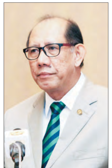
MENTERI Perhubungan, Yang Berhormat Dato Seri Setia Awang Haji Mustappa bin Haji Sirat semasa berucap pada Majlis Seminar Komersial bagi Keselamatan Menyelam.

"Berlandaskan kepada kepentingan ini juga, saya sangat menghargai inisiatif Al-Hadid Marine Services yang telah dapat menyumbang kepada pembangunan modal insan di kalangan anak tempatan, dengan adanya profesional yang terlatih dan berkepakaran di syarikat ini," ujarnya.