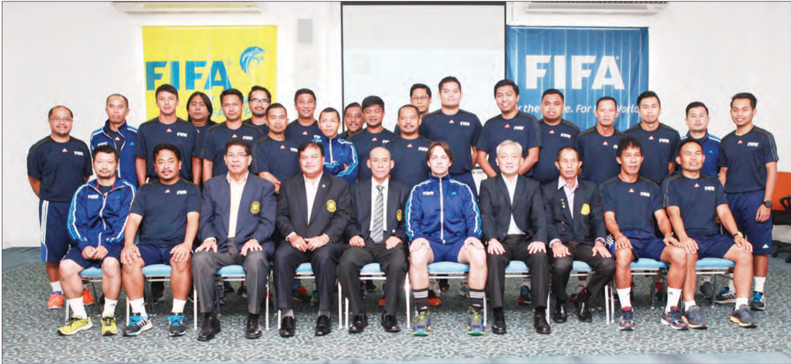
Pemangku Timbalan Presiden NFABD (lima, kiri) bergambar kenangan bersama para peserta kursus.

Beliau seterusnya berharap agar para peserta kursus akan bekerja keras dalam menjalani kursus yang sangat berguna ini dan berharap ianya menjadi permulaan dalam perkembangan bola sepak di negara ini.