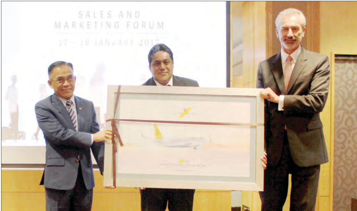
MENTERI Sumber-Sumber Utama dan Pelancongan, Yang Berhormat Dato Seri Setia Awang Haji Ali bin Haji Apong (kiri) menerima cenderahati semasa Majlis Perasmian Forum Pengurusan dan Pemasaran Royal Brunei (RB) 2017.

Oleh : Dk. Siti Redzaimi Pg. Haji Ahmad