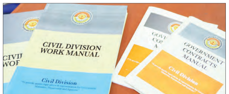
Civil Division Work Manual dan Government Contracts Manual yang dilancarkan.

Manual kontrak kerajaan juga boleh diperolehi di laman sesawang PPN di http://www.agc.gov.bn .