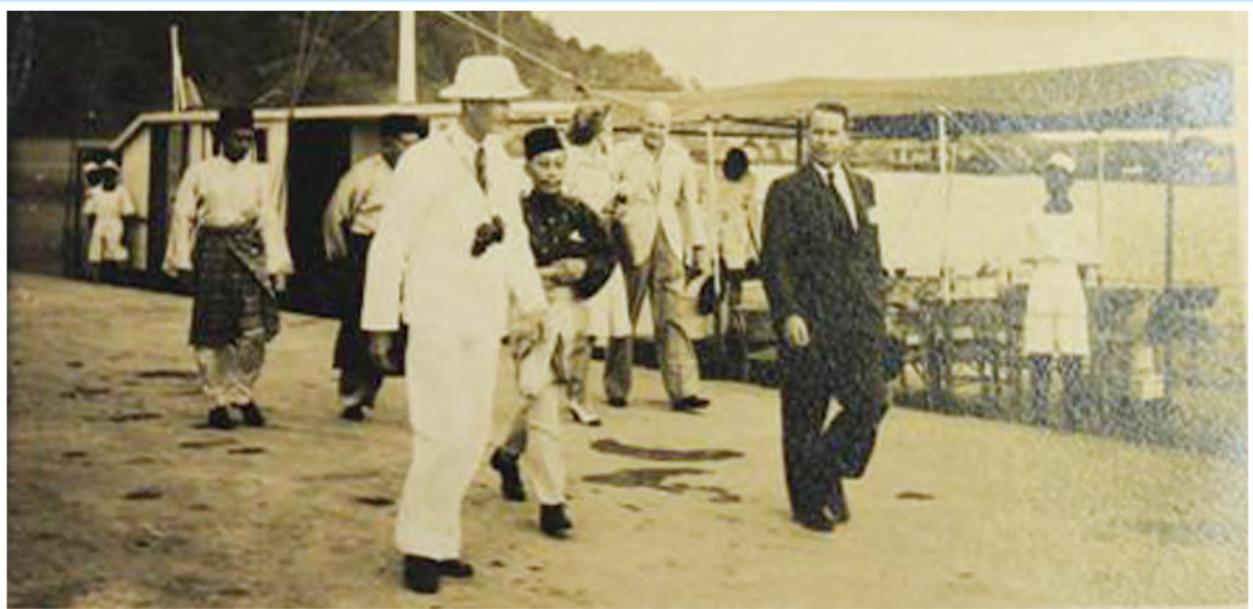
KEDATANGAN Pesuruhjaya Tinggi British bagi Asia Tenggara, Mr. Malcolm Mac Donald yang disambut oleh Sultan Ahmad Tajuddin Khairi Akhazul Waddien.