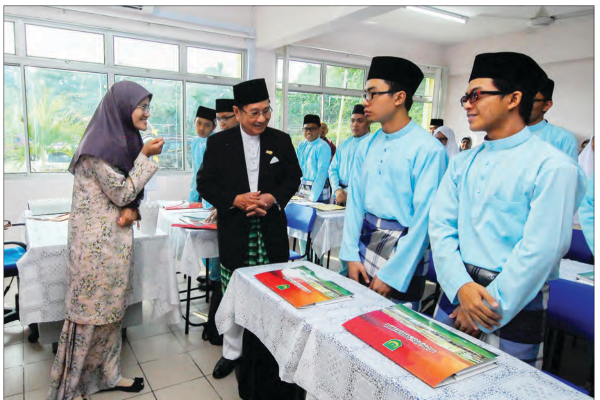
MENTERI Hal Ehwal Ugama, Yang Berhormat Pehin Udana Khatib Dato Paduka Seri Setia Ustaz Haji Awang Badaruddin semasa melawat ke kelas-kelas Pra U1 dan beramah mesra dengan penuntut SMALHB sesi pangajian 1438H/2017M.

Seramai 347 pelajar berjaya masuk ke Pra-U 1 di SMALHB tahun ini, iaitu 190 pelajar dalam jurusan Syariah, 88 orang pelajar dalam Jurusan Usuluddin, 21 pelajar dalam Jurusan Lughah Arabiah (Bahasa Arab), 20 pelajar dalam Jurusan Umum 1 dan 28 orang pelajar dalam Jurusan Umum 2.