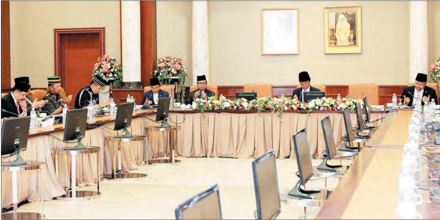
MESYUARAT Pertama Jawatankuasa Kebangsaan Sambutan Perayaan Ulang Tahun Keputeraan Kebawah Duli Yang Maha Mulia Paduka Seri Baginda Sultan dan Yang Di-Pertuan Negara Brunei Darussalam yang Ke-71 Tahun bagi Tahun 2017.