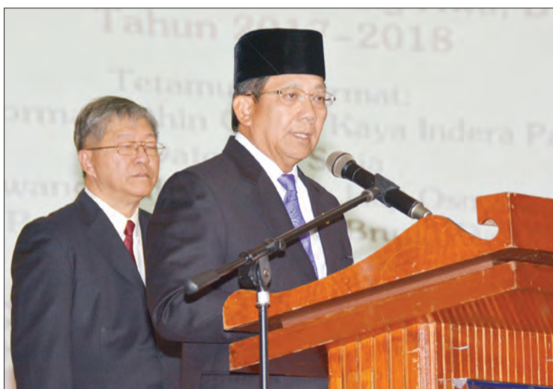
MENTERI Pendidikan, Yang Berhormat Pehin Orang Kaya Indera Pahlawan Dato Seri Setia Awang Haji Suyoi bin Haji Osman semasa menyampaikan ucapan pada Majlis Mengangkat Sumpah Ahli-Ahli Lembaga Pengarah Sekolah Menengah Chung Hwa, Bandar Seri Begawan Tahun 2017 - 2018.

BANDAR SERI BEGAWAN , Selasa, 17 Januari. - Menteri Pendidikan, Yang Berhormat Pehin Orang Kaya Indera Pahlawan Dato Seri Setia Awang Haji Suyoi bin Haji Osman menyarankan agar setiap institusi pendidikan swasta menubuhkan Lembaga Pengarah masing-masing sebagaimana dalam