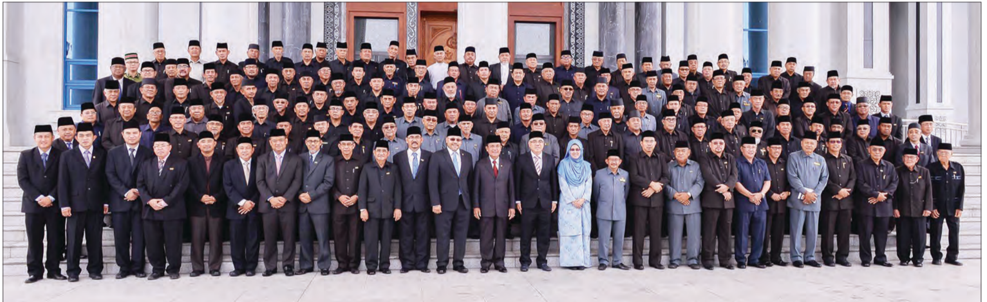
MENTERI Hal Ehwal Dalam Negeri semasa bergambar ramai bersama Penghulu-Penghulu, Ketua-Ketua Kampung serta Ketua-Ketua Rumah Panjang seluruh negara.