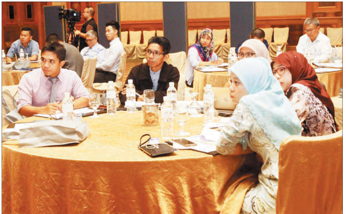
SEBAHAGIAN daripada yang hadir semasa Seminar Komersial bagi Keselamatan Menyelam.

berkenaan, khususnya International Marine Contractors Association di United Kingdom," katanya. Dalam hal tersebut, Yang Berhormat percaya Al-Hadid Marine Services sebagai pioneer dalam commercial diving services yang mempunyai kedudukan yang unik untuk bekerjasama dengan agensi-agensi kerajaan ke arah mengusahakan satu piawaian khusus yang lebih coherent untuk digunakan sebagai garis pandu bagi commercial diving services di negara ini. Yang Berhormat juga mengucapkan tahniah kepada Al-Hadid Marine Services, syarikat tempatan pertama yang berkecimpung dalam perkhidmatan commercial diving di negara ini. Walaupun baru sahaja ditubuhkan pada bulan September 2014, syarikat tersebut telah terlibat dalam melaksanakan pelbagai projek yang boleh dianggap professionally demanding termasuklah projek-projek kerajaan.