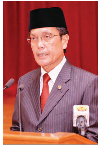
MENTERI Hal Ehwal Dalam Negeri, Yang Berhormat Pehin Orang Kaya Seri Setia Dato Seri Setia (Dr.) Haji Awang Abu Bakar bin Haji Apong semasa berucap pada perjumpaan bersama Penghulu-Penghulu Mukim serta Ketua-Ketua Kampung dan Ketua-Ketua Rumah Panjang.