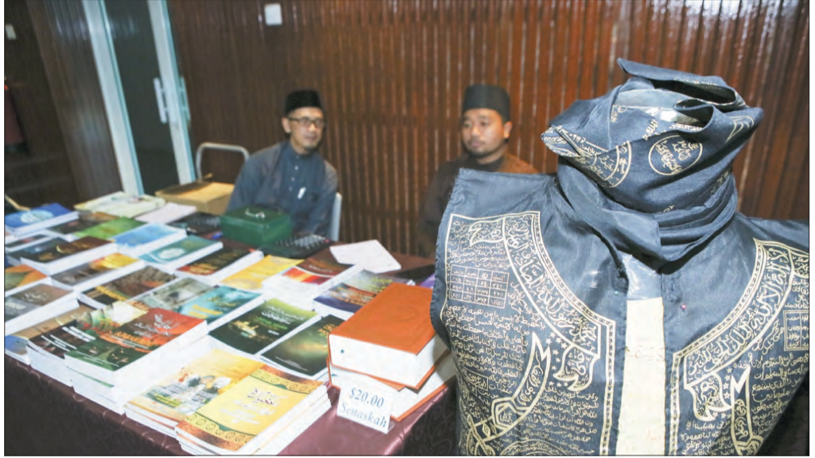
ANTARA bahan-bahan yang dipamerkan pada majlis tersebut.

dalam mengaplikasikan teori-teori ilmu yang dipelajari kepada masyarakat luar khususnya terhadap murid sekolah.