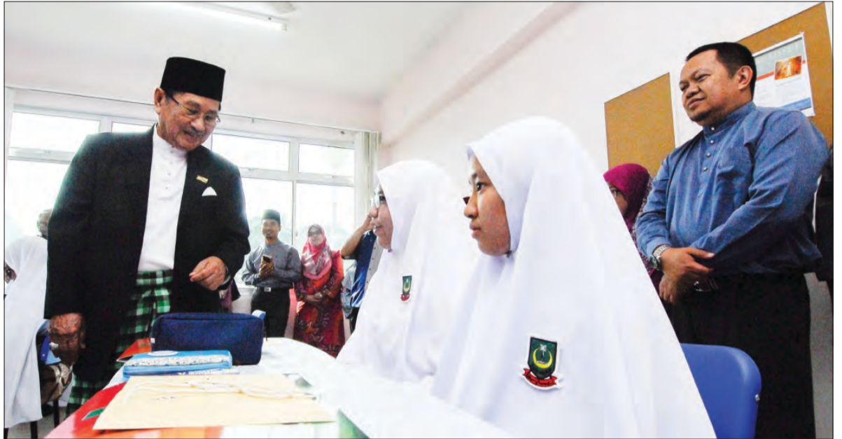
MENTERI Hal Ehwal Ugama, Yang Berhormat Pehin Udana Khatib Dato Paduka Seri Setia Ustaz Haji Awang Badaruddin bin Pengarah Dato Paduka Haji Othman semasa berinteraksi bersama beberapa penuntut Sekolah Menengah Arab Laki-Laki Hassanah Bolkiah (SMALHB) sesi pangajian 1438 Hijrah / 2017 Masihi.