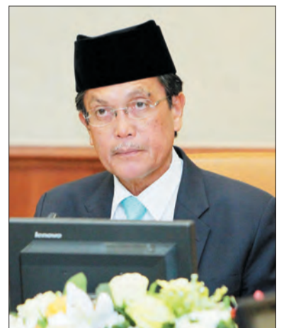
MENTERI Hal Ehwal Dalam Negeri, Yang Berhormat Pehin Orang Kaya Seri Kerna Dato Seri Setia (Dr.) Haji Awang Abu Bakar bin Haji Apong semasa berucap pada Mesyuarat Pertama Jawatankuasa Kebangsaan Sambutan Perayaan Ulang Tahun Keputeraan Kebawah Duli Yang Maha Mulia Paduka Seri Baginda Sultan dan Yang Di-Pertuan Negara Brunei Darussalam yang Ke-71 Tahun bagi Tahun 2017.

Yang Berhormat berharap dan mengalu-alukan supaya Ahli-Ahli Jawatankuasa Kebangsaan, Jawatankuasa Tadbir Tertinggi di peringkat dan Jawatankuasa-Jawatankuasa Kerja akan terus