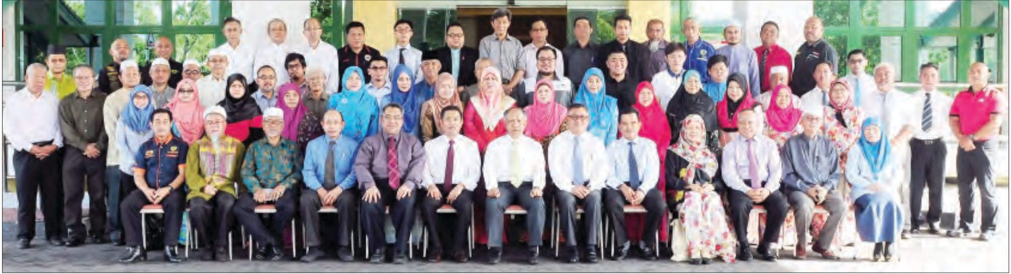
MENTERI Kebudayaan, Belia dan Sukan, Yang Berhormat Pehin Datu Lailaraja Mejar Jeneral (B) Dato Paduka Seri Haji Awang Halbi bin Haji Mohd. Yussof (duduk, tengah) bergambar ramai bersama 45 Persatuan Belia.