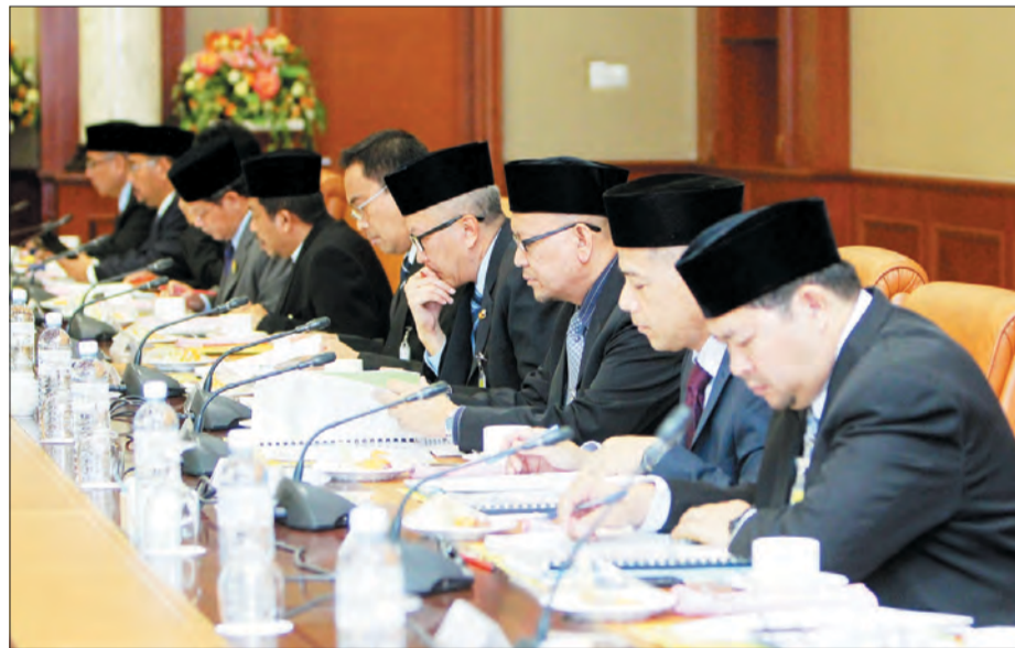
Pegawai-pegawai kanan yang hadir pada mesyuarat tersebut.

Turut hadir pada mesyuarat berkenaan ialah Yang Amat Mulia Pengiran Cheteria serta ahli-ahli Jawatankuasa Kebangsaan Sambutan Perayaan Ulang Tahun Keputeraan Kebawah DYMM Paduka Seri Baginda Sultan dan Yang Di-Pertuan Negara Brunei Darussalam Yang Ke-71 Tahun.