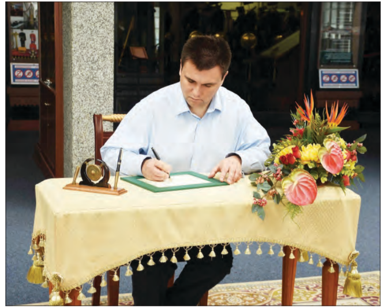
MENTERI Hal Ehwal Luar Negeri Ukraine, Tuan Yang Terutama Pavlo Klimkin ketika menandatangani lembaran kenangan.

hingga 5.00 petang, manakala hari Jumaat dari jam 9.00 hingga 11.30 pagi dan disambung semula dari 2.30 hingga 5.00 petang yang mana masuk adalah percuma.