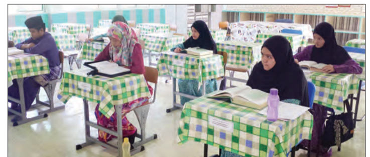
SERAMAI lapan orang pelajar baharu Skim Tilawah Al-Quran Remaja (STAR) bagi Pengambilan Ke-20 bagi Sesi Tahun 2017-2018 telah memulakan pembelajaran di Tahun 1 bertempat di Bangunan Sekolah Arab Temburong.

Ia bertujuan untuk melatih dan membimbing remaja dalam pembacaan Al-Quran melalui lagu-lagu tilawah masyhur bagi melahirkan pembaca-pembaca Al-Quran remaja berpotensi untuk dijadikan sebagai pelapis qari dan qariah negara ke peringkat kebangsaan dan antarabangsa.