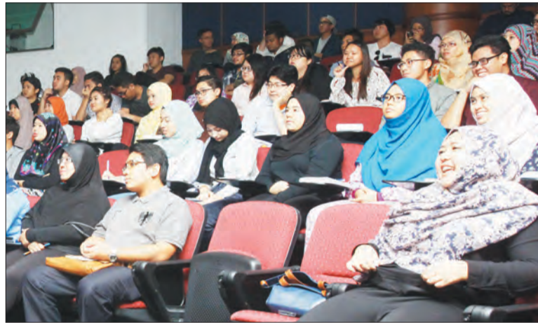
SEBAHAGIAN daripada yang hadir ke majlis sesi forum.

Forum tersebut, dibiayai oleh Sekretariat Chevening di bawah Projek Dana Chevening Alumni dibukakan kepada semua belia termasuk pelajar dari institusi tinggi dan menengah serta graduan, golongan profesional muda serta NGO. Di samping itu, Chevening Forum Belia Brunei turut disokong oleh Suruhanjaya Tinggi British.