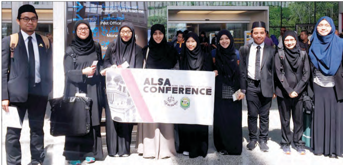
LAPAN pelajar dari Fakulti Syariah dan Undang-Undang UNISSA sebelum berlepas ke Bandung, Indonesia bagi menyertai Persidangan Tahunan ALSA 2017.

Berita dan Foto : Ihsan Universiti Islam Sultan Sharif Ali