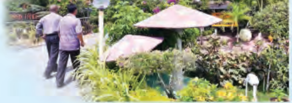
RESTORAN Tanda Kasih dihiasi dengan tanaman-tanaman dan perhiasan bagi menyambut kunjungan pelanggan.

Asas kejayaan beliau hari ini adalah berkat sabar, tawakkal, jujur dan ikhlas pada setiap tindakan. Selain itu beliau turut mendapat sokongan moral daripada keluarga dan