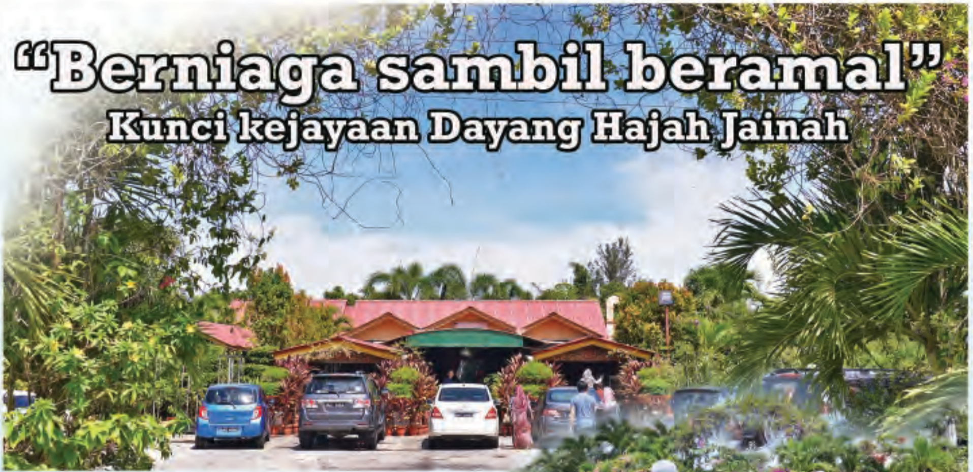
RESTORAN Tanda Kasih.