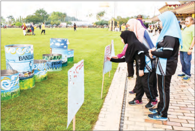
ORANG ramai yang berkunjung ke Bandarku Ceria mengundi tong yang paling cantik dan kreatif bagi menggalakkan orang awam menjaga kebersihan Bandar Seri Begawan.

Program Bandarku Ceria merupakan hari tanpa kereta yang diadakan setiap hari Ahad di mana beberapa jalan raya ditutup bagi lalu lintas dan dikawal rapi oleh pihak Polis Diraja Brunei bermula dari jam 6.00 hingga 10.00 pagi.