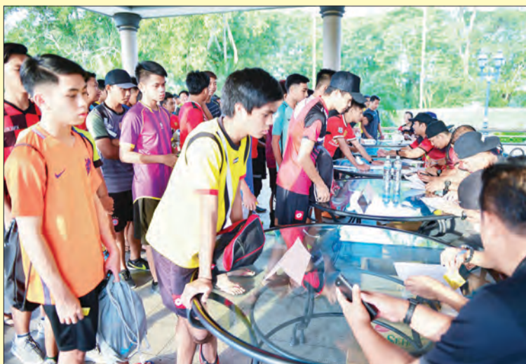
PARA peserta semasa mendaftar bagi sesi pemilihan tersebut. (kiri)

Namun begitu, ujar beliau, para peserta yang tidak terpilih untuk mengikuti pasukan DPMM FC 18 tahun ke bawah tersebut diharap akan lebih berusaha pada masa yang akan datang.