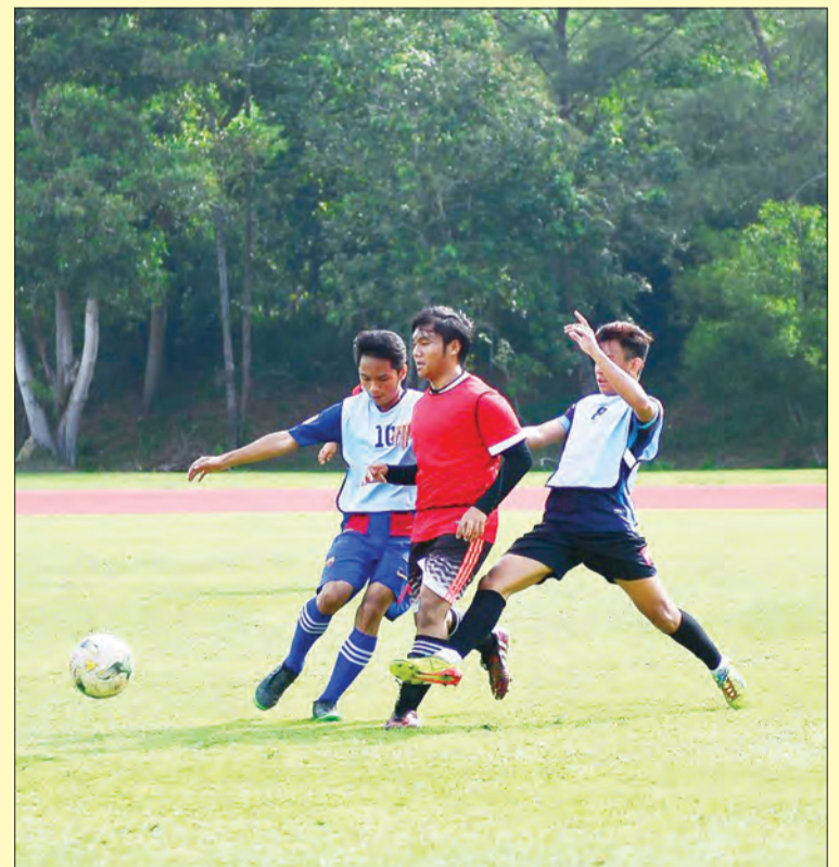
PARA peserta menonjolkan potensi masing-masing semasa sesi pemilihan pemain di bawah umur 18 tahun yang dianjurkan oleh Kelab Bola Sepak Brunei DPMM FC.