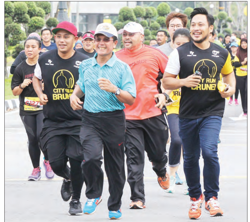
YANG Berhormat Menteri Hal Ehwal Dalam Negeri juga berkesempatan menyertai Larian 'City Run Brunei 2017'.

Mereka juga berpendapat, melalui larian ini secara tidak langsung memberi kesedaran kepada orang ramai akan pentingnya menjaga kesihatan melalui bersenam selain menjaga permakanan masing-masing.