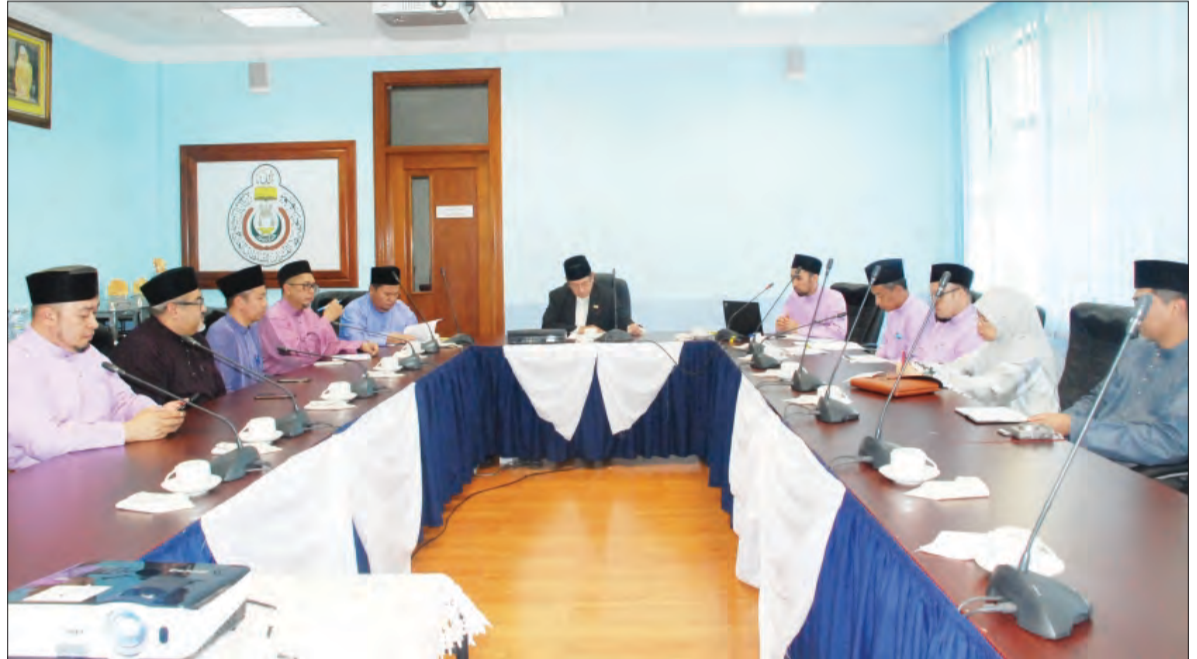
MENTERI Hal Ehwal Ugama ketika membuat lawatan ke ITQSHHB.