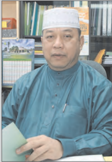
GURU Penghubung Belajar Mengaji Al-Quran Jame' 'Asr Hassanil Bolkiah, Kampung Kiarong, Mudim Haji Suhaili bin Haji Kalong semasa ditemu bual.

Oleh : Saerah Haji Abdul Ghani