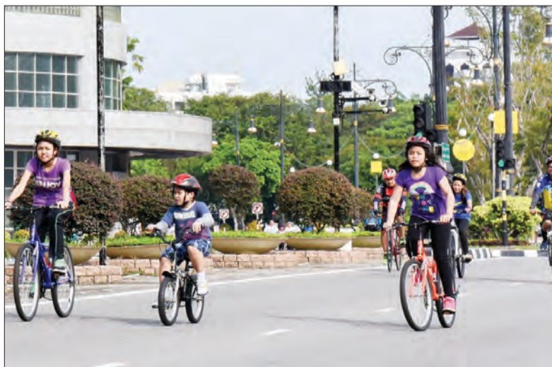
ASPEK keselamatan semasa berbasikal perlu diambil perhatian sewaktu beriadah di Bandarku Ceria.