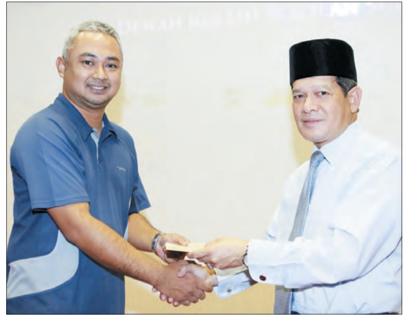
PEMANGKU Pengarah Pendidikan Kokurikulum semasa menyampaikan Surat Lantikan Tuan-tuan Rumah bagi Aktiviti-Aktiviti Kokurikulum Sekolah-Sekolah Menengah, Maktab-Maktab dan Sekolah Rendah bagi Tahun 2017.

lantikan secara rasmi dan sumbangan peralatan sukan yang bersesuaian bagi mengendalikan pertandingan serta aktiviti-aktiviti kokurikulum yang ditetapkan.