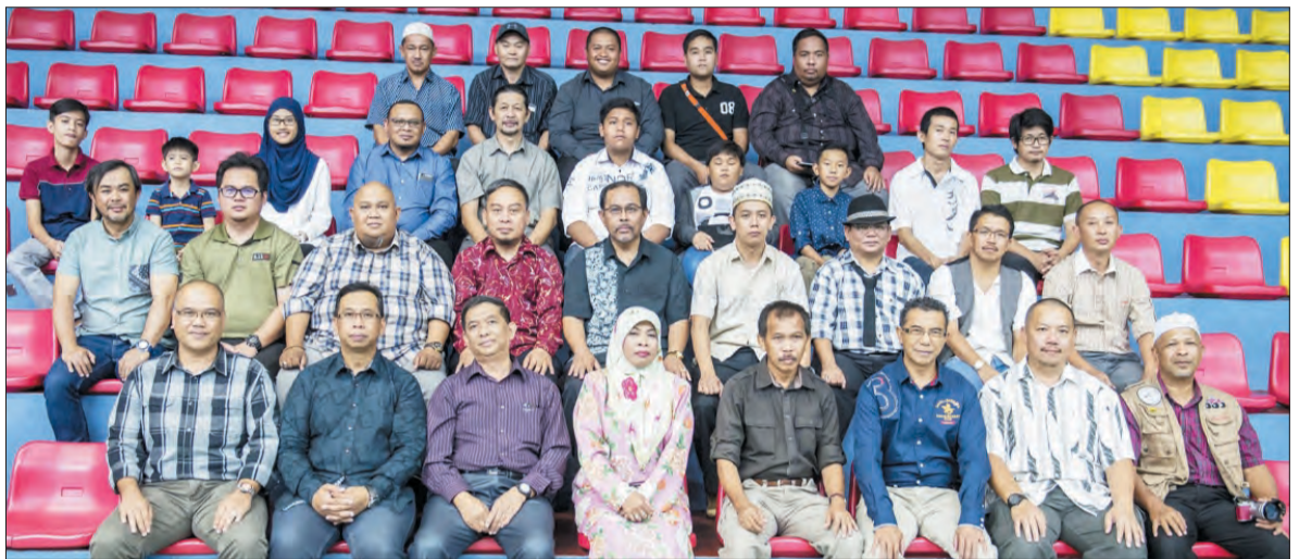
PEMANGKU Timbalan Pengetua Pusat Sejarah Brunei (depan, lima dari kanan) bergambar kenangan bersama Ahli-Ahli Persatuan Fotografi Negara Brunei Darussalam (PFNBD).

Majlis malam gala merupakan acara tahunan PFNBD bagi menghargai jasa dan sumbangan para ahli.