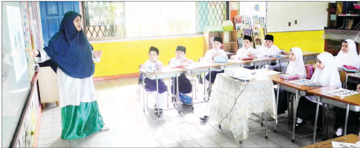
SESI pembelajaran pelajar-pelajar pra sekolah di Sekolah Ugama Haji Mohd Jaafar Maun dengan menggunakan teknologi ICT - Apple Airplay.