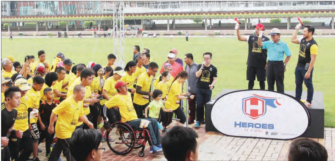
MENTERI Hal Ehwal Dalam Negeri, Yang Berhormat Pehin Orang Kaya Seri Kerna Dato Seri Setia (Dr.) Haji Awang Abu Bakar bin Haji Apong semasa menyempurnakan pelepasan Larian 'City Run Brunei 2017' di ibu negara.