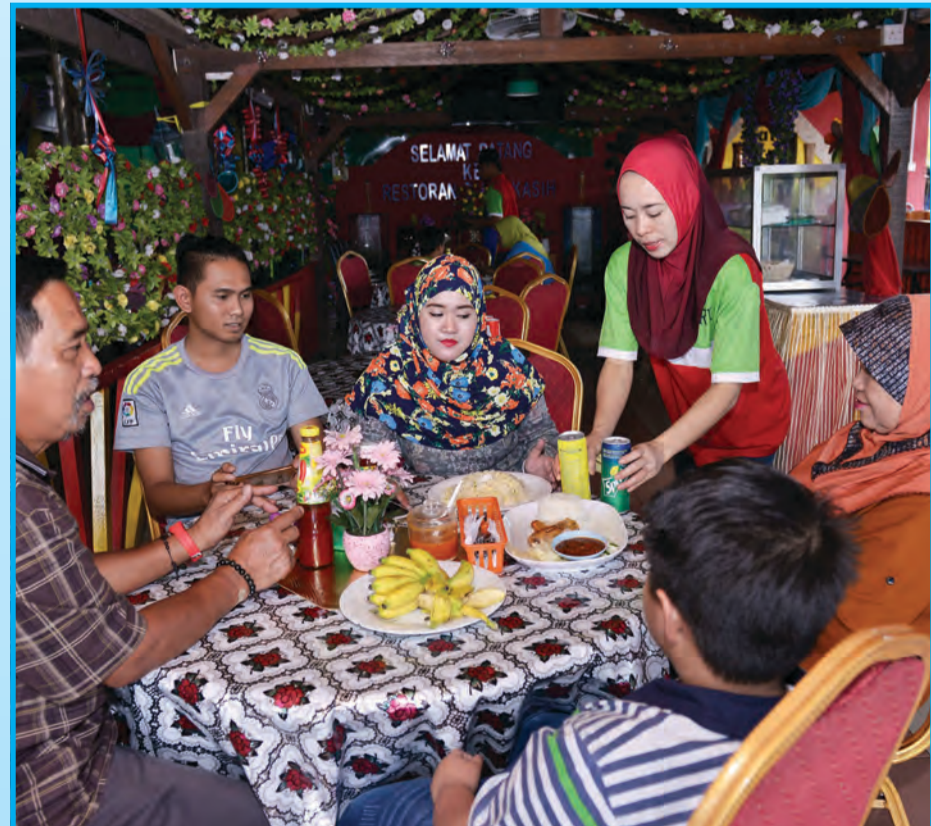
RESTORAN Tanda Kasih menjadi pilihan keluarga untuk makan di luar.

sentiasa ikhlas dan jujur, siap siaga menanggung risiko, jangan terlalu fokus kepada keuntungan atau kekayaan, sabar, azam yang kuat, mesra kawan, positif, rendah diri dan berfikiran terbuka. Jika model tidak mencukupi, mula secara kecil kecilan dahulu.