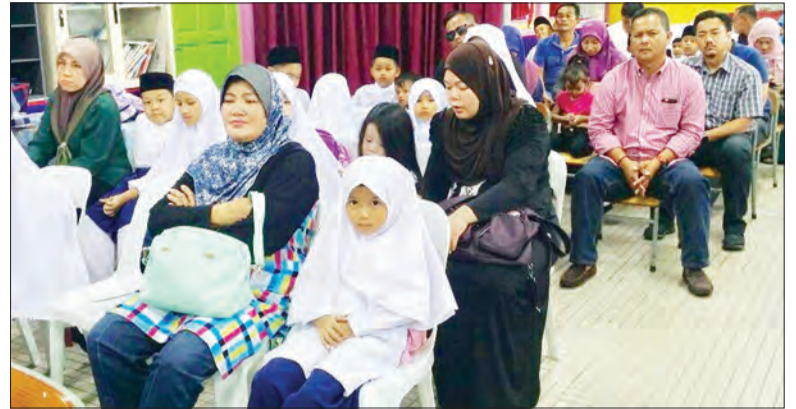
TAKLIMAT kemasukan Pra Sekolah baru-baru ini.

Tahun 2017 mencatatkan seramai 5764 orang pelajar baharu memasuki pra sekolah di sekolah-sekolah agama seluruh negara.