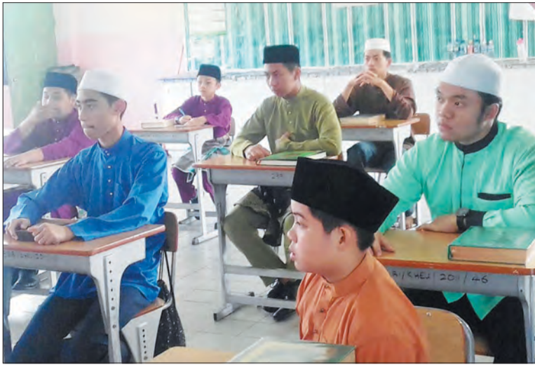
SEBAHAGIAN daripada pelajar yang terpilih mengikuti Skim Tilawah Al-Quran Remaja (STAR).

Oleh : Marlinawaty Hussin