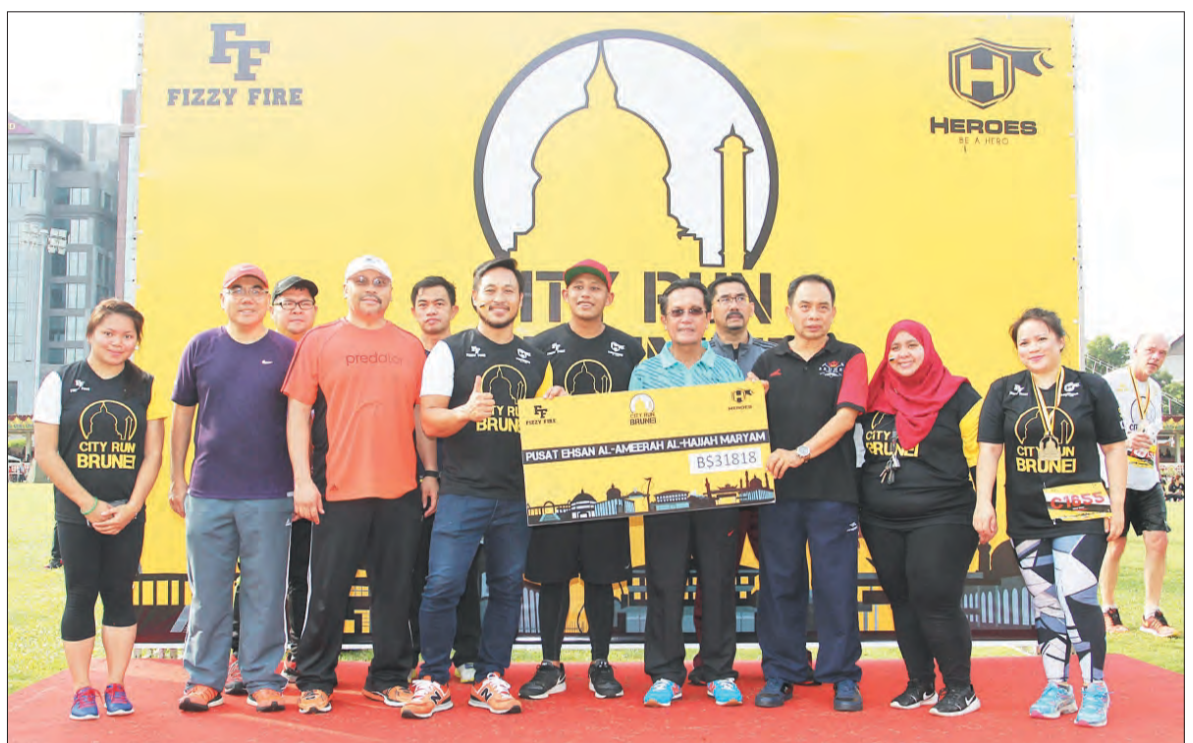
YANG Berhormat Menteri Hal Ehwal Dalam Negeri semasa menyampaikan sumbangan hasil derma Larian 'City Run Brunei 2017' kepada Pusat Ehsan Al-Ameerah Al-Hajjah Maryam.