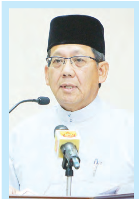
MENTERI Pendidikan, Yang Berhormat Pehin Orang Kaya Indera Pahlawan Dato Seri Setia Awang Haji Suyoi bin Haji Osman semasa berucap pada Majlis Doa Kesyukuran Sempena Ulang Tahun Ke-10 Penubuhan Universiti Sultan Sharif Ali (UNISSA), pada 13 Rabiulakhir 1438 Hijrah / 12 Januari 2017 Masihi, bertempat di Auditorium UNISSA.

UNISSA juga perlu memastikan para pelajar akan sentiasa mengamalkan nilai-nilai murni yang terkandung dalam falsafah negara 'Melayu Islam Beraja' (MIB)