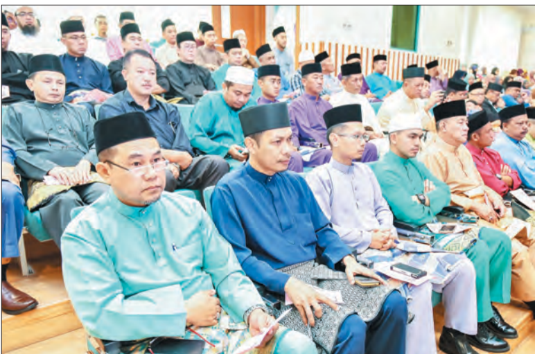
IBU bapa dan penjaga pelajar-pelajar yang hadir di Majlis Penerimaan Pelajar-Pelajar Baru (Peringkat Menengah) ITQSHHB Sesi Pengajian 1438 Hijrah / 2017 Masihi.