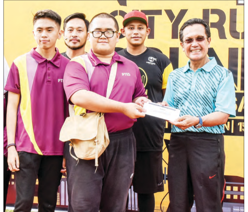
MENTERI Hal Ehwal Dalam Negeri menyempakan hadiah Tong Sampah Kreatif kepada pemenang tempat pertama, Pusat Tingkatan Enam Sengkurong.

Sepertimana menurut Pemangku Pengerusi Lembaga Bandaran BSB, Awang Haji Ali bin Matyassin menjelaskan selaras dengan tema 'Bandarku Ceria, Bandarku Bersih' ingin menerapkan kesedaran kepada orang ramai yang hadir memeriahkan bandar di setiap minggu di mana sahaja mereka berada sama ada di sekitar kawasan komersial, di setiap