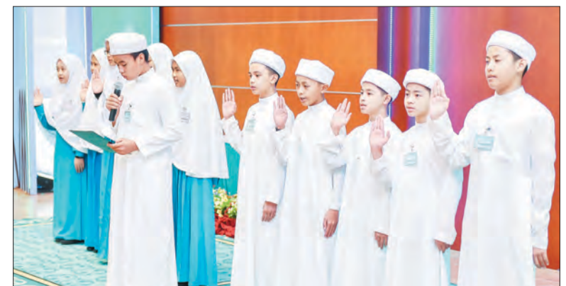
BACAAN Ikrar pelajar-pelajar baharu ITQSHHB Sesi Pengajian 1438 Hijrah / 2017 Masihi.