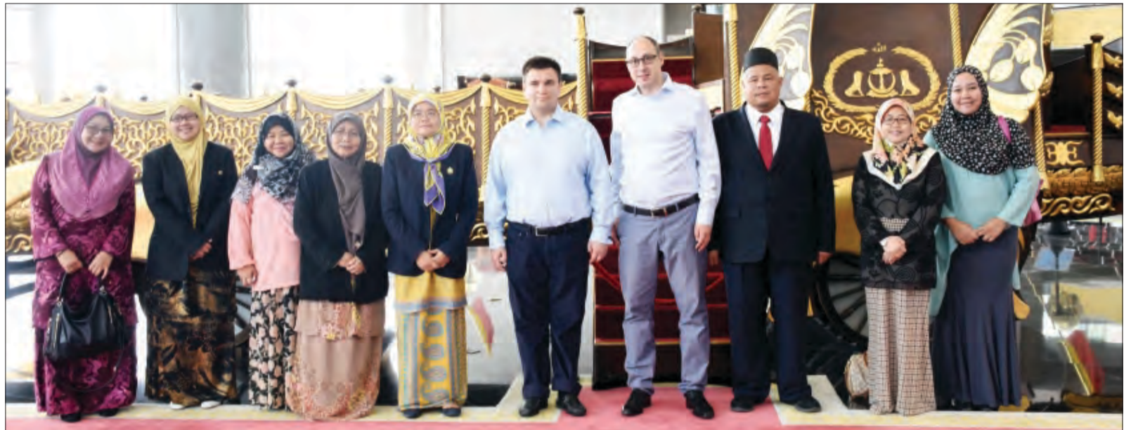
SESI bergambar ramai bersama Menteri Hal Ehwal Luar Negeri Ukraine, TYT Pavlo Klimkin.