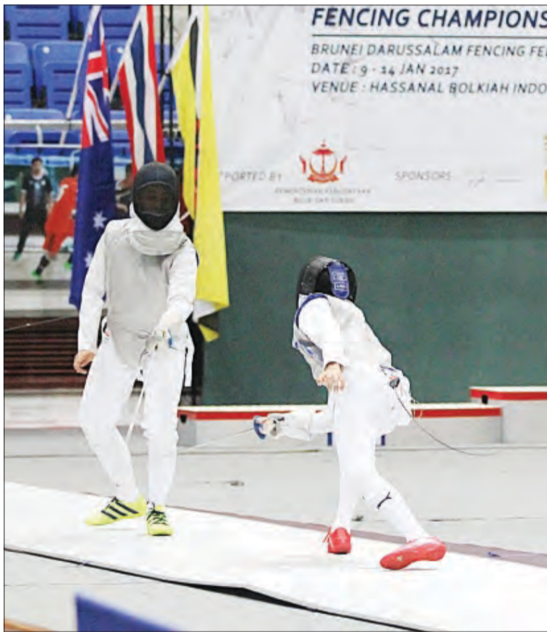
KEJOHANAN Lawan Pedang Terbuka Brunei telah berlangsung di Stadium Tertutup Hassanal Bolkiah yang telah bermula pada 9 Januari 2017 hingga 14 Januari 2017.

Lebih 90 pemain lawan pedang menyertai kejohanan kali ini yang dibahagikan kepada enam kategori individu dan enam kategori kumpulan dan juga turut disokong oleh Kementerian Kebudayaan, Belia dan Sukan.