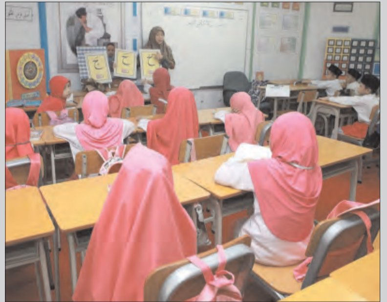
SUASANA semasa pembelajaran mengaji Al-Quran di Jame' 'Asr Hassanil Bolkiah, Kampung Kiarong.

Jumlah peserta yang telah dikhatamkan dari tahun 1998 sehingga 2016 ialah sejumlah 1555 orang yang mana 650 darinya adalah peserta lelaki sementara selebihnya seramai 905 terdiri dari peserta perempuan.