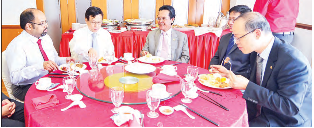
MENTERI Hal Ehwal Dalam Negeri, Yang Berhormat Pehin Orang Kaya Seri Kerna Dato Seri Setia (Dr.) Haji Awang Abu Bakar bin Haji Apong antara yang hadir pada rumah terbuka sempena Tahun Baharu Cina yang berlangsung di Parkview Hotel, Jerudong.

Majlis yang dianjurkan pada setiap tahun itu merupakan acara tahunan dan salah satu acara bagi mereka untuk berkumpul dan menghargai selain bersua kenal dengan pelanggan mereka serta para pembekal, profesional kesihatan terutama dengan pegawai dan kakitangan Kementerian Kesihatan yang sering bekerjasama dengan mereka.