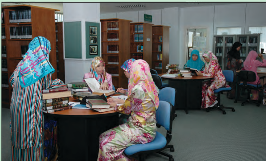
PERPUSTAKAAN Islam Brunei Darussalam juga menjadi kunjungan orang ramai untuk mencari bahan rujukan.

Bagi sebarang pertanyaan mengenainya bolehlah menghubungi talian : +6732224955 / +673 2224956. Di samping itu, orang ramai juga boleh melayari laman sesawang PIB, iaitu https://www.pib.gov.bn , Facebook - https://www.facebook.com/pibdjmk dan Instagram @pibdjmk.