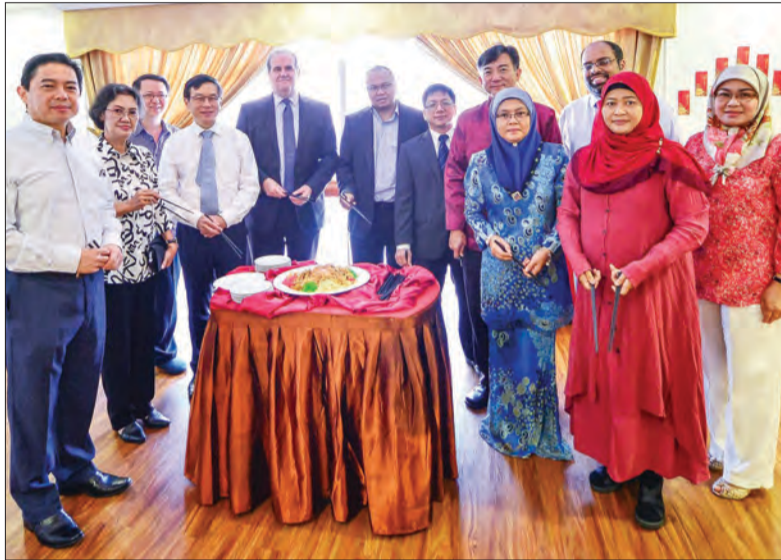
MAJLIS rumah terbuka sempena Tahun Baharu Cina anjuran Gleneagles Jerudong Park Medical Centre (JPMC) turut dihadiri oleh orang-orang kenamaan dan tetamu-tetamu khas.