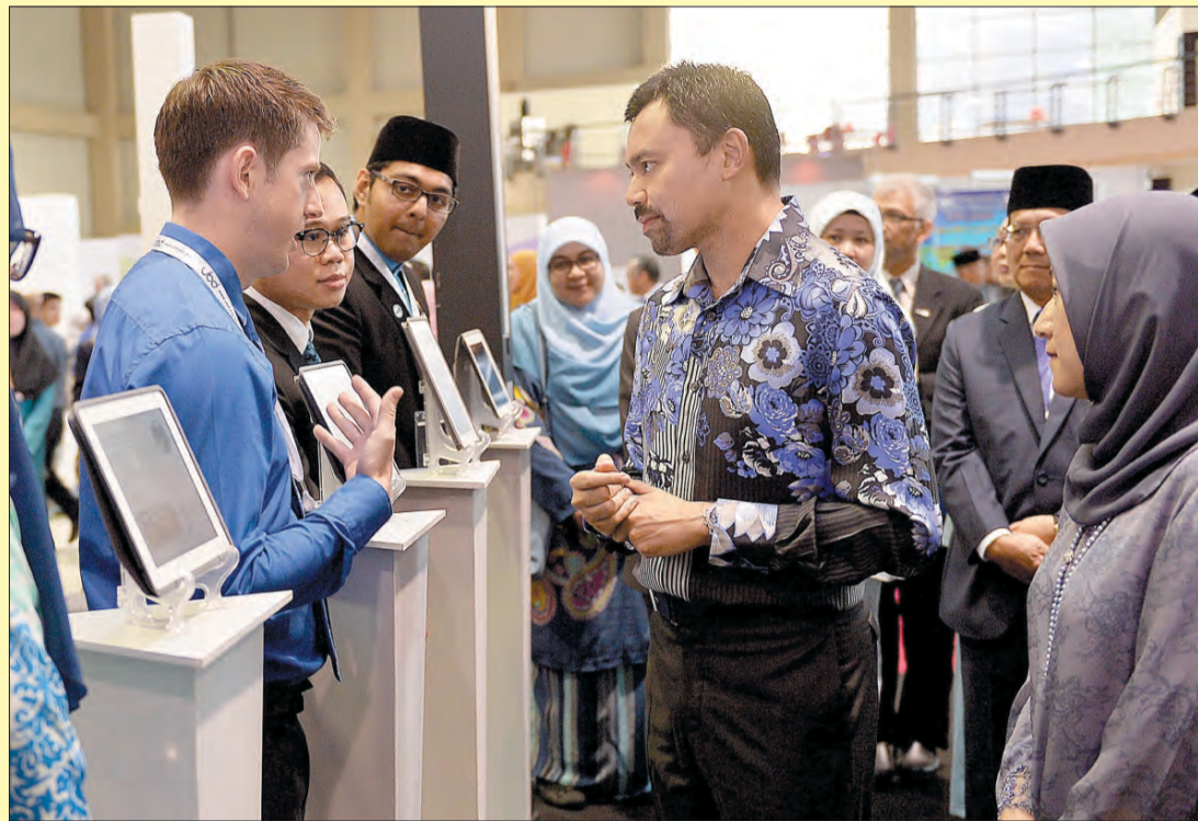
DULI Yang Teramat Mulia semasa berkenan melawat pameran yang disebarkan oleh Universiti Brunei Darussalam.

Manakala institusi tempatan swasta yang menyertai terdiri daripada Kolej Perniagaan Laksamana, Kolej Pengajian Siswazah Antarabangsa (IGS), Kolej Antarabangsa Miconet, Kolej Perdagangan dan Teknologi