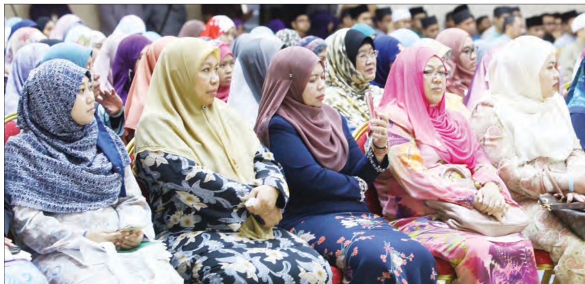
ANTARA yang hadir pada Majlis Ceramah Khas 'Iman, Cinta dan Taqwa' yang berlangsung di Auditorium, Universiti Islam Sultan Sharif Ali (UNISSA).

Menurutnya, dengan adanya taqwa kepada Allah insyaaAllah akan dipermudahkan segala urusan dan mendapat jawapan yang diminta, sesuai dengan ayat Al-Quran 'wattaqullaha wa yu'allimukumullah'.