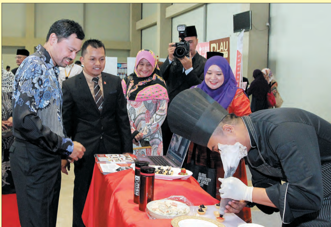
DULI Yang Teramat Mulia berkenan dijunjung menyaksikan salah satu pameran yang terdapat di sana sejurus perasmian Ekspo Pengajian Tinggi 2017.

Cosmopolitan, Institut Kemuda dan Brunei Darussalam Institute of Certified Public Accountants