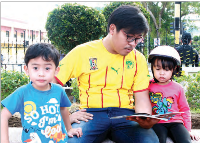
AKTIVITI membaca yang dikendalikan oleh Perpustakaan Bergerak Dewan Bahasa dan Pustaka Brunei.

BANDAR SERI BEGAWAN , Ahad, 12 Februari. - Dalam sama-sama menyokong kemeriahan Program Bandarku Ceria, Dewan Bahasa dan Pustaka (DBP) tidak ketinggalan memeriahkan program tersebut