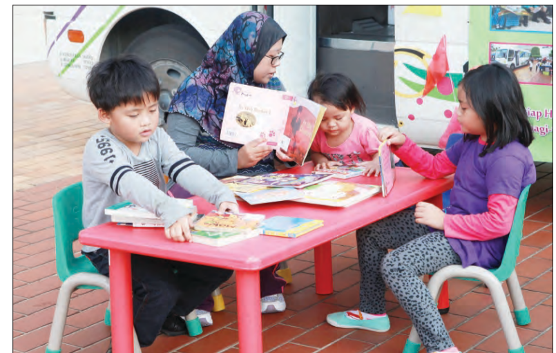
PROGRAM Memupuk Budaya Membaca anjuran DBP dapat menarik minat ramai kanak-kanak.

Menurutnya, bukan sahaja tertumpu kepada buku-buku tulisan rumi malah buku-buku dalam tulisan jawi juga turut disediakan untuk bacaan para pengunjung, yang mana ini adalah satu perkara yang baik bagi kanak-kanak khususnya.