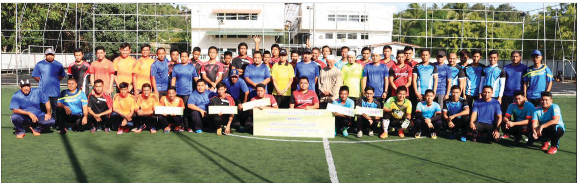
PASUKAN-PASUKAN yang menyertai Kejujohanan Futsal Belia Masjid Kampung Batu Marang 2017 dalam sesi bergambar ramai di awal kejujohanan tersebut.

BERITA-BERITA HARIAN BOLEH DIKUTI DI LAMAN SESAWANG : www.pelitabrunei.gov.bn