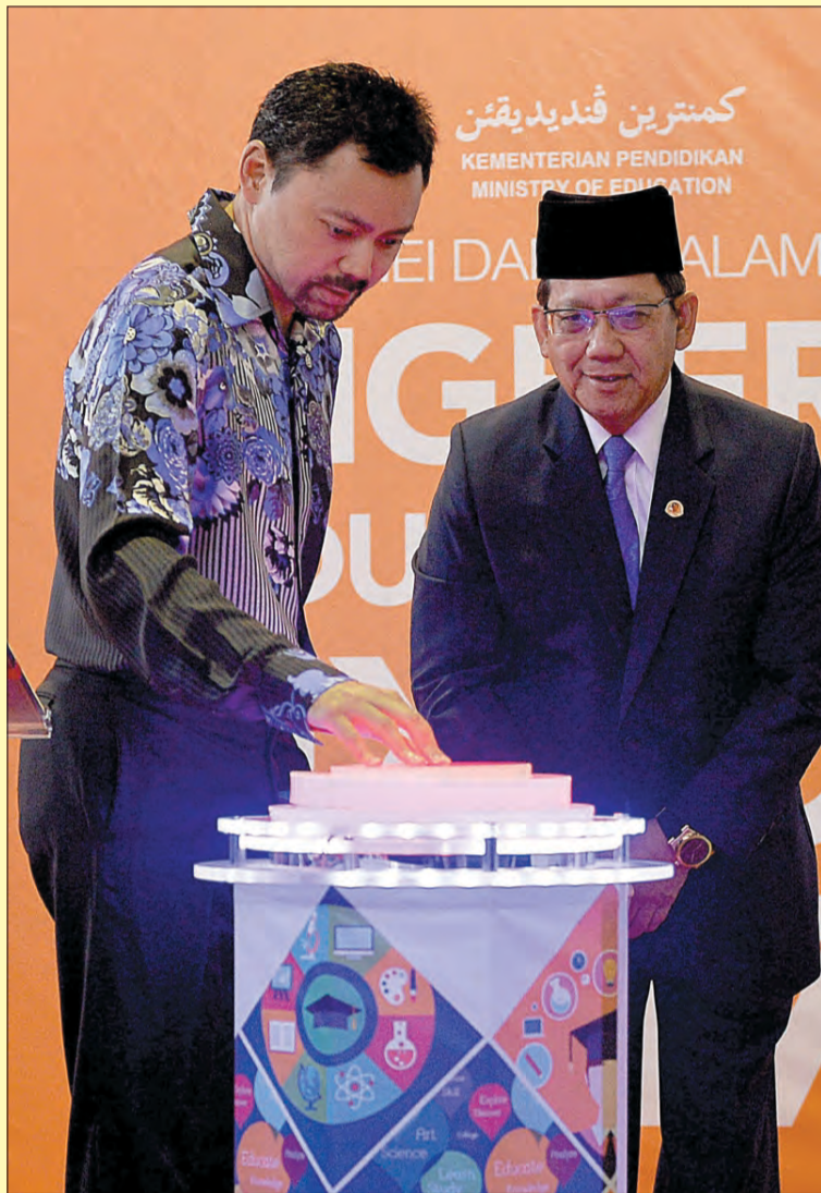
DULI Yang Teramat Mulia Paduka Seri Pengiran Muda Mahkota Pengiran Muda (Dr.) Haji Al-Muhtadee Billah ibni Kebawah Duli Yang Maha Mulia Paduka Seri Baginda Sultan Haji Hassanal Bolkiah Mu'izzaddin Waddaulah, Menteri Kanan di Jabatan Perdana Menteri semasa berkenan merasmikan Ekspo Pengajian Tinggi 2017.