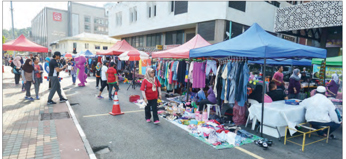
ORANG ramai yang menyertai Bandarku Ceria berpeluang meningkatkan pendapatan dengan menjual pelbagai barangan (atas), sementara gambar bawah, aktiviti Autobot memeriahkan lagi Bandarku Ceria.

Oleh itu, beliau berharap orang ramai di Bandarku Ceria tersebut akan menyokong usaha mereka dalam