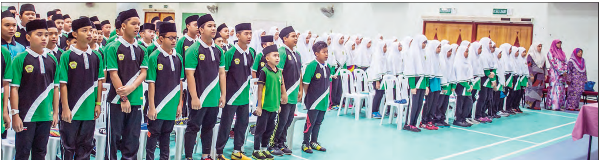
PENUNTUT-PENUNTUT Tahun 7 Sekolah Menengah Masin semasa berdiri menyanyikan lagu kebangsaan negara sebelum taklimat tersebut dimulakan.

Semangat cinta kepada raja, agama, bangsa dan negara perlu disemai di peringkat generasi muda terutama pelajar-pelajar sekolah rendah, menengah serta institusi pengajian tinggi.