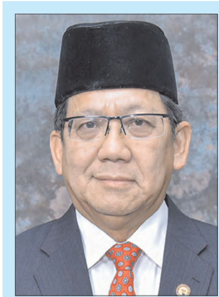
MENTERI Pendidikan, Yang Berhormat Pehin Orang Kaya Indera Pahlawan Dato Seri Setia Awang Haji Suyoi bin Haji Osman semasa berucap pada Majlis Konvokesyen Politeknik Brunei Ke-3 Tahun 2017 pada hari Khamis, 26 Januari 2017 Masihi di Dewan Canselor, Universiti Brunei Darussalam.

usaha bijak pihak Politeknik Brunei dalam memberikan bimbingan serta dorongan kepada para pelajar untuk lebih bersedia dalam menceburi bidang keusahawanan selepas tamat pengajian.