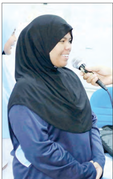
SALAH seorang penuntut cuba menjawab Kuiz Kenegaraan.

BANDAR SERI BEGAWAN , Isnin, 6 Februari. - Penuntut-penuntut diseru supaya mengambil berat mengenai aspek 'Menghayati Lagu Kebangsaan dan Bendera Negara', di samping mendalami bagaimana cara untuk menaikkan bendera di sekolah, institusi pendidikan dan di rumah-rumah.