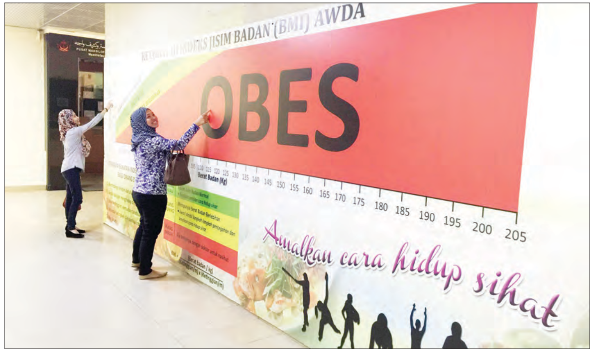
CARTA sukatan bagi berat badan.

Persoalannya, apakah punca-punca masalah kegemukan yang semakin menjadi pada era ini? Jelasnya antaranya kerana tidak mempraktikkan amalan pemakanan seimbang; kurang menjaga bentuk atau fizikal badan; cenderung kepada pemakanan makanan segera yang tinggi dengan kalori; kebanyakan individu yang bekerja terpaksa mengambil makanan segera sebagai makanan harian bagi