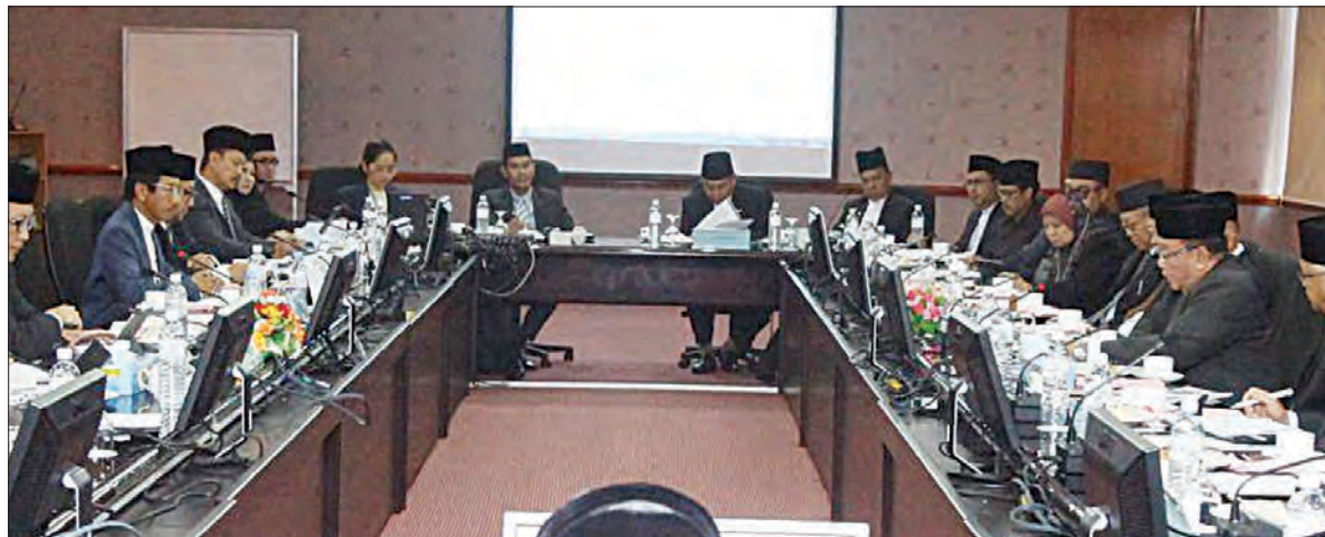
SUASANA Sesi Muzakarah Kementerian Perhubungan bersama Ahli-Ahli MMN bagi Tahun 2017 yang berlangsung di Bilik Mesyuarat AI-Mahabbah, Kementerian Perhubungan.