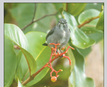
SATU spesies burung baharu, 'Spectacled Flowerpecker' ditemui di Taman Negara Ulu Temburong, Negara Brunei Darussalam.

"Ia berkemungkinan kali ke-114 atau 115 saya mendaki menara kanopi Taman Negara Ulu Temburong (mungkin sekitar 10 pagi) di mana saya melihat seekor burung kecil memakan buah-buahan merah. Pada masa itu, saya hanya tahu bahawa ia adalah seekor burung Flowerpecker tetapi saya yakin tidak pernah melihatnya sebelum ini. Burung Spectacled Flowerpecker hinggap sekitar 2 hingga 3 minit sebelum terbang ke dahan lain 2 - 3 meter jarak dari dahan sebelumnya sebelum terbang lagi," ujarnya.