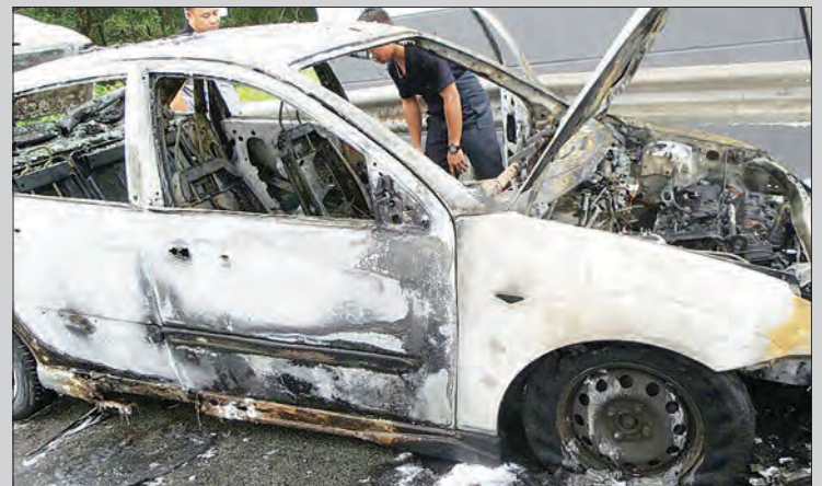
KEADAAN kenderaan jenis Ford Fiesta yang hangus dipercayai berpunca dari kerosakan bahagian kotak fuis enjin kereta berkenaan.

Semasa insiden berlaku, Ahli Bomba bertindak memadamkan api menggunakan foam , memandangkan api besar telah