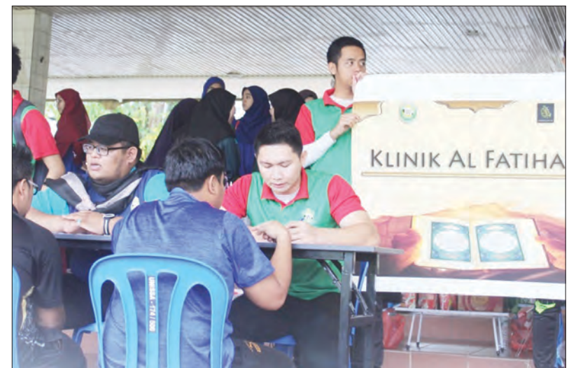
KLINIK Surah Al-Fatihah bagi membantu orang ramai memperbaiki dan menghalusi lagi bacaan Surah Al-Fatihah agar setiap ayat dapat dibaca dengan betul dan menepati makna sebenar.

Pada masa yang sama juga, Photohunt Race turut diadakan di antara mahasiswa / mahasiswi UNISSA agar dapat mengeratkan persaudaraan dan perpaduan antara warga UNISSA.