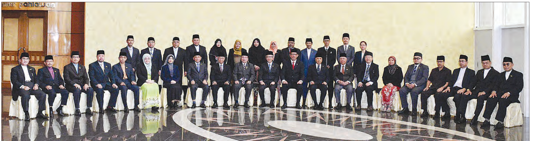
YANG Berhormat Menteri Perhubungan semasa bergambar ramai bersama Ahli-Ahli MMN pada Sesi Muzakarah Kementerian Perhubungan bersama Ahli-Ahli MMN bagi Tahun 2017.