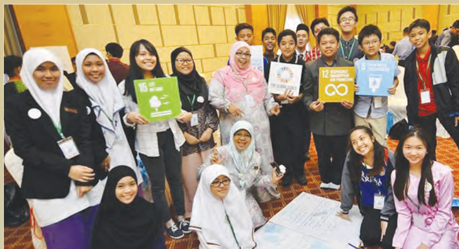
PESERTA-PESERTA forum terdiri daripada penuntut sekolah (atas dan bawah).

Beliau menambah, adapun usaha SDG, ialah mencapai aspirasi kemanusiaan ke arah keamanan, kemakmuran dan masa depan yang mampan tanpa ada pengecualian seseorang