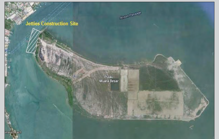
AKTIVITI menanam cerucuk dan pembinaan ( piling and constructions ) Jeti 1 dan 2 di saluran Barat Pulau Muara Besar (PMB) yang berkuat kuasa serta-merta sehingga 30 Disember 2017.

Bagi sebarang maklumat lanjut mengenai aktiviti-aktiviti pembinaan, sila hubungi Hengyi Industries Sdn. Bhd. melalui talian +673 2610210.