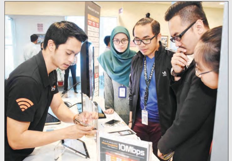
ANTARA pelajar yang menyaksikan pameran Jerayawara Negara Pintar.

Berita dan Foto : Ak. Syi'aruddin Pg. Daudin