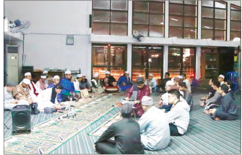
ACARA Qiyamullail bagi mahasiswa yang diadakan di Surau Sementara UNISSA.