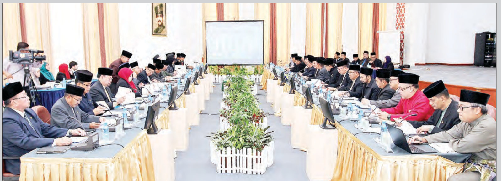
KEMENTERIAN Hal Ehwal Ugama (KHEU) semasa mengadakan Sesi Muzakarah bersama Ahli-Ahli Majlis Mesyuarat Negara (MMN).

Perjumpaan berkenaan adalah sebagai wadah bagi Ahli-Ahli MMN dan KHEU bermuzakarah serta mengongsi perkembangan aktiviti, dasar serta polisi kementerian yang terkini di samping menjalin dan membangun ikatan ukhuwah yang lebih erat di antara kedua-dua belah pihak.