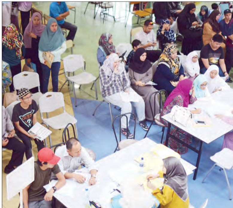
PUSAT Tingkatan Enam Meragang (PTEM) semasa mengadakan Hari Terbuka dan menjemput para ibu bapa, penjaga dan juga pelajar bagi kemasukan Sesi 2017 / 2018 di ruang lobi, PTEM.

BANDAR SERI BEGAWAN , Isnin, 6 Februari. - Pusat Tingkatan Enam Meragang (PTEM) mengadakan Hari Terbuka dan menjemput para ibu bapa, penjaga dan juga pelajar bagi kemasukan Sesi 2017 / 2018 bertempat di ruang lobi, PTEM.