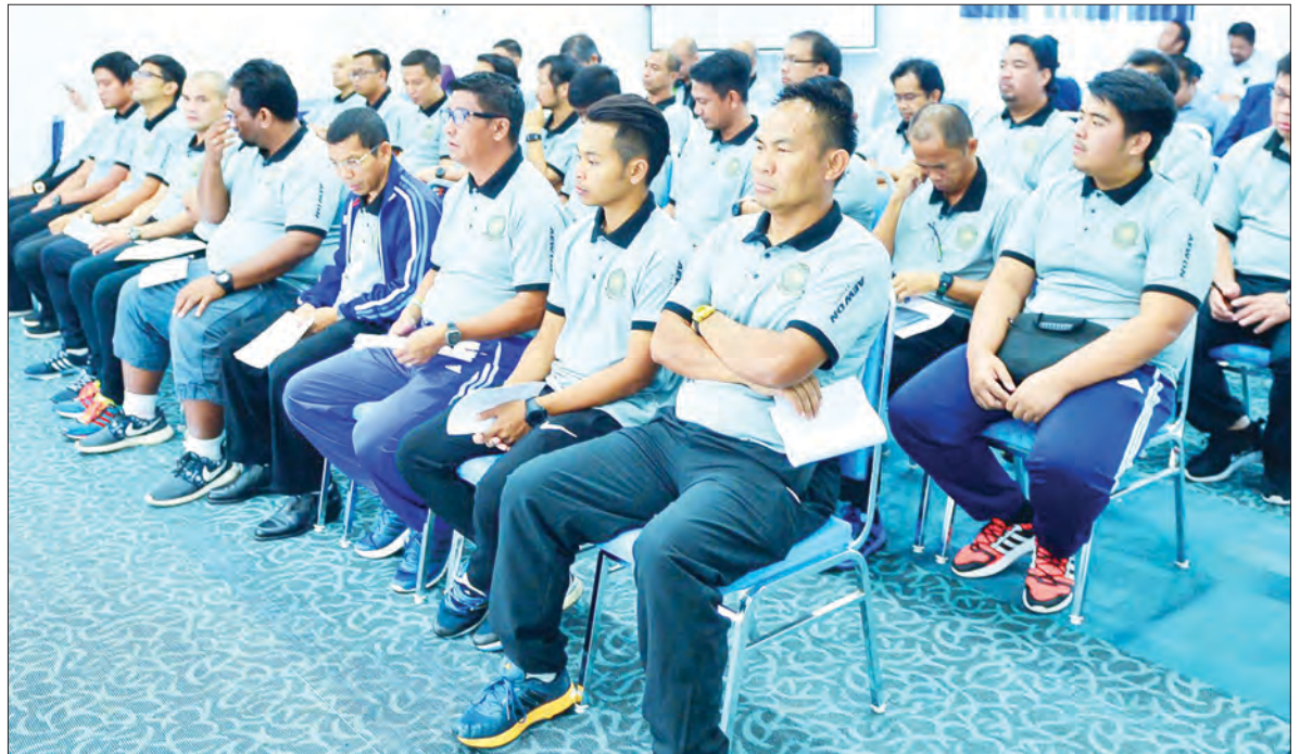
PARA peserta yang mengikuti kursus tersebut.

Oleh : Wan Mohamad Sahran Wan Ahmadi