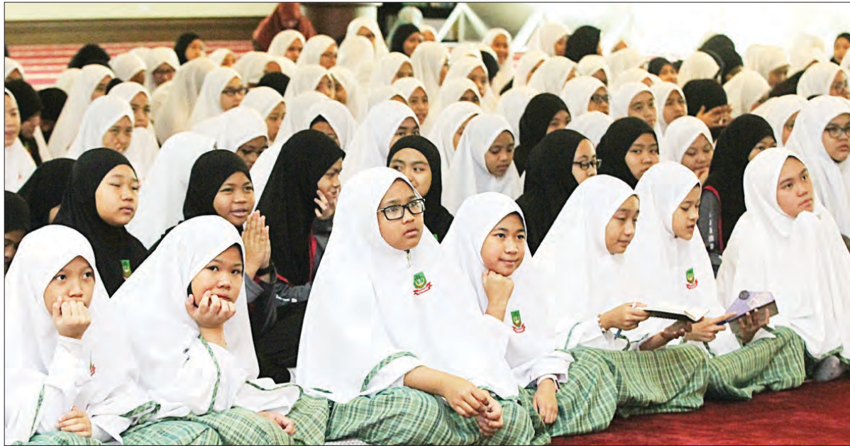
ANTARA penuntut Tahun 7 yang hadir pada Taklimat Kenegaraan 'Menghayati Lagu Kebangsaan dan Bendera Negara' di surau sekolah berkenaan.