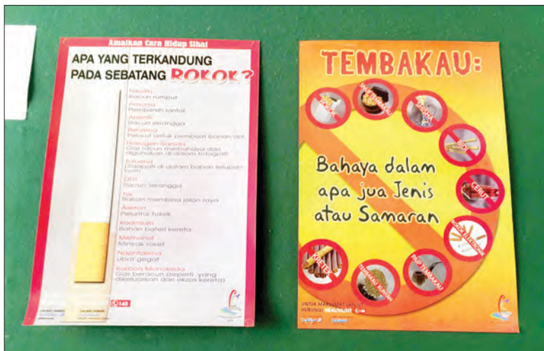
SEBAHAGIAN daripada poster yang mempamerkan bahaya rokok.

Di samping itu, pengambilan dan pendedahan pada nikotin yang berpanjangan melalui sedutan berpotensi menjejaskan perkembangan otak janin, kanak-kanak dan remaja, manakala warna, bau dan cara pembungkusan e-liquid boleh menarik perhatian kanak-kanak seterusnya mendatangkan kemudahan dan risiko keracunan jika terminum atau termakan.