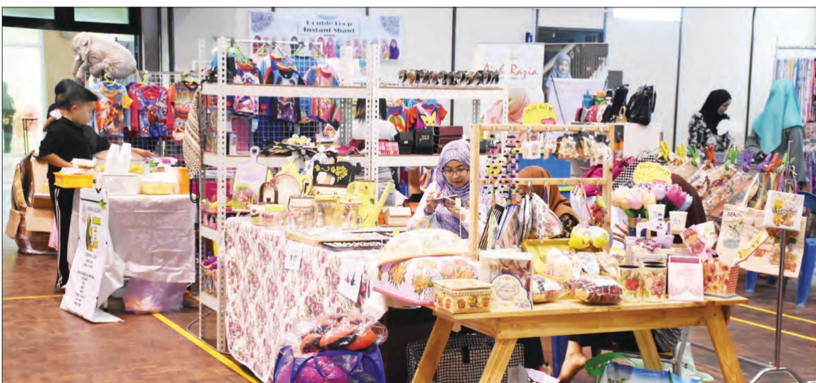
ANTARA petak jualan pada Bazar Awal Tahun 2017 anjuran MPK Kilanas dengan kerjasama Jabatan Daerah Brunei dan Muara yang berlangsung di Dewan Muhibah, Jabatan Daerah Brunei dan Muara, Berakas (atas kiri dan atas).

Sehubungan itu, orang ramai dialu-alukan untuk berkunjung ke bazar amal tersebut yang menjual pelbagai jenis jualan dalam petak-petak yang disediakan sepanjang bazar diadakan yang bermula pada pukul 8.00 pagi hingga 6.00 petang.