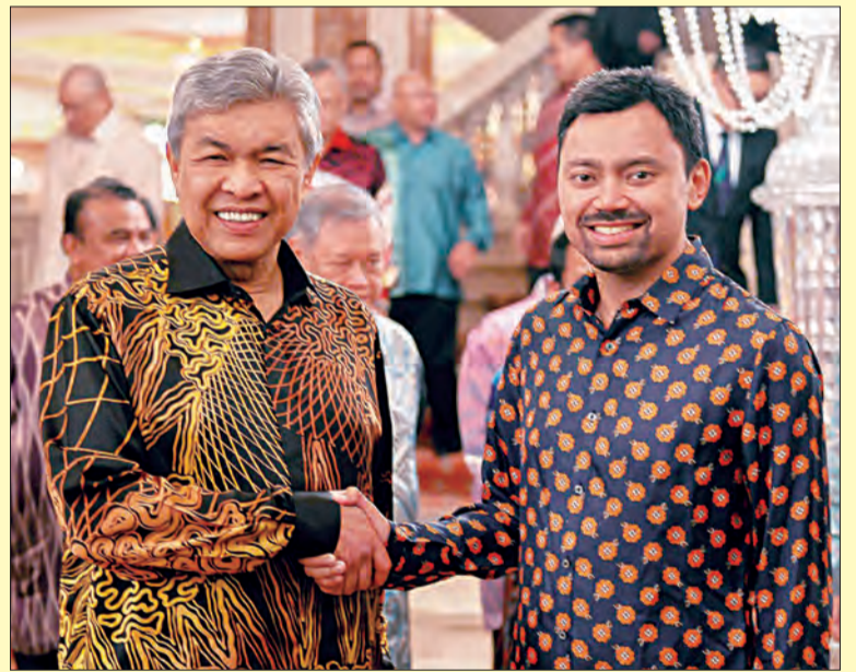
DULI Yang Teramat Mulia Paduka Seri Pengiran Muda Mahkota Pengiran Muda Haji Al-Muhtadee Billah, Menteri Kanan di Jabatan Perdana Menteri berkenan mengadakan Majlis Santap Malam bagi Timbalan Perdana Menteri dan Menteri Dalam Negeri Malaysia, Yang Amat Berhormat Dato' Seri Dr. Ahmad Zahid Hamidi (kiri), sementara gambar kanan, Duli Yang Teramat Mulia ketika berkenan bersalam mesra bersama Yang Amat Berhormat.