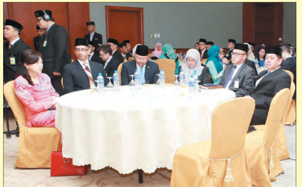
TURUT hadir pada Sesi Pembukaan Program B100, ialah Setiausaha-Setiausaha Tetap dan pegawai-pegawai kanan kerajaan (kiri dan kanan).