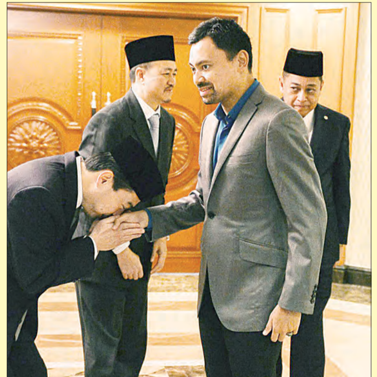
DULI Yang Teramat Mulia Paduka Seri Pengiran Muda Mahkota Pengiran Muda Haji Al-Muhtadee Billah ibni Kebawah Duli Yang Maha Mulia Paduka Seri Baginda Sultan Haji Hassanal Bolkiah Mu'izzaddin Waddaulah, Menteri Kanan di JPM, Pengerusi dan Sponsor Jawatankuasa Pandu PENGGERAK berkenan berangkat ke Sesi Pembukaan Program Brunei Top 100 Leaders (B100) Kali Ke-2.