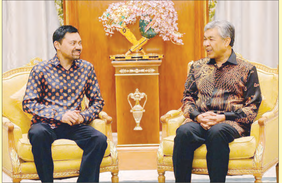
DULI Yang Teramat Mulia Paduka Seri Pengiran Muda Mahkota Pengiran Muda Haji Al-Muhtadee Billah ibni Kebawah Duli Yang Maha Mulia Paduka Seri Baginda Sultan Haji Hassanal Bolkiah Mu'izzaddin Waddaulah, Menteri Kanan di Jabatan Perdana Menteri berkenan menerima mengadap Timbalan Perdana Menteri dan Menteri Dalam Negeri Malaysia, Yang Amat Berhormat Dato' Seri Dr. Ahmad Zahid Hamidi.