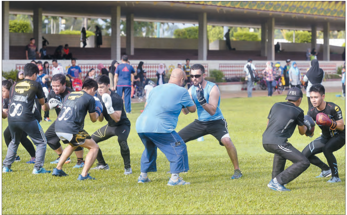
ANTARA aktiviti sukan yang diadakan di Taman Haji Sir Muda Omar 'Ali Saifuddin (bawah kiri dan atas).

Secara kesimpulannya, tidak menjadi satu kerugian jika kita aktif bersukan kerana ia memberi manfaat kesihatan terhadap diri individu itu sendiri.