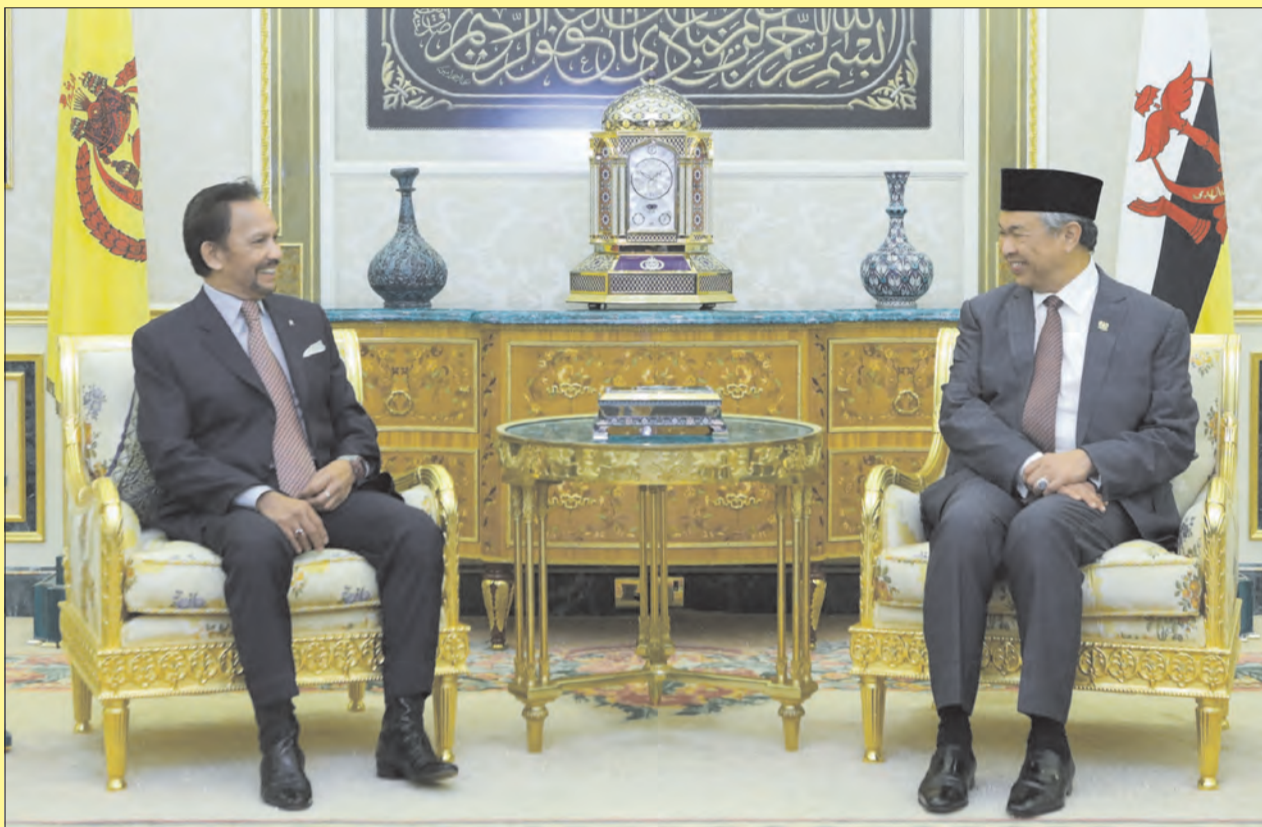
KEBAWAH Duli Yang Maha Mulia Paduka Seri Baginda Sultan Haji Hassanal Bolkiah Mu'izzaddin Waddaulah ibni Al-Marhum Sultan Haji Omar 'Ali Saifuddien Sa'adul Khairi Waddien, Sultan dan Yang Di-Pertuan Negara Brunei Darussalam berkenan menerima mengadap Timbalan Perdana Menteri dan Menteri Dalam Negeri Malaysia, Yang Amat Berhormat Dato' Seri Dr. Ahmad Zahid Hamidi di Istana Nurul Iman.