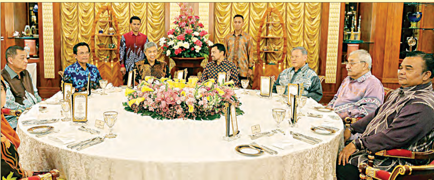
DULI Yang Teramat Mulia berkenan mengadakan Majlis Santap Malam bagi Yang Amat Berhormat Timbalan Perdana Menteri dan Menteri Dalam Negeri Malaysia serta rombongan yang berlangsung di Qashr Al-Meezaan.

Zahid Hamidi serta rombongan. Sebelum Majlis Santap Malam, Duli Yang Teramat Mulia Paduka Seri Pengiran Muda Mahkota Pengiran Muda Haji Al-Muhtadee Billah berkenan menerima mengadap Yang Amat Berhormat Timbalan Perdana Menteri dan Menteri Dalam Negeri Malaysia. Turut hadir pada Majlis Santap Malam tersebut ialah Pesuruhjaya