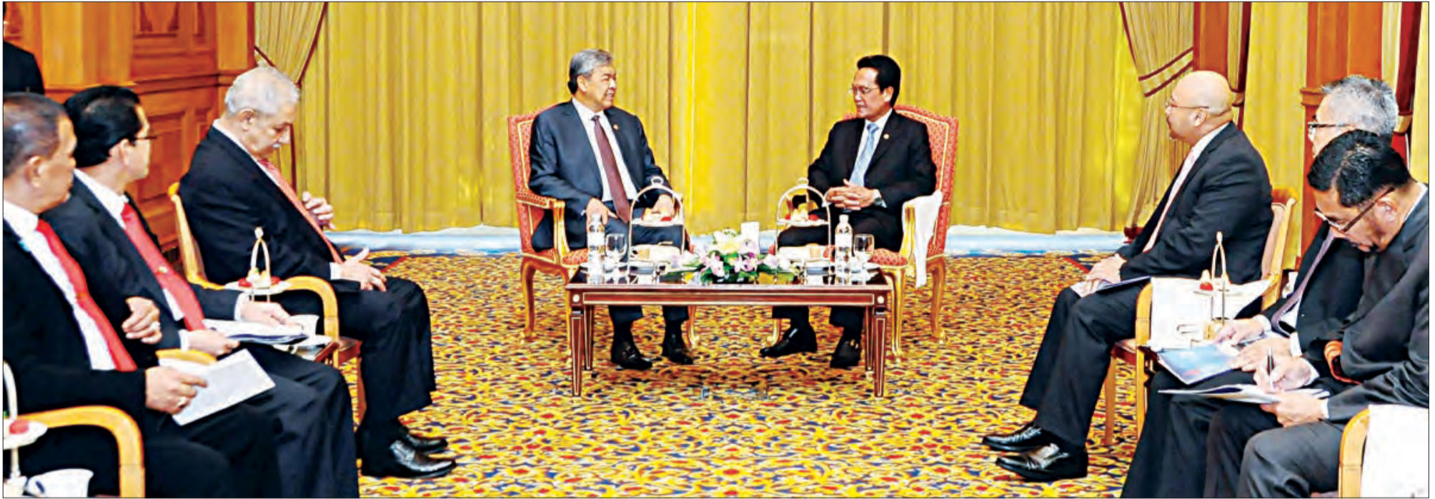
MENTERI Hal Ehwal Dalam Negeri, Yang Berhormat Pehin Orang Kaya Seri Kerna Dato Seri Setia (Dr.) Haji Awang Abu Bakar bin Haji Apong dan Timbalan Perdana Menteri dan Menteri Dalam Negeri Malaysia, Yang Amat Berhormat Dato' Seri Dr. Ahmad Zahid Hamidi semasa mengadakan perjumpaan dua hala.