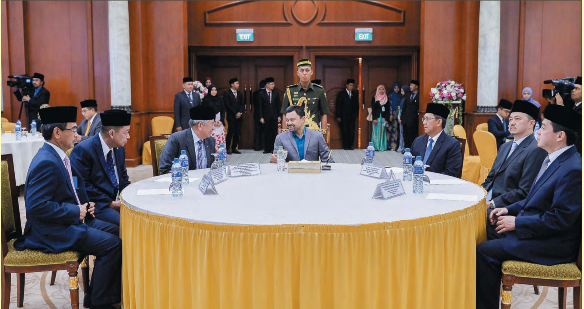
DULI Yang Teramat Mulia Paduka Seri Pengiran Muda Mahkota Pengiran Muda Haji Al-Muhtadee Billah ibni Kebawah Duli Yang Maha Mulia Paduka Seri Baginda Sultan Haji Hassanal Bolkiah Mu'izzaddin Waddaulah, Menteri Kanan di Jabatan Perdana Menteri (JPM), Pengerusi dan Sponsor Jawatankuasa Pandu PENGGERAK berkenan berangkat ke Sesi Pembukaan Program Brunei Top 100 Leaders (B100) Kali Ke-2 di JPM. Turut hadir, ialah Menteri di JPM dan Menteri Kewangan II (Kedua), Yang Berhormat Pehin Orang Kaya Laila Setia Dato Seri Setia Awang Haji Abdul Rahman bin Haji Ibrahim, selaku Timbalan Pengerusi Bersama Jawatankuasa Pandu PENGGERAK dan Ahli-Ahli Jawatankuasa Pandu PENGGERAK, iaitu Menteri Pendidikan, Yang Berhormat Pehin Orang Kaya Indera Pahlawan Dato Seri Setia Awang Haji Suyoi bin Haji Osman; Menteri Tenaga (Energy) dan Perindustrian di JPM, Yang Berhormat Pehin Datu Singamanteri Kolonel (B) Dato Seri Setia (Dr.) Awang Haji Mohammad Yasmin bin Haji Umar; Menteri Pembangunan, Yang Berhormat Dato Seri Setia Awang Haji Bahrin bin Abdullah; Timbalan Menteri Kewangan, Yang Mulia Dato Paduka Dr. Awang Haji Mohd. Amin Liew bin Abdullah dan Timbalan Menteri di JPM, Yang Mulia Dato Paduka Awang Haji Mohd. Roselan bin Haji Mohd. Daud, selaku Ketua PENGGERAK.