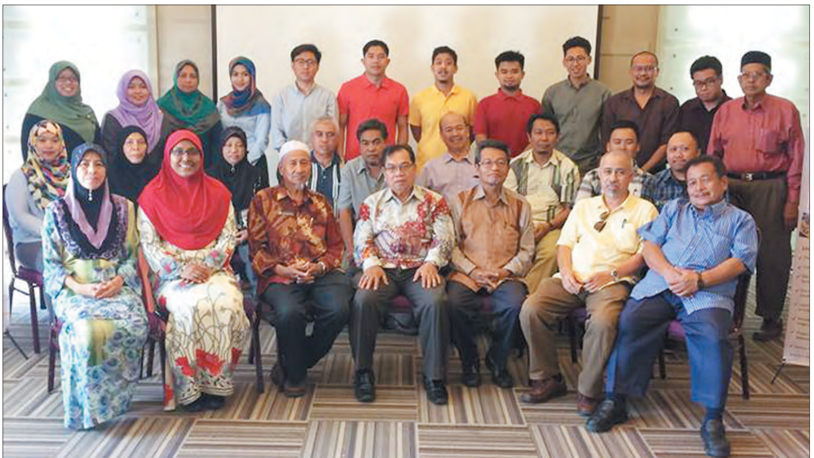
SERAMAI 36 ahli Persekutuan Usahawan Melayu Brunei berjaya menamatkan Sesi Asas Perakaunan Usahawan : Urus Perniagaan Secara Berkesan Dengan Simpan Kira & Kewangan Praktikal semasa bergambar ramai.

Menurutnya, kini beliau pasti boleh menggunakan dan melaksanakan konsep dan tip yang dipelajari untuk perniagaannya sendiri. Dengan penggunaan boardgame , ia lebih menyeronokkan dan mudah bagi mereka untuk memahami bagaimana membuat simpan kira.