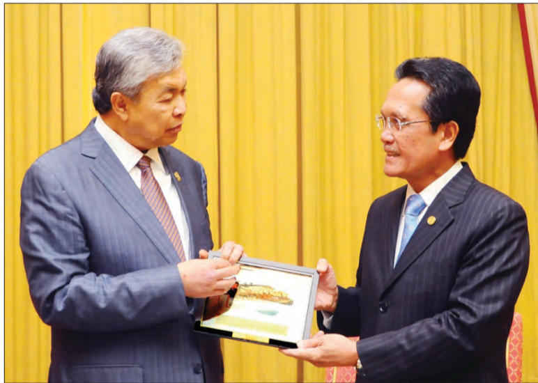
MENTERI Hal Ehwal Dalam Negeri, Yang Berhormat Pehin Orang Kaya Seri Kerna Dato Seri Setia (Dr.) Haji Awang Abu Bakar bin Haji Apong dan Timbalan Perdana Menteri dan Menteri Dalam Negeri Malaysia, Yang Amat Berhormat Dato' Seri Dr. Ahmad Zahid Hamidi semasa bertukar cenderahati (kiri sekali dan kiri).