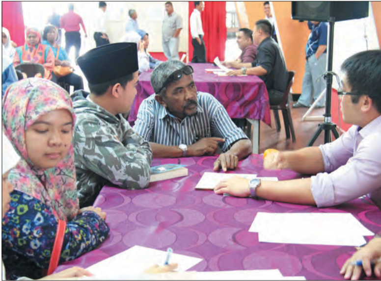
SEBAHAGIAN daripada ibu bapa dan penjaga pelajar Tahun 11 yang mengadakan perjumpaan dan perbincangan bersama guru-guru kelas.

Success', iaitu untuk melatih para pelajar cara-cara menjawab soalan peperiksaan yang sebenar dari peringkat awal, memberikan peluang guru-guru lain dalam mata pelajaran yang sama membantu di antara satu dengan yang lain dalam membimbing para pelajar, serta bagi membantu para pelajar untuk meningkatkan pencapaian keputusan mereka berdasarkan 'Traffic Light Grouping System'.