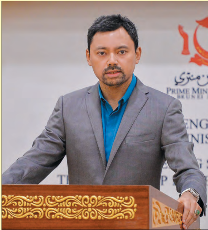
DULI Yang Teramat Mulia Paduka Seri Pengiran Muda Mahkota Pengiran Muda Haji Al-Muhtadee Billah ibni Kebawah Duli Yang Maha Mulia Paduka Seri Baginda Sultan Haji Hassanal Bolkiah Mu'izzaddin Waddaulah, Menteri Kanan di Jabatan Perdana Menteri (JPM), Pengerusi dan Sponsor Jawatankuasa Pandu PENGGERAK berkenan mengurniakan sabda pada Sesi Pembukaan Program Brunei Top 100 Leaders (B100) Kali Ke-2 di JPM.

Pendekatan delivery pastikan matlamat negara dicapai