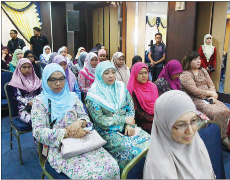
ANTARA pegawai dan kakitangan serta belia yang hadir pada majlis tersebut.

Turut hadir, Setiausaha-Setiausaha Tetap KHEU serta pegawai-pegawai kanan di KHEU, Jabatan Majlis Ugama Islam, Urusetia PROPAZ, TAIB, Insurans Islam TAIB Holdings Sendirian Berhad dan Darussalam Holdings Sendirian Berhad.