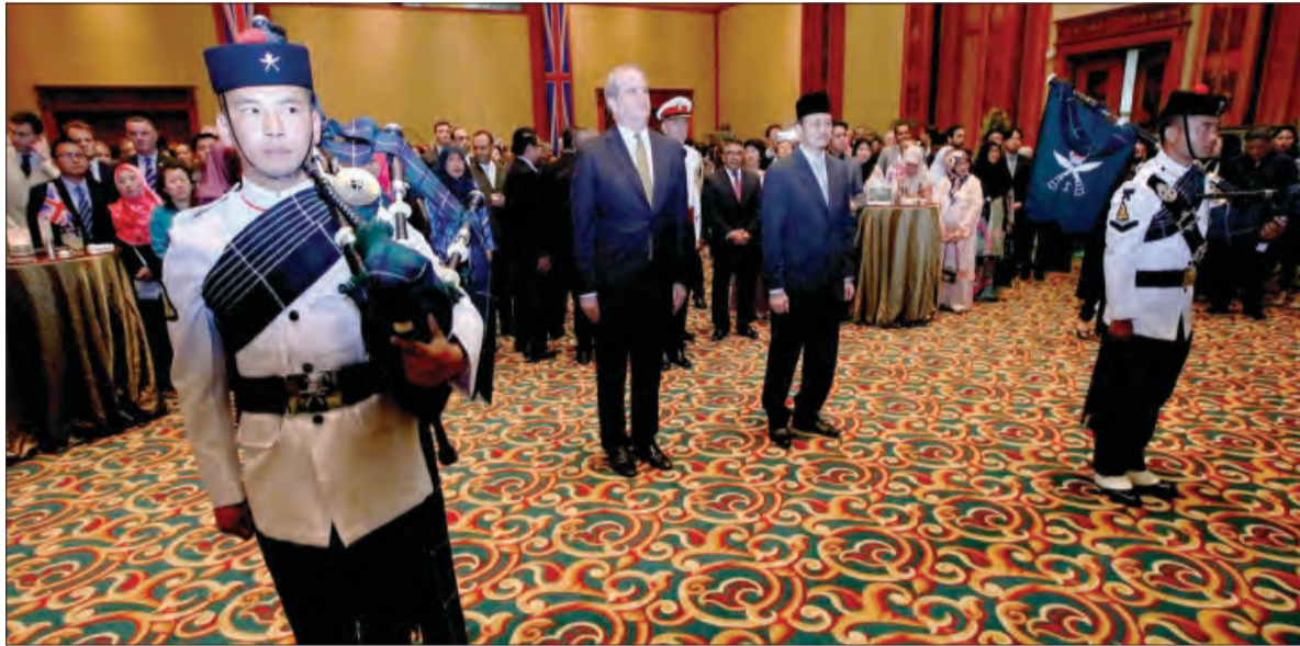
MAJLIS Malam Resepsi Sempena Ulang Tahun Hari Puja Usia Kebawah Duli Yang Maha Mulia Paduka Seri Baginda Queen Elizabeth Kedua yang Ke-91 berlangsung di Indera Kayangan Ballroom, The Empire Hotel & Country Club.

Di samping itu, dua lukisan hutan Brunei turut dipamerkan bagi memperingati masa kini dan lalu.