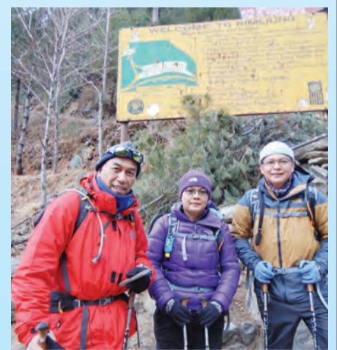
MEMULAKAN perjalanan ke EBC.