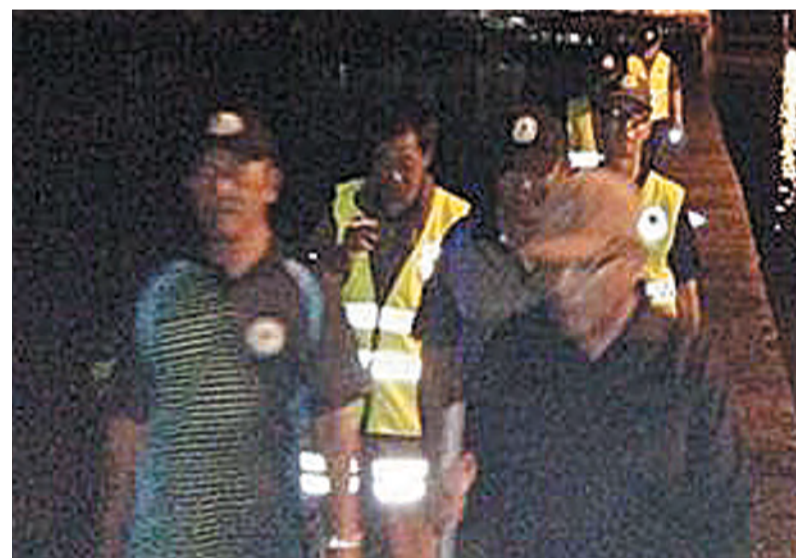
RONDAAN pencegahan jenayah Balai Polis Kampung Ayer bersama Pengawasan Kejiranan Kampung Pudak.