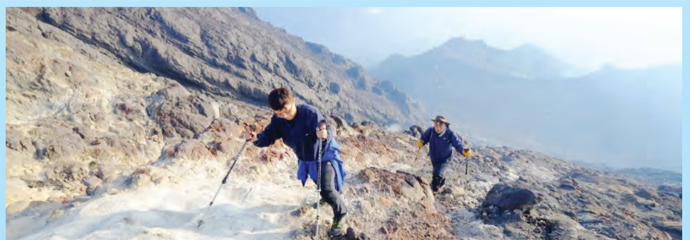
GUNUNG Merapi di Indonesia antara gunung yang turut menjadi tempat bagi sesi latihan.