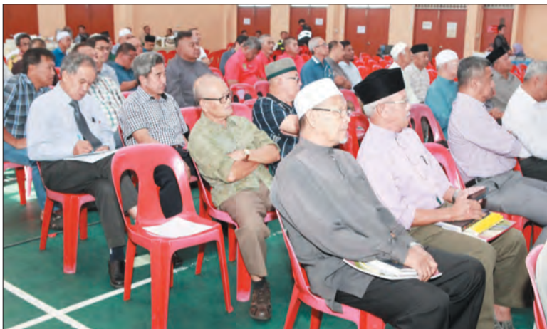
SEBAHAGIAN daripada penduduk kampung di bawah Mukim Kilanas yang hadir pada muzakarah tersebut.

Dalam masa yang sama, pihak berkenaan juga dapat memberikan penerangan dan penjelasan kepada penduduk mukim mengenai isu-isu yang dibangkitkan.