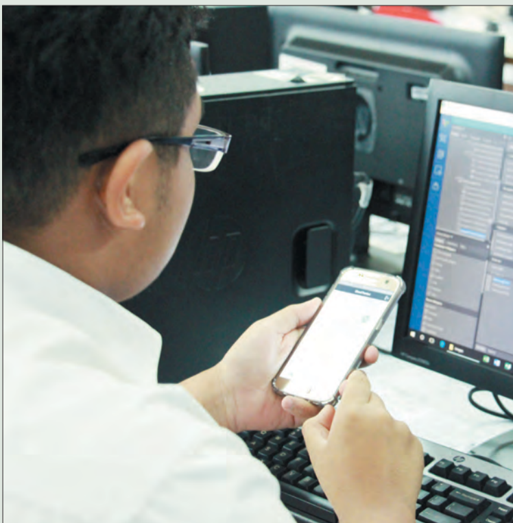
PEMBANGUNAN industri ICT Brunei melalui inisiatif 'Smart Nation' Telekom Brunei Berhad (TelBru) mendapat sambutan dari para pelajar.

Selain itu, kempen tersebut juga merupakan sebahagian daripada Program Tanggungjawab Sosial Korporat (Corporate Social Responsibility - CSR) JPMC sebagai sumbangan kepada masyarakat dan alam sekitar.