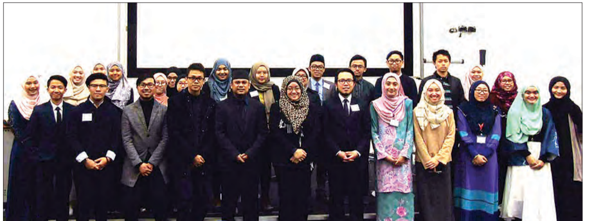
AHLI-AHLI panel forum motivasi tahunan bergambar ramai bersama pelajar-pelajar Brunei dari seluruh United Kingdom yang diadakan di salah sebuah Dewan Kuliah di Universiti York.

Pelukis ternama negara dan Republik Rakyat China bergabung mempamerkan karya mereka bersempena 25 tahun hubungan diplomatik antara kedua buah negara.