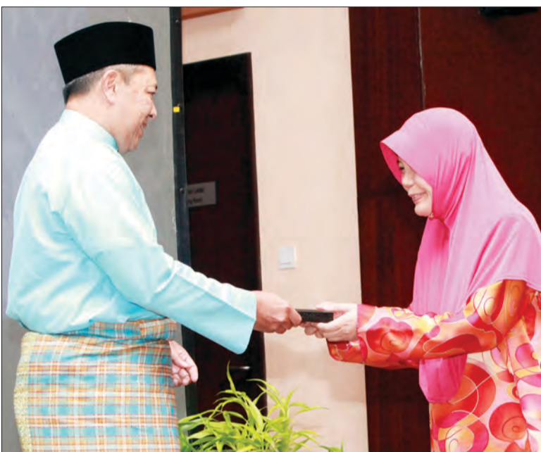
TIMBALAN Menteri Pertahanan semasa menyampaikan Pingat Kerja Lama kepada salah seorang kakitangan wanita Kementerian Pertahanan sempena Sambutan Perayaan Ulang Tahun Hari Keputeraan Kebawah DYMM Sultan dan Yang Di-Pertuan Ke-70 Tahun.