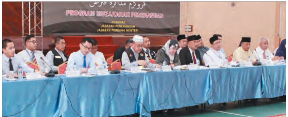
AHLI-AHLI panel Program Muzakarah Penerangan (PMP) yang terdiri daripada wakil dari jabatan-jabatan kerajaan.