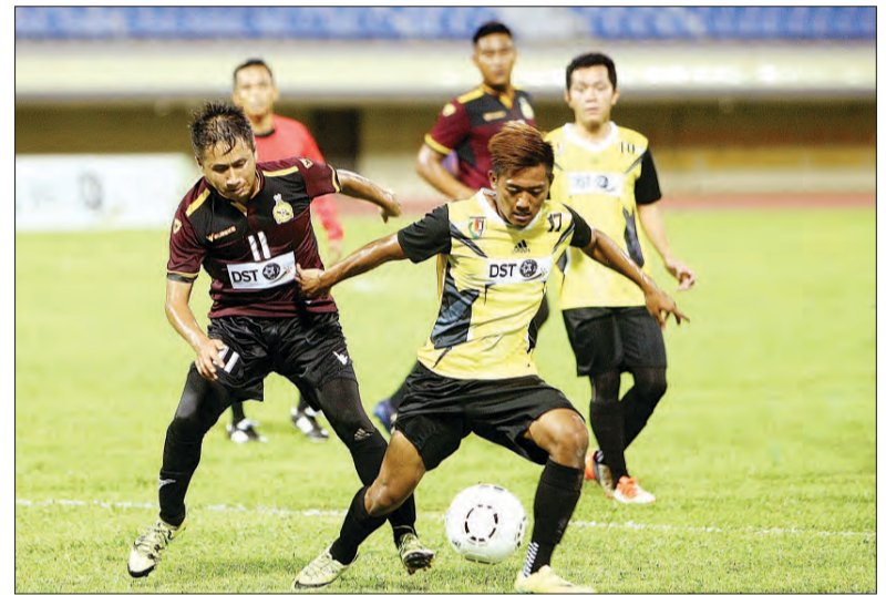
AKSI kedua-dua pasukan pada Perlawanan Akhir Piala Liga Sumbangsih DST 2017 yang berlangsung di Stadium Negara Hassanal Bolkiah.