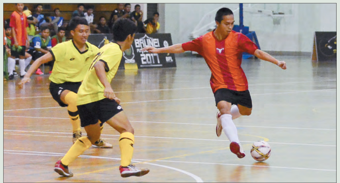
PEMAIN Pasukan Eagle Blues melepaskan rembatan sambil cuba dikawal oleh dua pemain Pasukan Pembangunan Kebangsaan (NFT) pada saingan Liga Futsal Brunei 2017.

Oleh : Marlinawaty Hussin