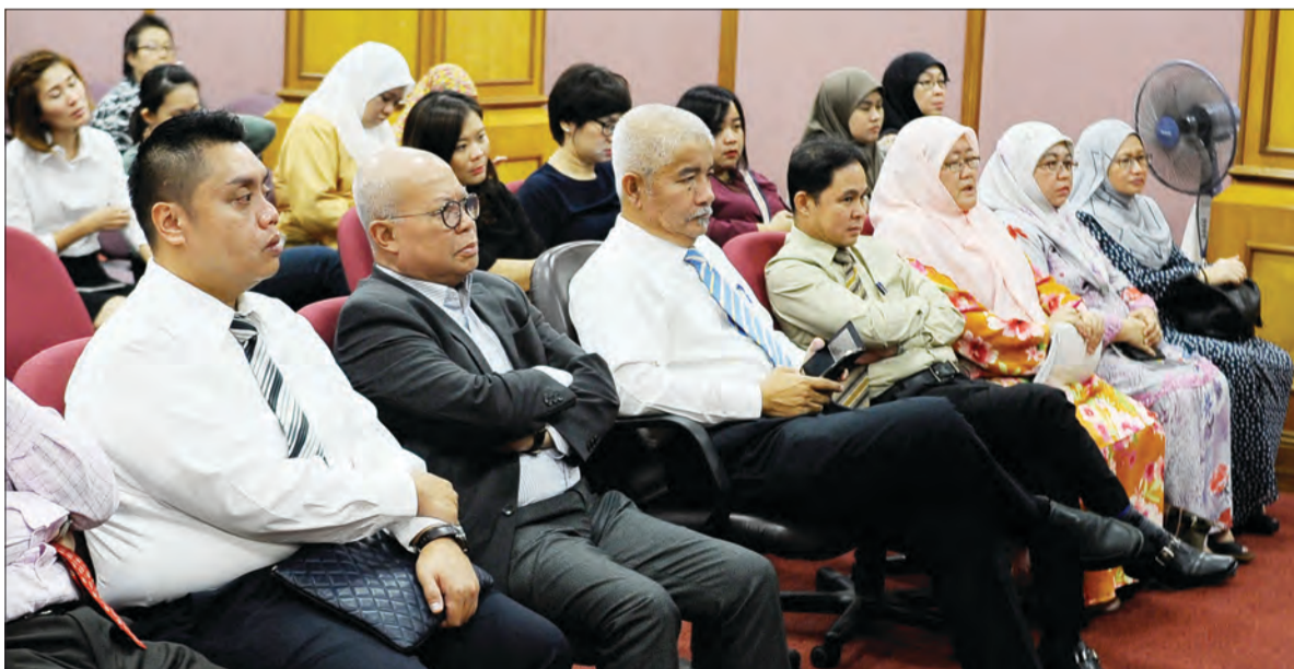
ANTARA pemilik tanah, pemaju, agen hartanah, badan-badan profesional, juru ukur tanah berlesen, peguam, institusi kewangan semasa menghadiri Majlis Pembarigaaan Hak Milik Strata di bawah Akta Kanun Tanah (STRATA) Penggal 189 yang berlangsung di Dewan Bertabur, Tingkat 1, Kementerian Pembangunan.