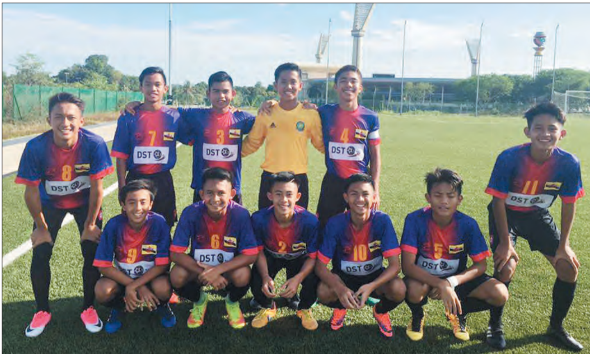
PASUKAN Tabuan 'A' bergambar ramai sejeurus sebelum perlawanan berlangsung di Liga Remaja Bawah 16 Tahun (B-16) Persatuan Bola Sepak Kebangsaan Brunei Darussalam (NFABD) menentang Pasukan Parma FC.

Oleh : Aimi Sani