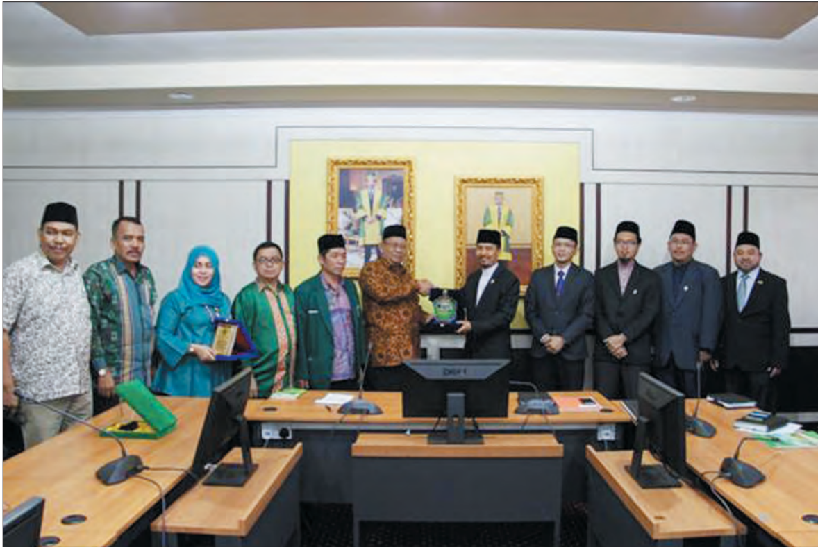
KEDUA belah pihak, UNISSA dan Universitas Al-Washliyah (UNIVA) Medan, Republik Indonesia saling bertukar cenderahati dalam lawatan tersebut.

Siaran Akhbar dan Foto : Universiti Islam Sharif Ali