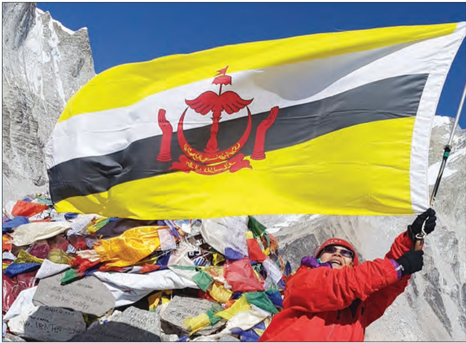
BERJAYA sampai ke Everest Base Camp (EBC) pada jam 2.00 petang waktu tempatan bersamaan jam 4.00 petang waktu Brunei pada 23 Februari 2017 (gambar atas), sementara gambar bawah adalah kumpulan wanita AFE Expedition 2016.