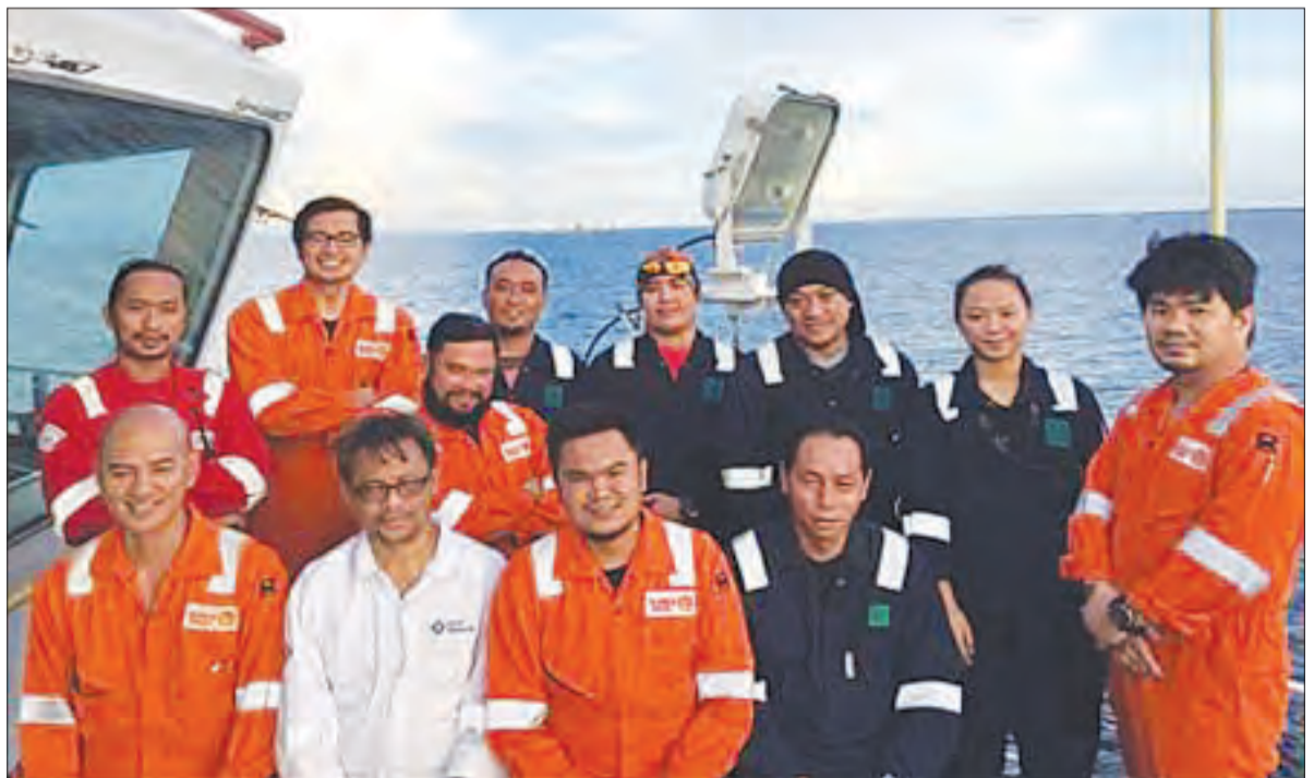
ANTARA ahli krew Wireline yang telah berjaya menukarkan di satu unit wireline darat dan satu unit wireline luar pesisir dalam operasinya 24 jam.

untuk mendapatkan akses jauh ke dalam perigi. Teknik ini digunakan untuk mengambil ukuran dalam yang baik, untuk membuka atau menutup zon menghasilkan yang berbeza dan juga untuk menambah atau membuang peralatan dalam telaga pengeluaran untuk meningkatkan pengeluaran.