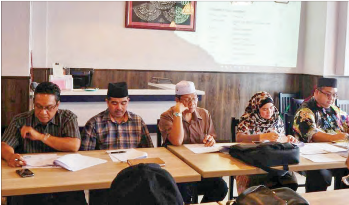
ANTARA ahli yang hadir pada Mesyuarat Khas PSBNS Brunei 2017.