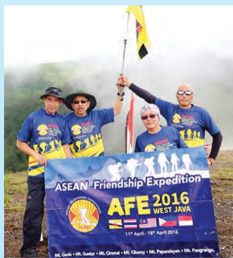
Wakil dari Negara Brunei Darussalam yang menyertai 'ASEAN Friendship Expedition 2016'.

Pendakian bukan setakat menguji kekuatan mental dan fizikal malahan emosi dan keseluruhan jiwa dan raga. Tanpa semangat dan kekuatan serta keberanian seseorang itu tidak akan mampu untuk mencapai impiannya menaiki pergunungan. Niat misi pendakian hendaklah disertai dengan keikhlasan kerana Allah bukan semata-mata untuk mencipta nama.