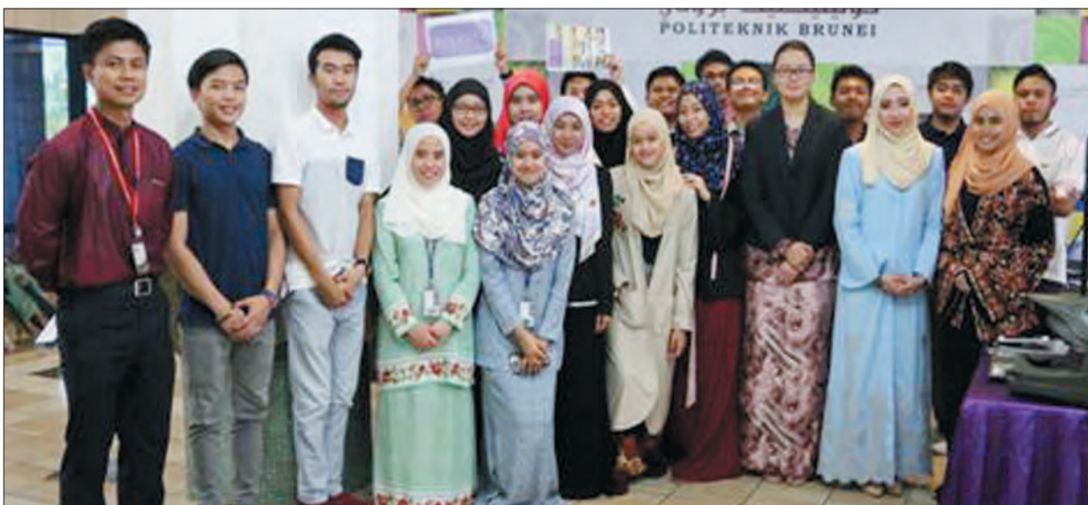
ENAM kumpulan pelajar Sekolah Perdagangan yang mengambil Diploma Level 5 dalam jurusan Business Studies (Keusahawanan) mengadakan satu pameran 'Cabaran Keusahawanan Belia' (Youth Entrepreneurship Challenge) berlangsung di Lobi Politeknik Brunei, Jalan Ong Sum Ping.

Antara matlamat dan objektif simposium itu ialah untuk berkomunikasi dan mengesahkan produk atau perkhidmatan prototaip pelajar serta meyakinkan para juri akan potensi pasaran idea perniagaan mereka.