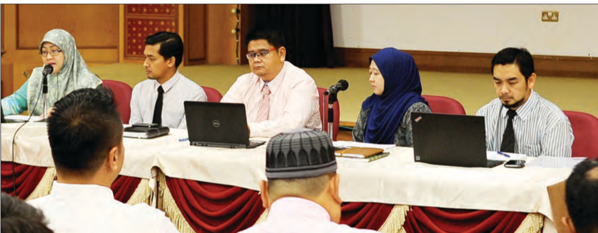
PARA pegawai dari Jabatan Tanah dan turut dijayakan oleh Jabatan Ukur yang hadir menghuraikan mengenai Akta Hak Milik Strata, Proses Pecah Bahagi Bangunan Strata, Proses Penyediaan Sijil bagi Pecah Bahagi Bangunan Strata, Proses Pendaftaran dan Pindah Milik Hak Milik Strata dan akhir sekali Peranan Perbadanan Strata pada Majlis Pembarigaaan Hak Milik Strata di bawah Akta Kanun Tanah (STRATA) Penggal 189 yang berlangsung di Dewan Bertabur, Tingkat 1, Kementerian Pembangunan.

Maklum balas orang ramai melalui kaji selidik ini sangat berguna bagi MSD mengatur strategi dalam menangani masalah yang dihadapi oleh orang ramai dan menambatkan perkhidmatan kerajaan sesuai dengan kehendak dan keperluan orang ramai.