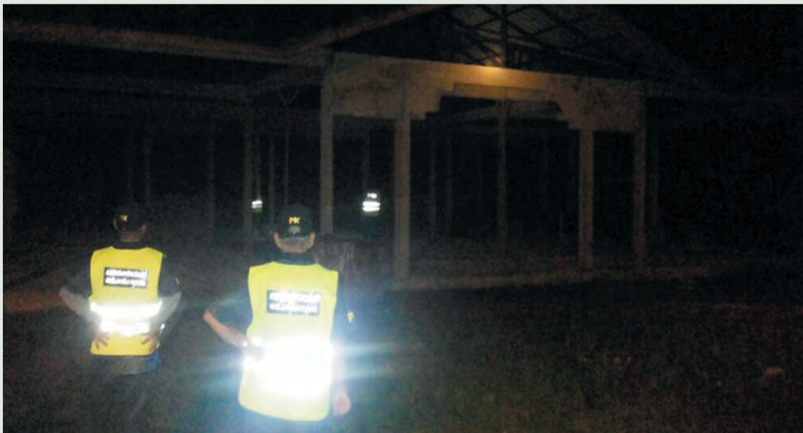
RONDAAN pencegahan jenayah secara berasingan dijalankan sekitar kawasan di Mukim Amo dan Mukim Labu.

Rondaan berjalan kaki dan menggunakan kenderaan digiatkan di kawasan kampung-kampung Pengawasan Kejiranan di kedua-dua buah mukim. Tiada kegiatan yang mencurigakan didapati sepanjang rondaan dijalankan. Operasi dijalankan sehingga larut malam.