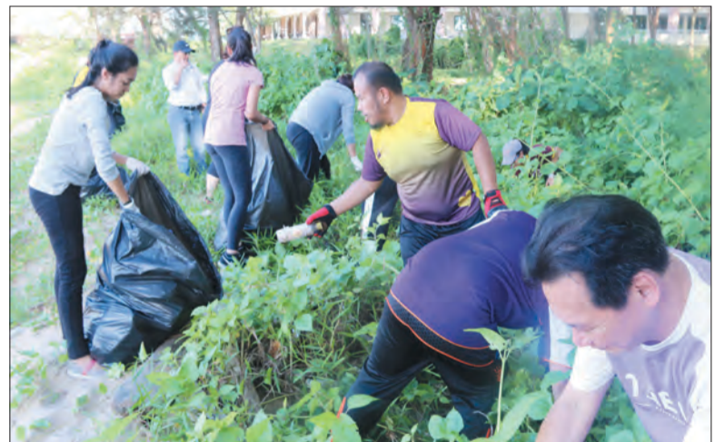
PARA pekerja JPMC dengan kerjasama Pusat Kanser Brunei (TBCC), Pusat Pemulihan dan Neurosains Strok Brunei (BNSRC) dan Gleneagles JPMC bergotong-royong membersihkan kawasan pantai di Jerudong.