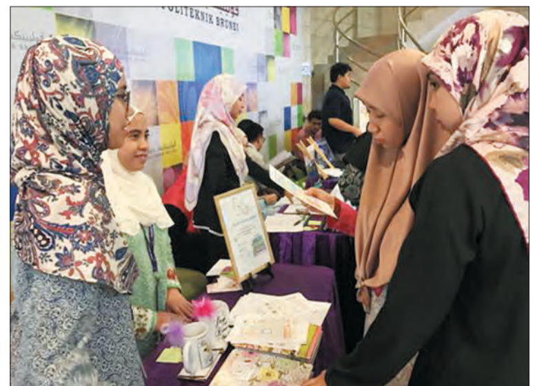
SALAH satu petak pameran 'Cabaran Usahawan Belia' mempamerkan prototaip pelajar di bawah modul pengkhususan - Perancangan Usaha Niaga Baharu.

Bahagian Kokurikulum juga telah menerima sumbangan dari pelbagai jabatan di bawah Kementerian Pendidikan dan dari sekolah-sekolah serta orang ramai.