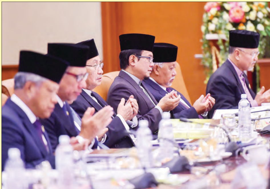
SEBAHAGIAN Ahli Jawatankuasa Tertinggi yang turut hadir pada Mesyuarat Ketiga Jawatankuasa Tertinggi Sambutan Jubli Emas Kebawah Duli Yang Maha Mulia Paduka Seri Baginda Sultan dan Yang Di-Pertuan Negara Brunei Darussalam Menaiki Takhta (atas, bawah dan bawah kanan).

DYTM seterusnya berharap agar perbincangan pada hari ini akan dapat mencetuskan pemikiran bernas dan berupaya memudah cara serta mempertingkatkan keberkesanan pelaksanaan acara-acara sambutan selaras dengan hasrat untuk melihat kesempurnaan dan kewalihan acara yang direncanakan ini.