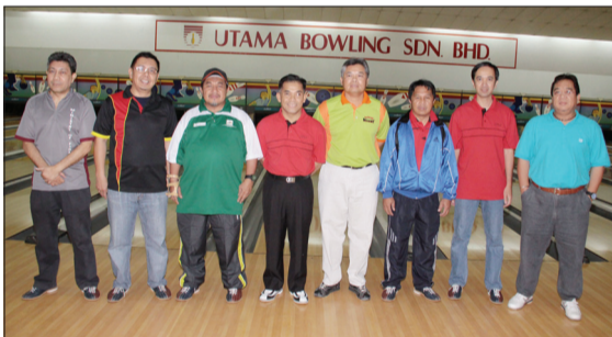
PEMAIN-PEMAIN bergambar ramai di temasya Pesta Sukan Kementerian-Kementerian (PSKK) bagi acara Tenpin Bowling .