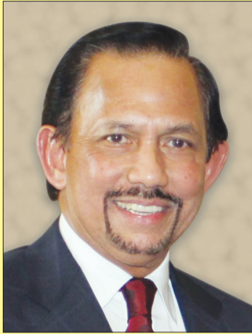
KEBAWAH Duli Yang Maha Mulia Paduka Seri Baginda Sultan Haji Hassanal Bolkiah Mu'izzaddin Waddaulah ibni Al-Marhum Sultan Haji Omar 'Ali Saifuddin Sa'adul Khairi Waddien, Sultan dan Yang Di-Pertuan Negara Brunei Darussalam berkenan menghantar perutusan tahniah kepada Presiden Republik India, Puan Yang Terutama Pratibha Devisingh Patil dan Perdana Menteri Republik India, Tuan Yang Terutama Dr. Manmohan Singh bersempena dengan hari republik negara tersebut.

Seterusnya, dalam perutusan baginda kepada Perdana Menteri Republik India, baginda merakamkan