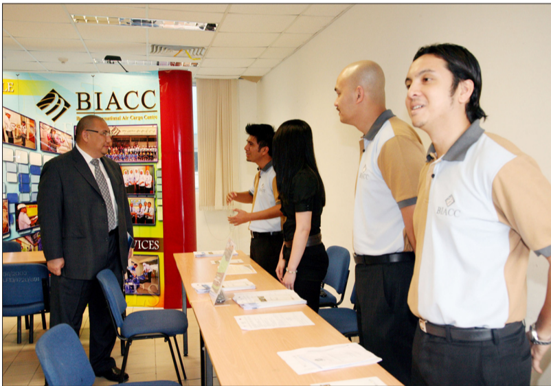
TETAMU kehormat semasa melawat salah satu ruang bilik bagi Walk-in interview yang terdapat di pameran 'InfoDay EXPO@ITB'.

semasanya, meningkatkan hubungan-hubungan dengan masyarakat secara keseluruhan dan menyediakan satu landasan bagi pertukaran maklumat antara institut berkenaan, industri, jabatan-jabatan kerajaan, agensi-agensi lain, orang awam serta para graduan.