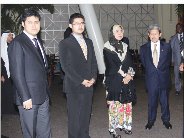
DYTM dan YTM bersama anakanda-anakanda ketika berkenan berangkat menghadiri Majlis Santap Tengah Hari di Istana Al Shuwaikh Al-Aamir yang diberikan oleh Perdana Menteri Kuwait, Duli Yang Teramat Mulia Sheikh Nasser Mohammed Al-Ahmad Al-Sabah dan Majlis Santap Malam yang diadakan Pusat Saintifik Kuwait (Aquarium) sempena lawatan baginda ke Kuwait.

Minyak dan gas yang menjadi hasil utamanya dan telah menjadikan negara teluk itu sebagai negara kelima terbesar mempunyai simpanan minyak di dunia.