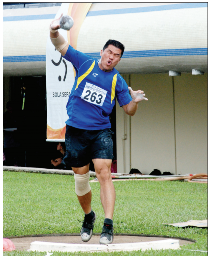
PESERTA lontar peluru 40 tahun ke atas lelaki semasa beraksi.