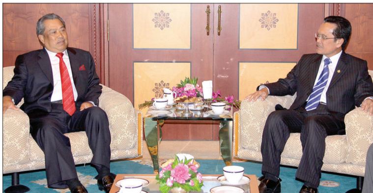
TIMBALAN Perdana Menteri dan Menteri Pelajaran Malaysia, Yang Amat Berhormat Tan Sri Dato' Haji Muhyiddin bin Haji Mohd. Yassin dan Menteri Pendidikan, Yang Berhormat Pehin Orang Kaya Seri Kerna Dato Seri Setia (Dr.) Haji Awang Abu Bakar bin Haji Apong semasa mengadakan Mesyuarat Dua Hala di The Hotel Empire and County Club, Jerudong.

Malaysia dan Negara Brunei Darussalam berharap untuk melaksanakan semua aktiviti pendidikan melalui kumpulan kerja bersama yang ada dan akan datang antara Kementerian Pendidikan kedua-dua buah negara.