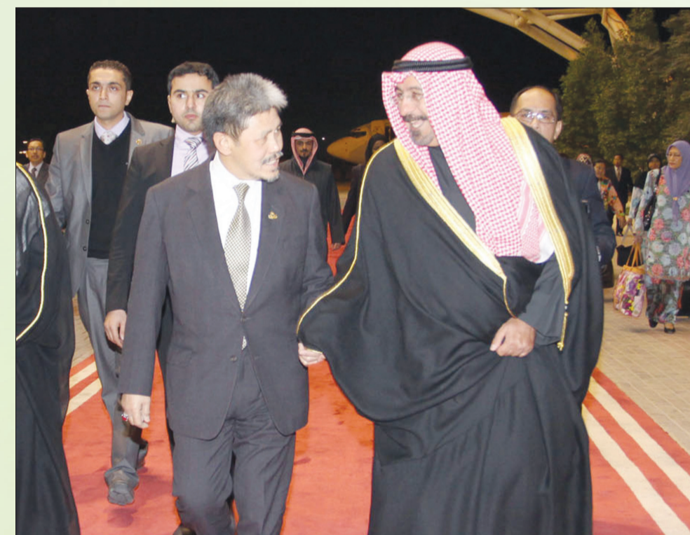
DYTM berangkat tiba di Lapangan Terbang Antarabangsa Kuwait dengan dialu-alukan oleh Timbalan Perdana Menteri dan Menteri Hal Ehwal Luar Negeri, Tuan Yang Terutama Sheikh Dr. Mohammad Sabah Al-Salem Al-Sabah.

DULI Yang Teramat Mulia dan Yang Teramat Mulia Pengiran Anak Isteri Pengiran Anak Hajah Zariah binti Al-Marhum Pengiran Pemancha Pengiran Anak Haji Mohamed Alam ketika berkenan berangkat menghadiri Santap Malam yang diberikan oleh Timbalan Perdana Menteri dan Menteri Hal Ehwal Luar Negeri Kuwait, Tuan Yang Terutama Sheikh Dr. Mohammad Sabah Al-Salem Al-Sabah, bertempat di Pusat Saintifik Kuwait (Aquarium) (kiri).