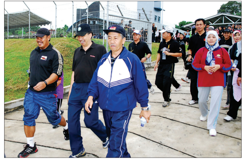
MENTERI Kebudayaan, Belia dan Sukan, Yang Berhormat Pehin Orang Kaya Pekerma Laila Diraja Dato Paduka Awang Haji Hazair bin Haji Abdullah memulakan acara Walkaton Sempena Minggu Membaca.

PMS di buka dari jam 8.00 pagi hingga 5.00 petang setiap hari Isnin hingga Khamis, sementara pada hari Sabtu dan Ahad ia dibuka dari jam 10.00 pagi hingga 5.00 petang dan ditutup pada hari Jumaat.