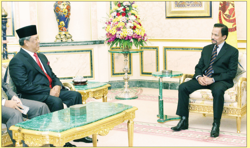
KEBAWAH Duli Yang Maha Mulia Paduka Seri Baginda Sultan Haji Hassanal Bolkiah Mu'izzaddin Waddaulah ibni Al-Marhum Sultan Haji Omar 'Ali Saifuddien Sa'adul Khairi Waddien, Sultan dan Yang Di-Pertuan Negara Brunei Darussalam berkenan menerima mengadap Timbalan Perdana Menteri dan Menteri Pelajaran Malaysia, Yang Amat Berhormat Tan Sri Dato' Haji Muhyiddin bin Haji Mohd. Yassin.