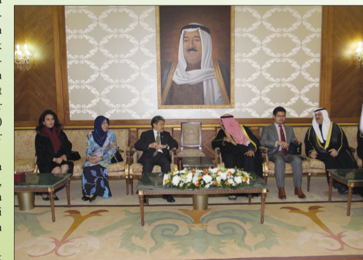
DYTM dan YTM berserta anakanda-anakanda ketika membuat Lawatan ke Bandaraya Kuwait atas jemputan Timbalan Perdana Menteri dan Menteri Hal Ehwal Luar Negeri Kuwait, TYT Sheikh Dr. Mohammad Sabah Al-Salem Al-Sabah.

Sementara itu, Duli Yang Teramat Mulia Syeikh Nasser Al-Mohammad Al-Ahmad Al-Jaber Al-Sabah, bekas Perdana Menteri juga telah mengadakan lawatan ke Negara Brunei Darussalam pada bulan Julai 2008 dan