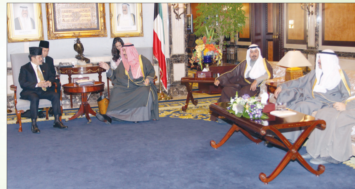
DULI Yang Teramat Mulia ketika mengadakan perjumpaan bersama Perdana Menteri Kuwait, Duli Yang Teramat Mulia Sheikh Nasser Mohammed Al-Ahmad Al-Sabah.

Penandatanganan MOU pula adalah berhubung dengan kerjasama di bidang minyak dan gas.