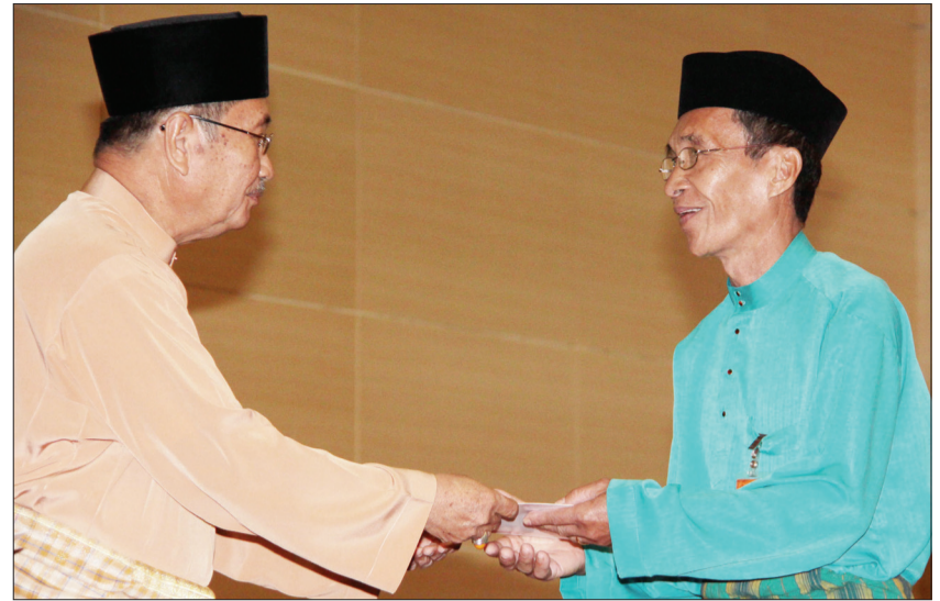
MENTERI Hal Ehwal Dalam Negeri, Yang Berhormat Pehin Udana Khatib Dato Paduka Seri Setia Ustaz Haji Awang Badaruddin bin Pengarah Dato Paduka Haji Othman semasa menyampaikan sijil taraf kerakyatan kepada seorang penerima.

"Kita akan meneruskan dasar menerima rakyat