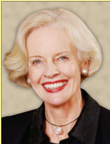
GOVERNOR-General Australia, Puan Yang Terutama Quentin Bryce.

Seterusnya dalam tahniah perutusan baginda yang sama kepada Perdana Menteri Australia, baginda berasa