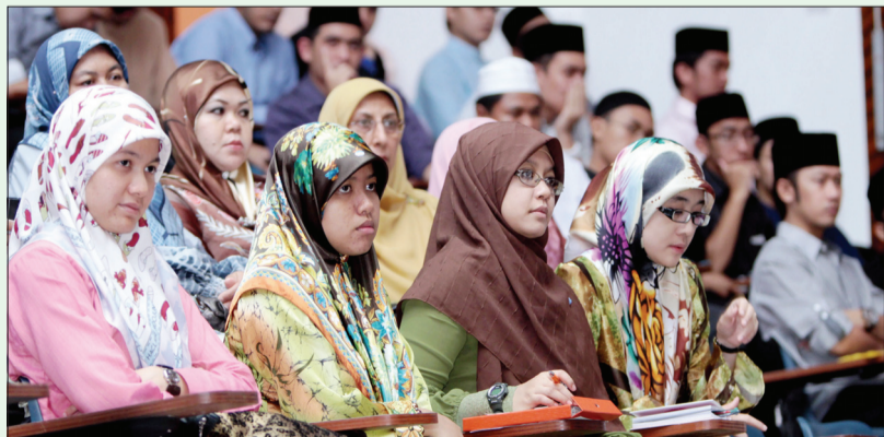
SEBAHAGIAN mahasiswa dan mahasiswi Universiti Islam Sultan Sharif Ali khusyuk mendengar ceramah yang disampaikan oleh tetamu kehormat.

Ke arah ini JIPK juga akan berusaha mengemaskan urusan-urusan pelaksanaan Akta Taraf Kebangsaan termasuk merancang dan melaksanakan kursus-kursus induksi kerakyatan bagi pemohon-pemohon supaya mereka mendapat kesempatan awal yang luas untuk mengintegrasikan atau mengasimilasikan diri mereka ke dalam arus perdana Brunei.