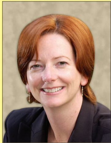
PERDANA Menteri Australia, Yang Berhormat Julia Gillard.

gembira bekerja bersama-sama dengan Puan Yang Terutama pada tahun yang lepas untuk meningkatkan hubungan persahabatan dan kerjasama yang mesra di antara kedua buah negara termasuk kejayaan yang dicapai dalam Sidang Kemuncak ASEAN-Australia di Hanoi pada tahun lepas. Baginda juga bergembira mengalu-alukan kemasukan Australia ke dalam Kumpulan ASEM.