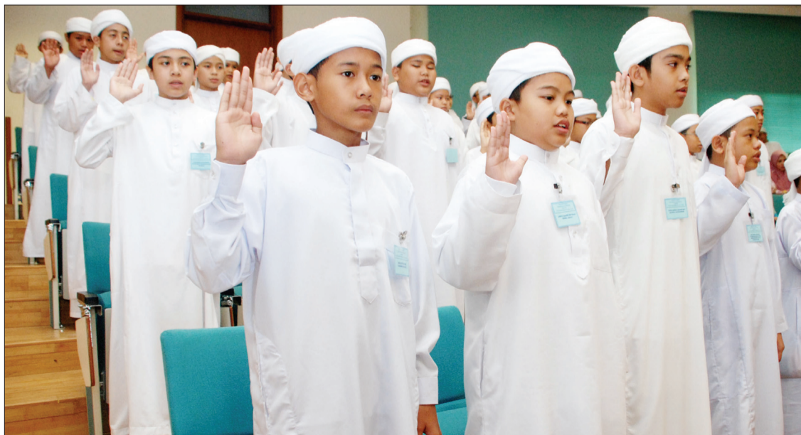
PELAJAR baru ITAQSHHB semasa membaca ikrar di Majlis Kemasukan Pelajar Sesi 1432H/2011M di Dewan Kuliah, institut berkenaan.

Juga hadir pegawai-pegawai kanan KHEU, pegawai dan kakitangan ibu bapa dan para pelajar ITAQSHHB.