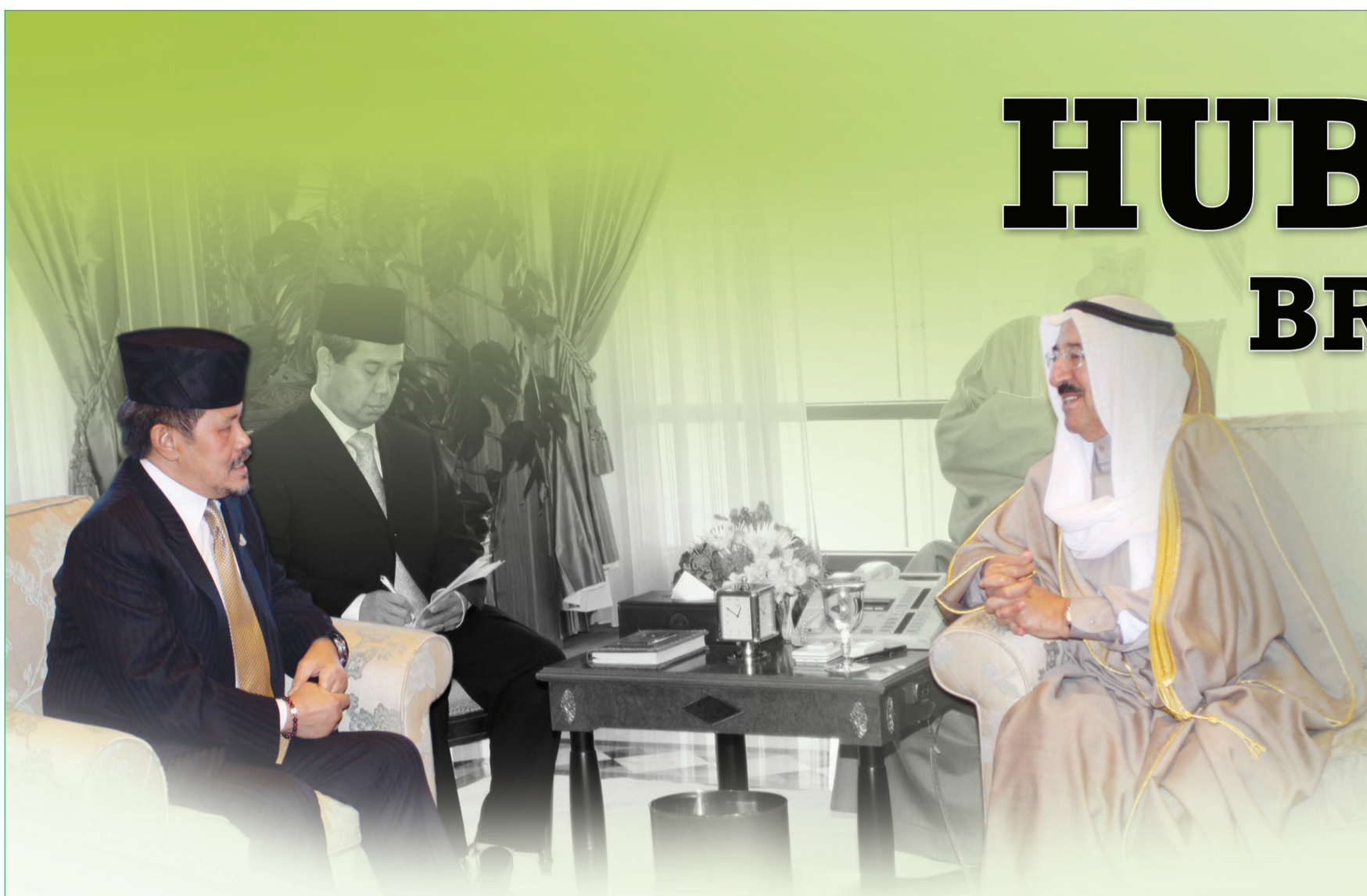
DULI Yang Teramat Mulia Paduka Seri Pengiran Perdana Wazir Sahibul Himmah Wal-Waqar Pengiran Muda Mohamed Bolkiah ibni Al-Marhum Sultan Haji Omar 'Ali Saifuddin Sa'adul Khairi Waddien, Menteri Hal Ehwal Luar Negeri dan Perdagangan berangkat mengadap ke hadapan majlis Duli Yang Maha Mulia Sheikh Sabah Al-Ahmad Al-Jaber Al-Sabah, Emir Kuwait diti Istana Seif Al-Aamir.