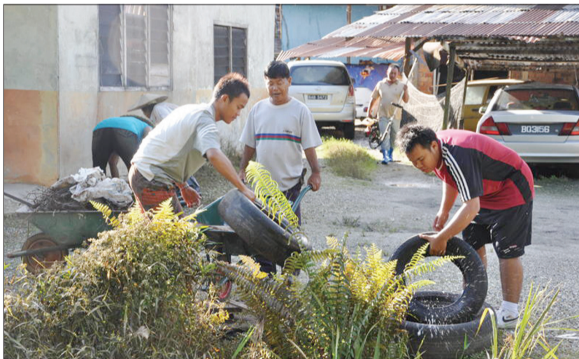
AKTIVITI gotong-royong membersihkan kawasan Rumah Panjang Kampung Tanjung Bungar, Mukim Batu Apoi.

Kerja-kerja gotong-royong dijalankan oleh ahli-ahli Majlis Perundingan Kampung (MPK) Tanjung Bungar dan penduduk sekitarnya dengan dibantu oleh para pegawai dan kakitangan dari Jabatan Daerah Temburong dan Angkatan Bersenjata Diraja Brunei (ABDB) Cawangan Temburong.