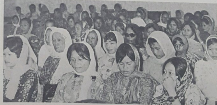
Sa-bahagian dari mualaf2 perempuan Daerah Tutong yang menghadhiri Majlis Bimbingan Pengetahuan Ugama Islam yang di-anjorkan oleh Jabatan Hal Ehwal Ugama.