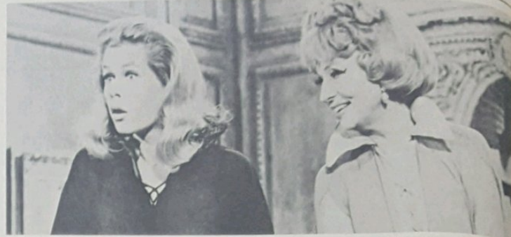
Siri Baru 'Bewitched' menggantikan siri 'I Dream of Jeannie'.