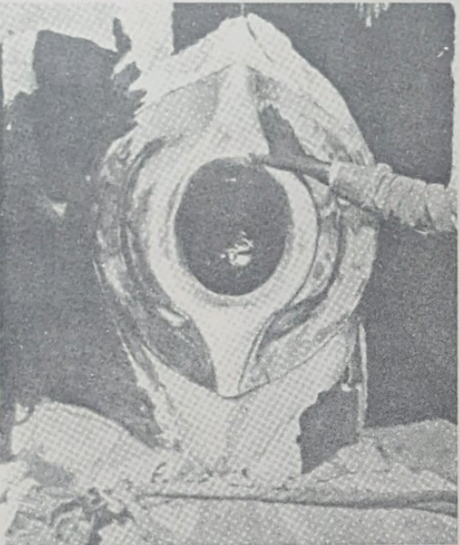
Hajarul - Aswad

Al-Qormuti menyimpan Al-Hajarul Aswad di-tempat-nya HAJARA dalam negeri Bahrin sa-lama 22 tahun... dan adapun tempat letak batu itu di-Ka'abah tetap tinggal kosong dan orang2 hanya meletak tangan di-sana untok mengambil berkat.