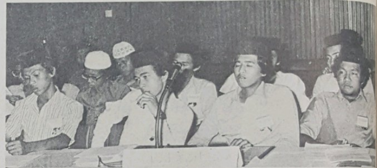
Perwakilan Seminar Pengetahuan Ugama Islam di-Kalangan Penuntut2 dari Maktab Anthon Abell, Seria.

Tidak dapat di-nafikan juga chara penyampaian pelajaran ugama yang berkesan ia-lah dengan memberikan pengalaman sa-chara langsung. Penyampaian pelajaran ibadat mithal-nya amat-lah sesuai sa-kali dengan sa-chara praktikal terutama-nya dalam pelajaran2 yang berkisar di-tingkatan lima ia-itu HAJI. Dan untuk memenohi tujuan ini, maka perlulah sa-buah sekolah itu mengadakan sa-buah bilek khusus yang di-lengkapkan dengan alat2 yang praktikal yang lengkap seperti: a. Peralatan sembahyang yang lengkap seperti sejadah, kain tel-