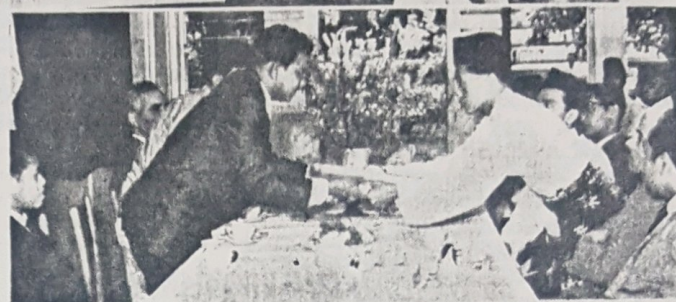
Gambar atas: Yang Teramat Mulia Seri Paduka Duli Pengiran Muda Mahkota dan rombongan kelihatan di-sambut oleh Ahli2 Jawatan Kuasa Sambutan Hari Puja Usia Duli Yang Maha Mulia di-Kolej Islam Malaya ketika tiba di-Kolej Islam itu. Gambar bawah: Y.T.M. Seri Paduka Duli Pengiran Muda Mahkota kelihatan sedang menerima ucapan persembahan Hari Puja Usia D.Y.M.M. dari Setia Usaha majlis sambutan itu, Inche Yahya Haji Ibrahim.