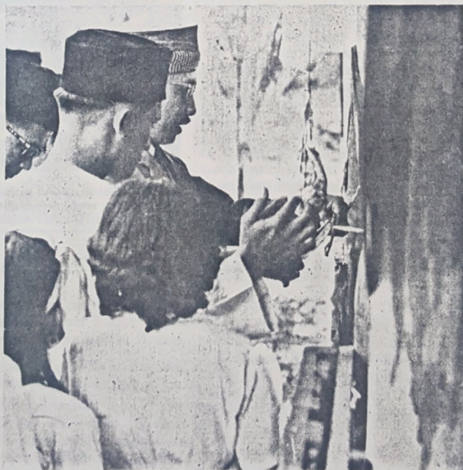
DULI YANG MAHA MULIA MAULANA AL-SULTAN, SIR OMAR ALI SAIFUD-DIN kelihatan sedang mengisytiharkan pembukaan rasmi SEKOLAH MELAYU DULI PENGIRAN MUDA MAHKOTA, Kuala Tutong pada 14 Oktober, 1962. Berita pembukaan rasmi sekolah itu telah di-siarkan dalam akhbar ini pada 17 Oktober, 1962.